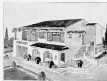
Autre modèle de villa provençale.

L'installation intérieure devant être adaptée, sans aucune faute, au style de la villa, il importait l'en confier l'exécution à des décorateurs d'un goût reconnu. Aussi la Société générale foncière a-t-elle porté son choix sur le célèbre atelier Primatrou s, atelier d'art des Grands Magasins du Printemps. On sait que ses modèles, ses tentures, ses bibelots ont triomphé à l'Exposition des Arts Décoratifs et sa réputation mondiale grandit à chaque manifestation