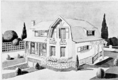
Un modèle des cottages construits à La Baule-les-Pins par la Société générale foncière.

Il semble que l'on doive voir là une tentative de développement de la propriété bâtie bien inspirée à divers titres. Elle apporte un concours salutaire à ce besoin général de la villégiature estivale qui est une des caractéristiques de notre époque. Elle se produit au moment favorable où