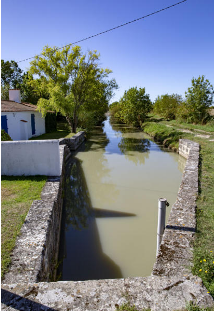
La bonde du Coteau.