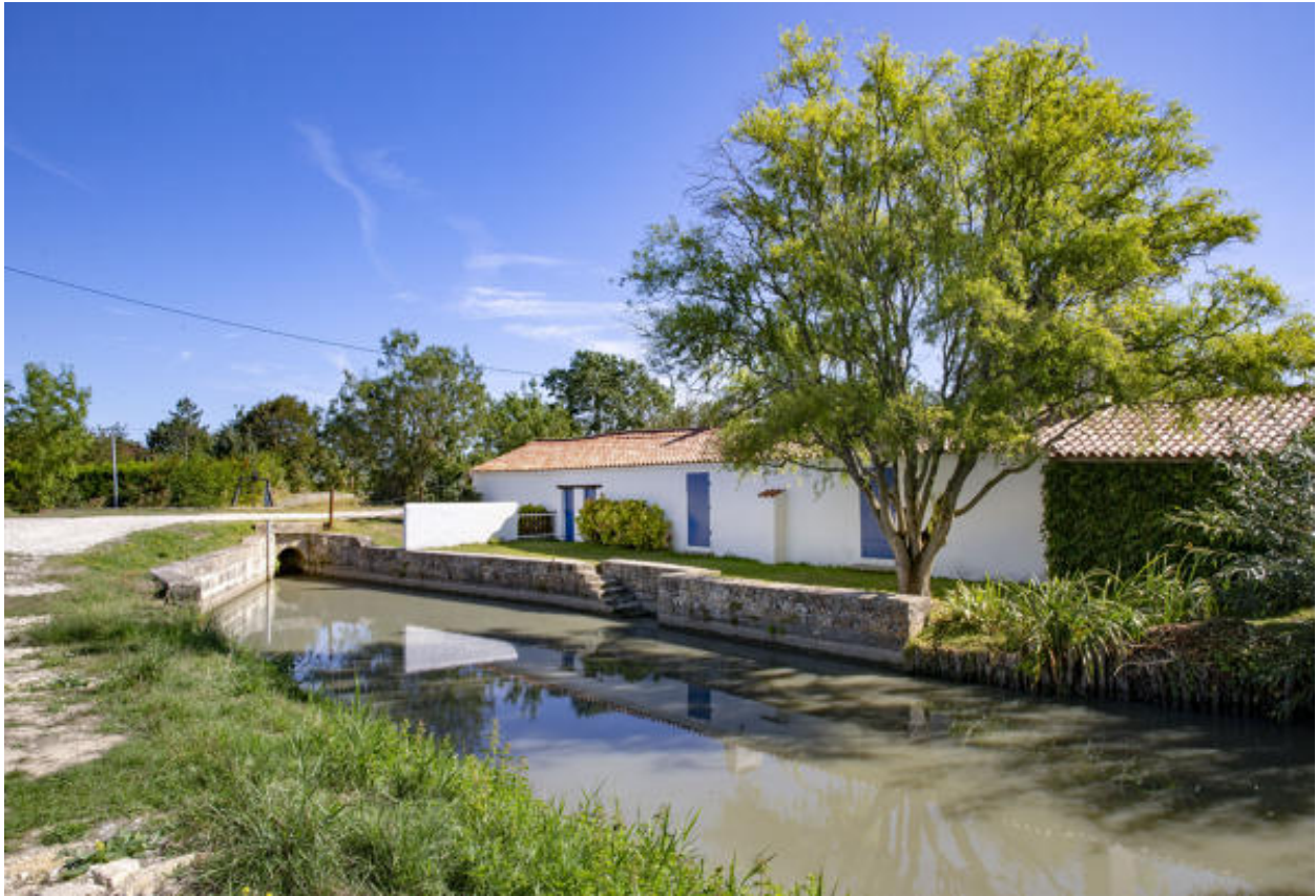
La bonde côté aval, les quais qui l'encadrent et l'ancienne maison de garde, vus depuis le sud-ouest.