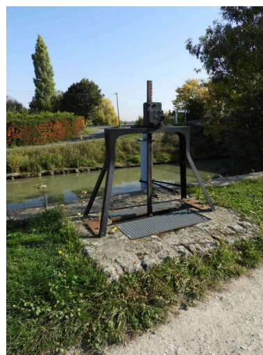
Le portique et la crémaillère au-dessus de la vanne.