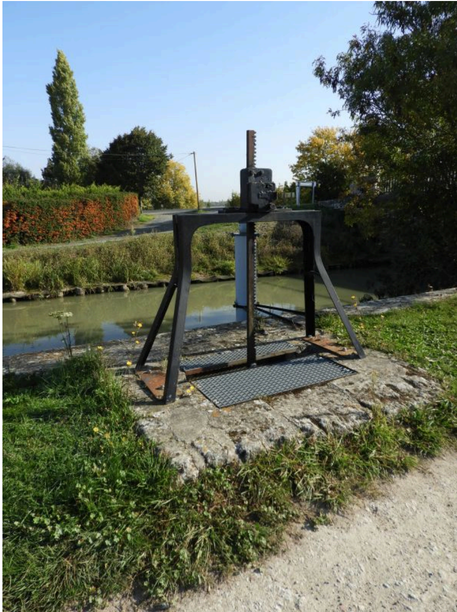
Le portique et la crémaillère au-dessus de la vanne.