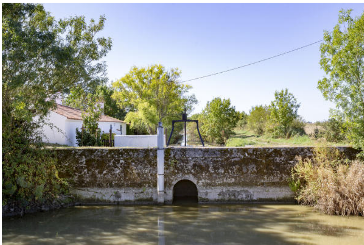
La bonde du Coteau.