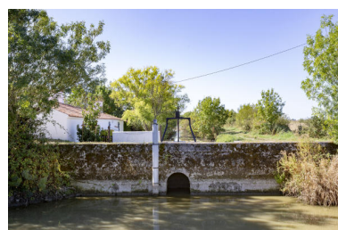
La bonde du Coteau. IVR52_20198502210NUCA