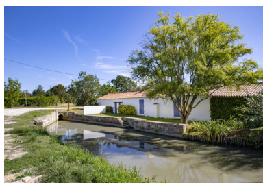
La bonde côté aval, les quais qui l'encadrent et l'ancienne maison de garde, vus depuis le sud-ouest.