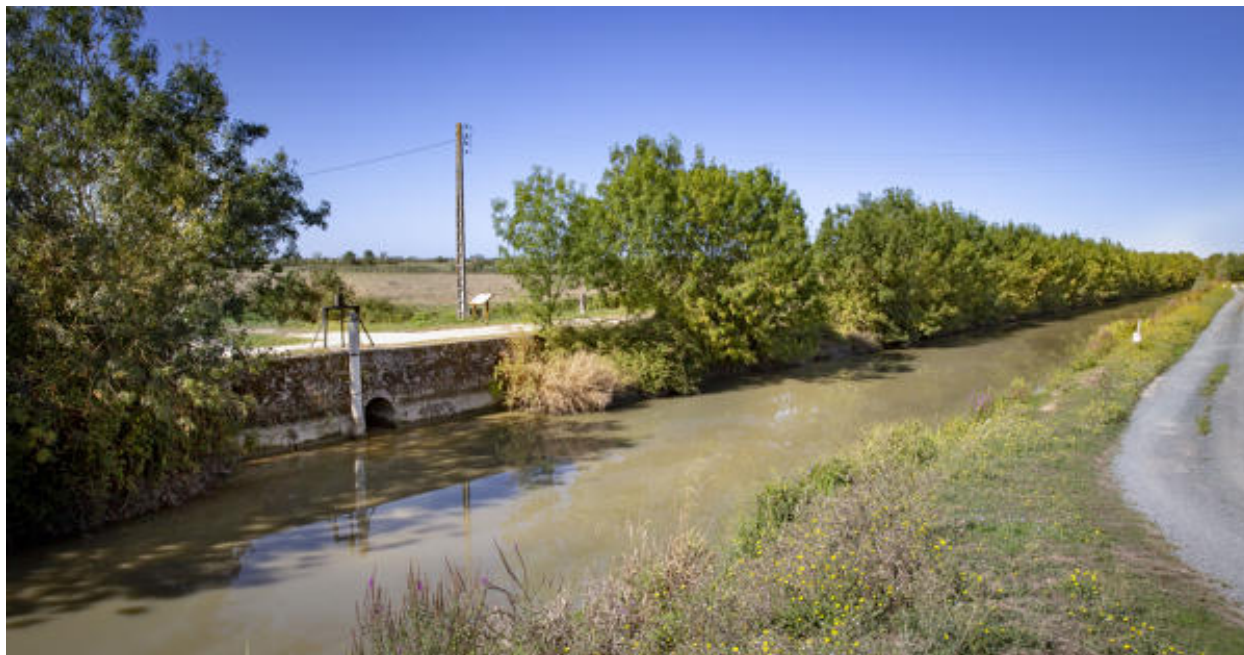
La bonde du Coteau.