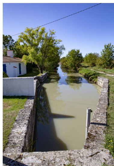
La bonde du Coteau.