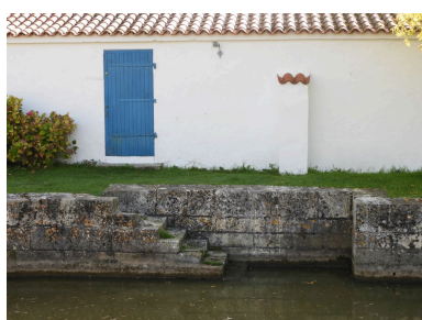
Quai et emmarchement sur la rive gauche de la bonde, au pied de l'ancienne maison de garde.