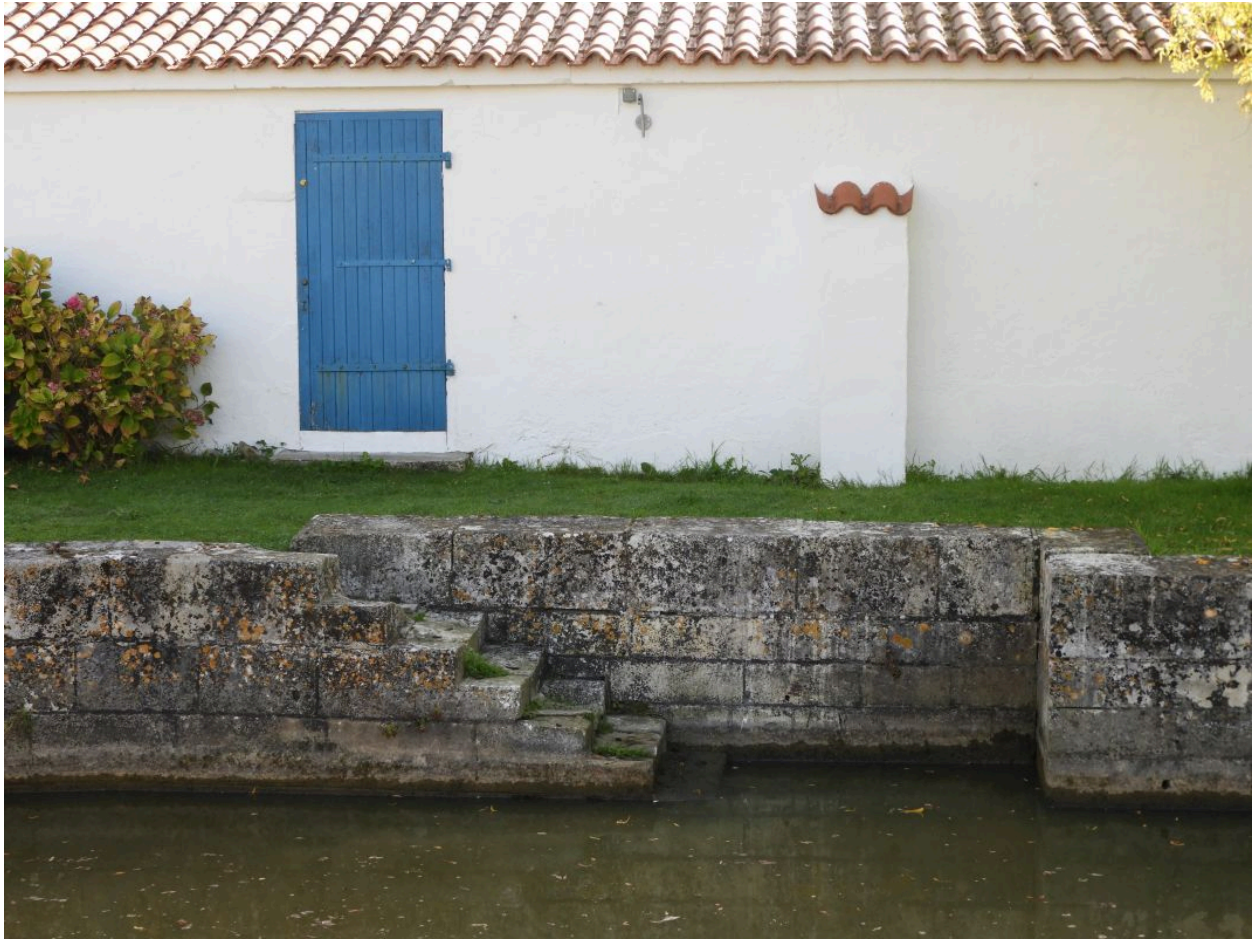
Quai et emmarchement sur la rive gauche de la bonde, au pied de l'ancienne maison de garde.