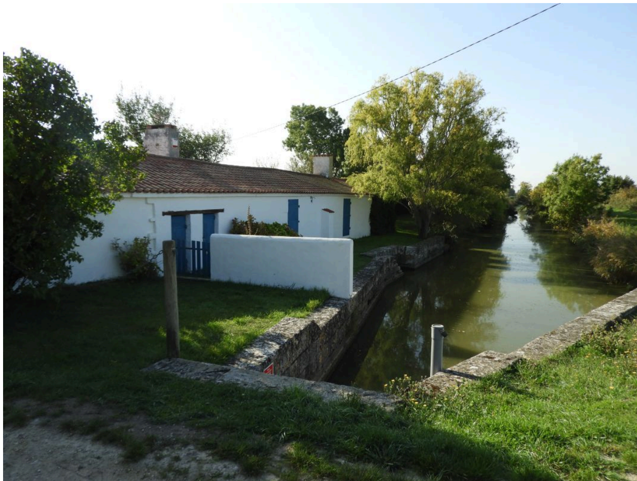
La bonde, l'ancienne maison de garde et le canal du Clain, vus depuis le nord.