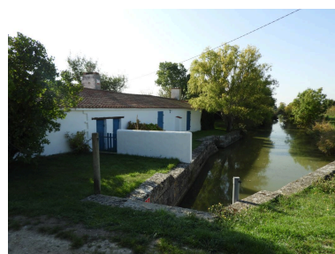
La bonde, l'ancienne maison de garde et le canal du Clain, vus depuis le nord. IVR52_20188500361NUCA