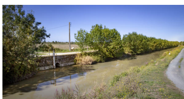
La bonde du Coteau.