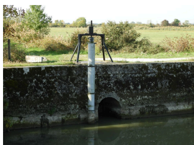
La bonde côté amont, du côté de la ceinture des Hollandais, vue depuis le nord.