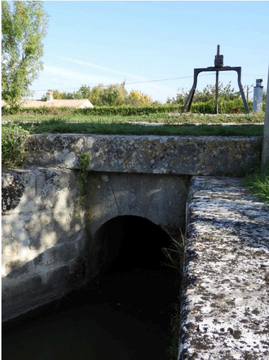
Le passage voûté de la bonde, côté aval, au sud, et le portique au-dessus de la vanne, en arrière.