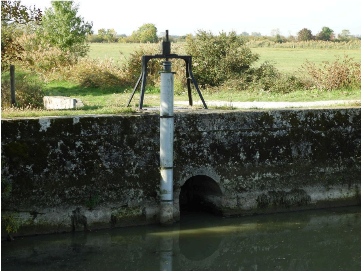
La bonde côté amont, du côté de la ceinture des Hollandais, vue depuis le nord.