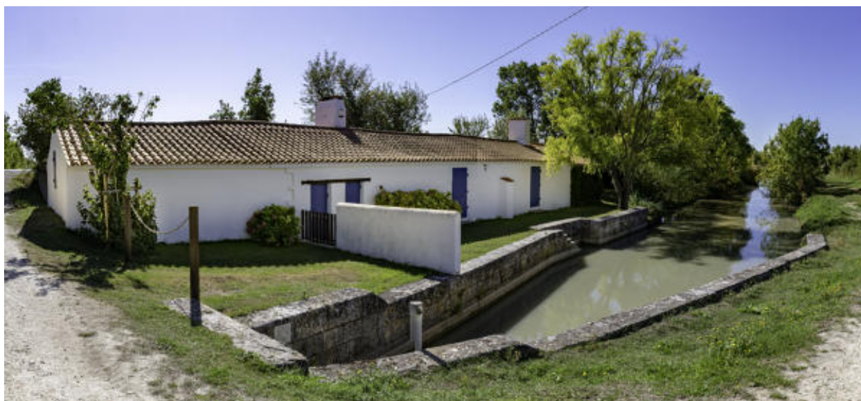
La bonde du Coteau.