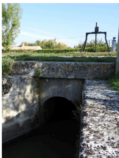
Le passage voûté de la bonde, côté aval, au sud, et le portique au-dessus de la vanne, en arrière.