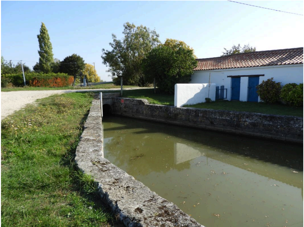
La bonde côté aval, les quais qui l'encadrent et l'ancienne maison de garde, vus depuis le sud-ouest.