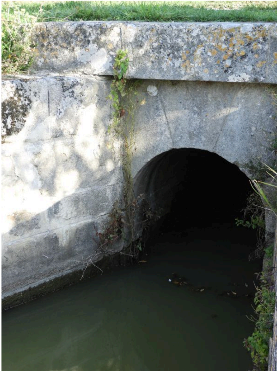
Le passage voûté de la bonde, côté aval, au sud.