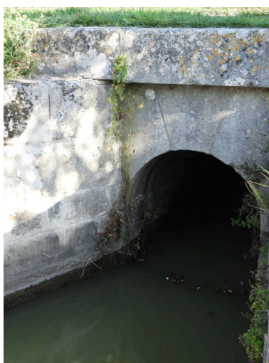
Le passage voûté de la bonde, côté aval, au sud.