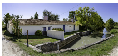
La bonde du Coteau. IVR52_20198502213NUCA