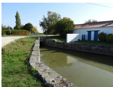
La bonde côté aval, les quais qui l'encadrent et l'ancienne maison de garde, vus depuis le sud-ouest.