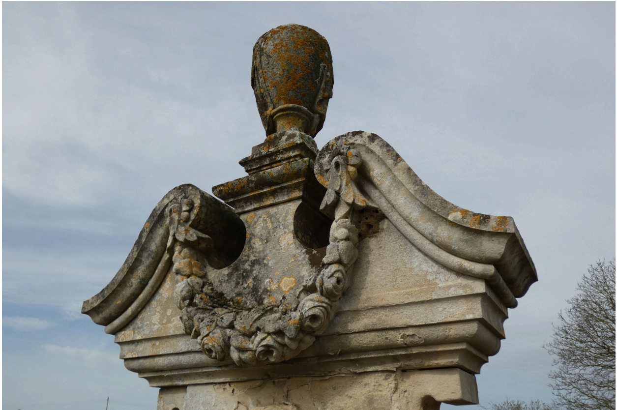
Le fronton surmonté d'une urne funéraire et orné d'une guirlande de roses.