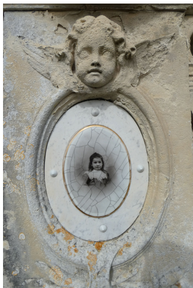
La photographie de la défunte dans un médaillon, sous une tête d'ange sculptée. IVR52_20238501028NUCA