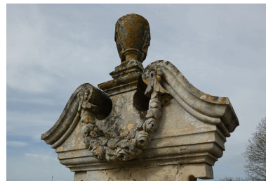
Le fronton surmonté d'une urne funéraire et orné d'une guirlande de roses.