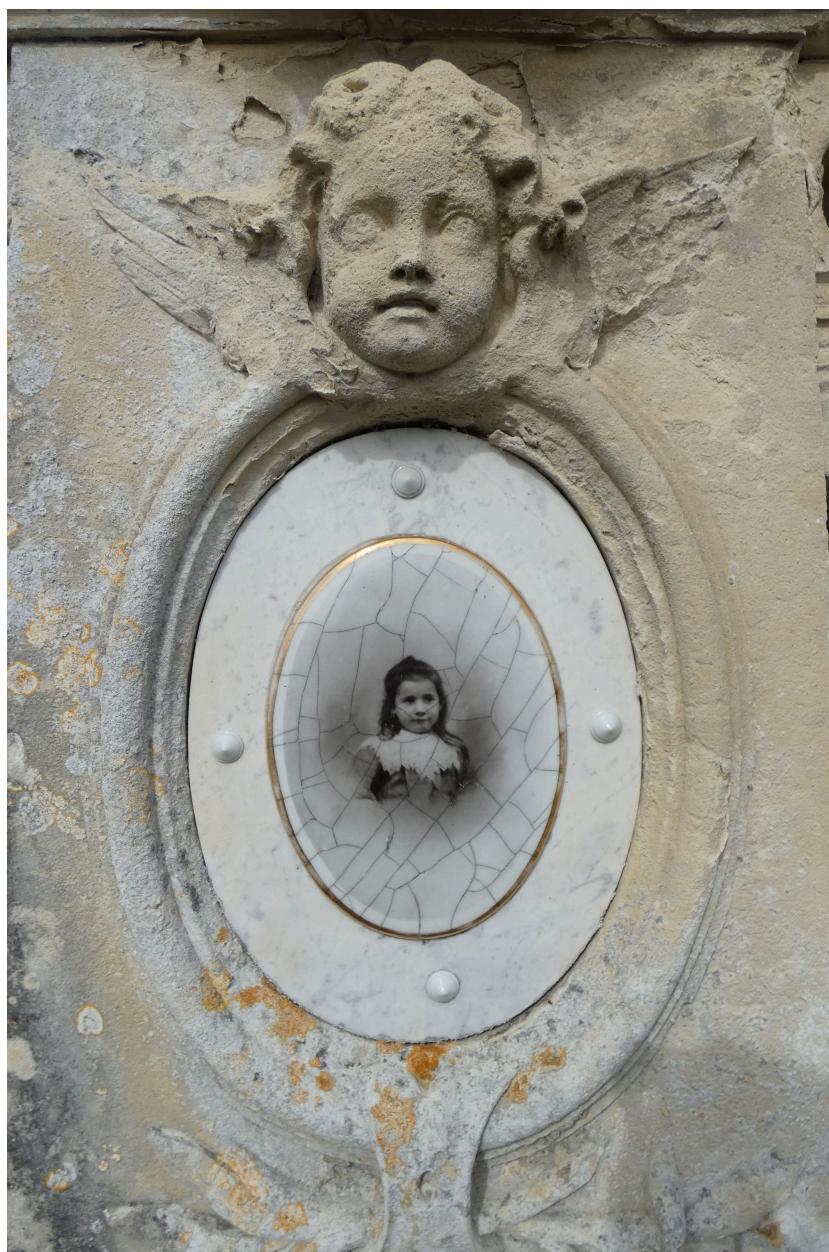
La photographie de la défunte dans un médaillon, sous une tête d'ange sculptée.