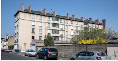
Vue de la façade de l'immeuble côté rue du puit de la chaîne. IVR52_20197200493NUCA