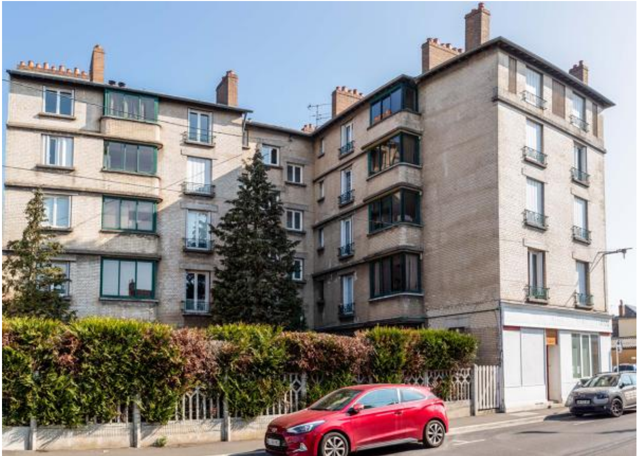
Vue de la façade de l'immeuble côté boulevard Carnot.