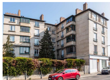
Vue de la façade de l'immeuble côté boulevard Carnot.