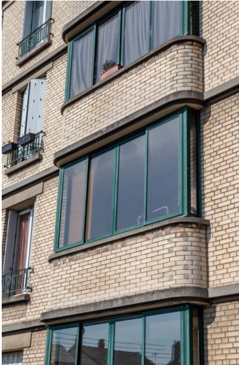
Vue des oriels sur l'aile en retour ouest de l'immeuble.