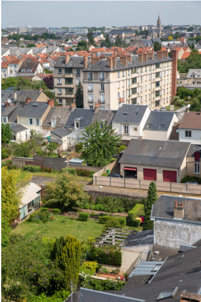
Vue de l'immeuble pris dan l'urbanisation.