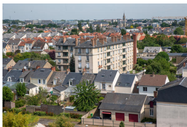
Vue de l'immeuble depuis le sud.