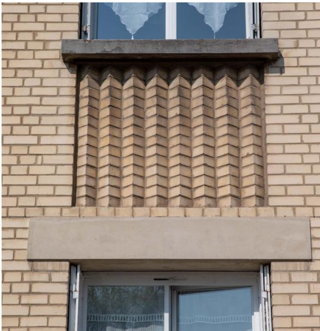
Vue des reliefs en arête de la brique en dessous des fenêtres.