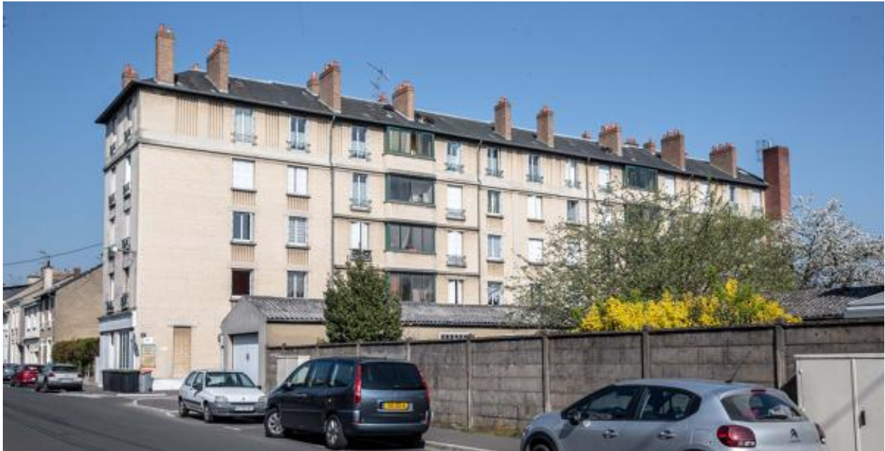
Vue de la façade de l'immeuble côté rue du puit de la chaine.