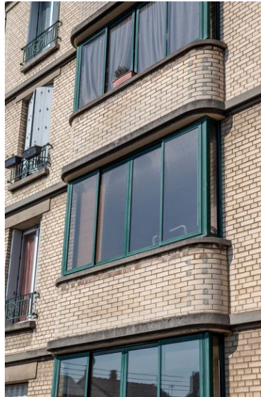
Vue des oriels sur l'aile en retour ouest de l'immeuble.