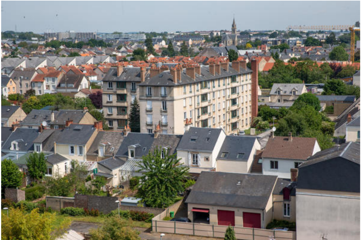
Vue de l'immeuble depuis le sud.