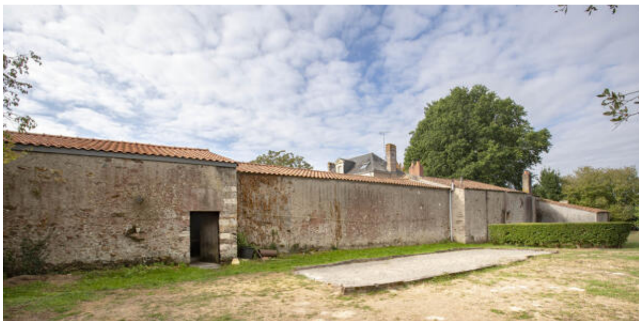
Aile nord de l'ensemble agricole, ayant abrité la cuverie, vue du nord.