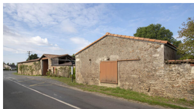
Vue générale depuis la route de la Haye-Fouassière