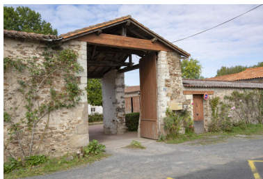
Porte cochère, depuis la route de la Haye-Fouassière.