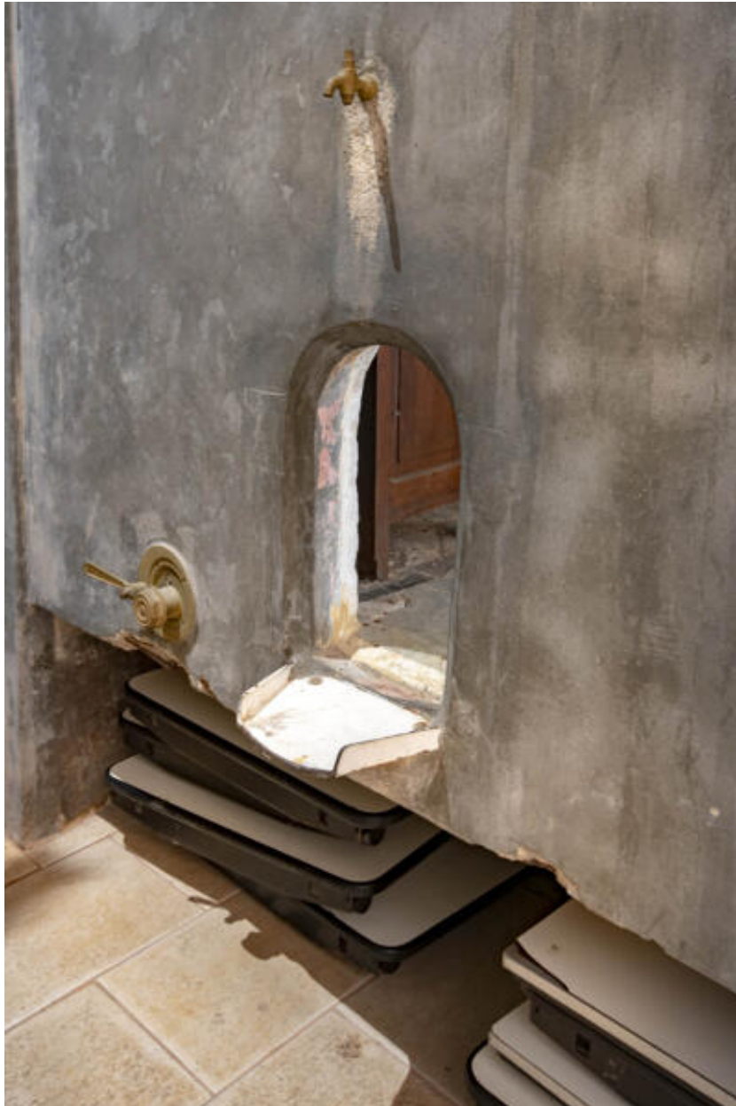
Cuve aérienne désaffectée.