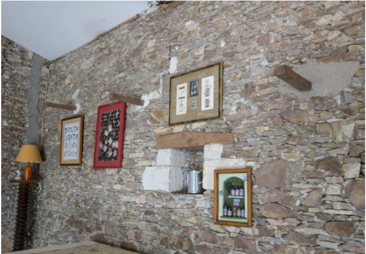
Détail d'une baie condamnée.