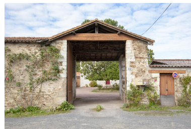
IVR52_20224400334NUCA