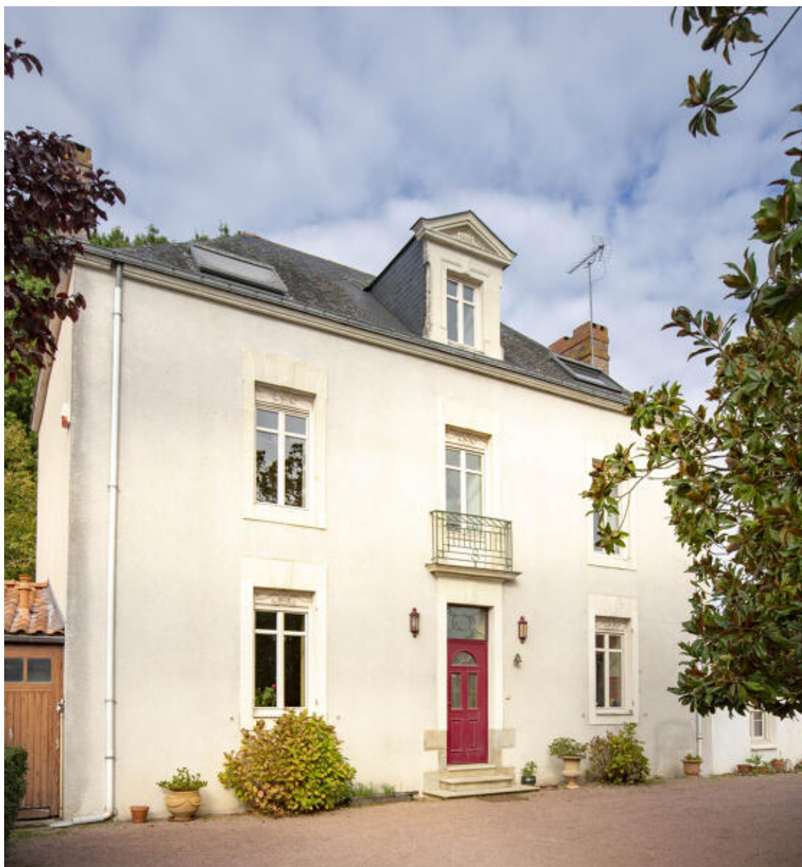
Maison de maître, depuis la cour.