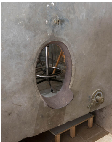
Cuve aérienne désaffectée.