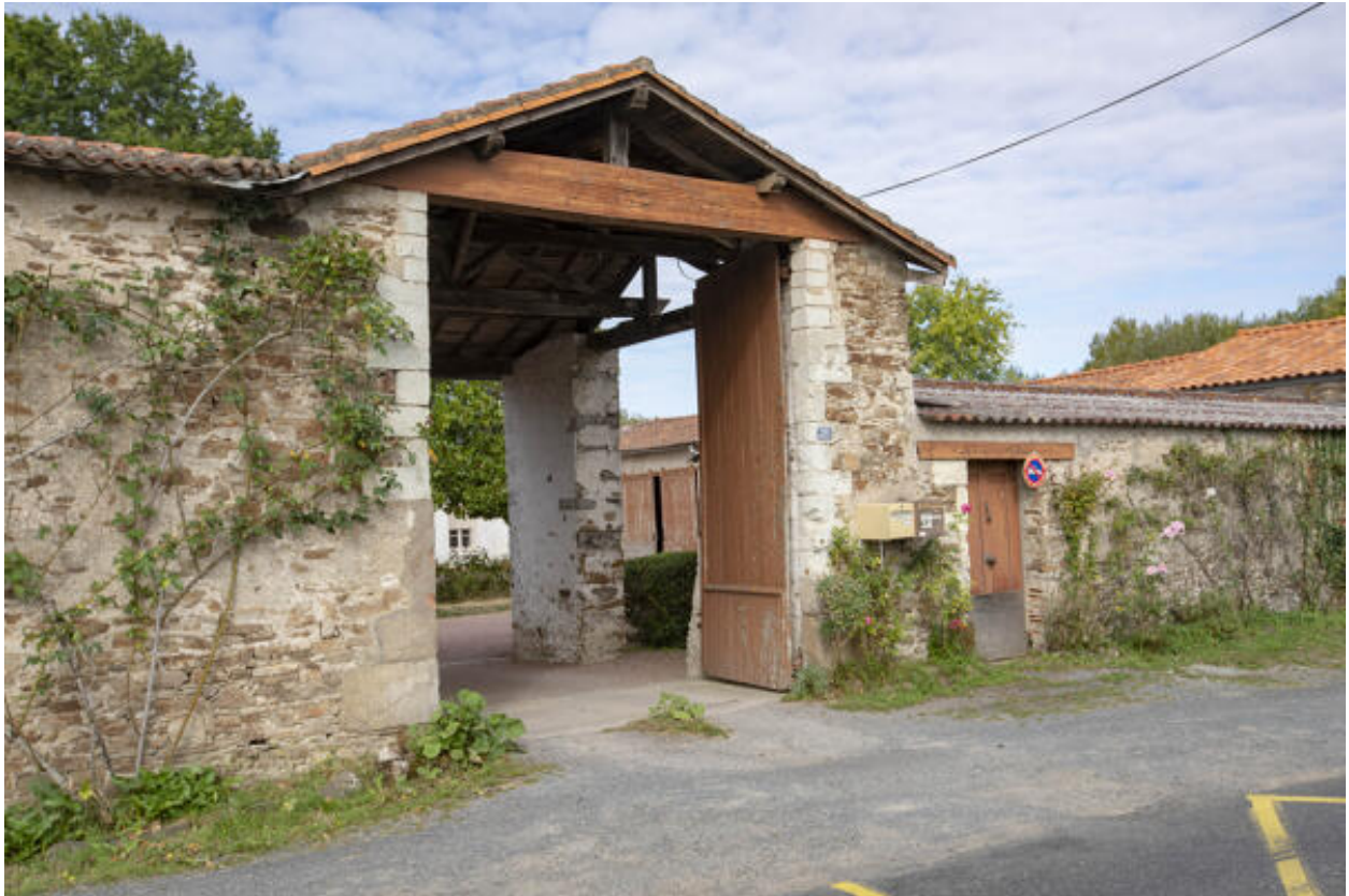
Porte cochère, depuis la route de la Haye-Fouassière.