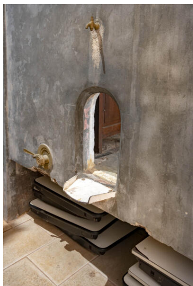
Cuve aérienne désaffectée. IVR52_20224400323NUCA