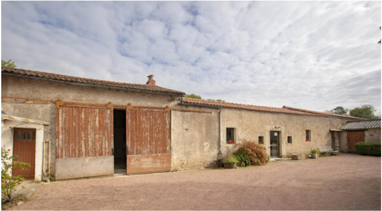
Aile nord de l'ensemble agricole, ayant abrité la cuverie, vue du sud.