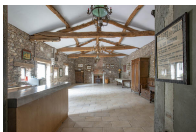
Ancien chai reconverti en habitation ; on distingue les deux dernières cuves désaffectées aux extrémités gauche et droite de l'image. IVR52_20224400326NUCA