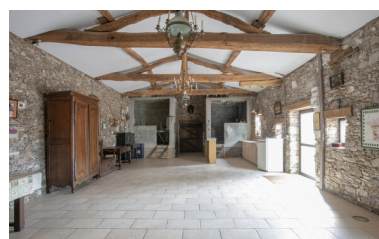
Ancien chai reconverti en habitation ; on distingue les deux dernières cuves désaffectées au fond du bâtiment. IVR52_20224400327NUCA