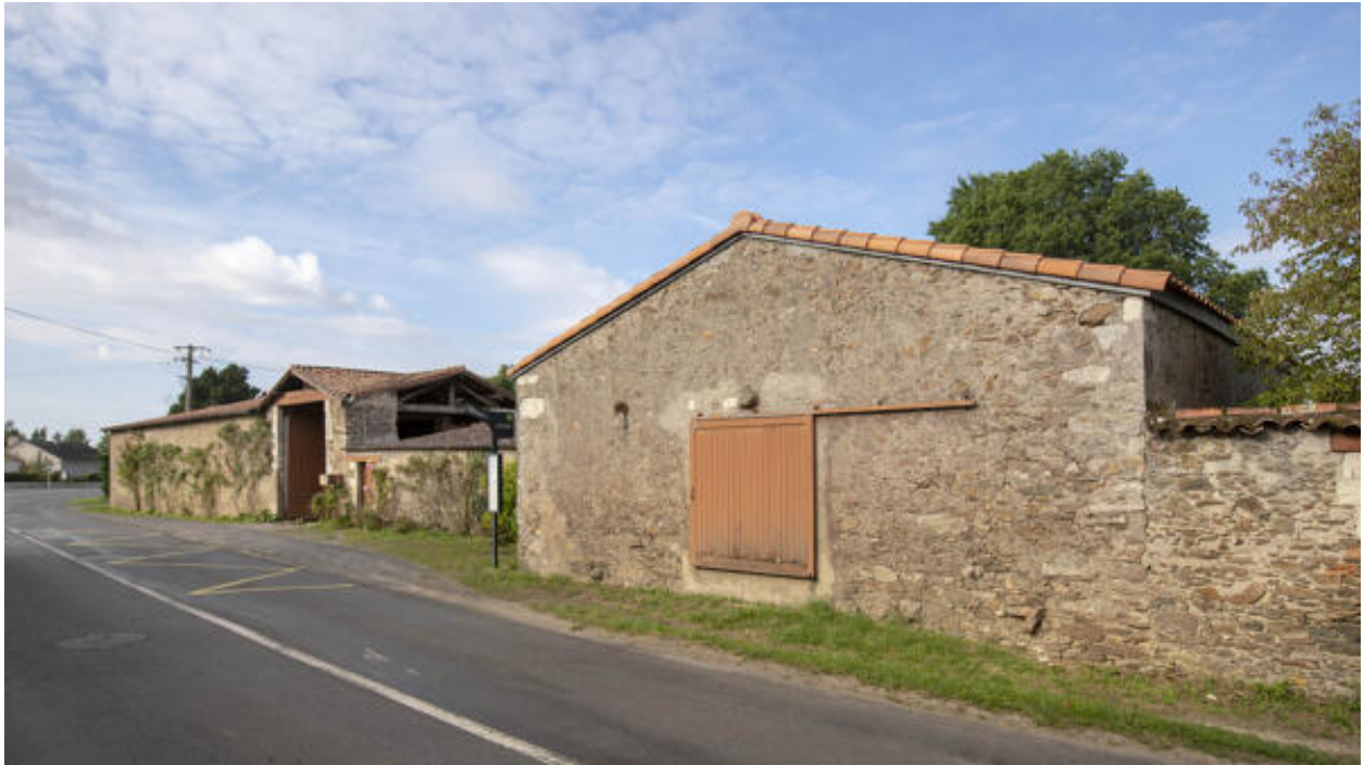
Vue générale depuis la route de la Haye-Fouassière