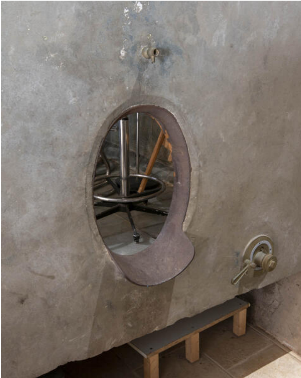
Cuve aérienne désaffectée.