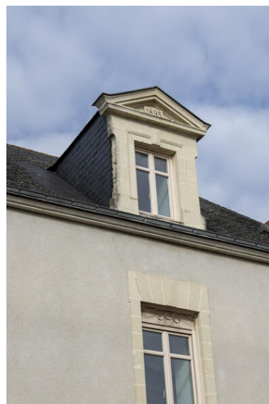
Détail de la lucarne en chien assis. IVR52_20224400331NUCA