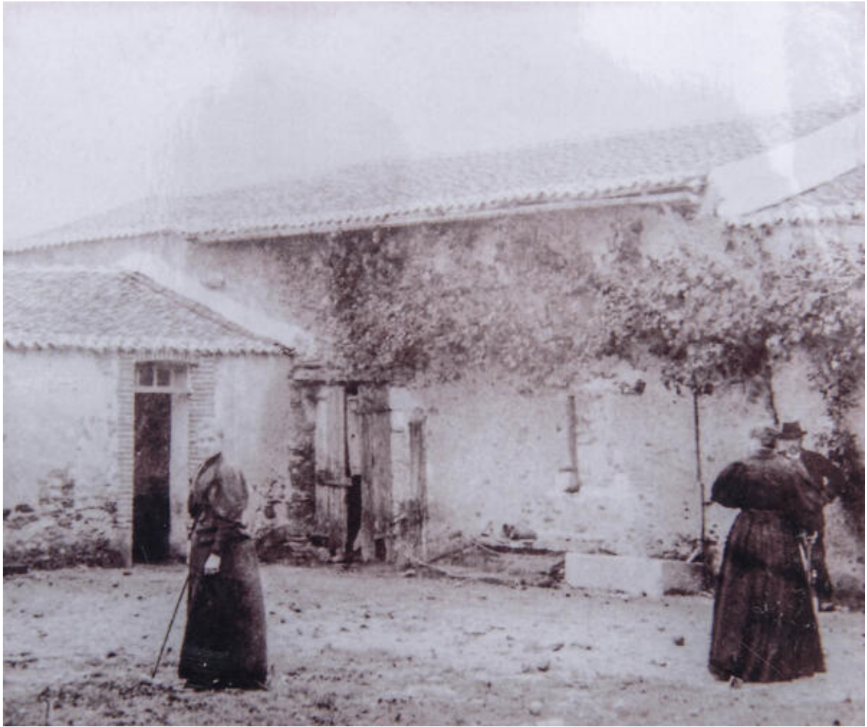
Angle nord-ouest de la ferme, vu de la cour.