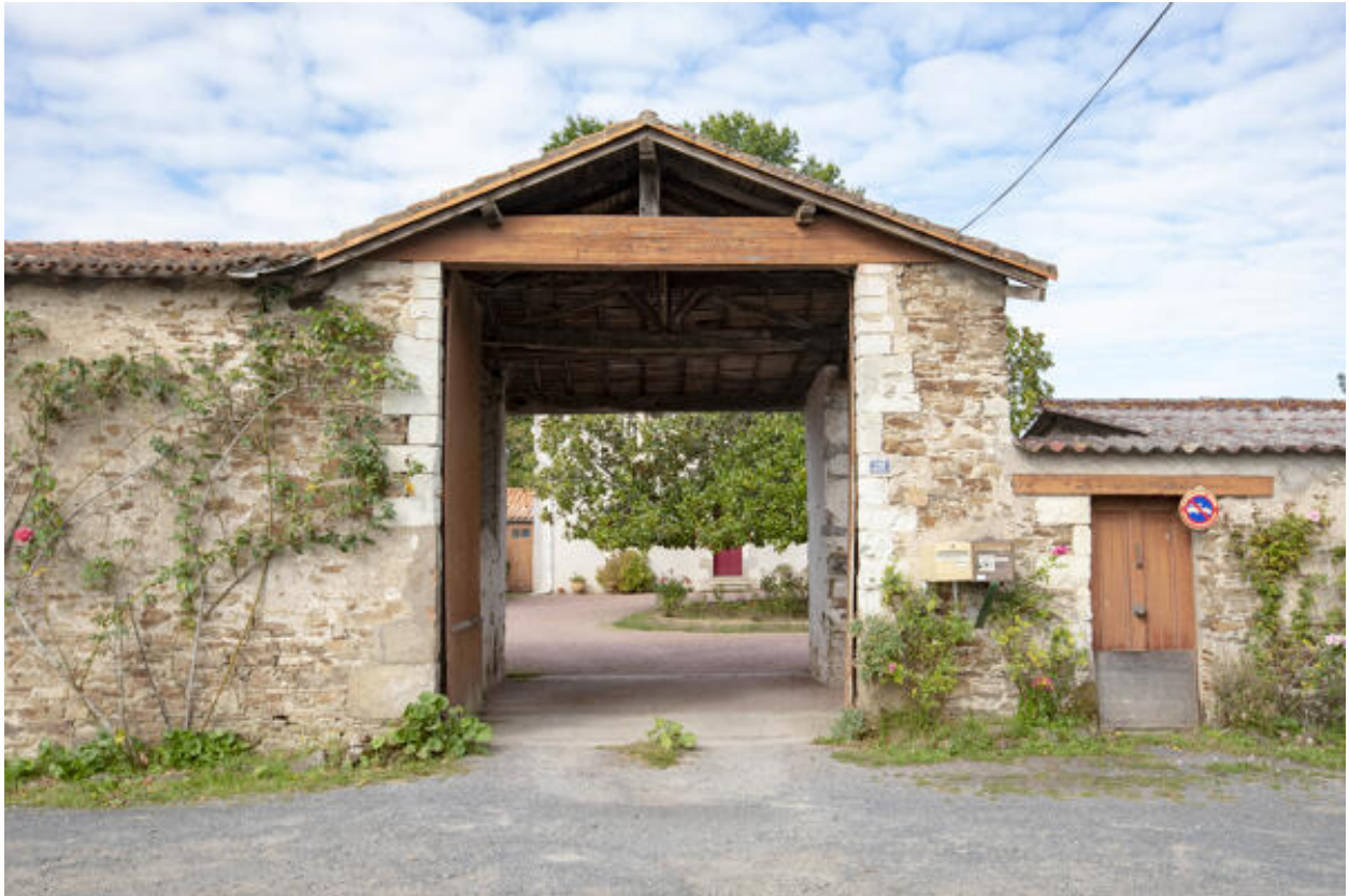
Porte cochère, depuis la route de la Haye-Fouassière.