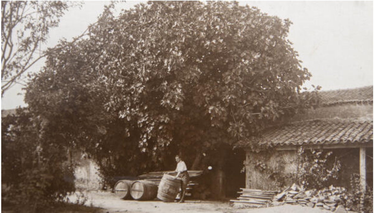
Michel Libeau père, dans la cour de la ferme de la Poterie (?)