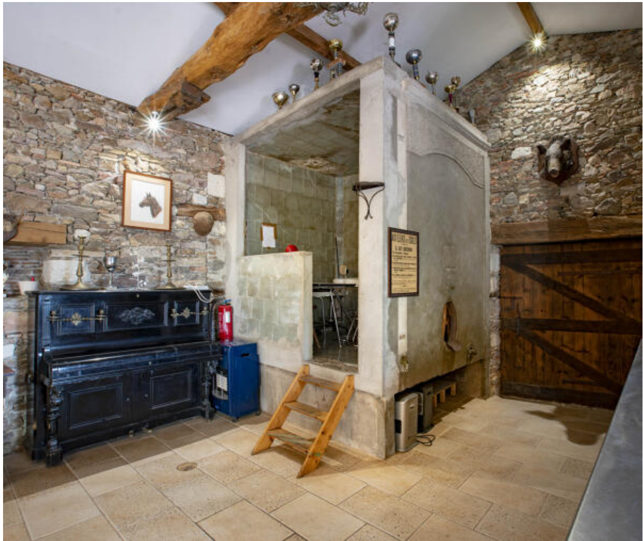
Cuve aérienne désaffectée.