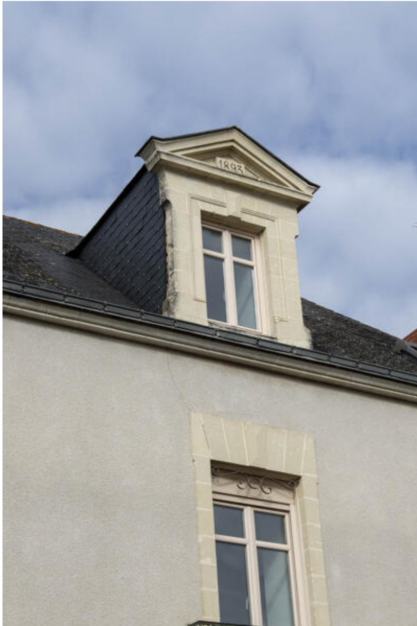
Détail de la lucarne en chien assis.