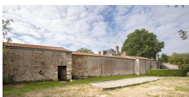
Aile nord de l'ensemble agricole, ayant abrité la cuverie, vue du nord. IVR52_20224400324NUCA