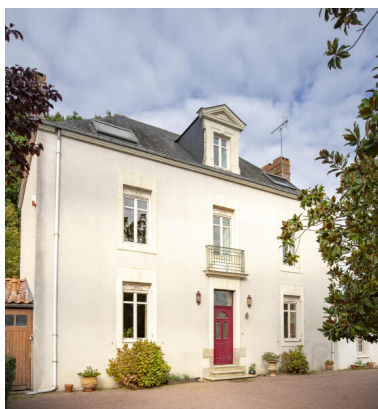
Maison de maître, depuis la cour. IVR52_20224400330NUCA