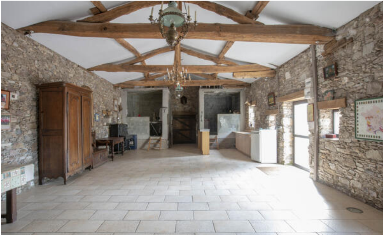
Ancien chai reconverti en habitation ; on distingue les deux dernières cuves désaffectées au fond du bâtiment.