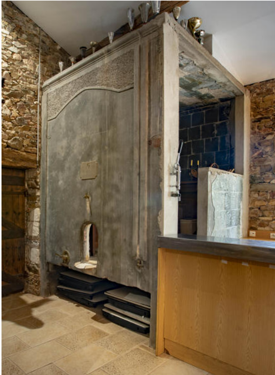
Cuve aérienne désaffectée.