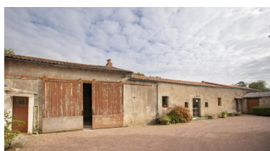
Aile nord de l'ensemble agricole, ayant abrité la cuverie, vue du sud. IVR52_20224400329NUCA