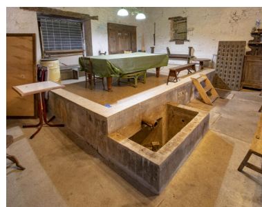
Maie désaffectée et cuves souterraines ; au fond à gauche, porte à vendange.