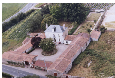
Vue aérienne non datée de la ferme de la Poterie.