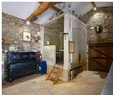
Cuve aérienne désaffectée. IVR52_20224400321NUCA