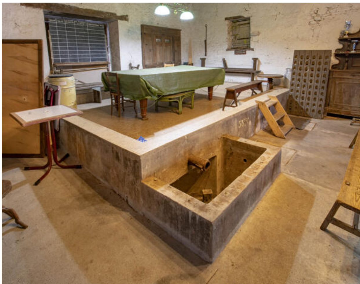
Maie désaffectée et cuves souterraines ; au fond à gauche, porte à vendange.