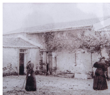
Angle nord-ouest de la ferme, vu de la cour.