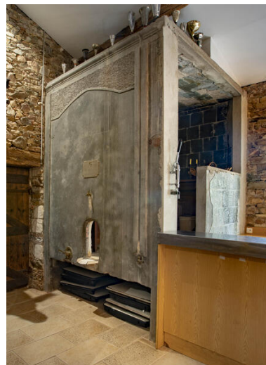
Cuve aérienne désaffectée. IVR52_20224400320NUCA