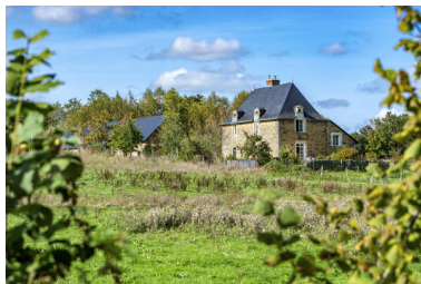
La maison des Landellières.