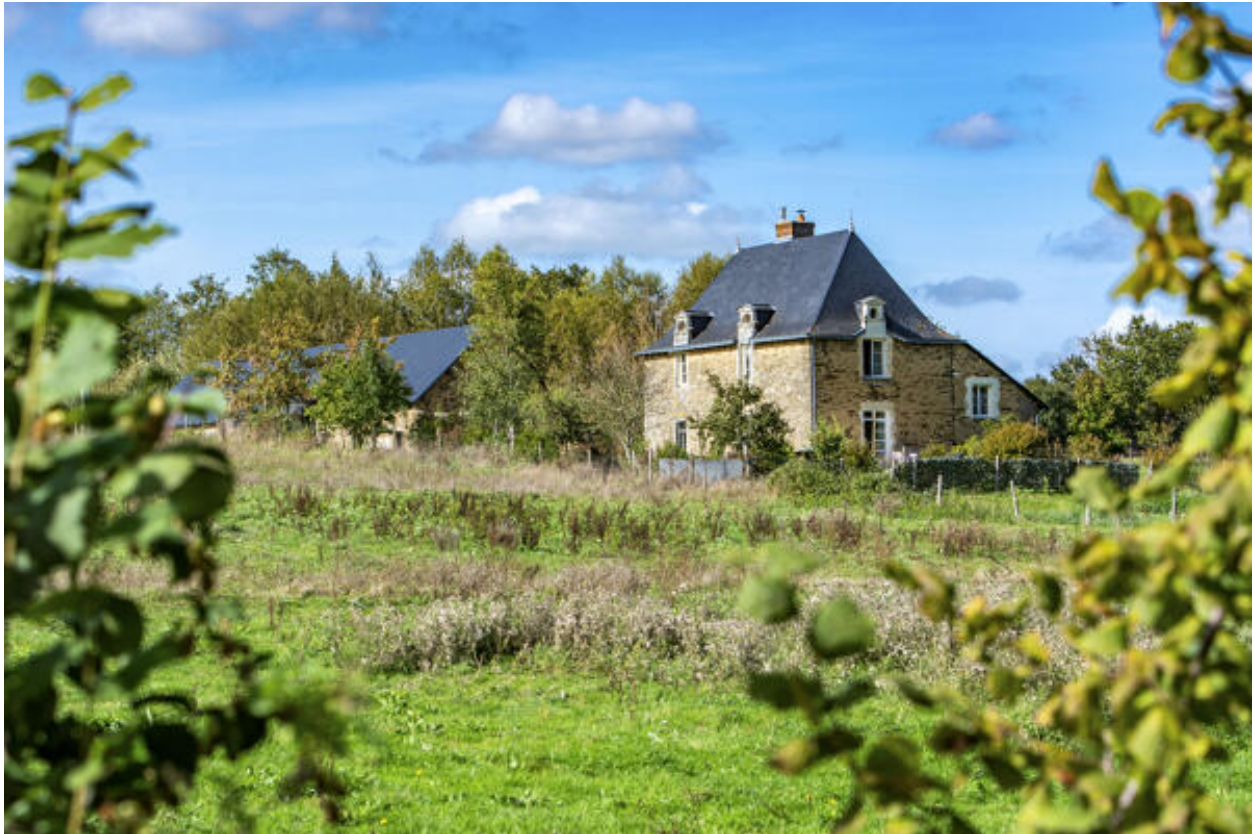
La maison des Landellières.