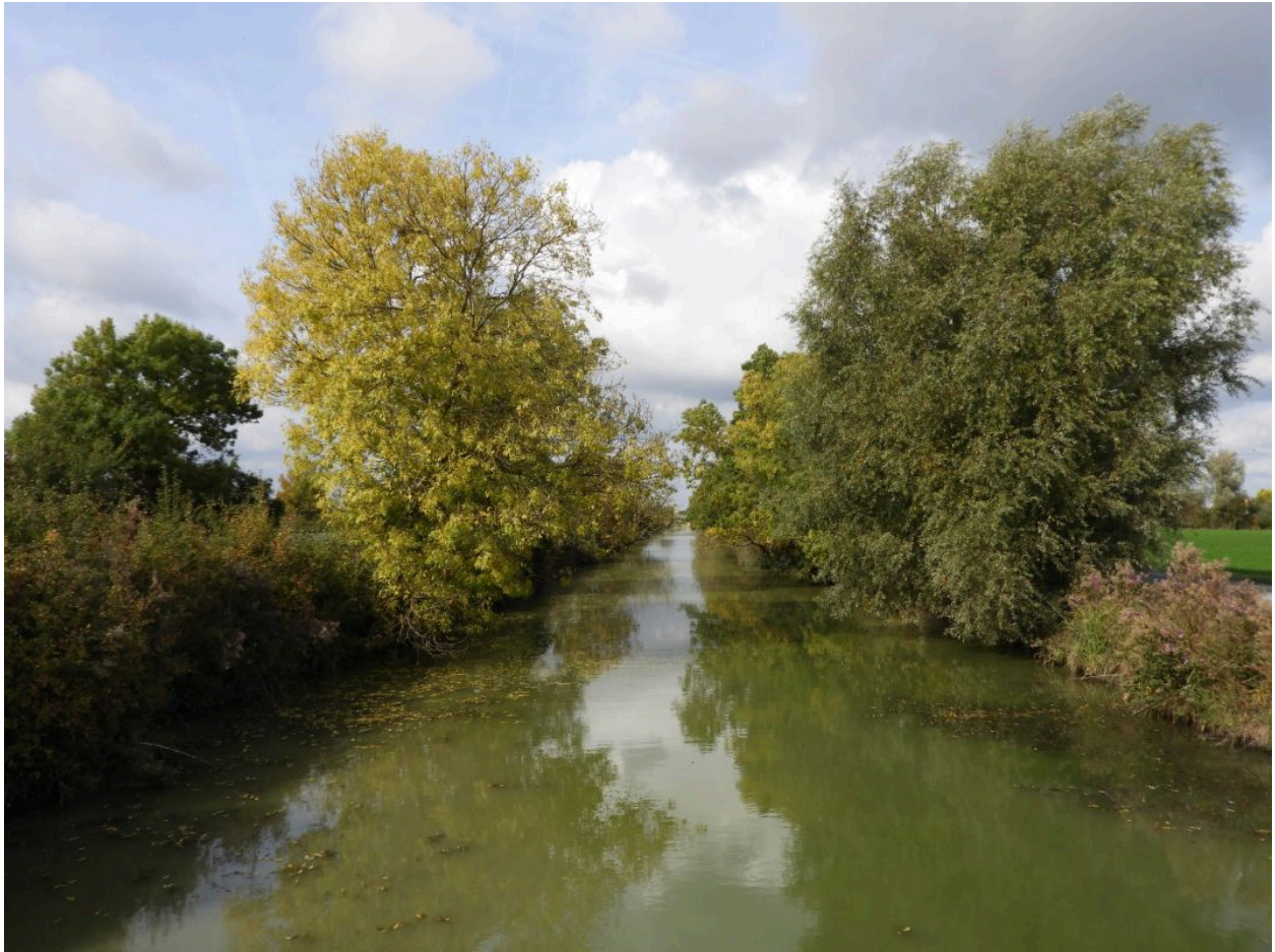
Le canal de Vienne au sud du pont de Puyravault, vu en direction du nord.