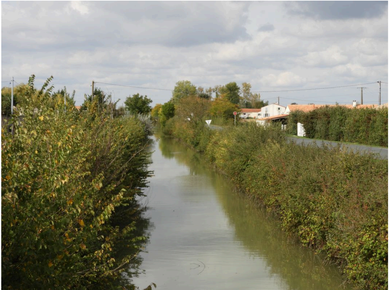
Le canal de Vienne au pont de Puyravault, traversant l'ancienne île, vu en direction du nord.