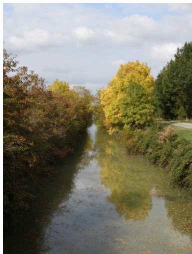
Le canal de Vienne vu en direction du nord, à Moque-Souris. IVR52_20188500091NUCA