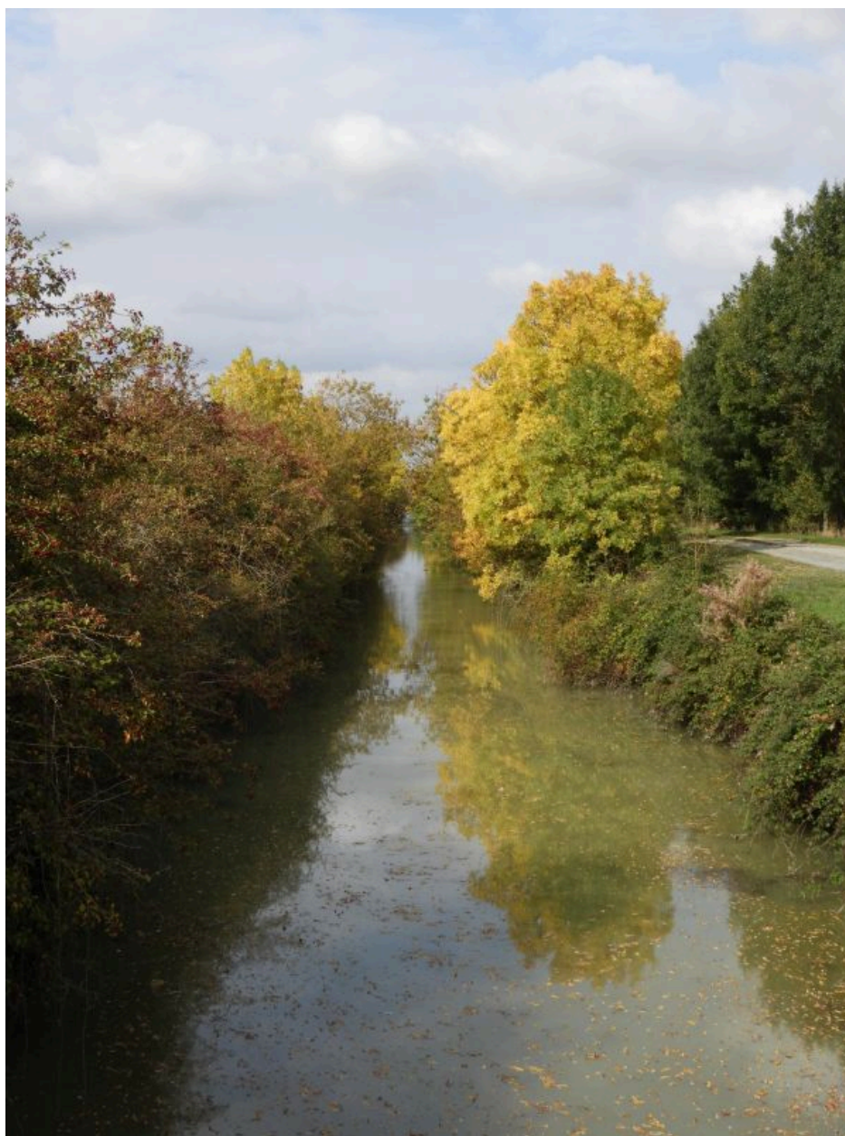
Le canal de Vienne vu en direction du nord, à Moque-Souris.