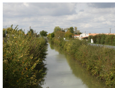
Le canal de Vienne au pont de Puyravault, traversant l'ancienne île, vu en direction du nord.