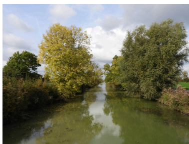
Le canal de Vienne au sud du pont de Puyravault, vu en direction du nord.