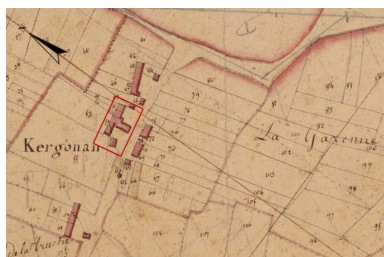
Extrait du plan cadastral de 1819, section E1, parcelles n° 50, 52, 54. IVR52_20094404073NUCA