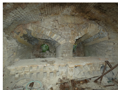
Les deux foyers du second four, vus depuis le sud.

IVR52_20228500812NUCA