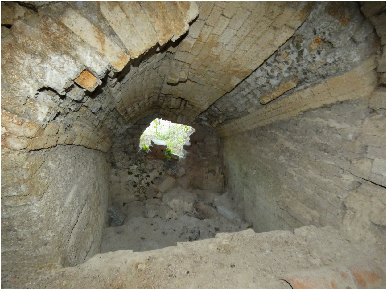
Un des deux foyers du second four, vu depuis le sud.