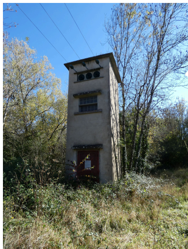
Le transformateur électrique vu depuis le nord.