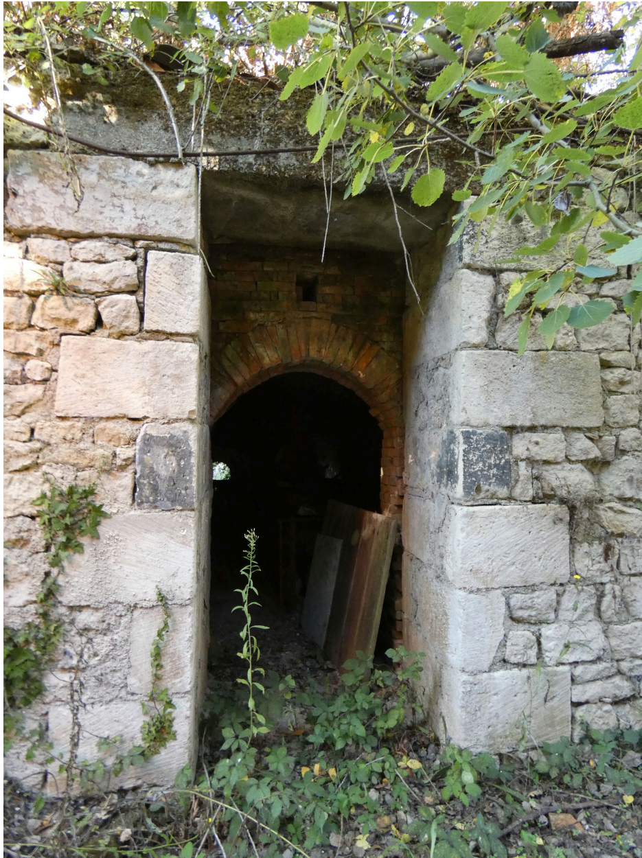
La porte d'enfournement du second four, à l'est, vue depuis le sud.