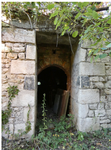
La porte d'enfournement du second four, à l'est, vue depuis le sud.

IVR52_20228500803NUCA