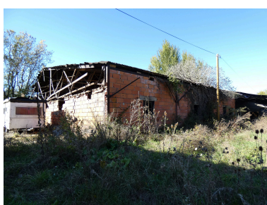
Le séchoir vu depuis le sud-est.