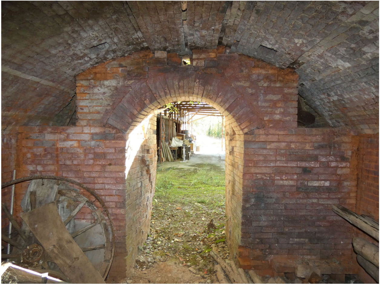
La porte d'enfournement du premier four, encadrée des conduits de cheminées, vue depuis le nord.