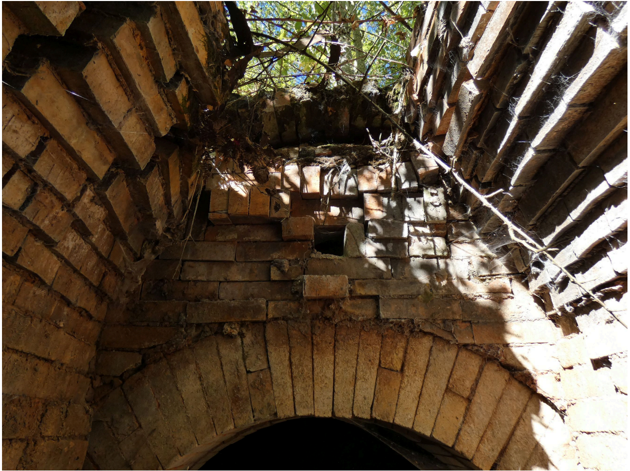
La voûte au-dessus de la porte du premier four.