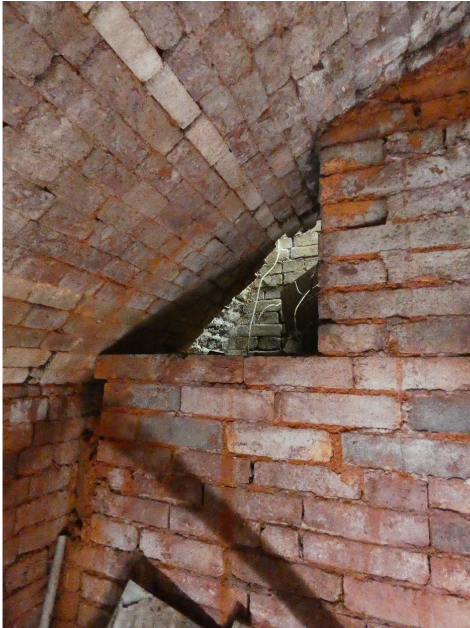
Un des conduits de cheminées de chaque côté de la porte du premier four, côté intérieur.