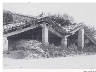
Anciens séchoirs vus vers 1980.