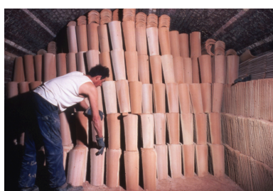
Tuiles dans le four.