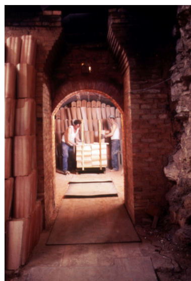
Entrée d'un des fours en cours de déchargement, vers 1980. IVR52_20218501968NUCA