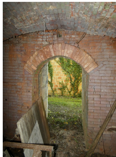
La porte d'enfournement du second four, vue depuis le nord.

IVR52_20228500798NUCA