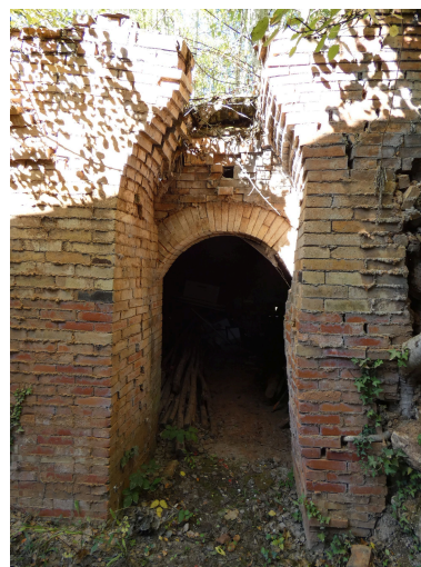
La porte d'enfournement du premier four, à l'ouest, vue depuis le sud. IVR52_20228500799NUCA