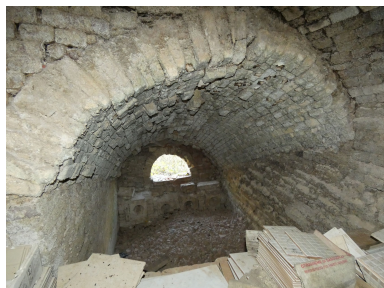
Un des deux foyers du premier four.

Phot. Yannis Suire IVR52_20228500805NUCA