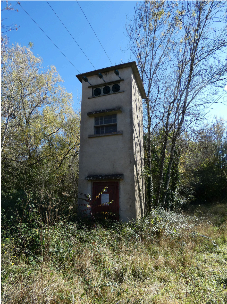
Le transformateur électrique vu depuis le nord.