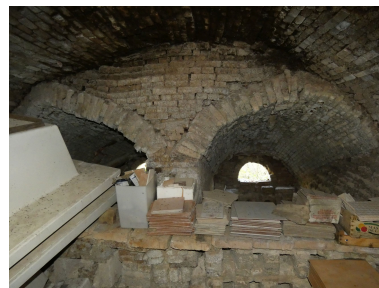
Les deux foyers du premier four, vus depuis le sud.

Phot. Yannis Suire IVR52_20228500806NUCA