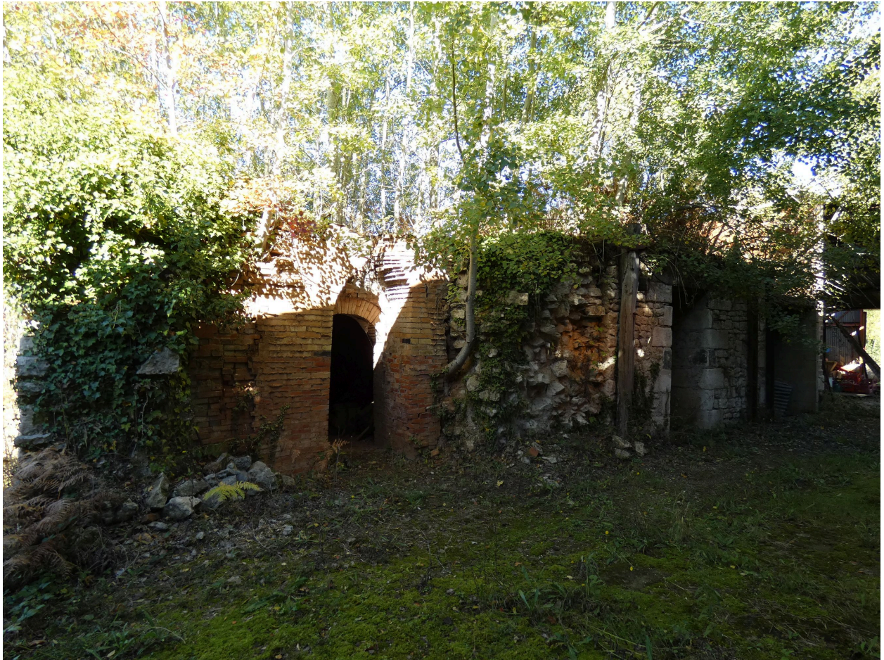
Les fours vus depuis le sud-ouest.