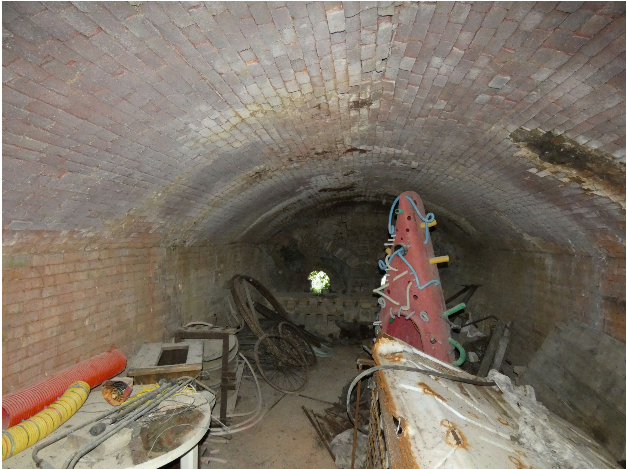
La chambre de cuisson du second four, vue depuis le sud.