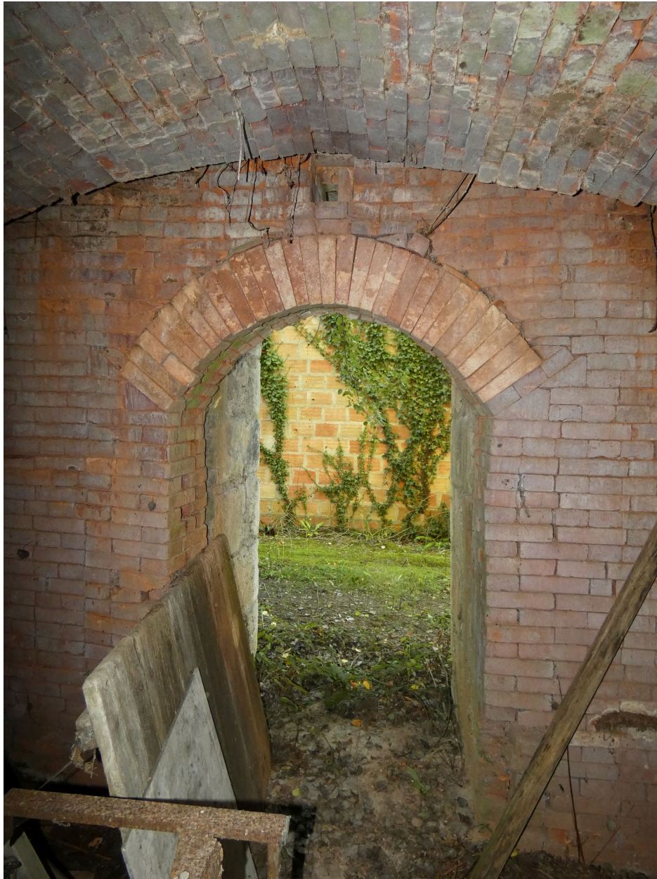
La porte d'enfournement du second four, vue depuis le nord.