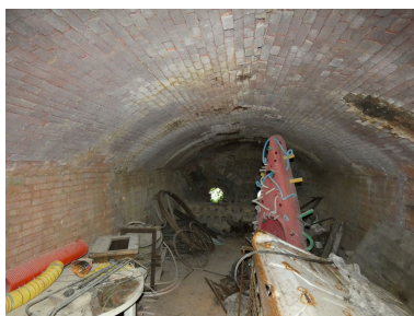
La chambre de cuisson du second four, vue depuis le sud.

Phot. Yannis Suire IVR52_20228500812NUCA