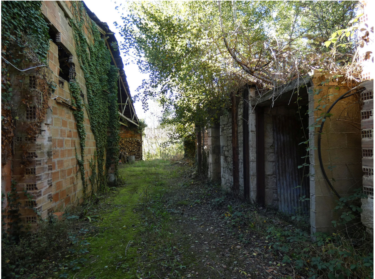
Le séchoir, à gauche, et les fours, à droite, vus depuis l'est.