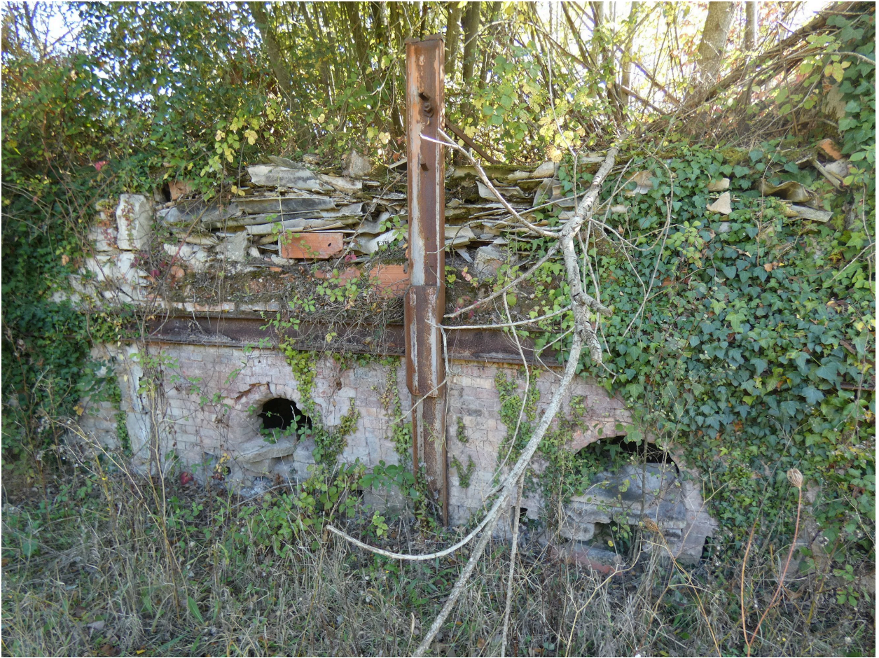
Les gueules de foyers du second four, vues depuis le nord.