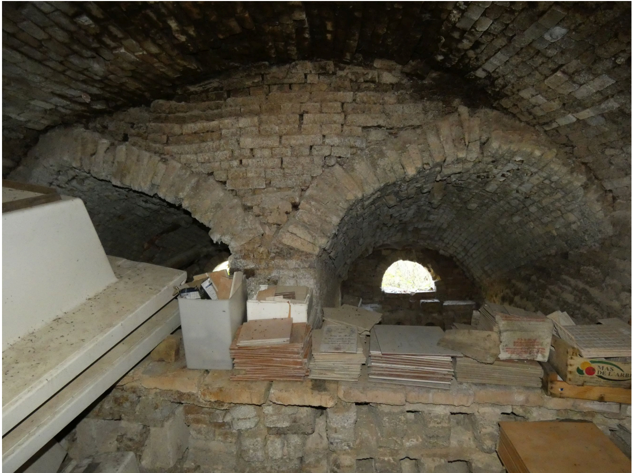
Les deux foyers du premier four, vus depuis le sud.