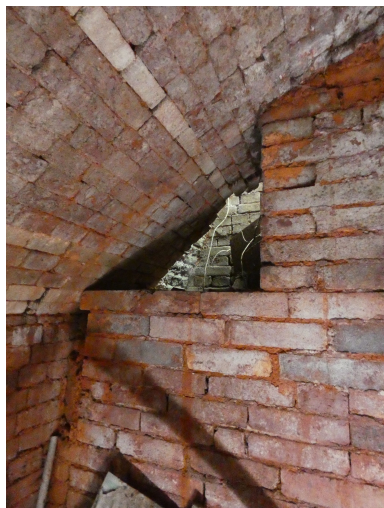
Un des conduits de cheminées de chaque côté de la porte du premier four, côté intérieur.

IVR52_20228500802NUCA