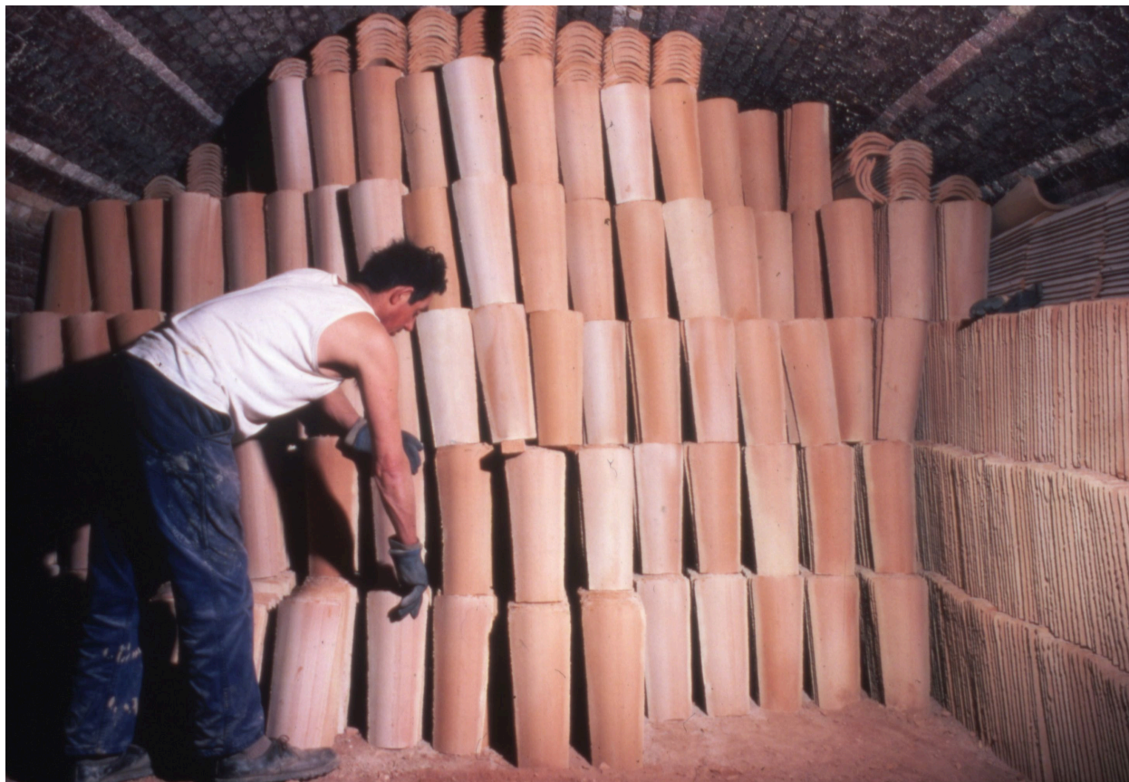
Tuiles dans le four.