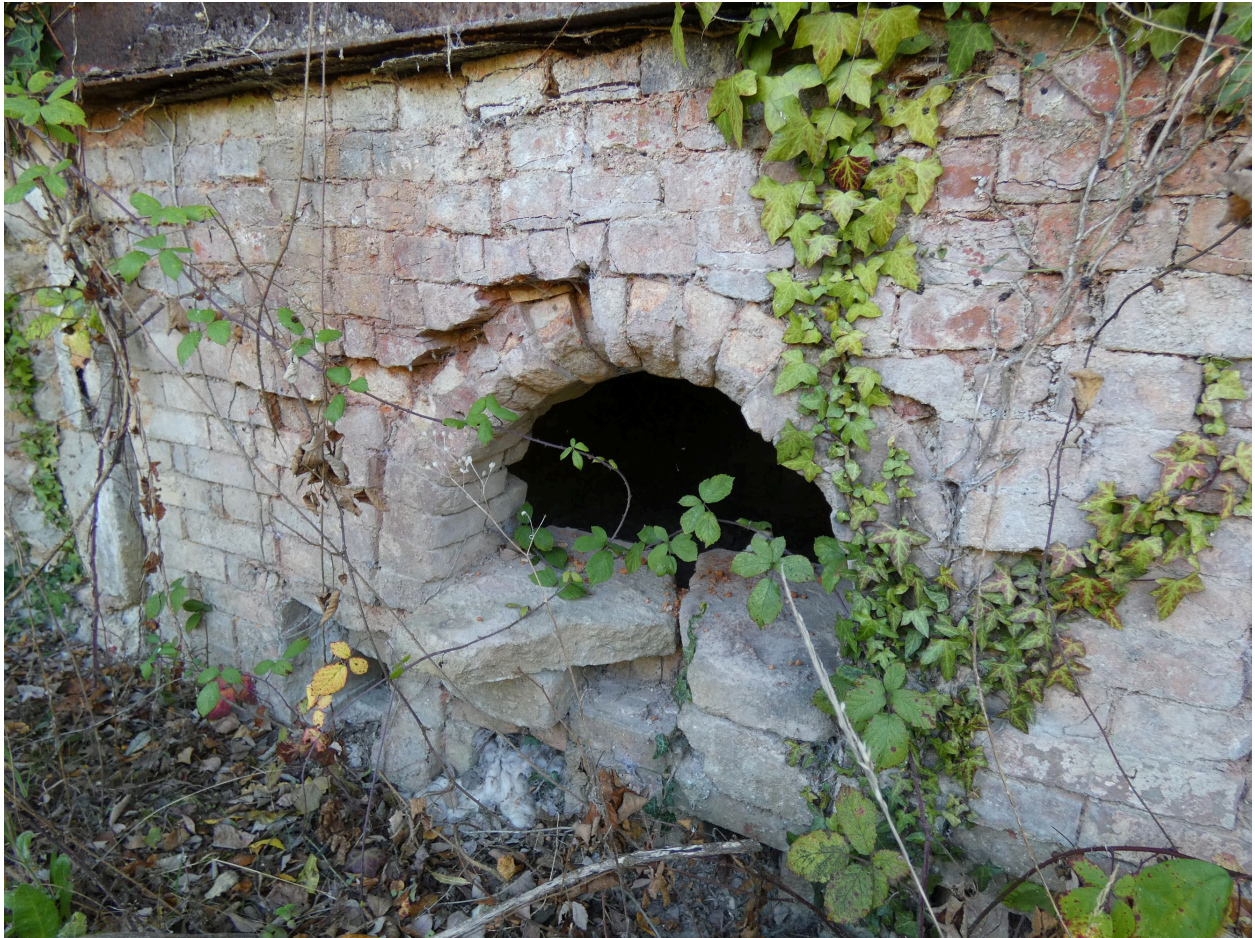
Une des gueules de foyer.