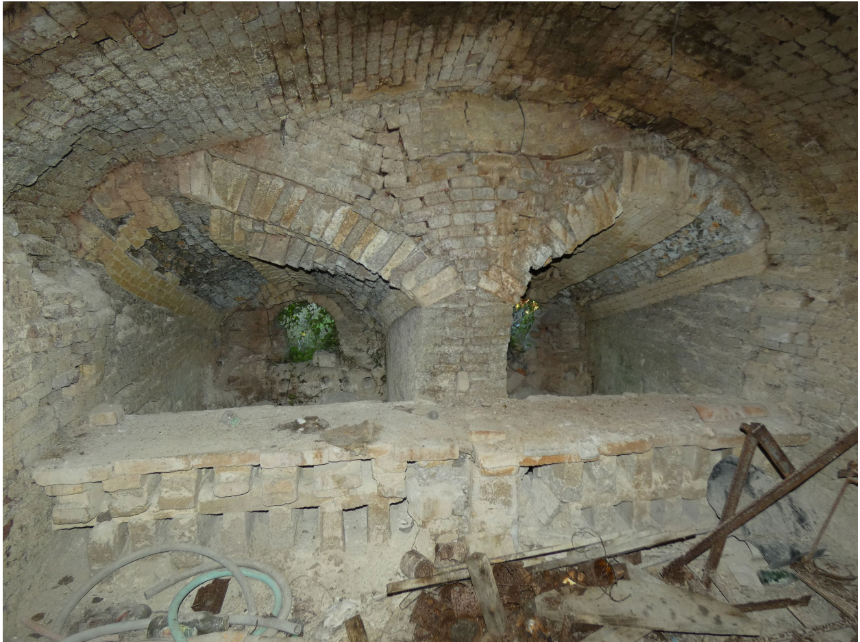
Les deux foyers du second four, vus depuis le sud.