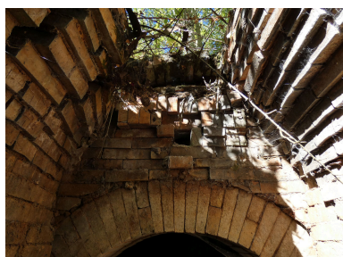
La voûte au-dessus de la porte du premier four.