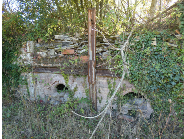
Les gueules de foyers du second four, vues depuis le nord.