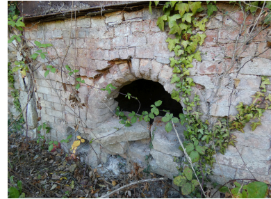
Une des gueules de foyer.