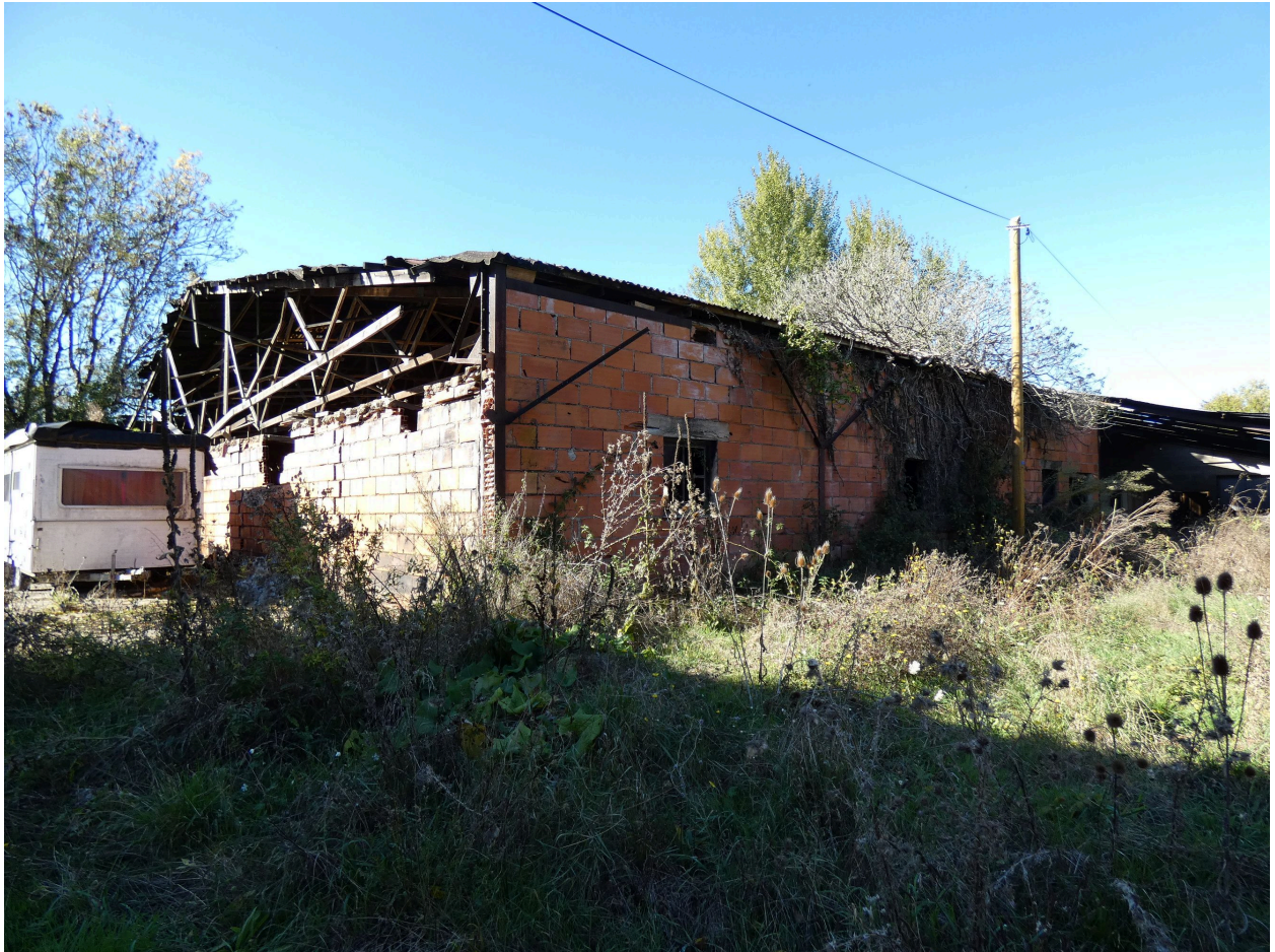
Le séchoir vu depuis le sud-est.