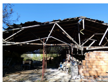
Le séchoir vu depuis le sud. IVR52_20228500818NUCA