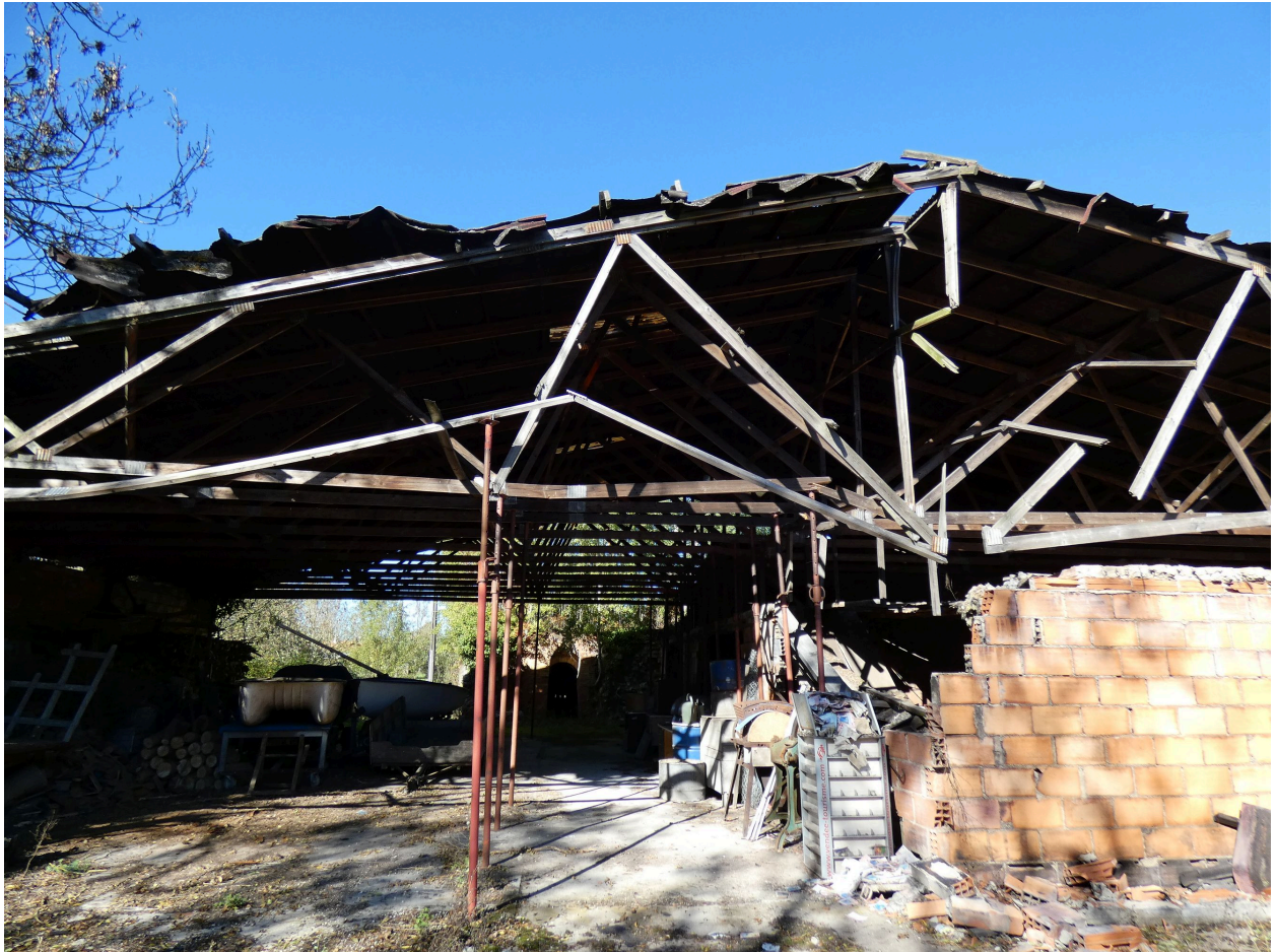
Le séchoir vu depuis le sud.