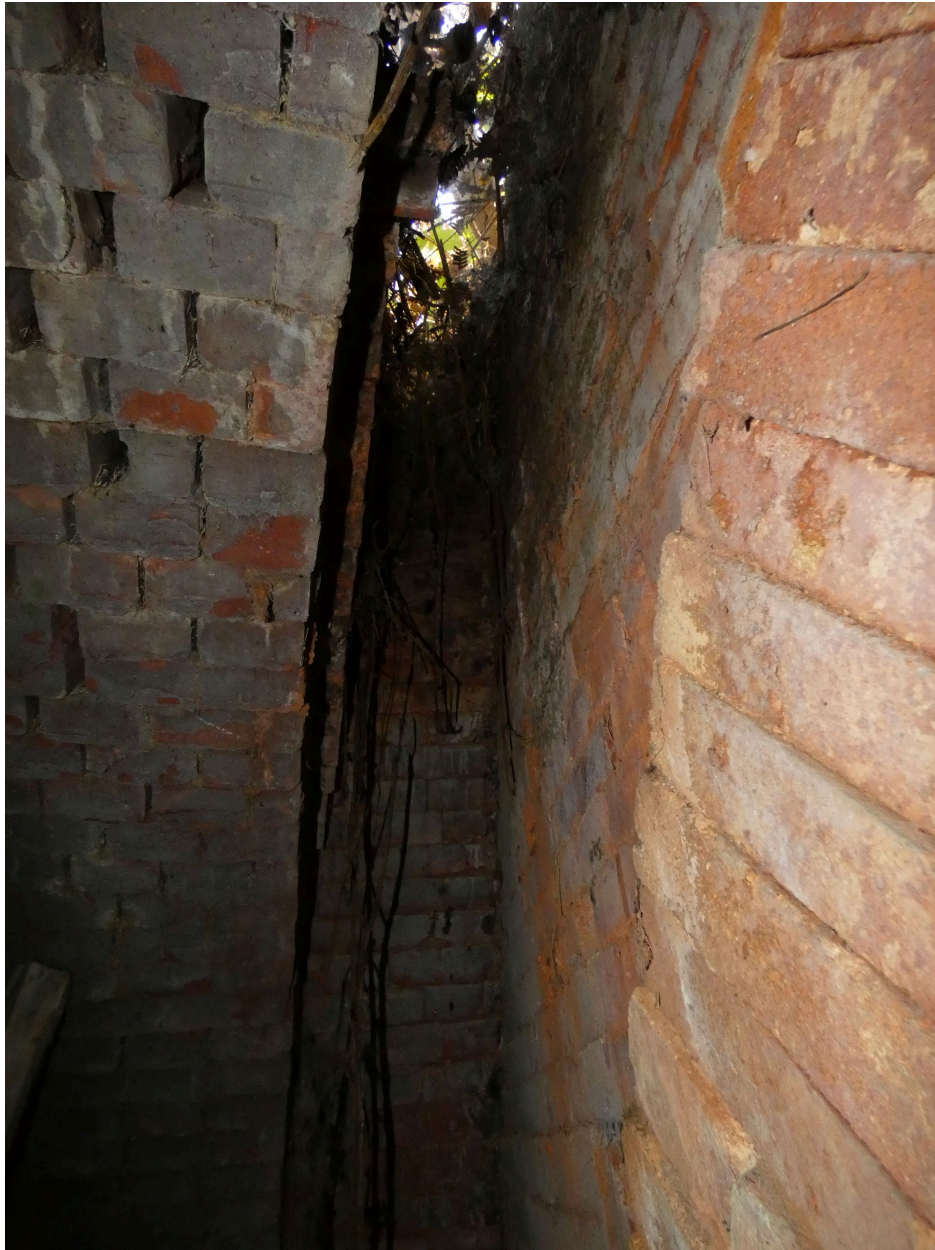
Le conduit d'évacuation au-dessus de la porte d'enfournement du second four.