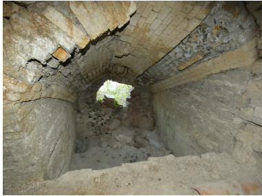
Un des deux foyers du second four, vu depuis le sud.

Le conduit d'évacuation au-dessus de la porte d'enfournement du second four.