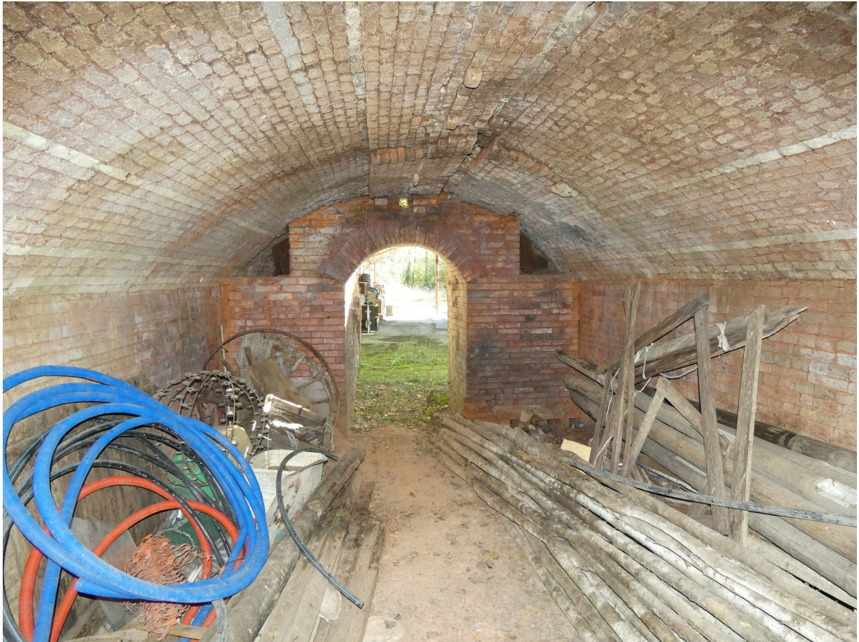
La chambre de cuisson du premier four, vue depuis le nord.