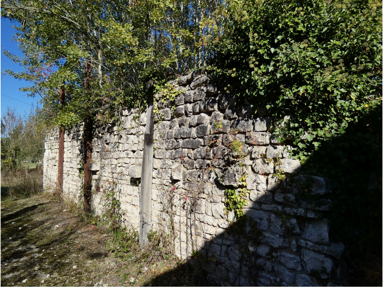
L'élévation ouest des four, en moellons calcaires ceinturés de métal.