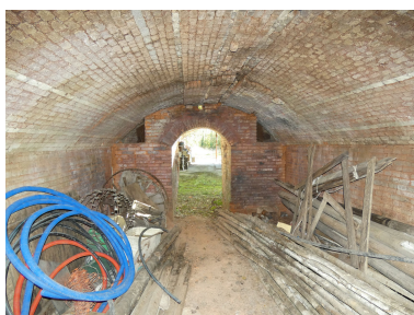
La chambre de cuisson du premier four, vue depuis le nord.