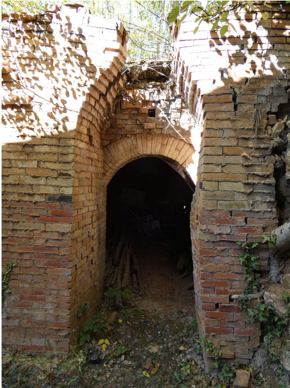
La porte d'enfournement du premier four, à l'ouest, vue depuis le sud.