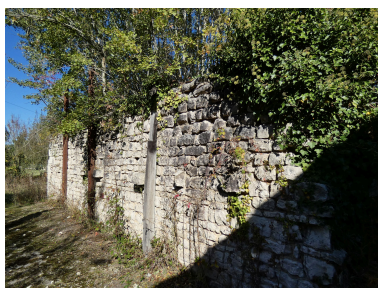
L'élévation ouest des four, en moellons calcaires ceinturés de métal.