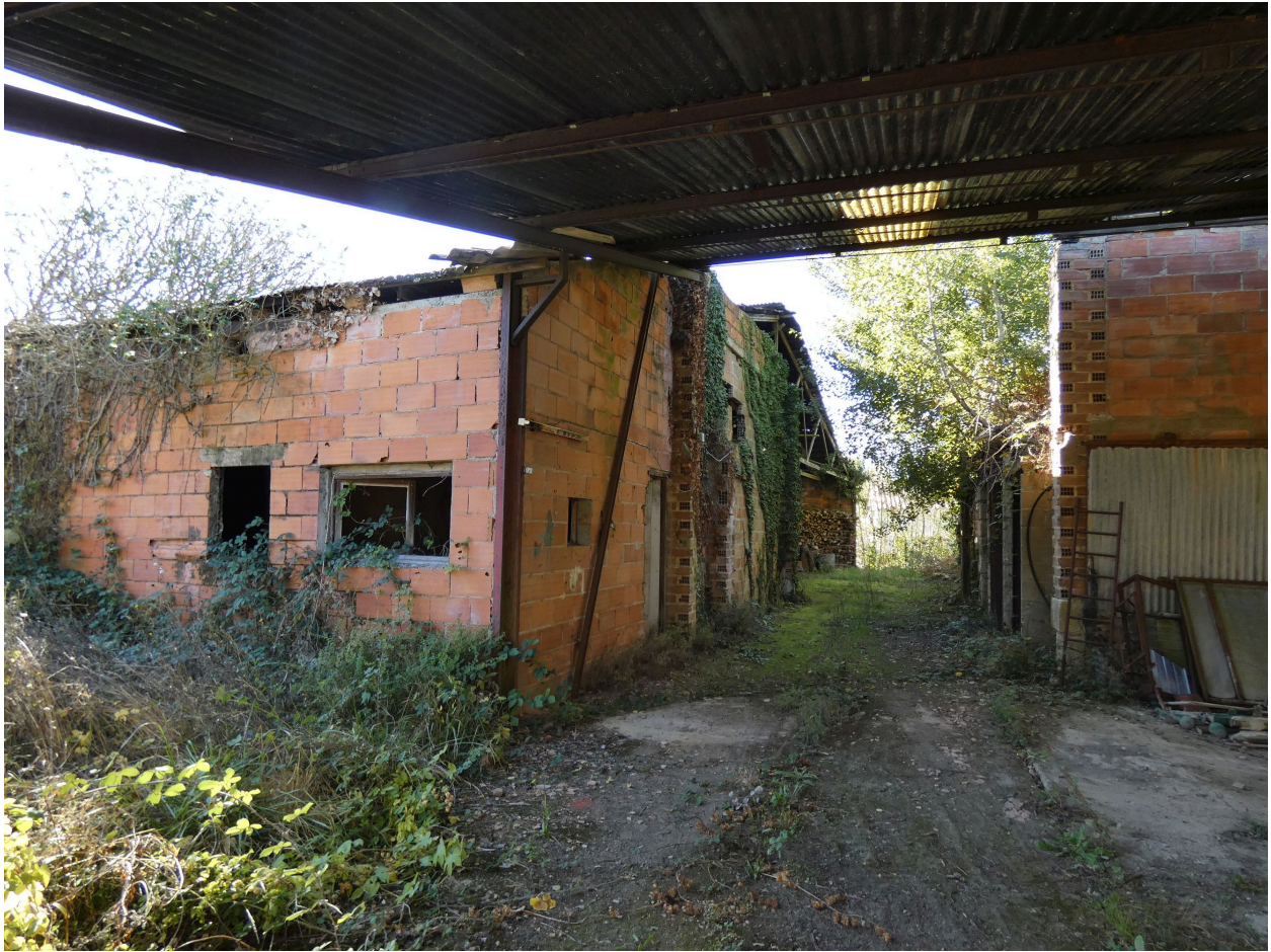
Le séchoir, à gauche, et les fours, à droite, vus depuis l'est.