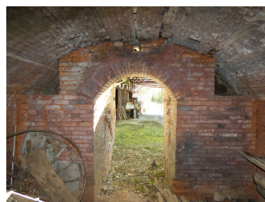
La porte d'enfournement du premier four, encadrée des conduits de cheminées, vue depuis le nord.