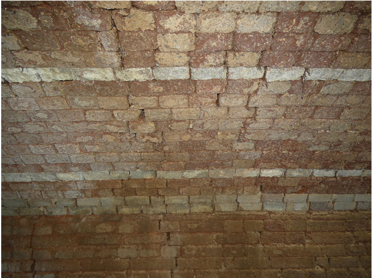
La voûte en parement de briques réfractaires du premier four.