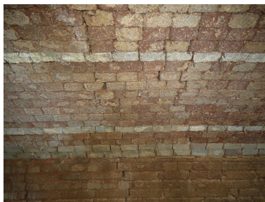
La voûte en parement de briques réfractaires du premier four.

Phot. Yannis Suire IVR52_20228500802NUCA