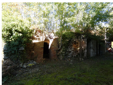
Les fours vus depuis le sud-ouest.