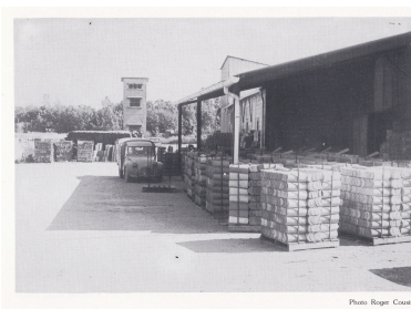
La tuilerie vers 1980.