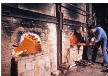
Alimentation des fours vers 1980.