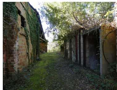
Le séchoir, à gauche, et les fours, à droite, vus depuis l'est.