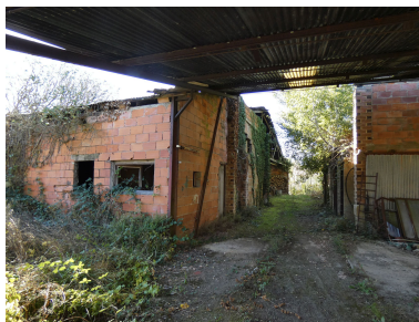
Le séchoir, à gauche, et les fours, à droite, vus depuis l'est.