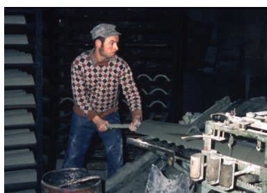
Enlèvement des tuiles en position de séchage, vers 1980.