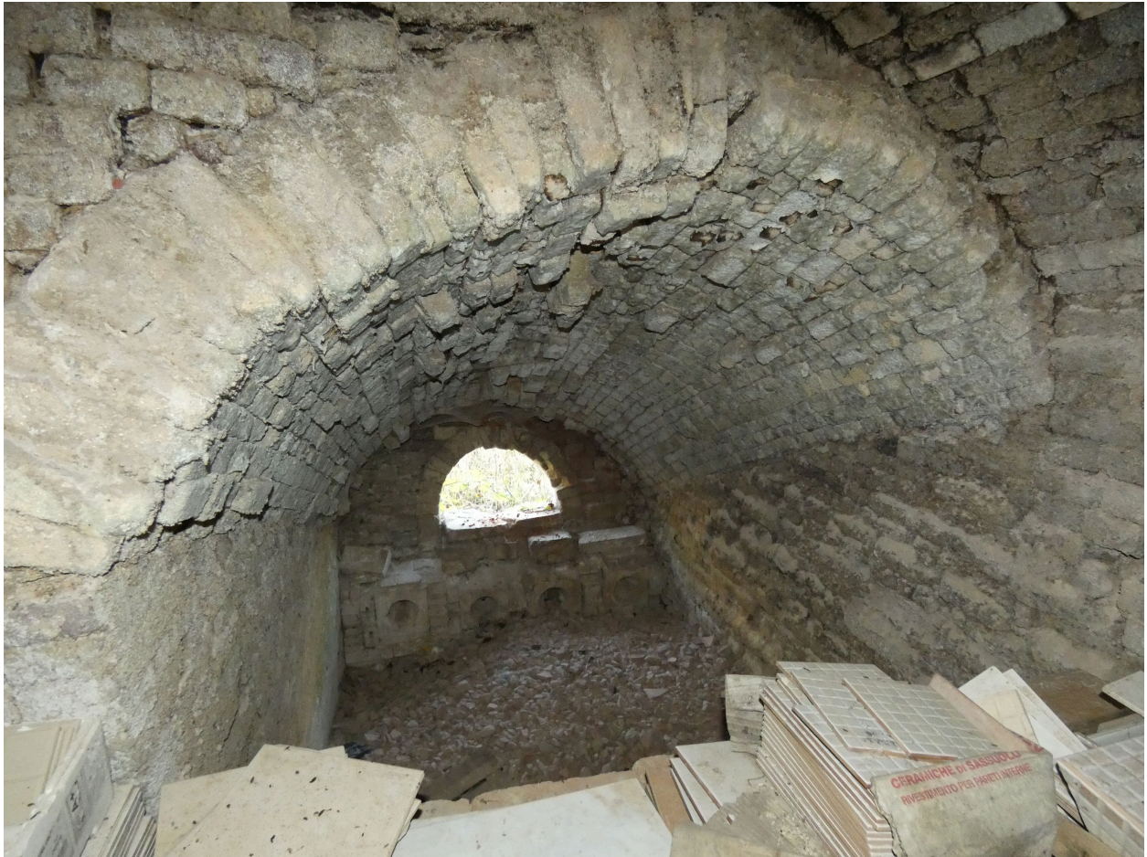
Un des deux foyers du premier four.