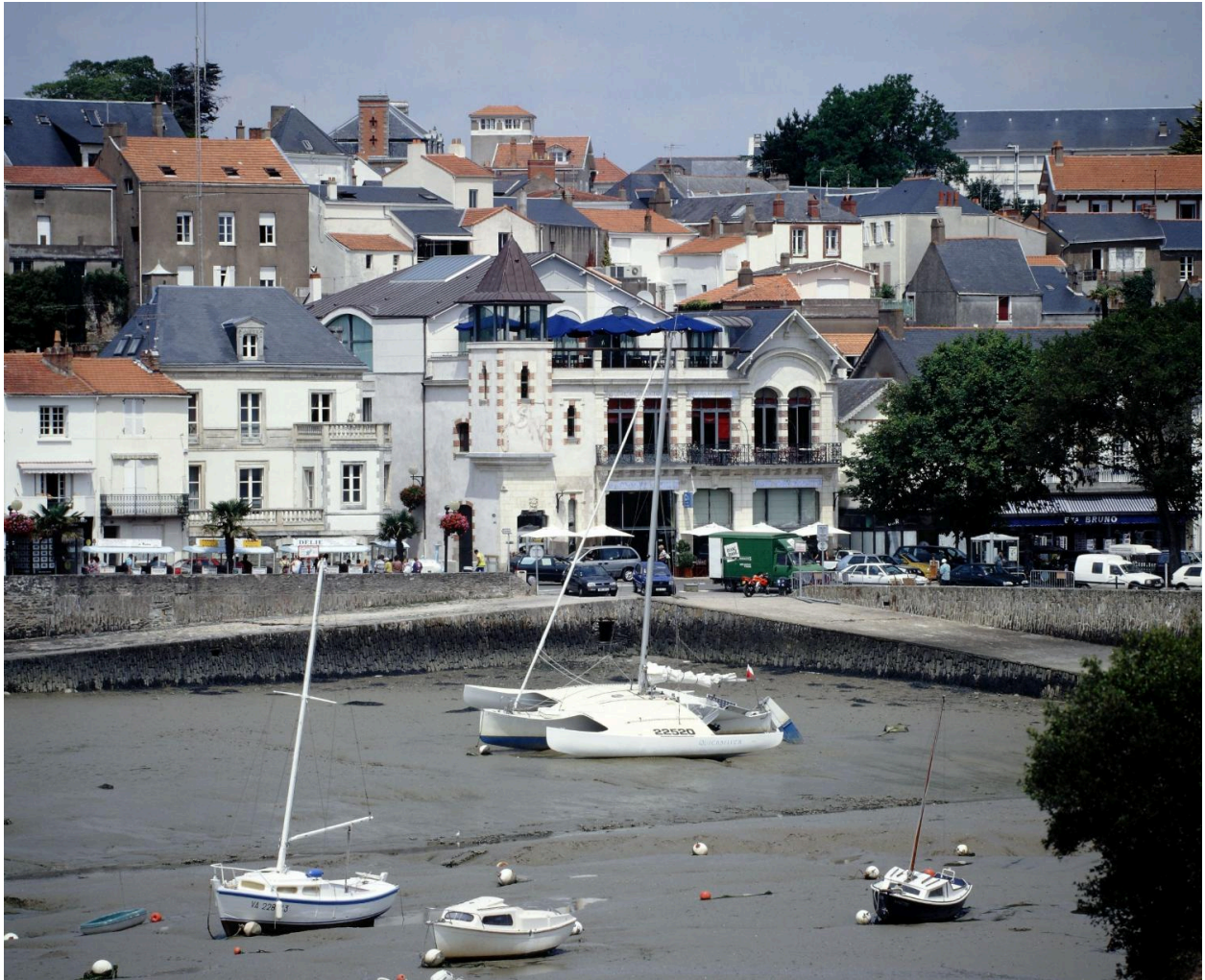
Casino du Môle, vue d'ensemble.