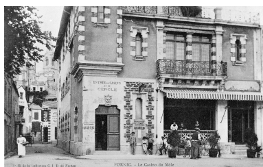
Rez-de-chaussée et premier étage du casino. IVR52_19944400434X