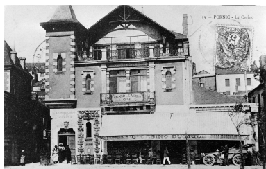
Elévation antérieure, premier état, fin 19e siècle.