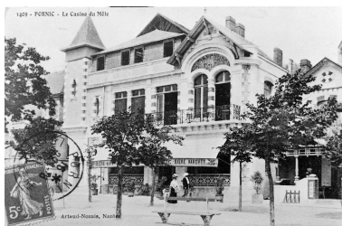
Elévation antérieure, début 20e siècle.