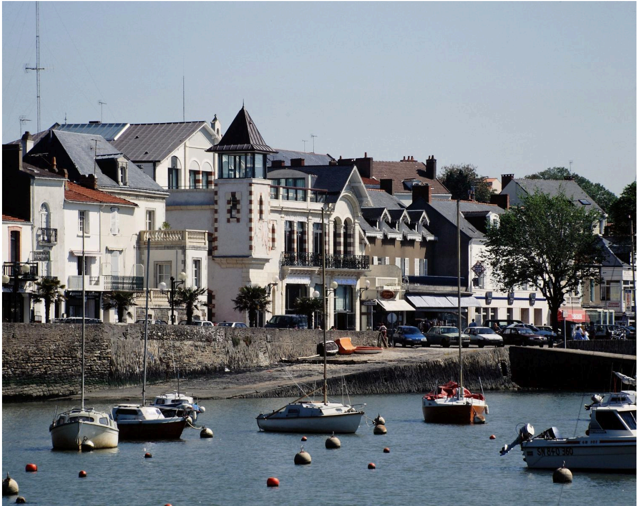
Vue d'ensemble du casino.