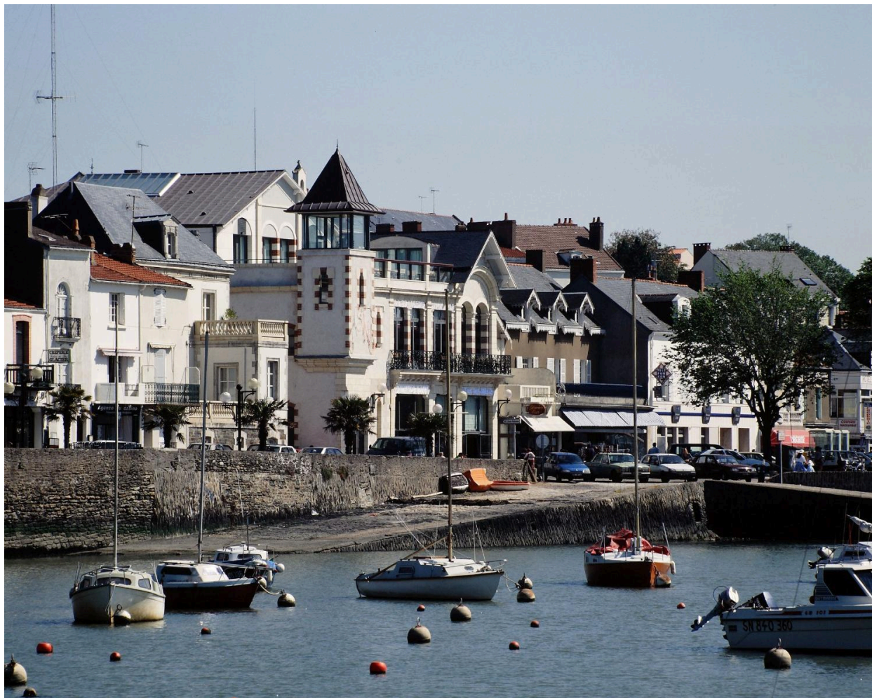
Vue d'ensemble du casino.