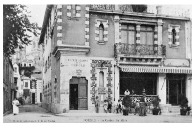
Rez-de-chaussée et premier étage du casino. IVR52_19944400434X