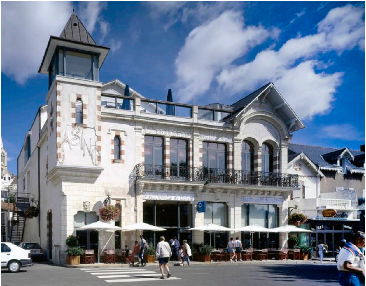
Elévation antérieure, fin 20e siècle.