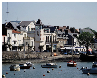
Vue d'ensemble du casino. IVR52_19944400586XA