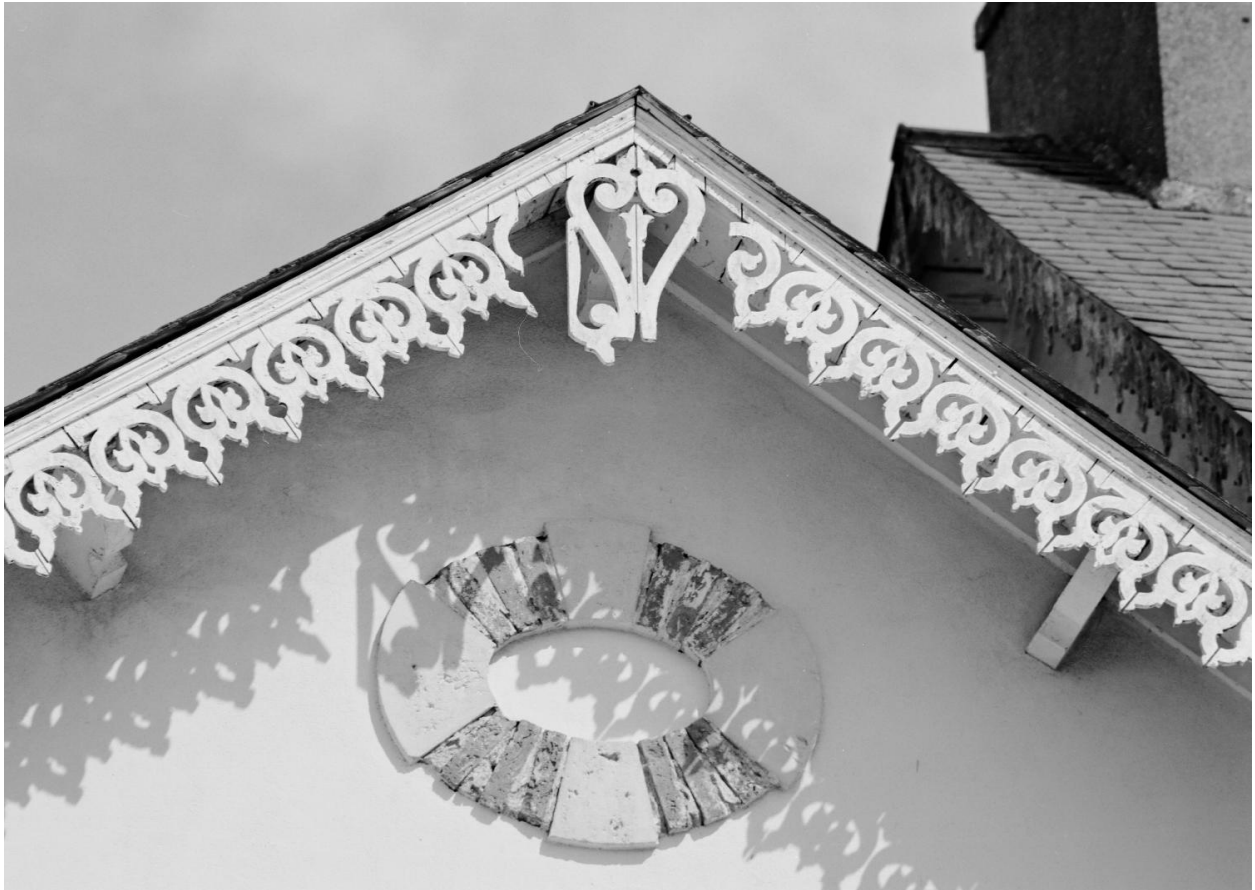
Oculus aveugle et lambrequins de toit.