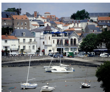
Casino du Môle, vue d'ensemble. IVR52_19974402449XA