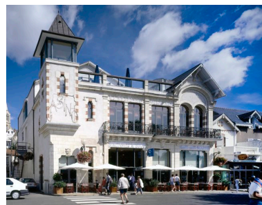
Elévation antérieure, fin 20e siècle.