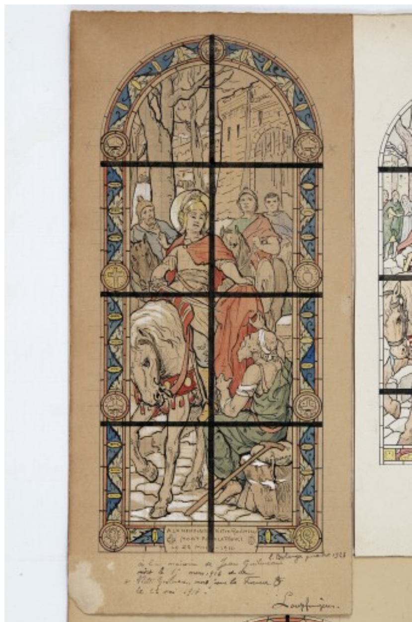
Maquette de la verrière 9 : Charité de saint Martin.