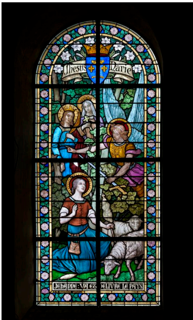
Verrière 10 : sainte Jeanne d'Arc entendant les voix.