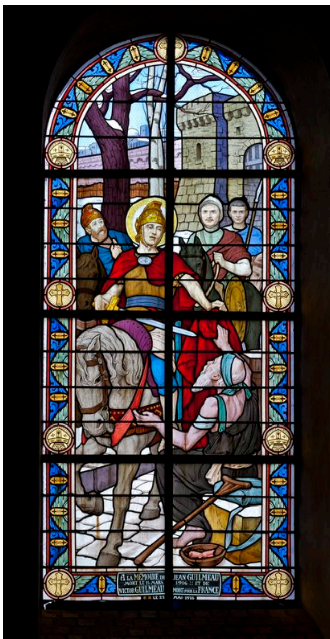
Verrière 9 : Charité de saint Martin.