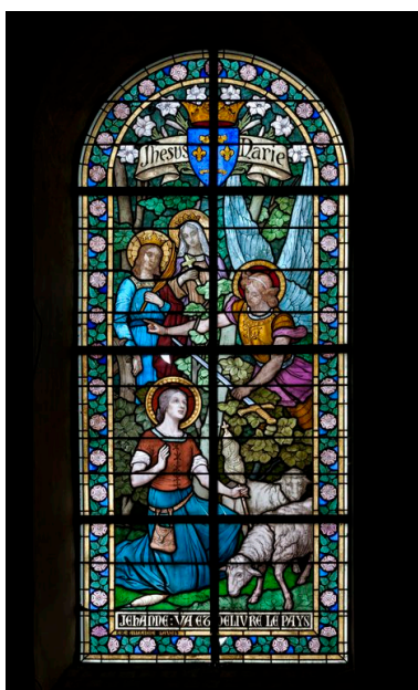
Verrière 10 : sainte Jeanne d'Arc entendant les voix.