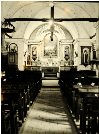
Intérieur de l'église de Thuboeuf, début du XXe siècle. IVR52_20205300532NUCA