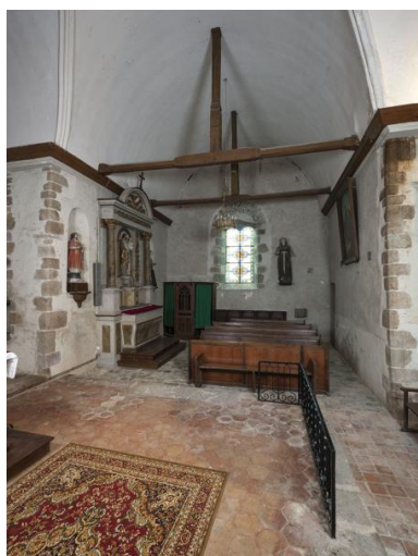
Bras sud du transept. IVR52_20185300103NUCA