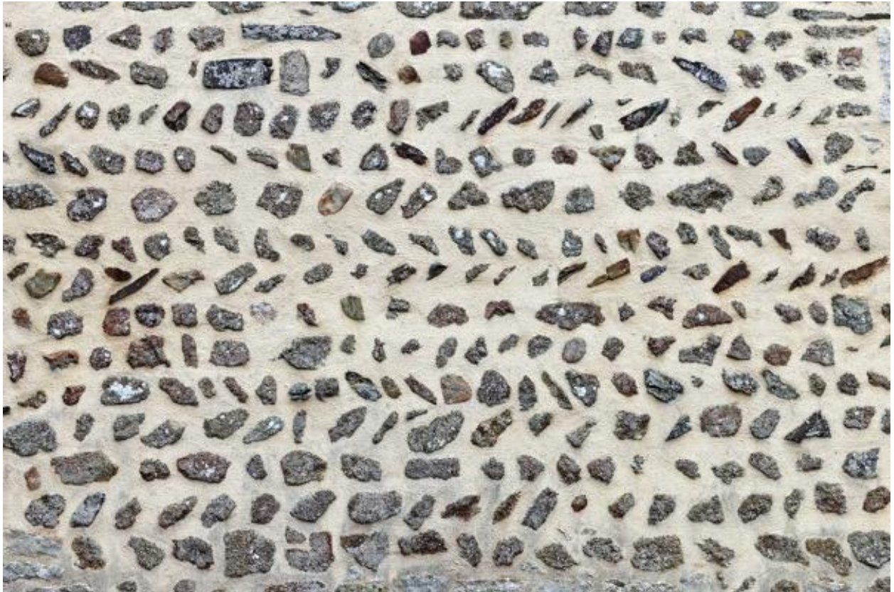
Maçonnerie en opus spicatum du bas-côté sud.