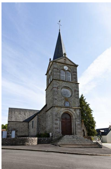
Façade occidentale de l'église Saint-Martin de Thuboeuf. IVR52_20205300243NUCA