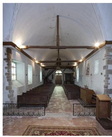
Nef. IVR52_20185300104NUCA