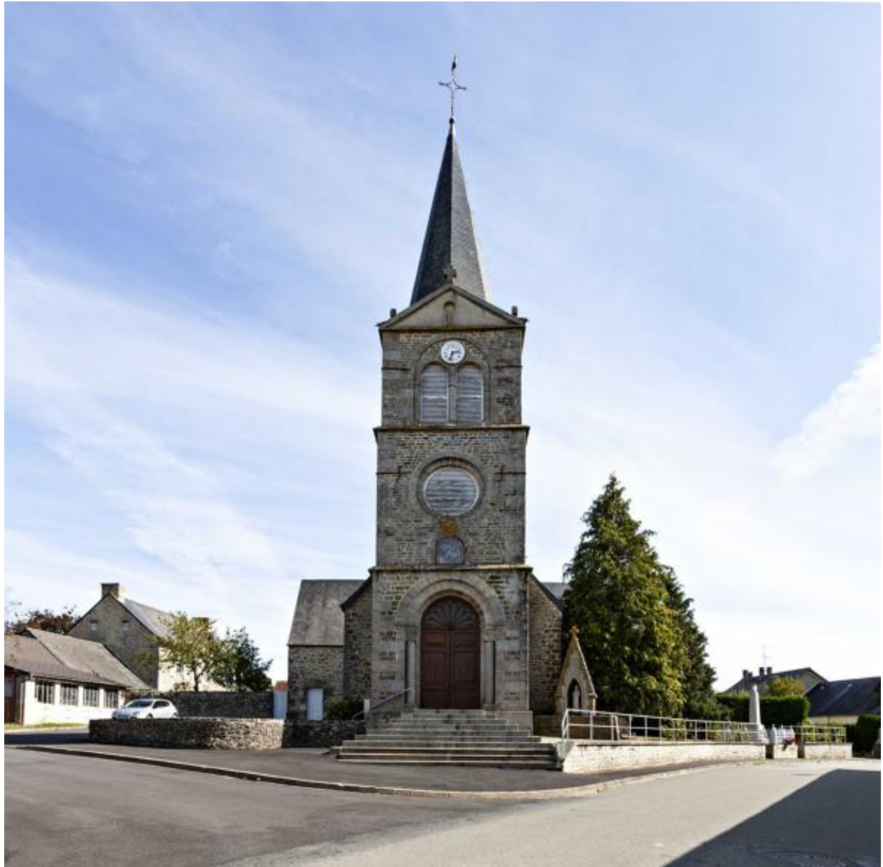
Clocher-porche de l'église Saint-Martin de Thuboeuf