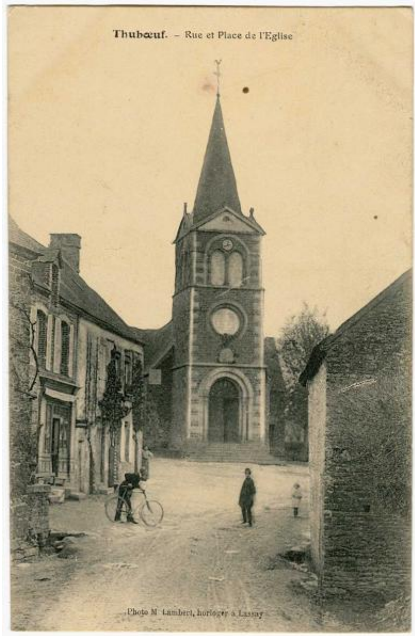
Carte postale du bourg et de l'église de Thubœuf.