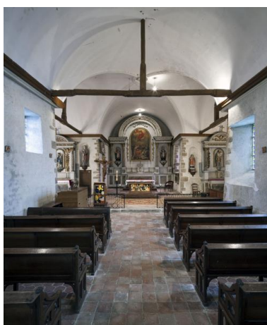
Nef et chœur. IVR52_20185300101NUCA