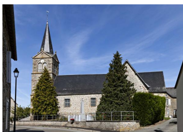
Bas-côté sud de l'église Saint-Martin de Thuboeuf.