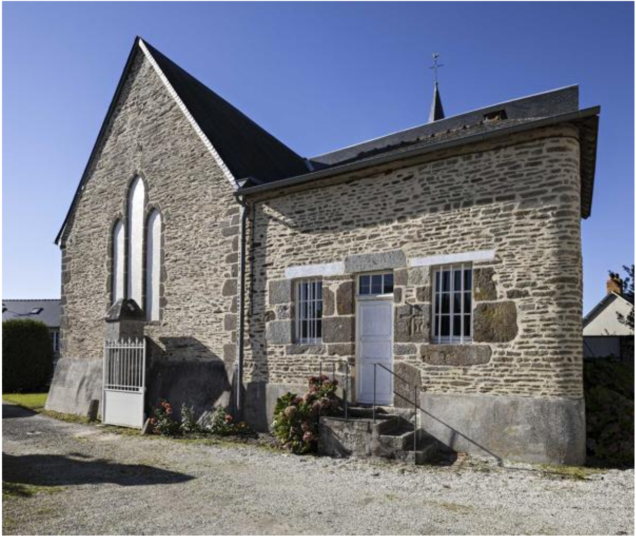
Chevet et sacristie.