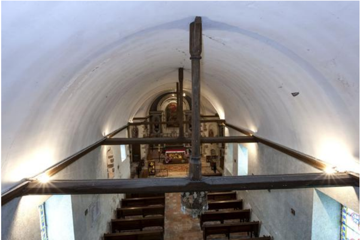
Charpente de la nef, vue depuis le premier étage de la tour clocher.