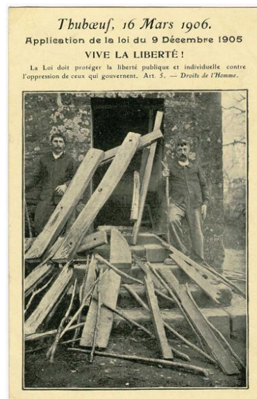
Carte postale, l'inventaire montrant l'ouverture de l'église de Thuboeuf lors de l'inventaire de 1906.