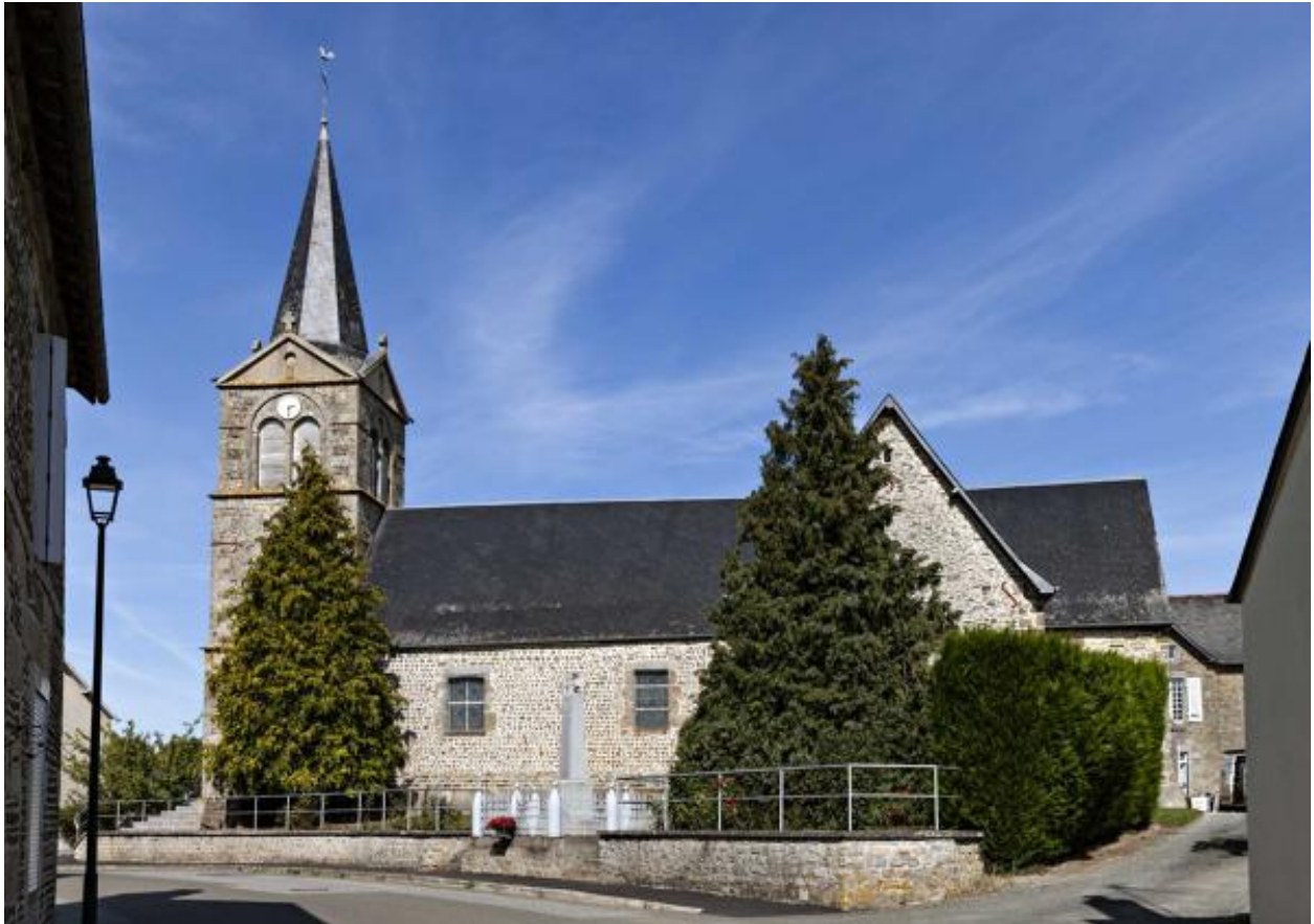
Bas-côté sud de l'église Saint-Martin de Thubœuf.