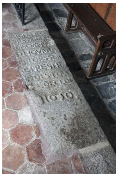
Pierre tombale.