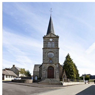
Clocher-porche de l'église Saint-Martin de Thuboeuf IVR52_20205300242NUCA