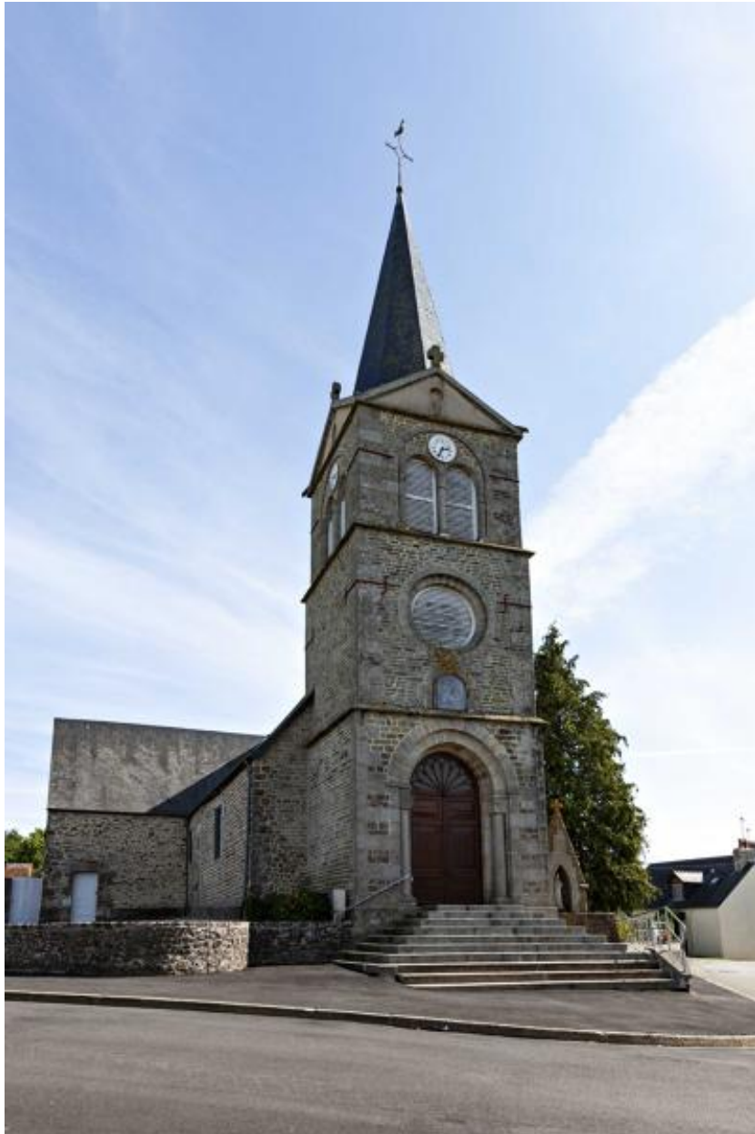
Façade occidentale de l'église Saint-Martin de Thubœuf.