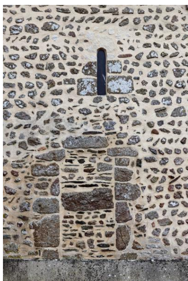
Baie romane du bas-côté sud de l'église Saint-Martin de Thuboeuf.