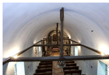
Charpente de la nef, vue depuis le premier étage de la tour clocher. IVR52_20185300157NUCA