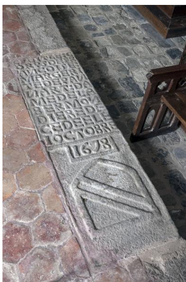
Pierre tombale. IVR52_20185300136NUCA