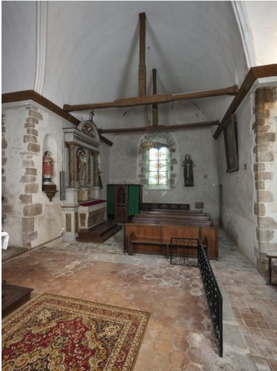
Bras sud du transept.