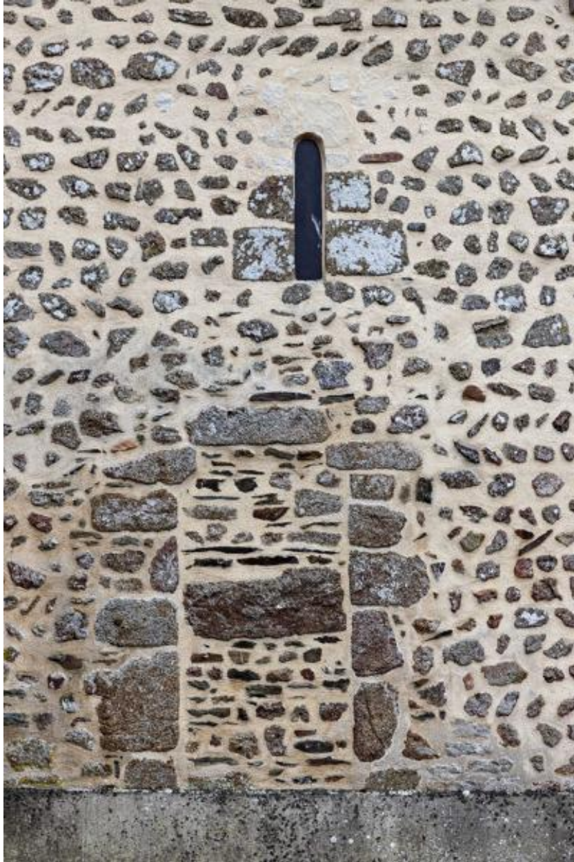
Baie romane du bas-côté sud de l'église Saint-Martin de Thuboeuf.