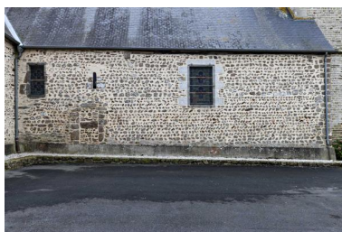
Bas-côté nord de l'église Saint-Martin de Thuboeuf.