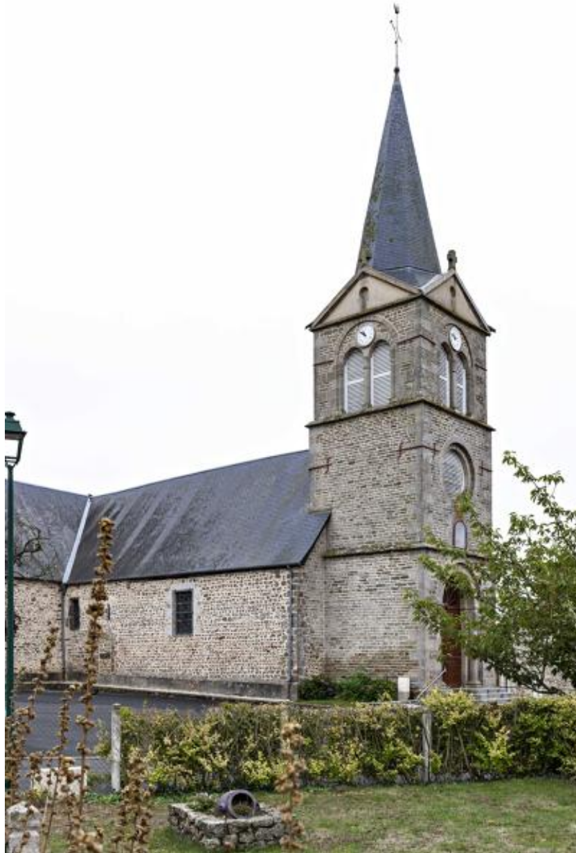
Eglise Saint-Martin de Thuboeuf, vue générale.