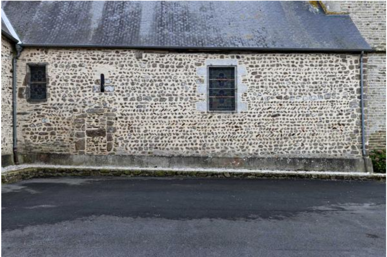
Bas-côté nord de l'église Saint-Martin de Thuboeuf.