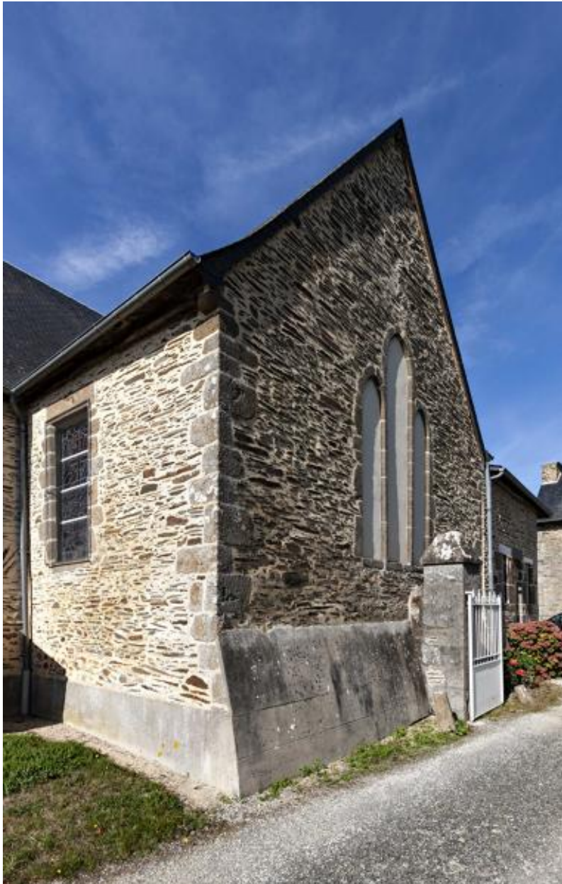
Transept, bras sud.