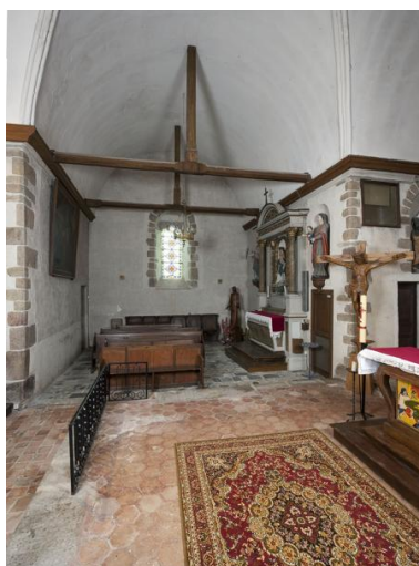
Bras nord du transept.