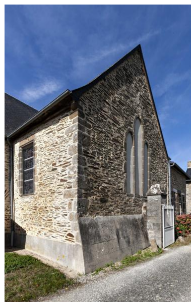
Transept, bras sud.