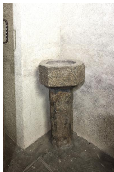
Bénitier colonne. IVR52_20185300119NUCA