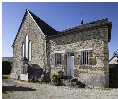
Chevet et sacristie. IVR52_20215301815NUCA