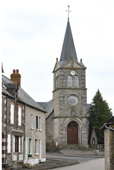
Tout-clocher. IVR52_20225300046NUCA