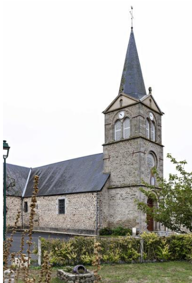
Eglise Saint-Martin de Thuboeuf, vue générale. IVR52_20205300259NUCA