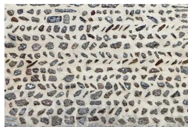
Maçonnerie en opus spicatum du bas-côté sud.