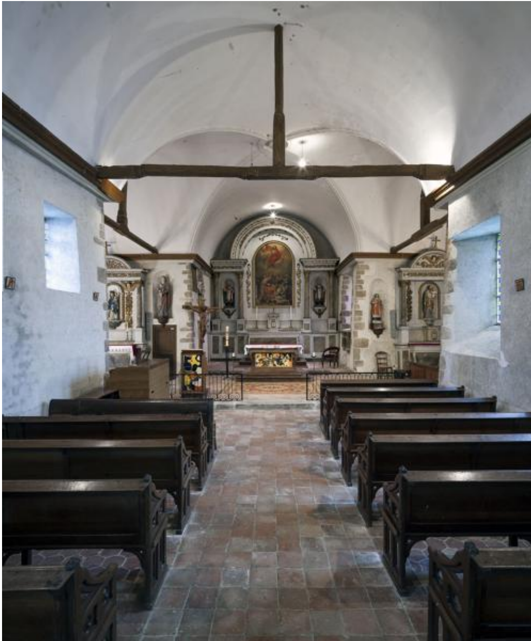
Nef et chœur.