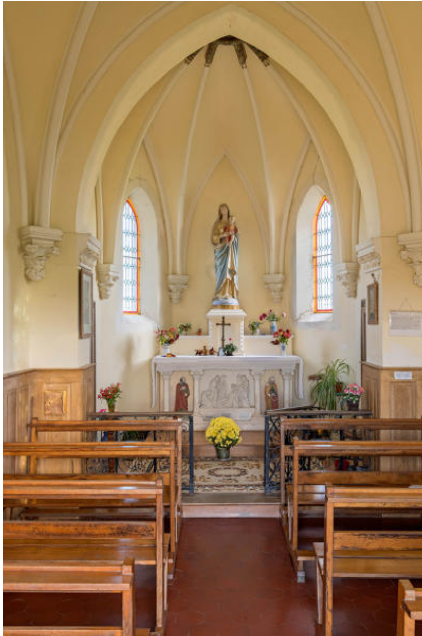
Vue intérieure de la chapelle.