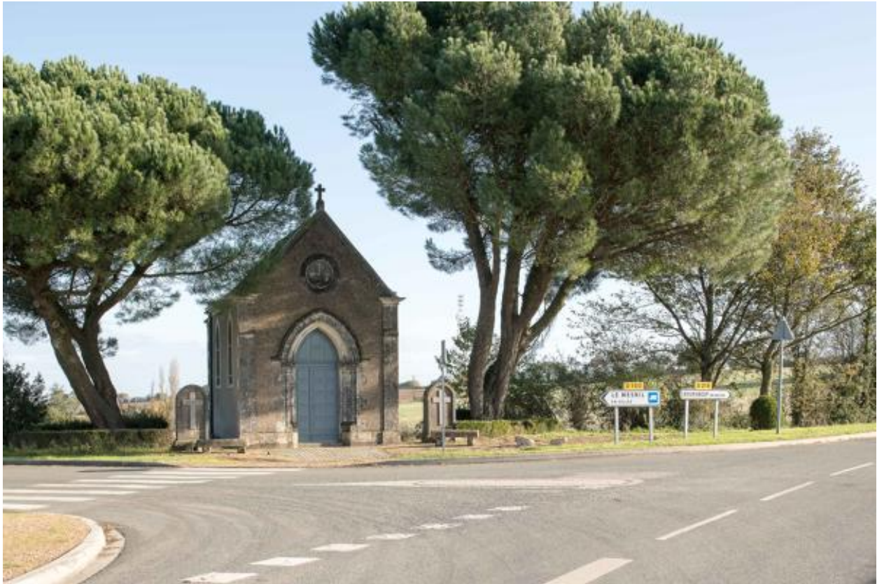
Vue générale de la chapelle de la Croix-Malo à Beausse.