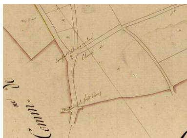
La Croix-Malo. Extrait du plan cadastral de 1827, section A2. (AD Maine-et-Loire ; 3 P 4 / 24 / 3). IVR52_20244900006NUCA