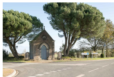
Vue générale de la chapelle de la Croix-Malo à Beausse. IVR52_20194900846NUCA