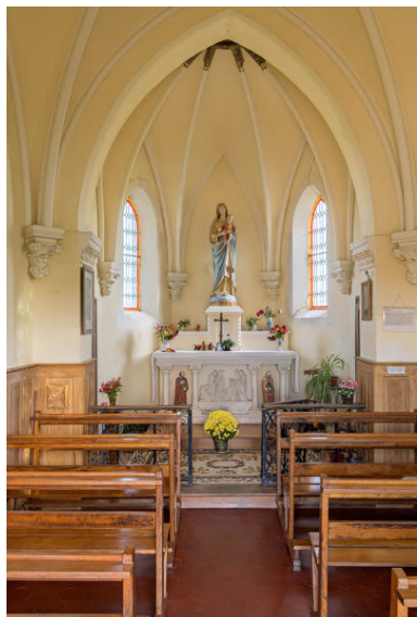
Vue intérieure de la chapelle.