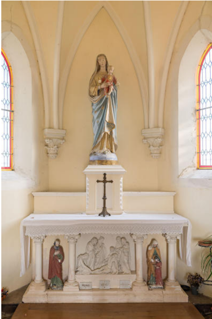
Vue intérieure : autel.