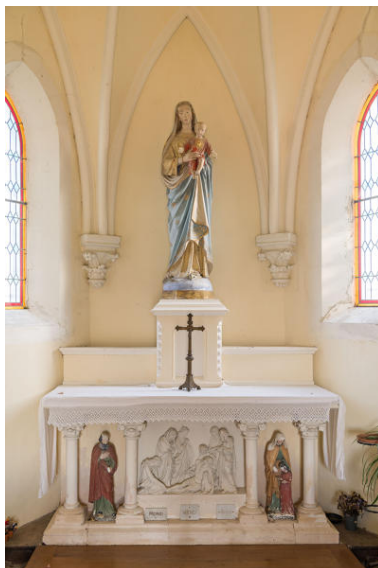
Vue intérieure : autel. IVR52_20194900849NUCA