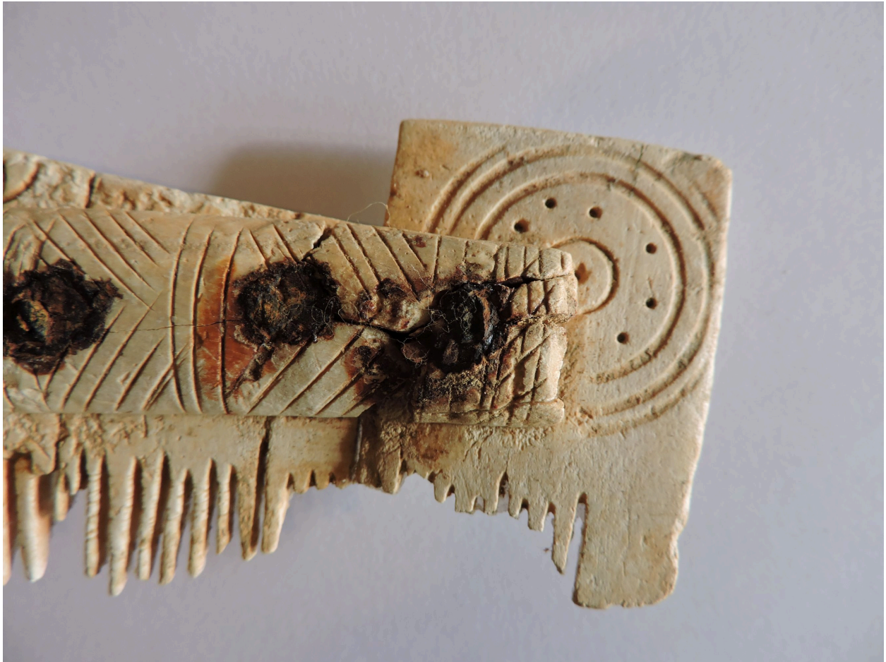
La poignée droite et son décor.