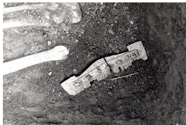
Le peigne mis au jour dans la sépulture n° 20.