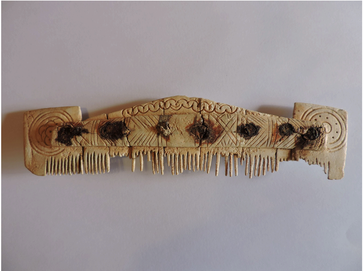
Vue d'ensemble du peigne.