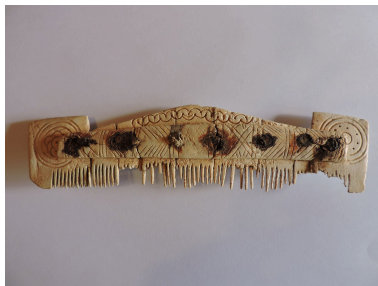
Vue d'ensemble du peigne.