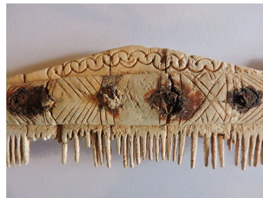
Détail de la partie centrale.