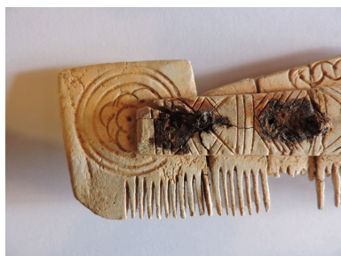
La poignée gauche et son décor.