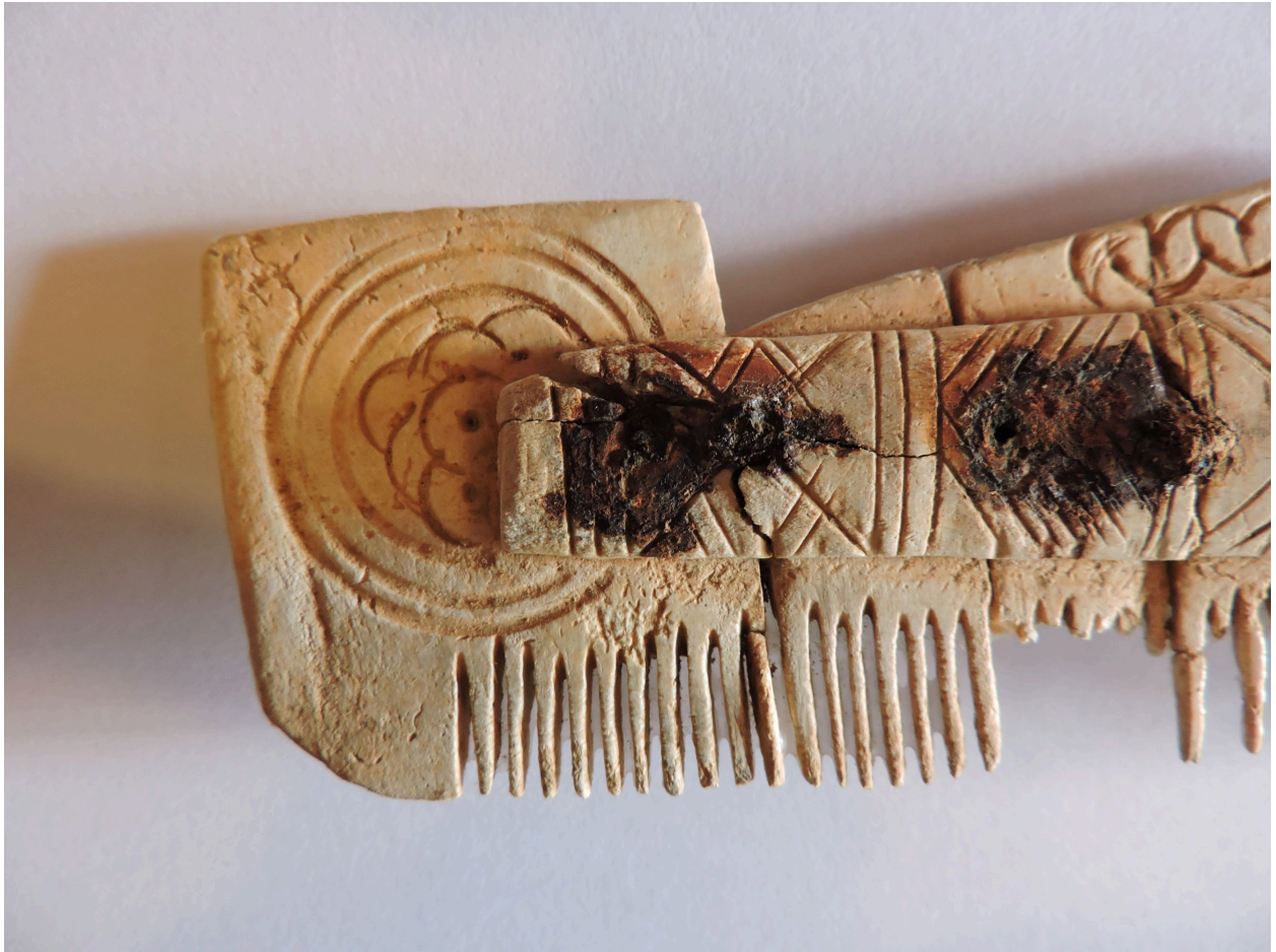
La poignée gauche et son décor.