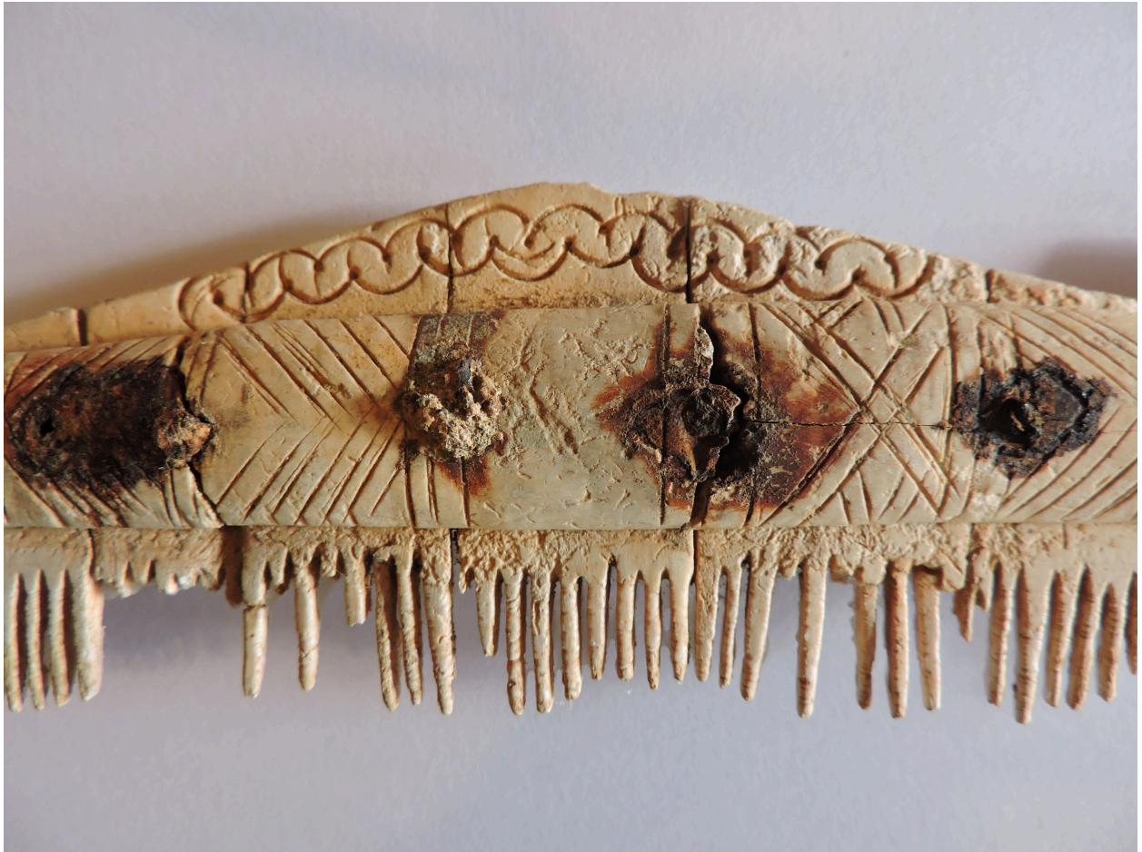
Détail de la partie centrale.