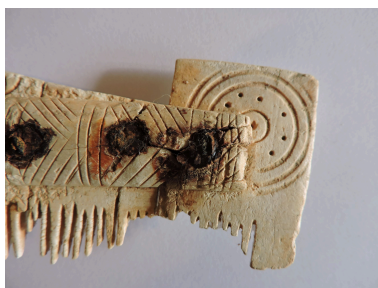
La poignée droite et son décor. IVR52_20218501365NUCA