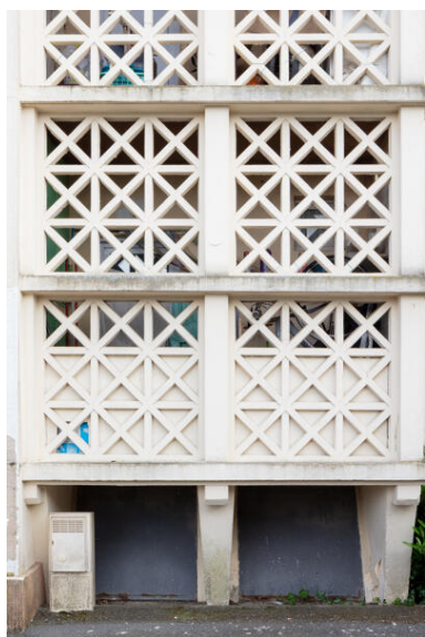
Détail du béton moucharabieh formant claustra des buanderies sur la façade principale du bâtiment A.