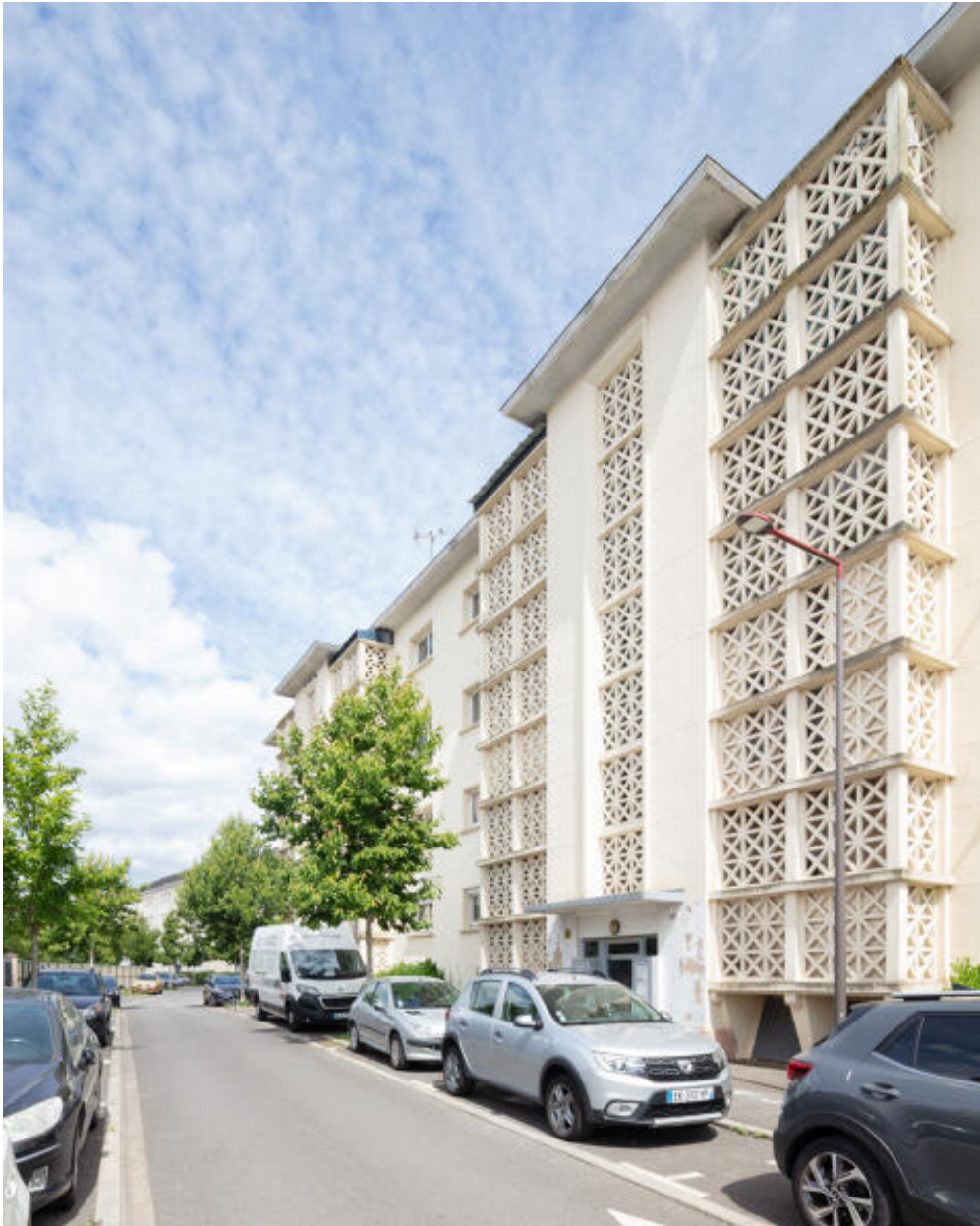
Vue de la façade principale du bâtiment A.