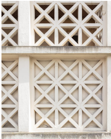
Détail du béton moucharabieh de la travée centrale du bâtiment A. IVR52_20227200609NUCA