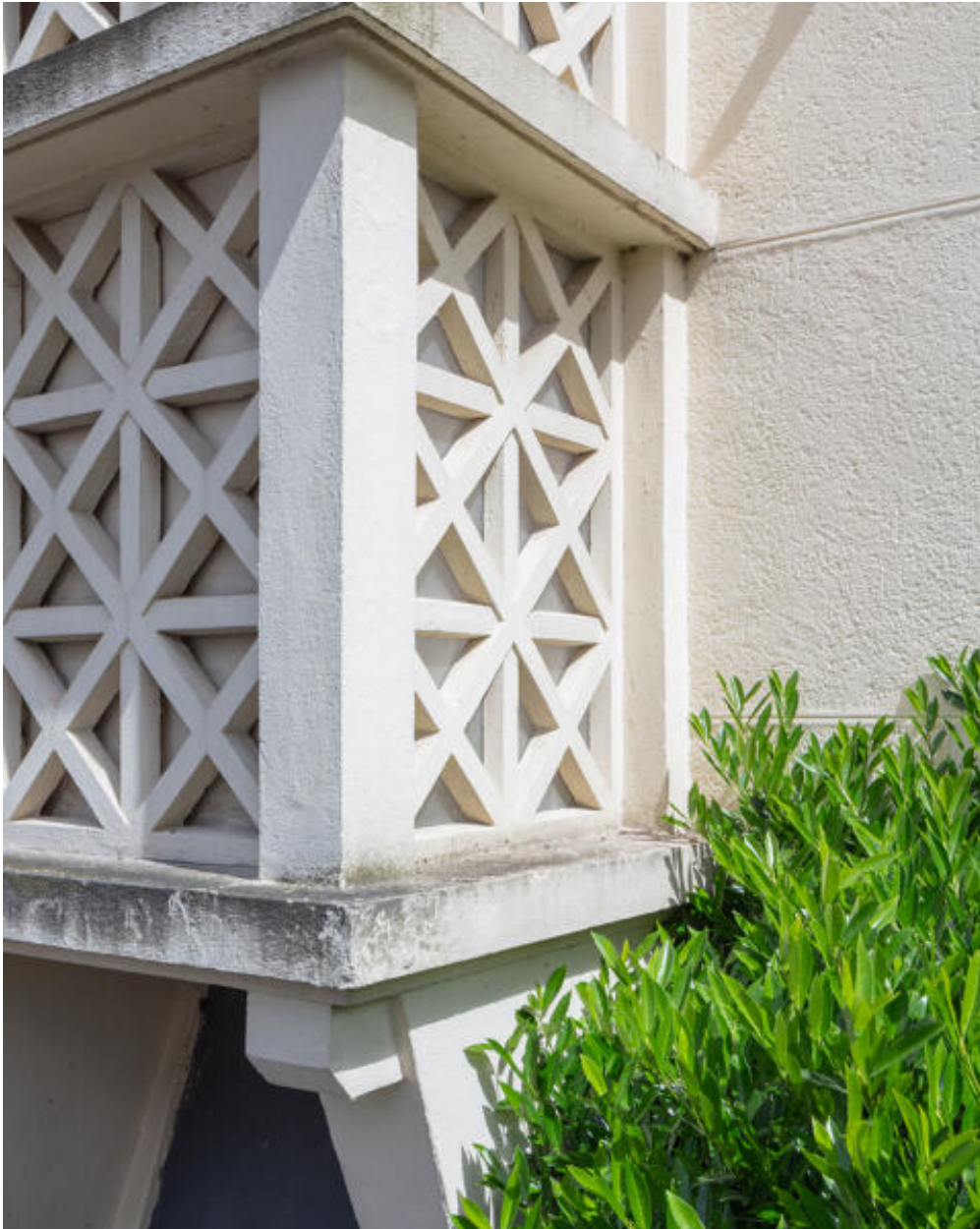
Détail de l'avant-corps en béton moucharabieh sur la façade principale.