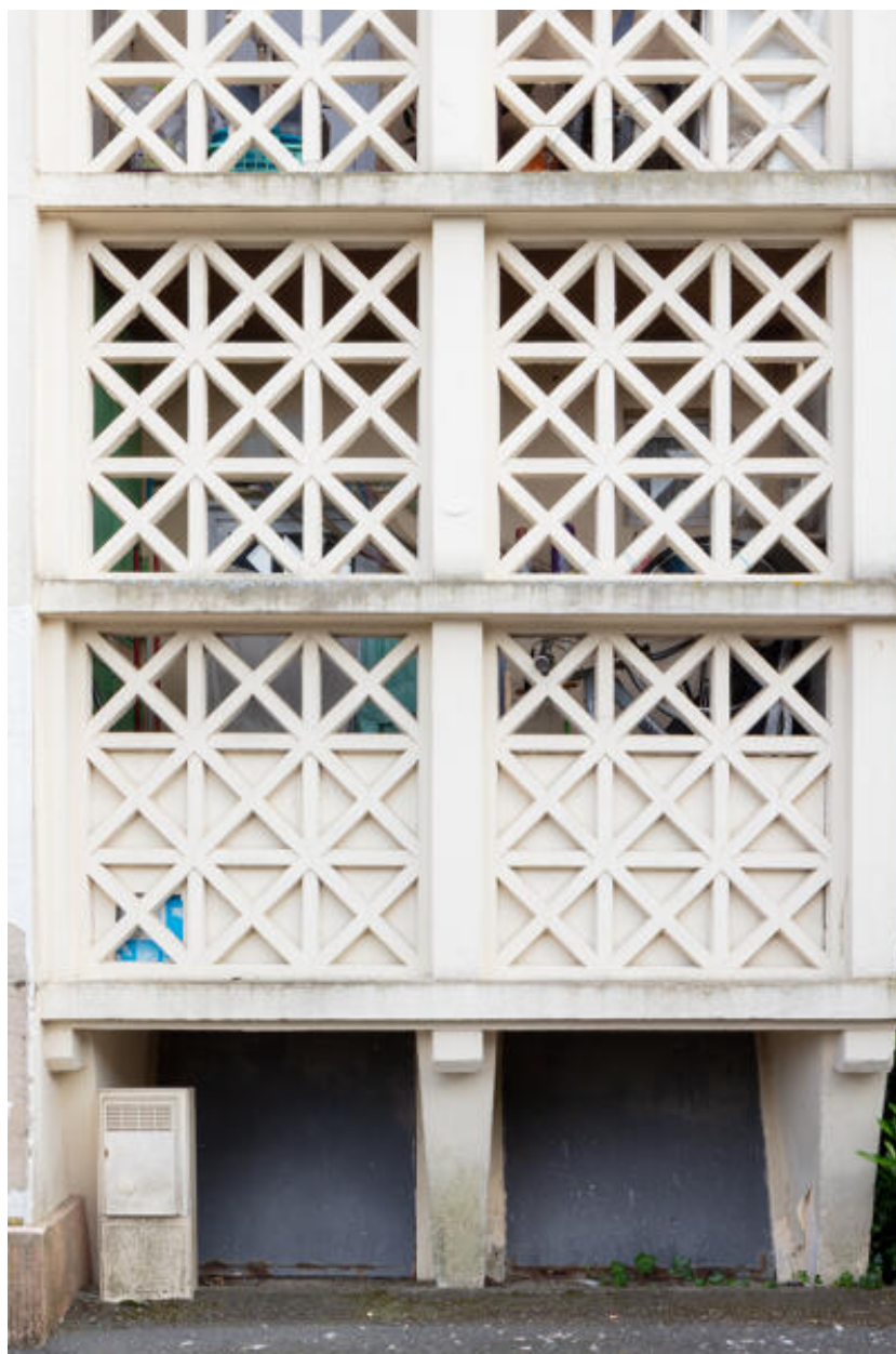
Détail du béton moucharabieh formant claustra des buanderies sur la façade principale du bâtiment A.