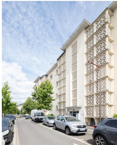
Vue de la façade principale du bâtiment A. IVR52_20227200607NUCA