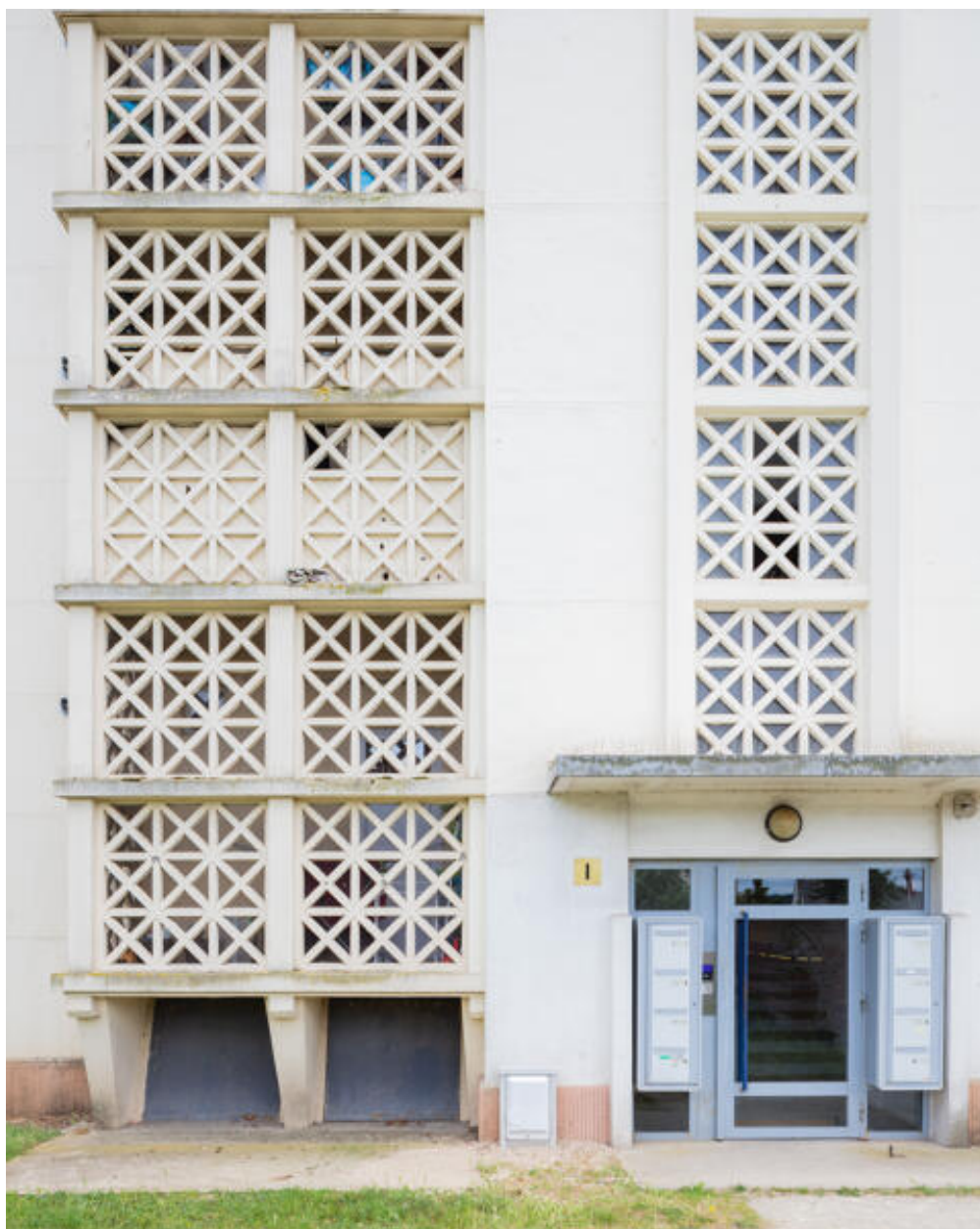
Détail du béton moucharabieh sur la travée centrale du bâtiment A.