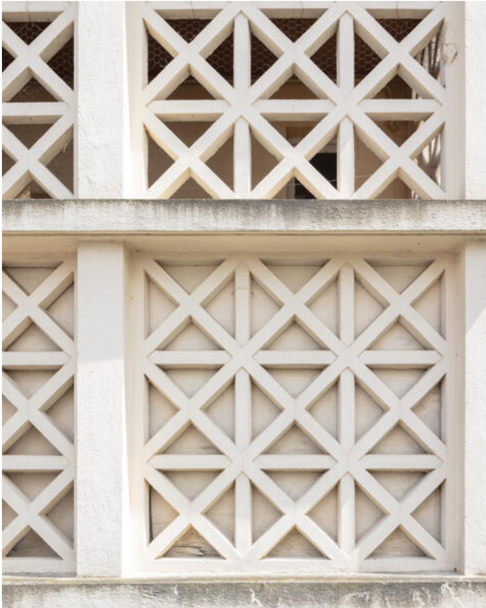
Détail du béton moucharabieh de la travée centrale du bâtiment A.