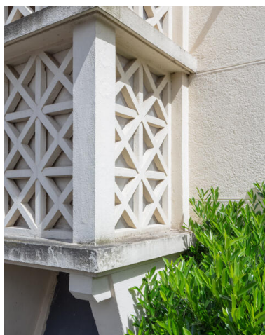
Détail de l'avant-corps en béton moucharabieh sur la façade principale. IVR52_20227200610NUCA