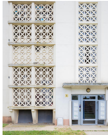
Détail du béton moucharabieh sur la travée centrale du bâtiment A. IVR52_20227200599NUCA