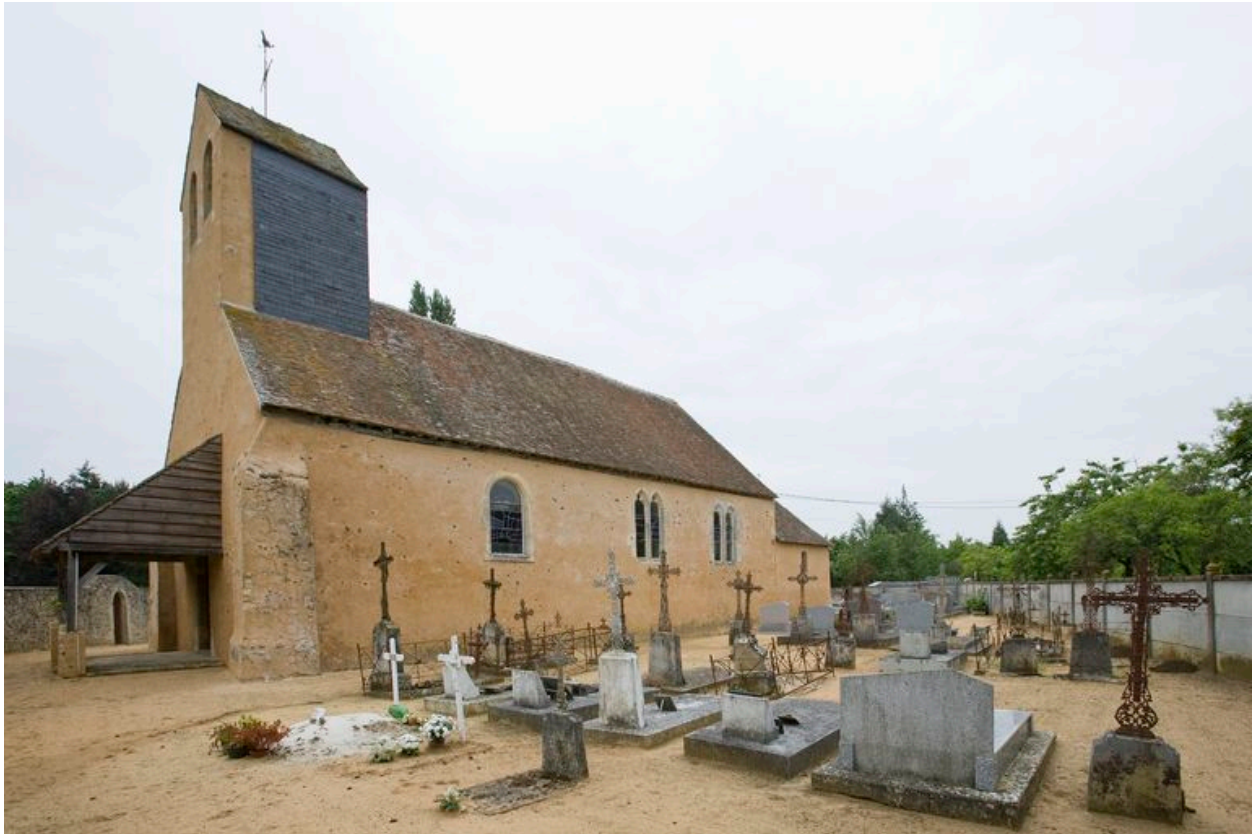
Vue générale depuis le sud.