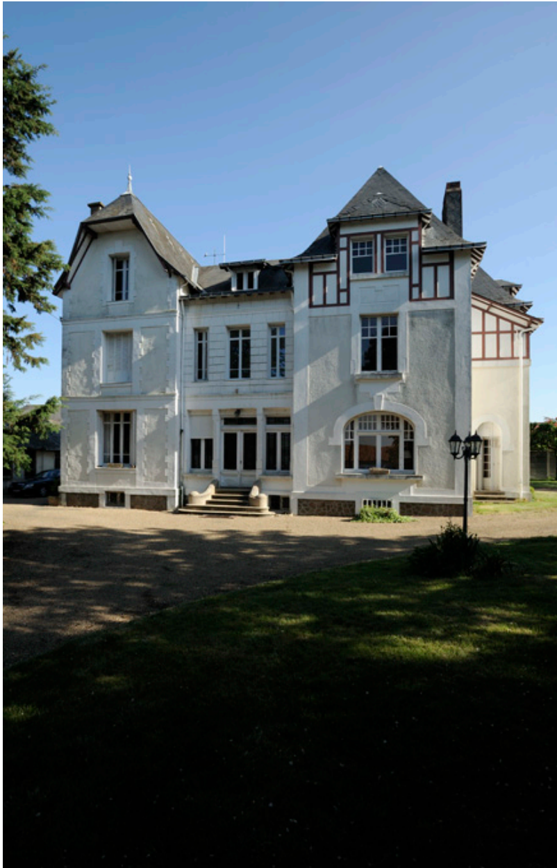
Vue générale de la maison de Louis Pasquier, depuis le sud.