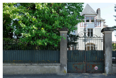
Maison de Louis Pasquier vue depuis la rue Pasteur.