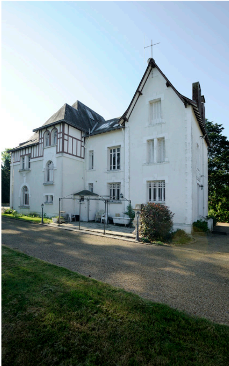
Maison de Louis Pasquier : façade nord.