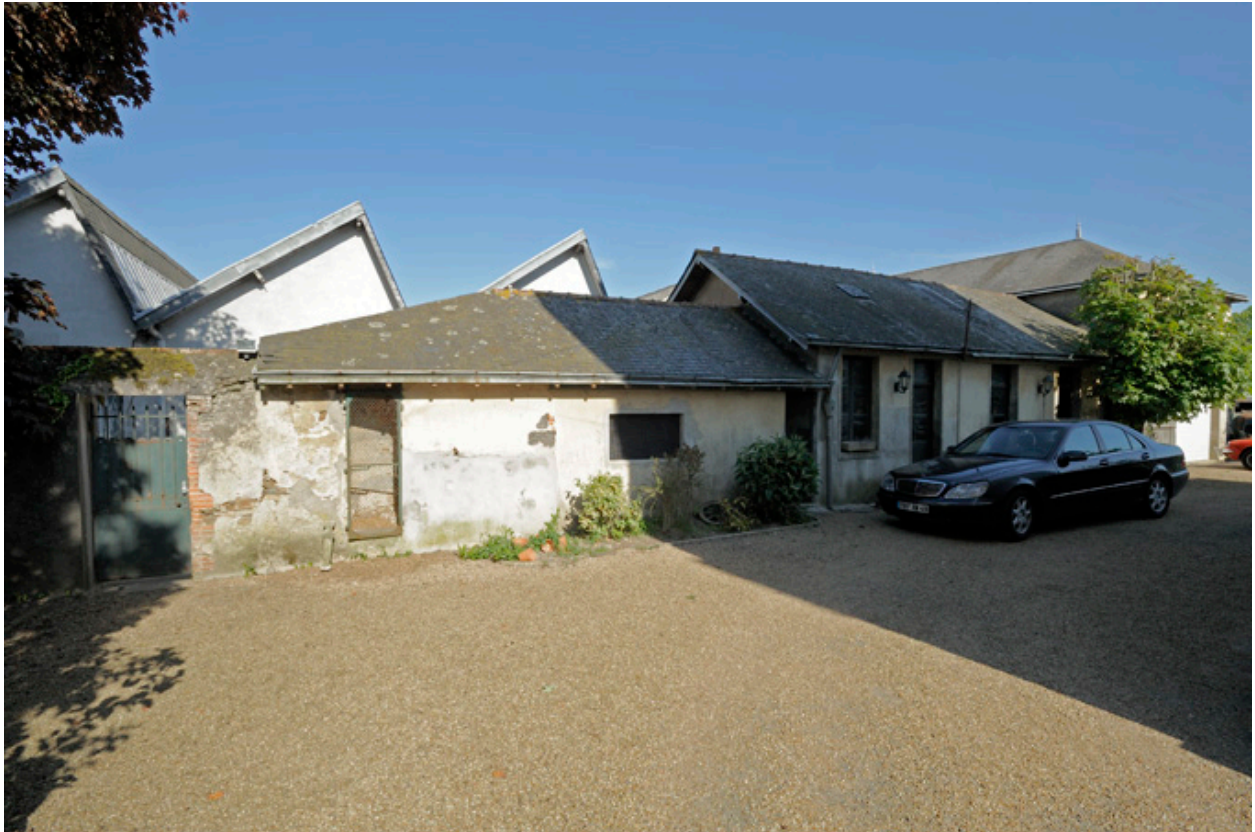
Maison de Louis Pasquier : dépendances et accès à l'usine Pasquier.