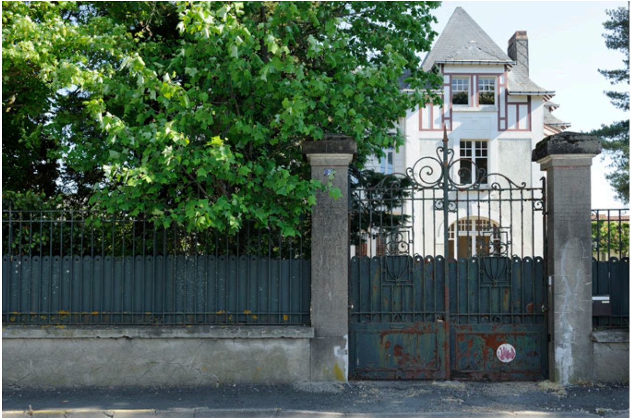
Maison de Louis Pasquier vue depuis la rue Pasteur.