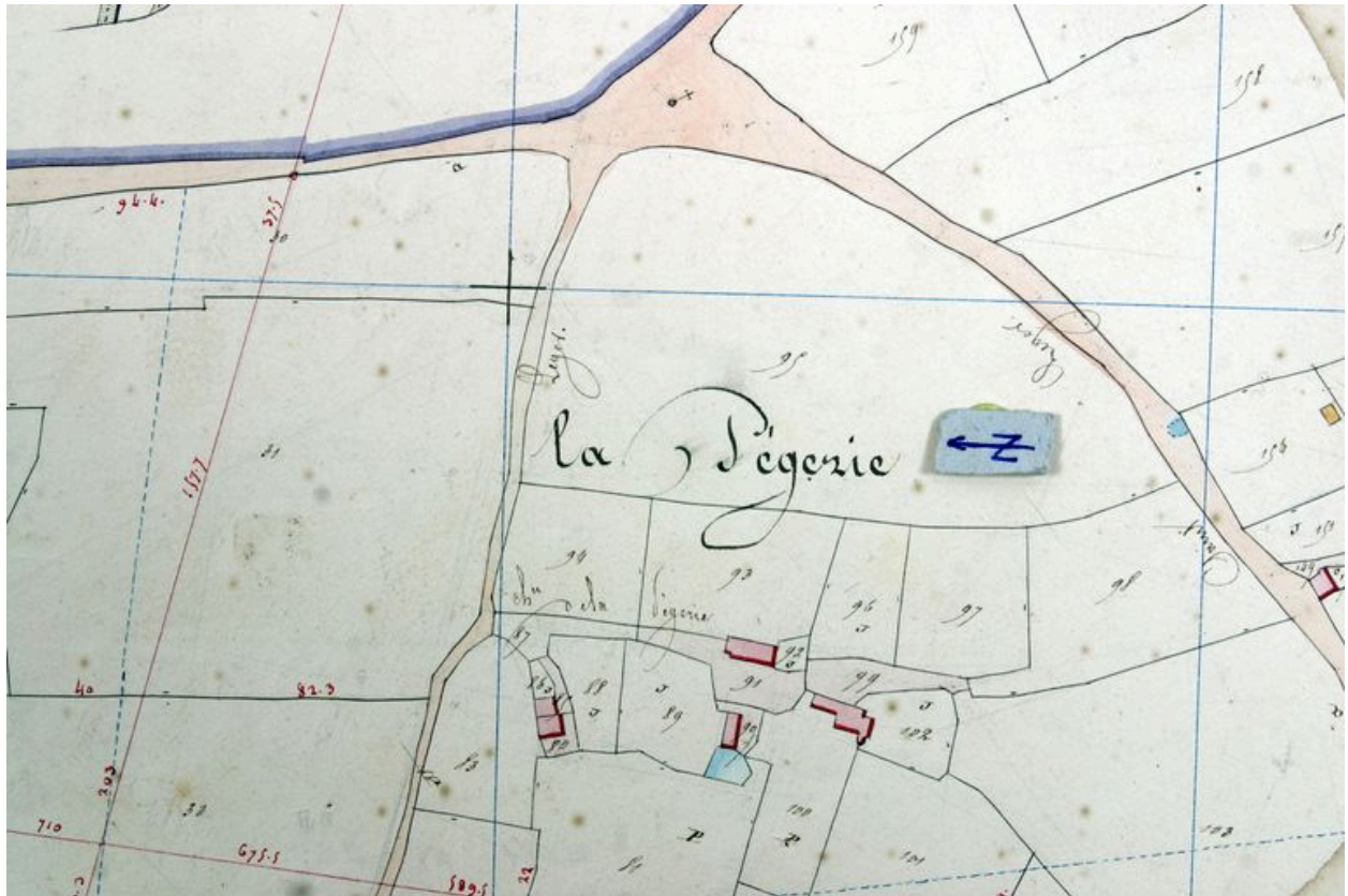
Extrait du plan cadastral de 1842, section C1.