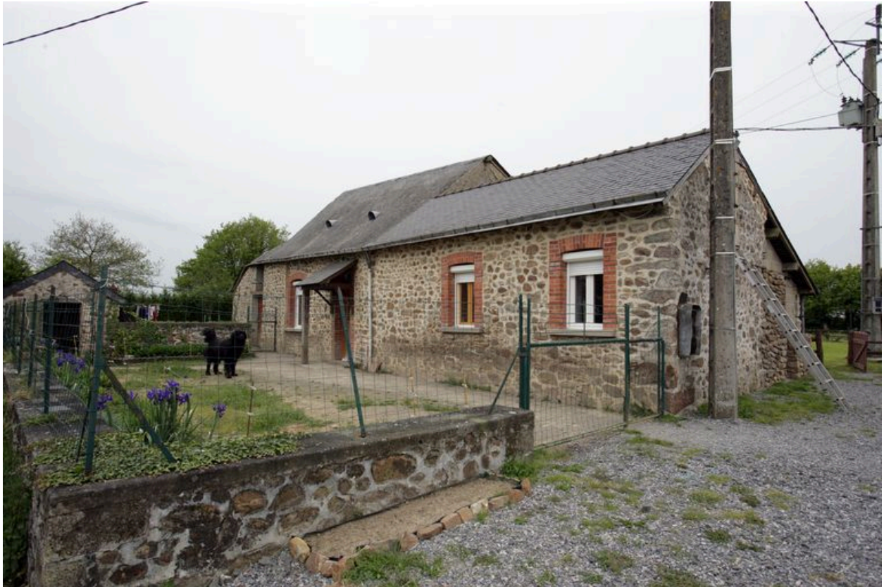
L'ancien logis-étable et le bûcher vus depuis le nord-est.