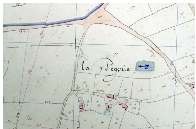
Extrait du plan cadastral de 1842, section C1.