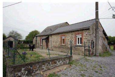
L'ancien logis-étable et le bûcher vus depuis le nord-est.