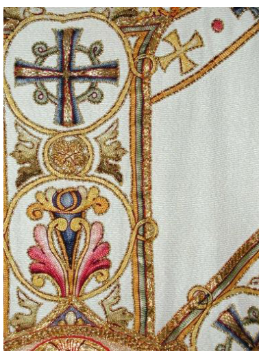
Détail de la broderie. IVR52_20064401636NUCA