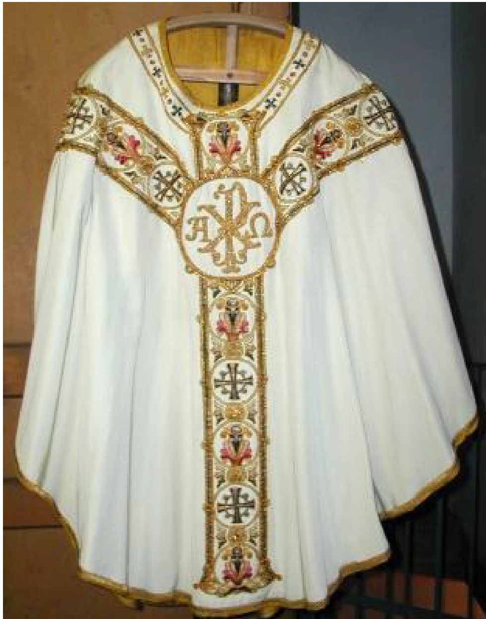
Vue générale, devant de la chasuble.