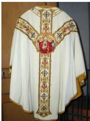
Vue générale, dos de la chasuble. IVR52_20064401633NUCA