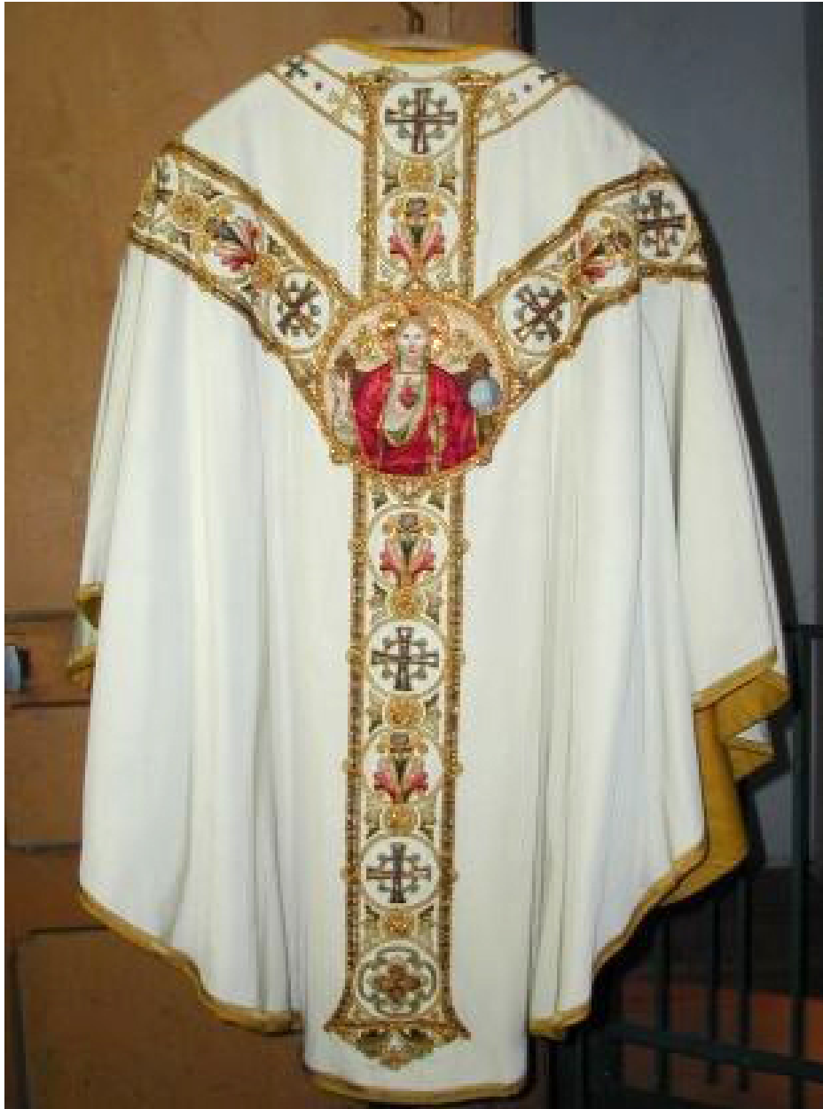
Vue générale, dos de la chasuble.