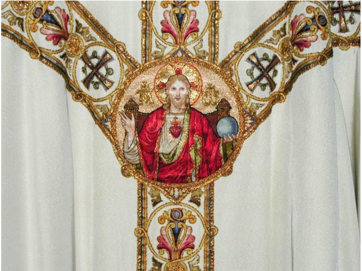
Détail du dos de la chasuble.