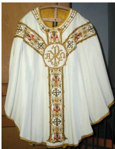
Vue générale, devant de la chasuble. IVR52_20064401632NUCA