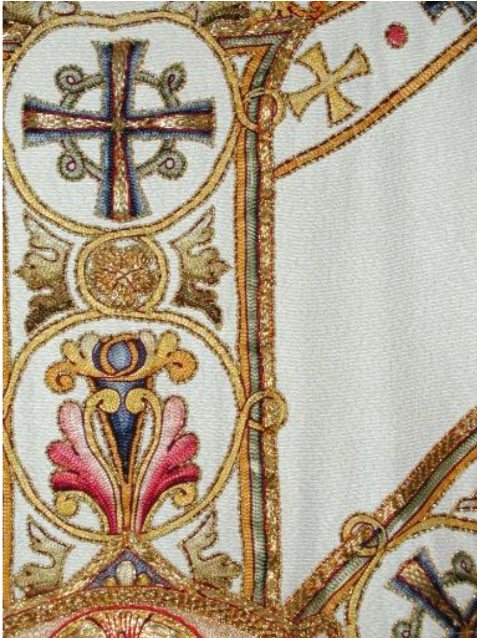
Détail de la broderie.