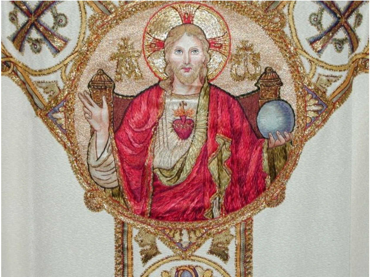
Détail du dos de la chasuble, motif.