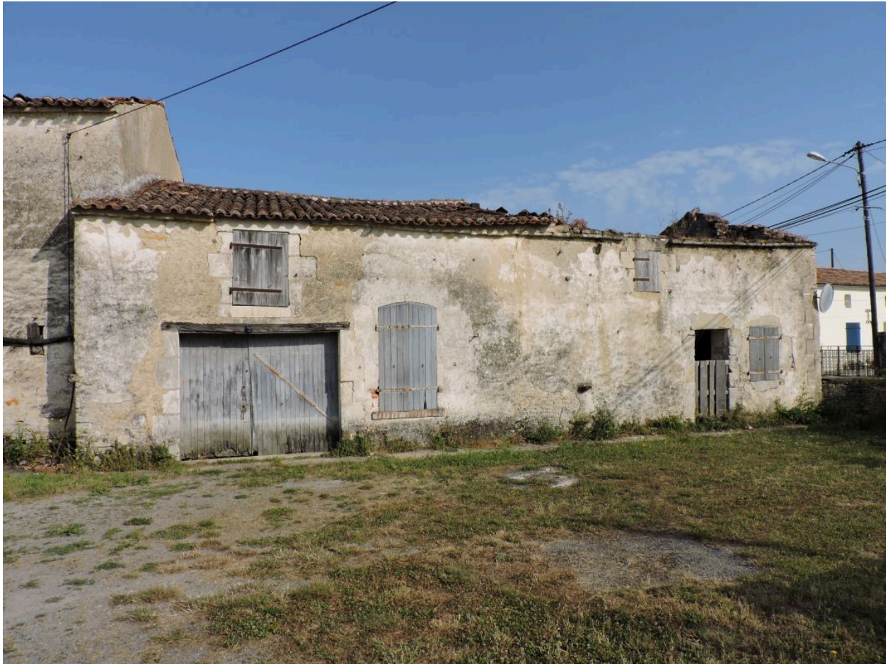
Le logis vu depuis le sud.