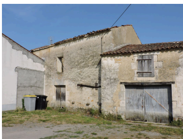
Dépendances dans le prolongement du logis.