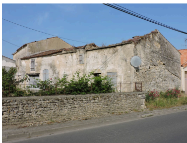
Le logis vu depuis l'est. IVR52_20198502482NUCA