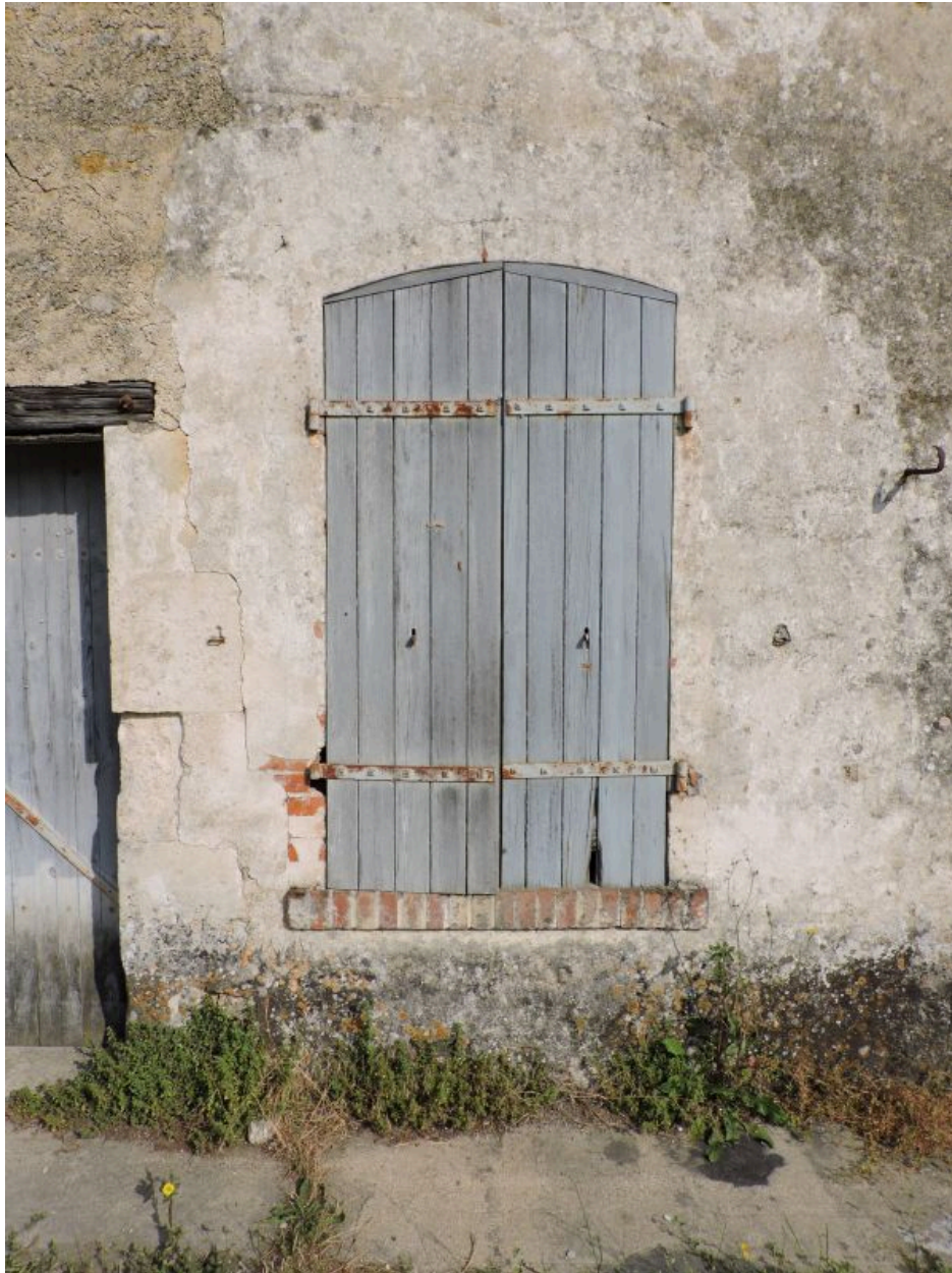
Une des ouvertures, avec linteau en arc segmentaire.