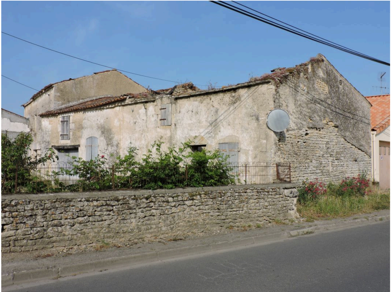
Le logis vu depuis l'est.