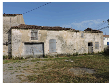
Le logis vu depuis le sud.