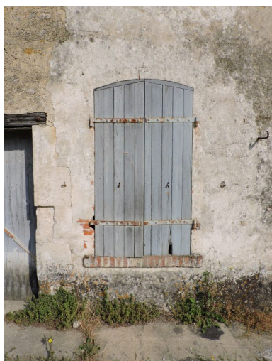
Une des ouvertures, avec linteau en arc segmentaire.