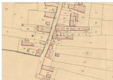
La parcelle 51, au centre, sur le plan cadastral de 1836. IVR52_20198501683NUCA