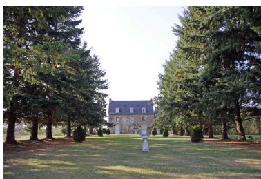
Le manoir de la Vallée vu depuis l'est. IVR52_20055302217NUCA