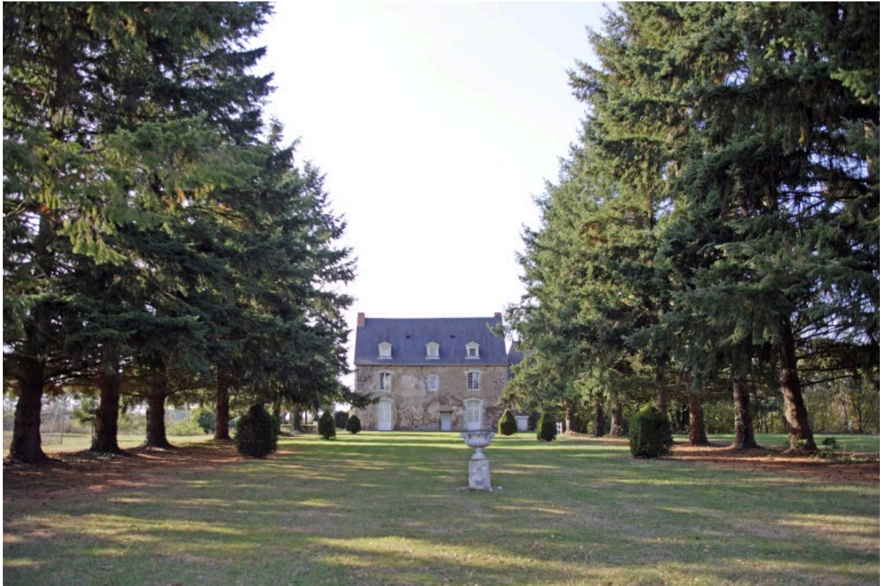
Le manoir de la Vallée vu depuis l'est.