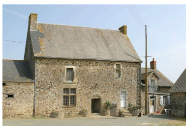
Le manoir d'Aigrefoin IVR52_20035302047NUCA