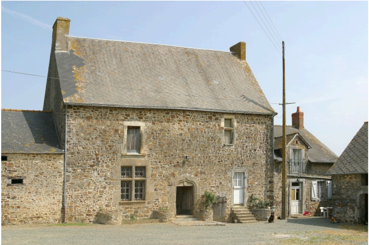
Le manoir d'Aigrefoin