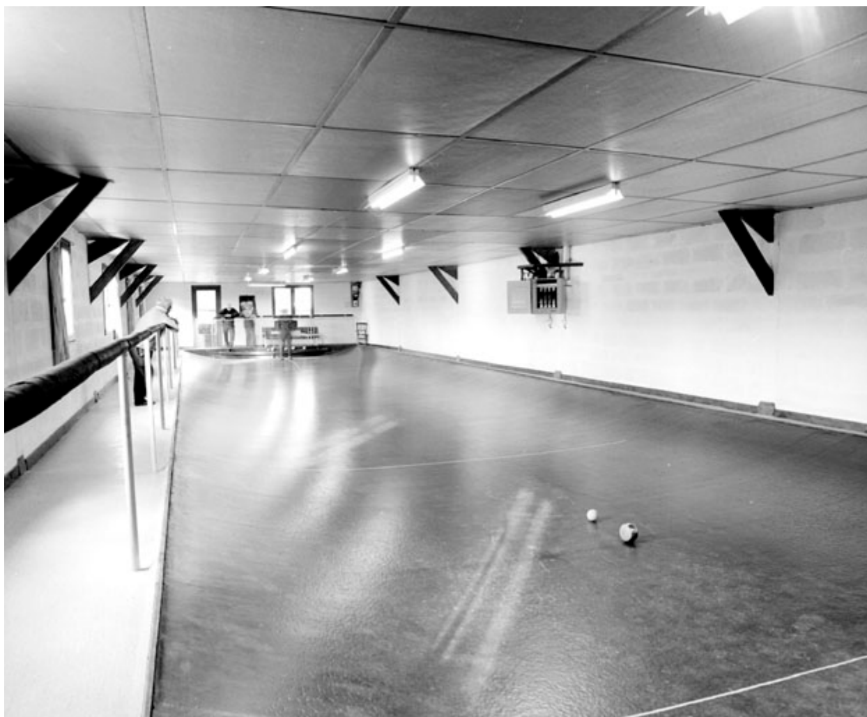
Partie de jeu de boule de fort, en 1995.