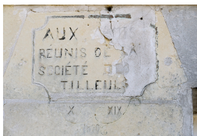
Inscription dédicatoire : Aux Amis réunis de la Société des Tilleuls, X - XIX, 1890.