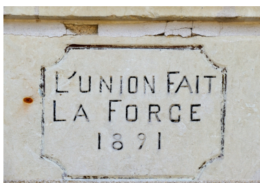
Inscription dédicatoire : L'union fait la force, 1891.