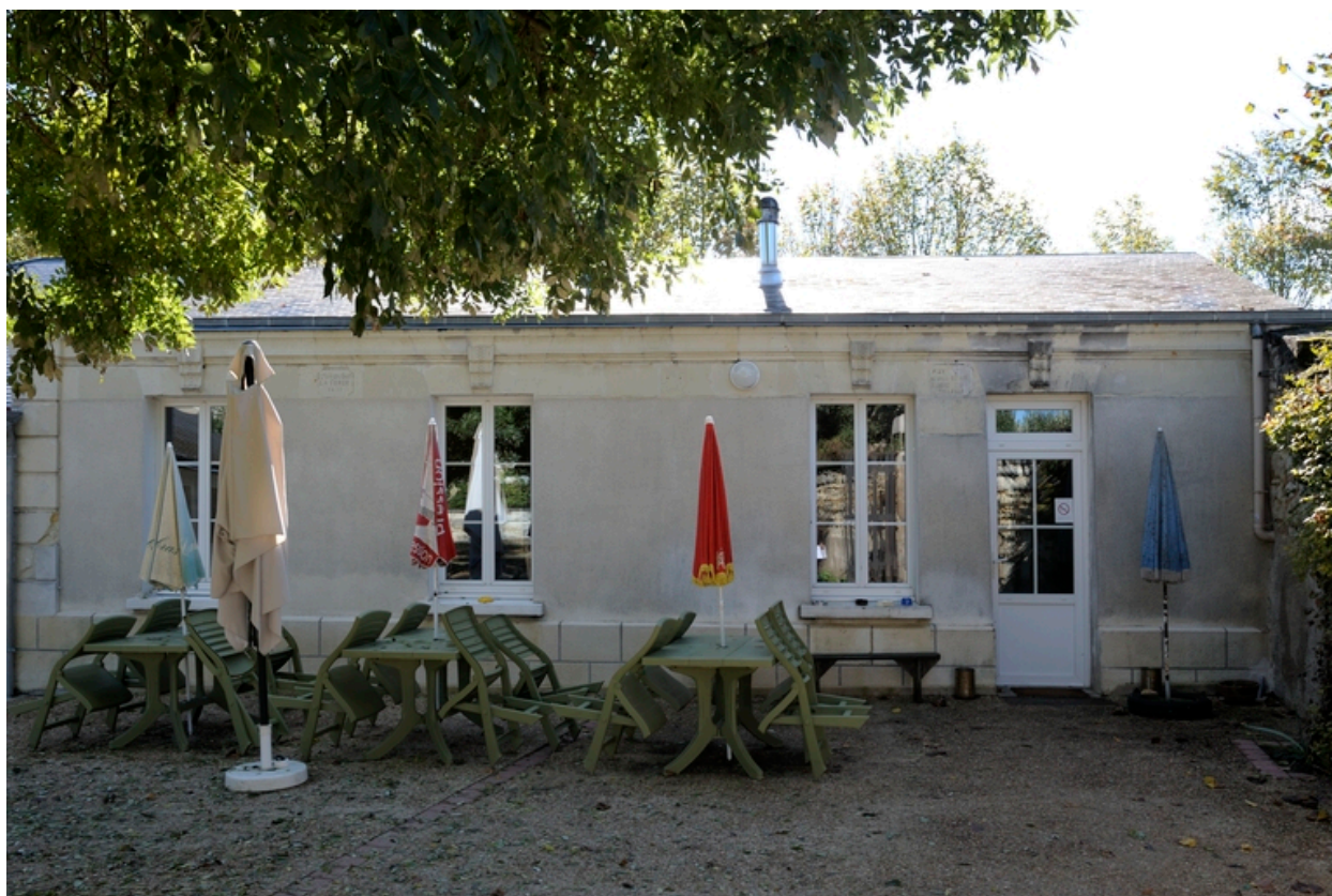
Vue d'ensemble sur le corps principal de la Société des Tilleuls.