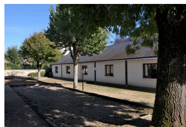
Vue d'ensemble sur les jeux, en plein air (palet, pétanque) ou en salle (boule de fort).