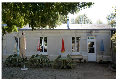
Vue d'ensemble sur le corps principal de la Société des Tilleuls. IVR52_20124901867NUCA