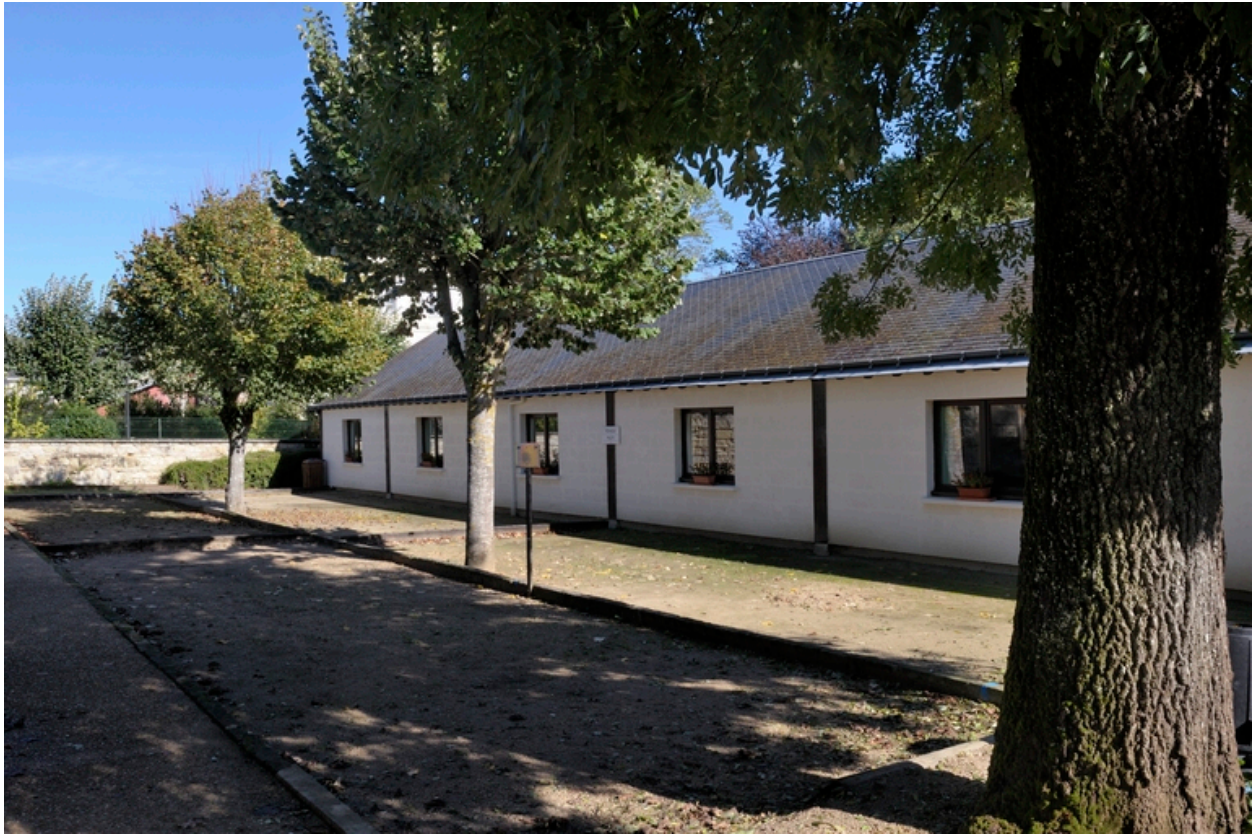
Vue d'ensemble sur les jeux, en plein air (palet, pétanque) ou en salle (boule de fort).