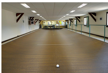
Vue du jeu de boule (2). IVR52_20124901865NUCA