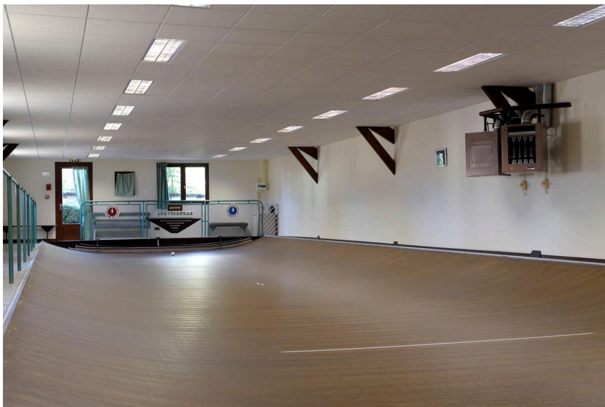
Vue du jeu de boule (1).