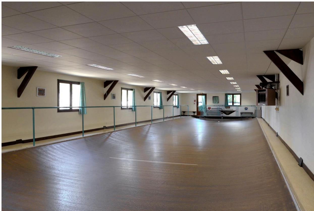
Vue générale du jeu de boule.