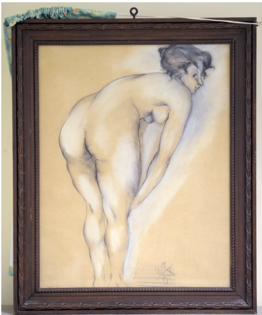
La Fanny (1908), fusain, craie blanche, sanguine sur papier.