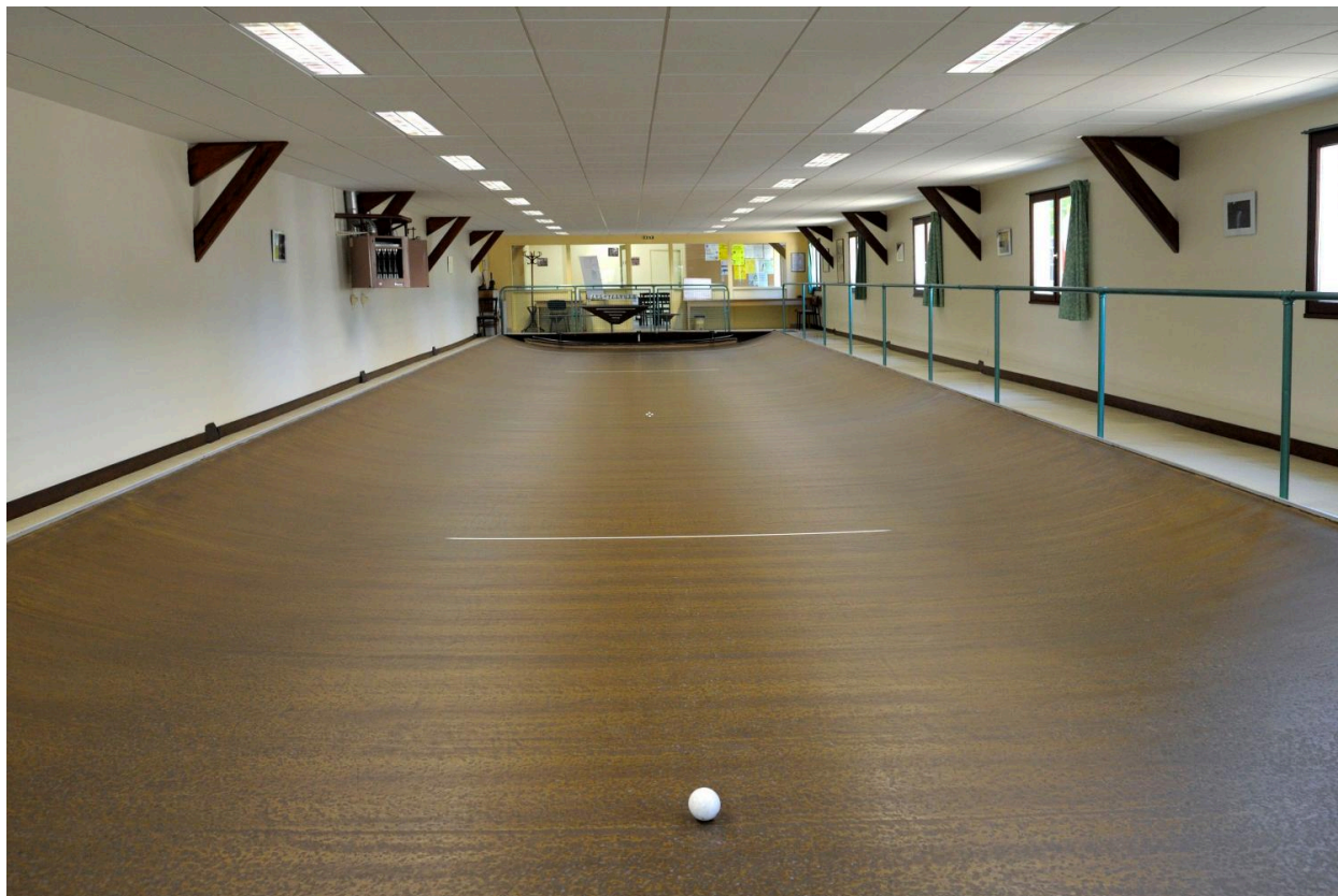
Vue du jeu de boule (2).