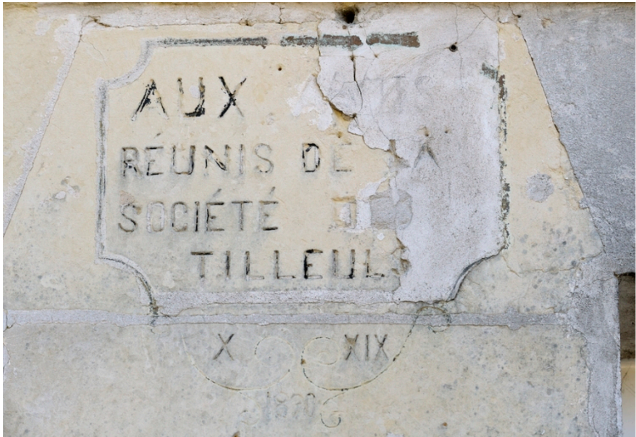
Inscription dédicatoire : Aux Amis réunis de la Société des Tilleuls, X - XIX, 1890.