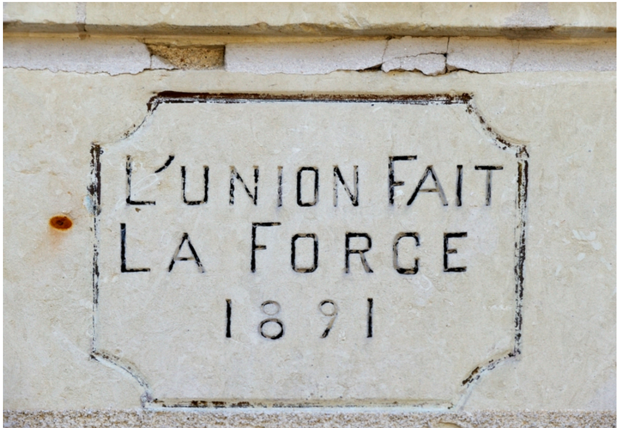
Inscription dédicatoire : L'union fait la force, 1891.