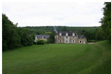
Vue d'ensemble prise du bois.