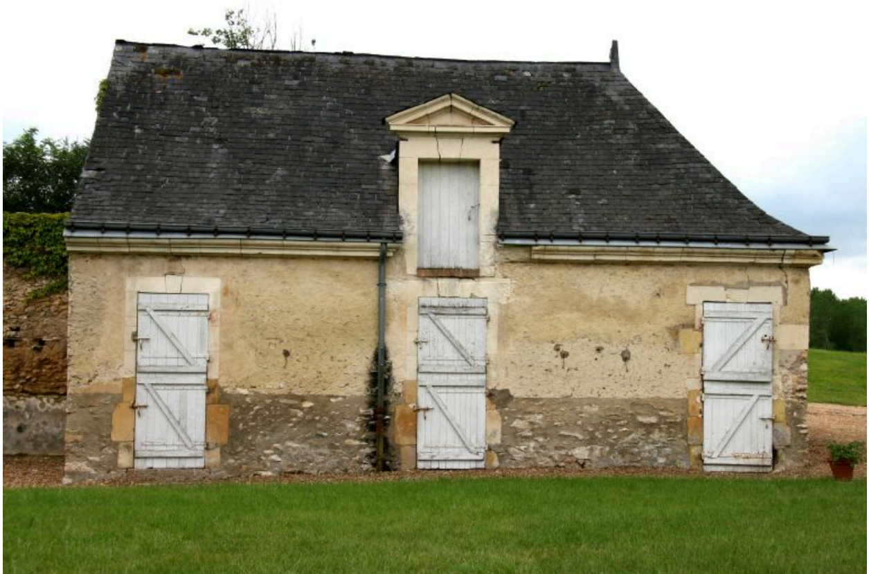
La ferme : écuries et greniers.