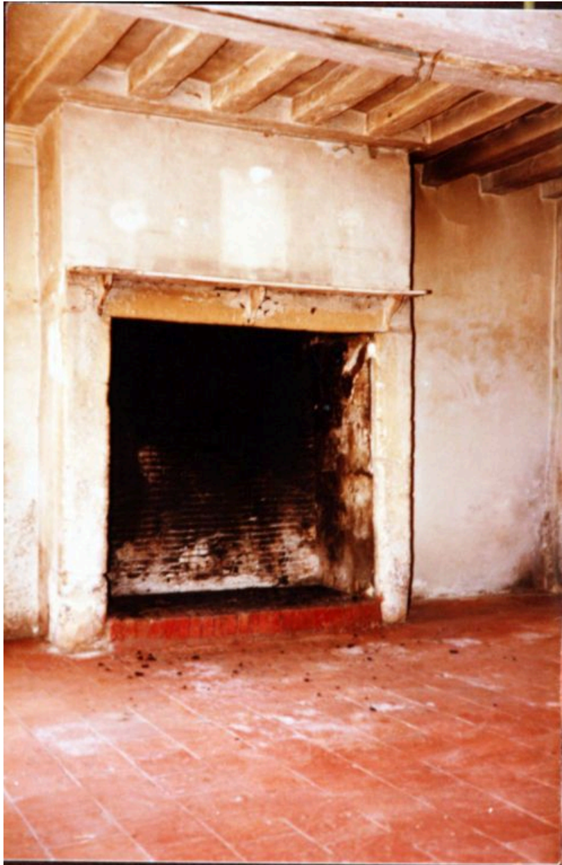
le logis, rez-de-chaussée : cheminée avant remaniements.