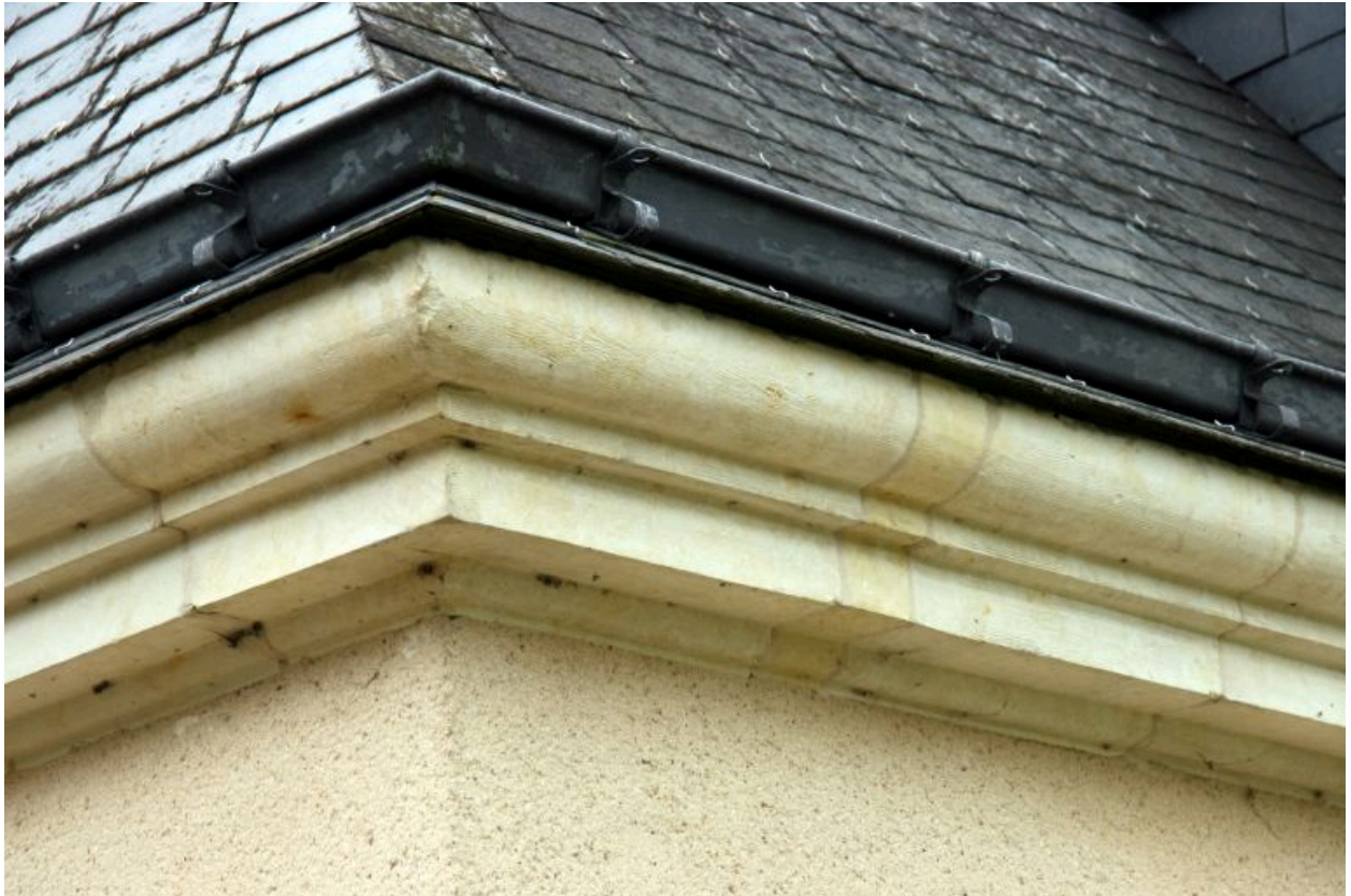
Le logis, détail : la corniche.