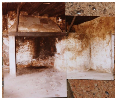
La ferme, buanderie proche le logis : cheminée avec four intérieur. IVR52_20077200509NUCA