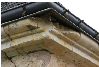
Les écuries : la corniche. IVR52_20077200499NUCA