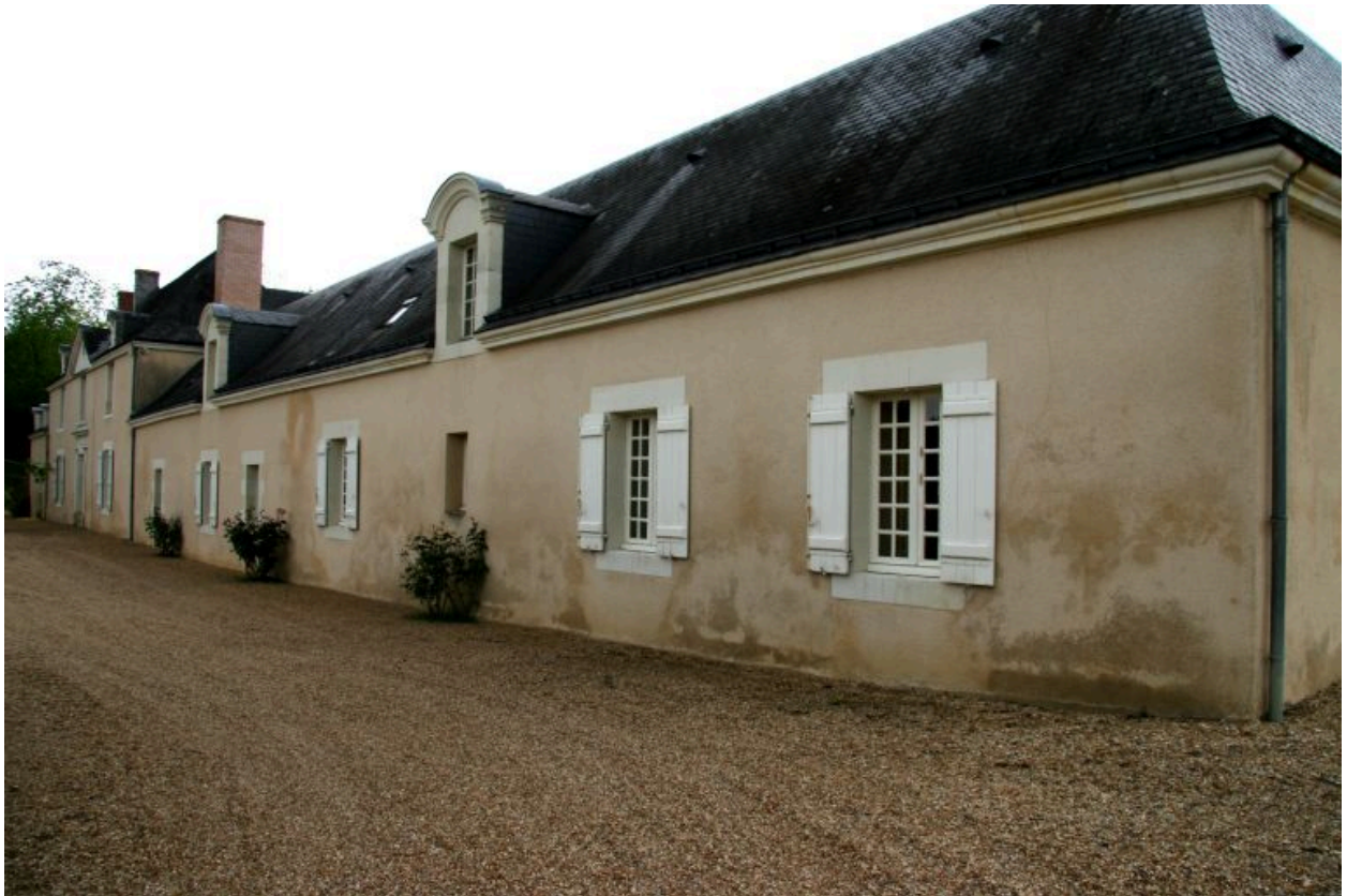
La ferme : façade postérieure remaniée.