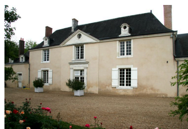
Le logis : façade antérieure. IVR52_20077200491NUCA