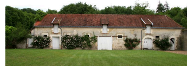
La ferme : remises et étables. IVR52_20077200497NUCA