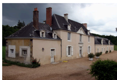
Vue d'ensemble de la façade antérieure du logis et de la façade postérieure de l'ancienne ferme. IVR52_20077200494NUCA