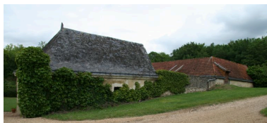
La ferme : aile sur le chemin.