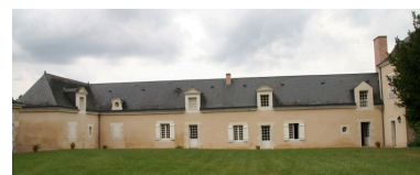
La ferme : façade sur cour.