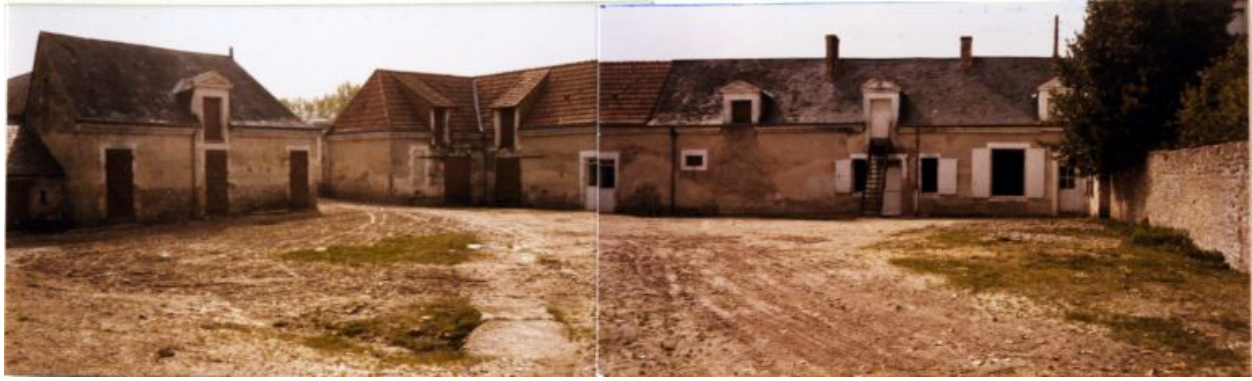
La ferme avant les travaux.