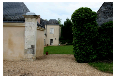
La ferme : portail d'entrée.