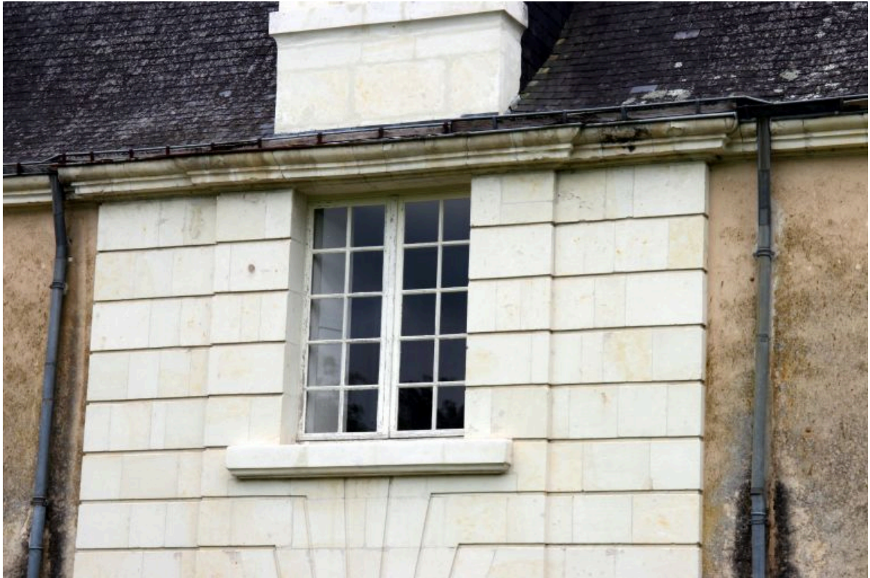
Le logis, façade sur la cour, détail : avant-corps central de bossages allongés.