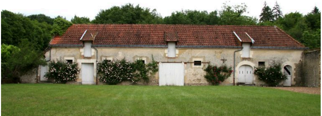
La ferme : remises et étables.