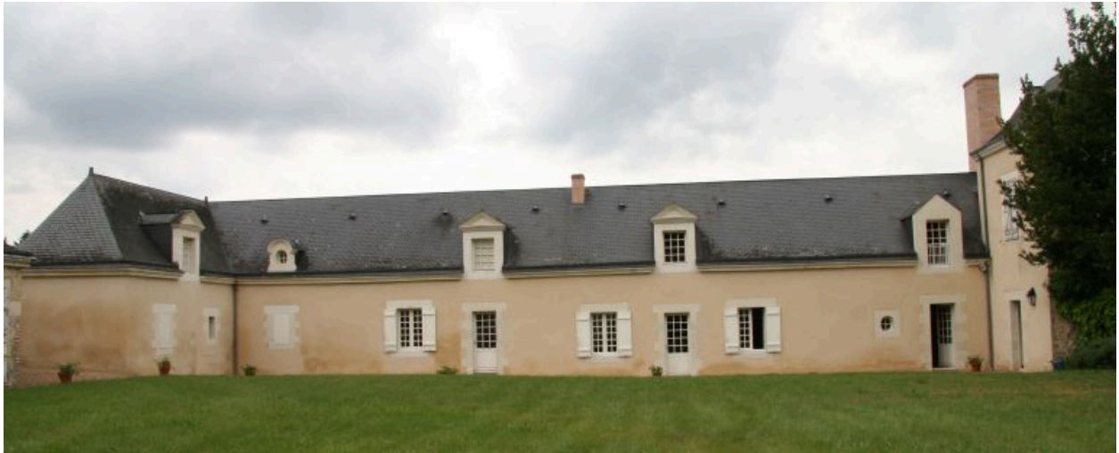
La ferme : façade sur cour.