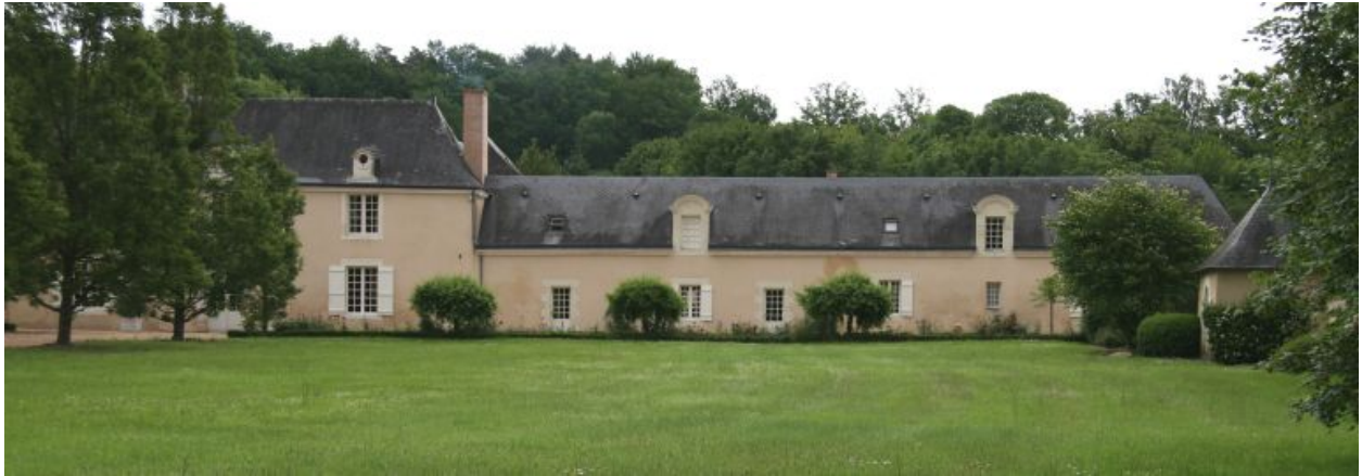
Vue d'ensemble de la façade principale.