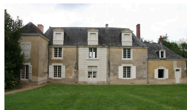
Le logis : façade postérieure sur la cour.