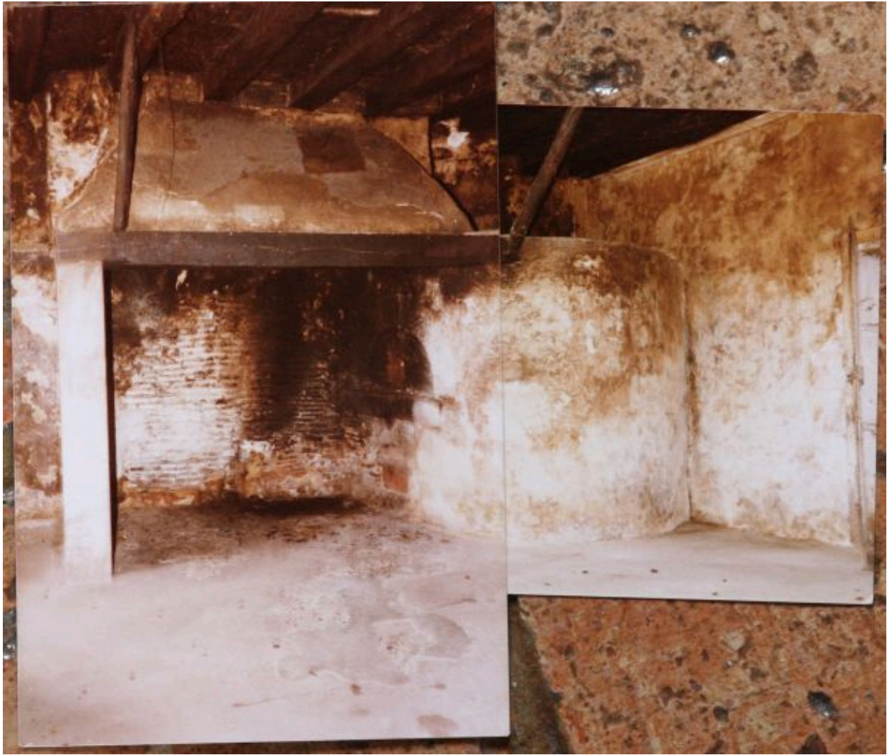
La ferme, buanderie proche le logis : cheminée avec four intérieur.