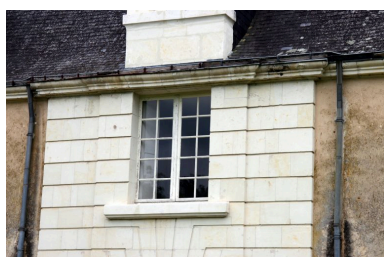
Le logis, façade sur la cour, détail : avant-corps central de bossages allongés.