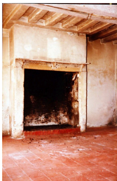
le logis, rez-de-chaussée : cheminée avant remaniements.