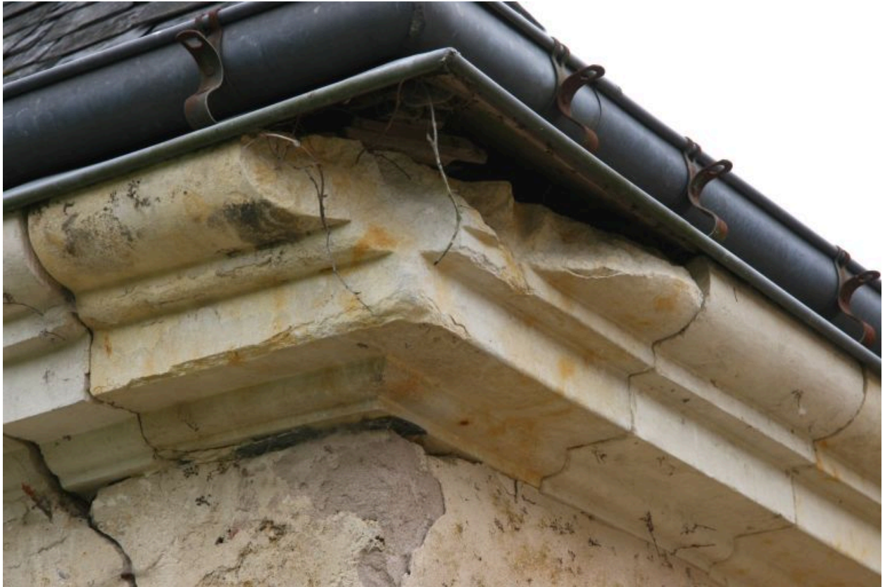
Les écuries : la corniche.