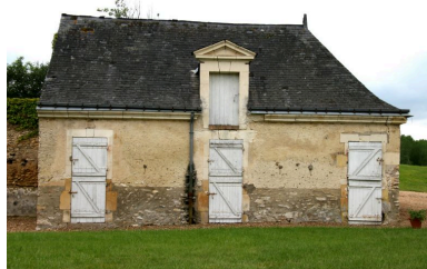
La ferme : écuries et greniers. IVR52_20077200496NUCA