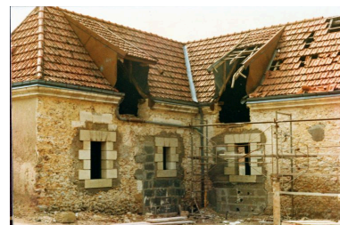
La ferme, aile en retour : les baies en cours de remaniements. IVR52_20077200508NUCA