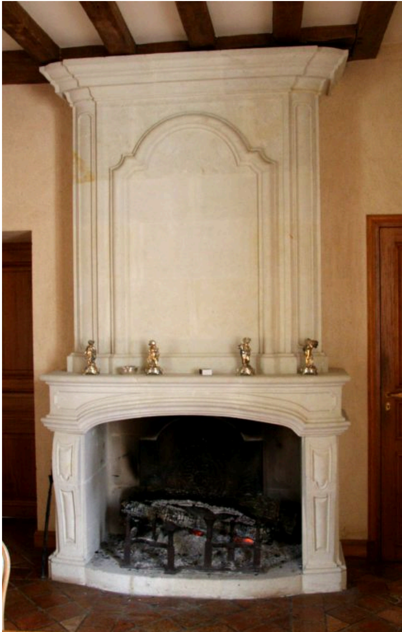
Le logis, rez-de-chaussée : nouvelle cheminée.