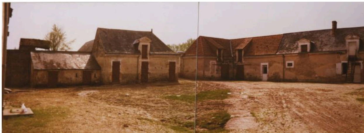
La ferme : l'aile en retour avant les travaux.