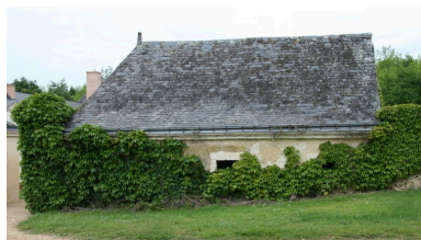
Les écuries et grenier : façade postérieure sur le chemin. IVR52_20077200518NUCA