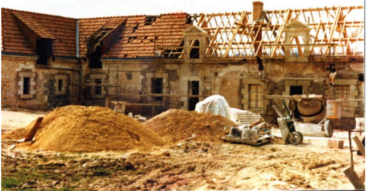
La ferme, façade sur la cour pendant les travaux.