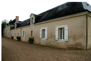
La ferme : façade postérieure remaniée. IVR52_20077200490NUCA