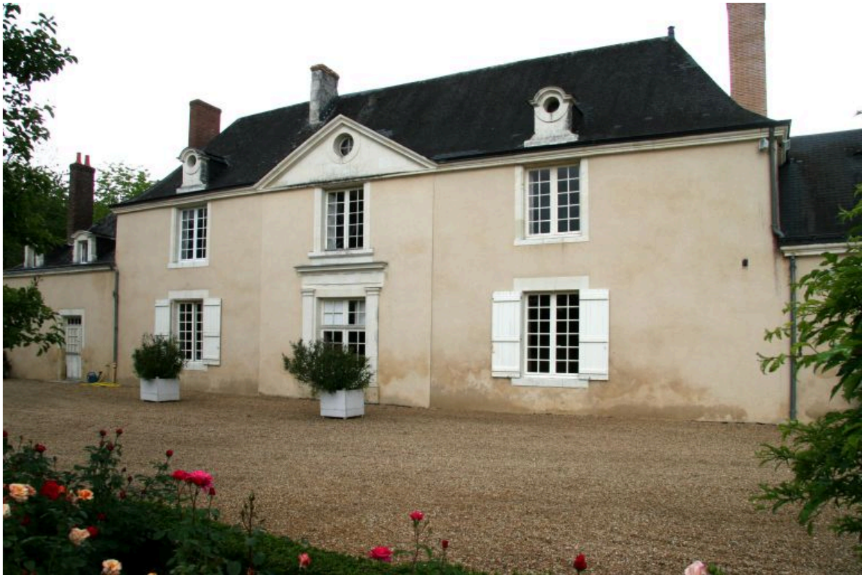
Le logis : façade antérieure.