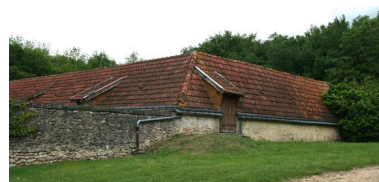
Les étables et remises : aile en retour sur le chemin. IVR52_20077200517NUCA