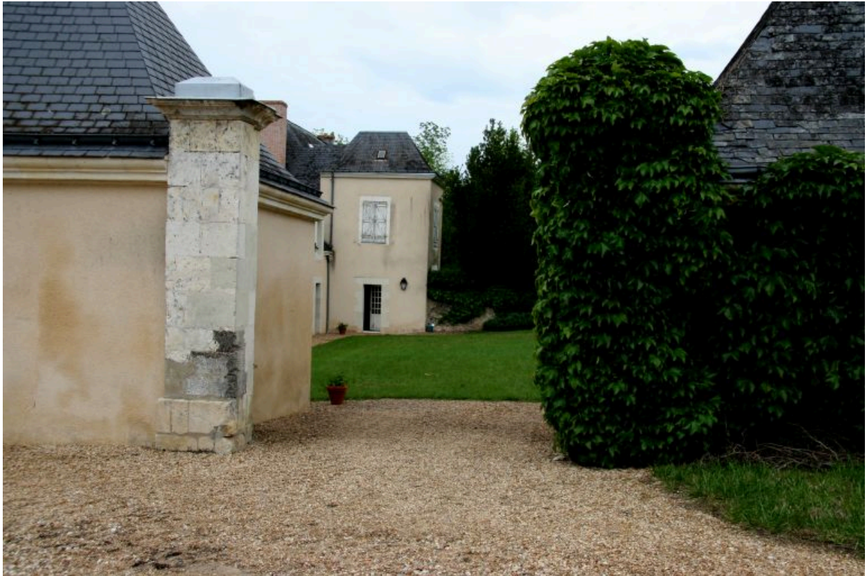
La ferme : portail d'entrée.