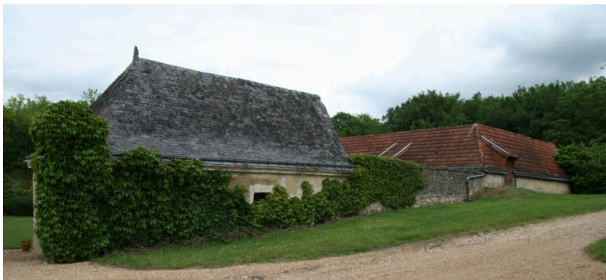
La ferme : aile sur le chemin.