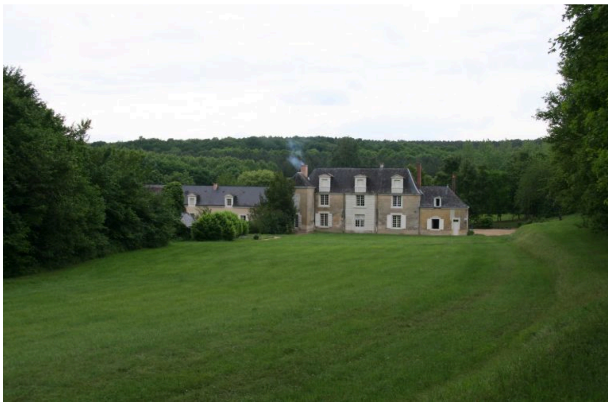
Vue d'ensemble prise du bois.