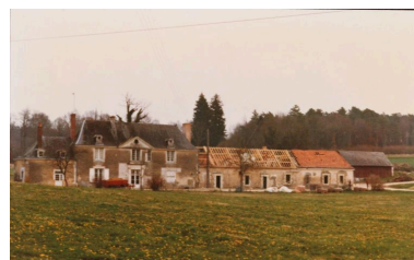
Le logis et la ferme : état avant les travaux.