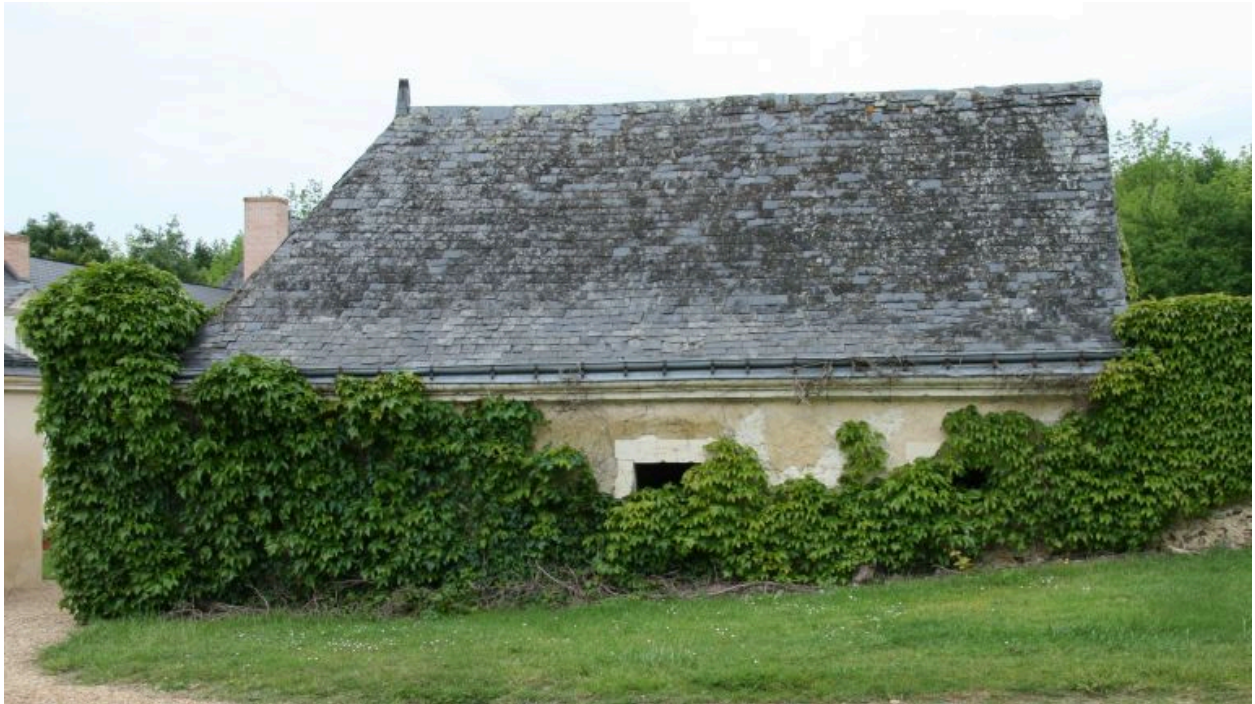
Les écuries et grenier : façade postérieure sur le chemin.