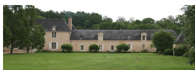
Vue d'ensemble de la façade principale. IVR52_20077200489NUCA