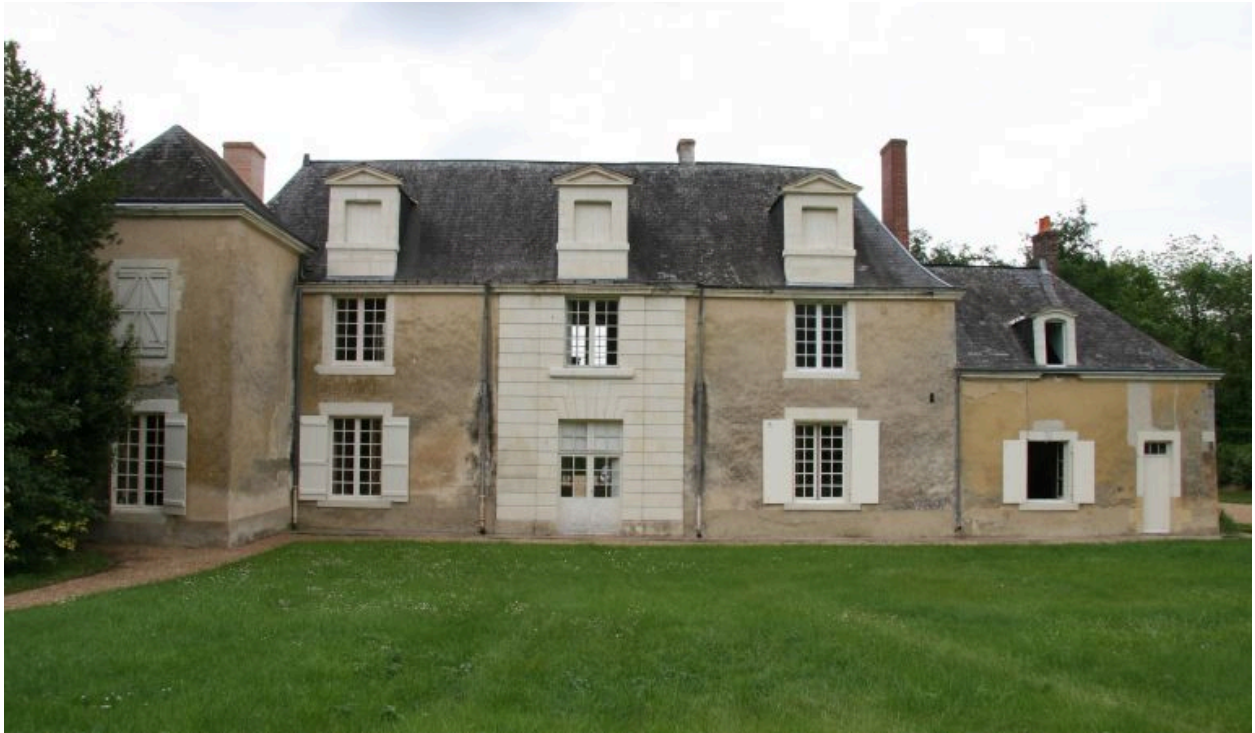
Le logis : façade postérieure sur la cour.