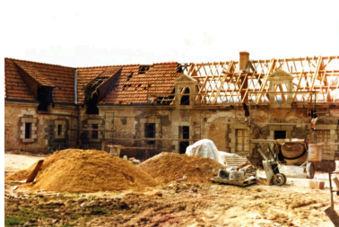
La ferme, façade sur la cour pendant les travaux.