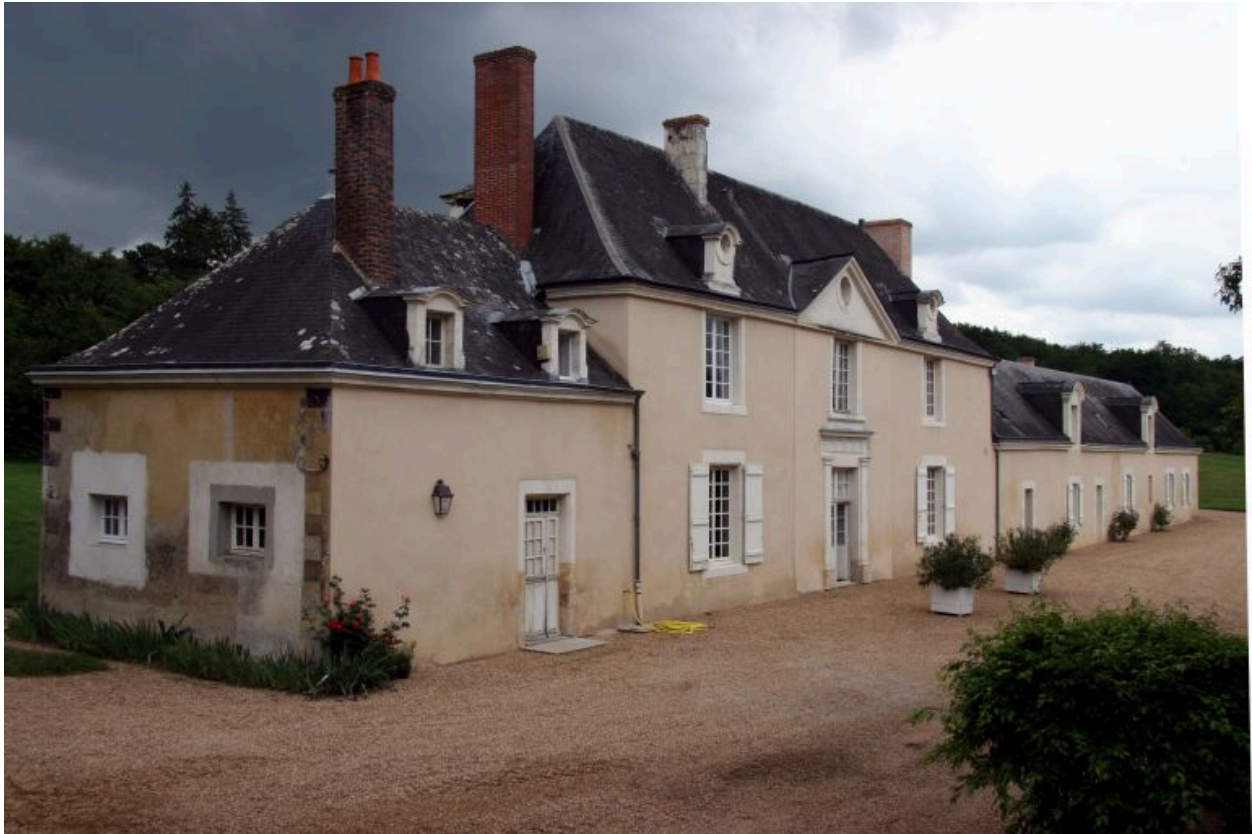
Vue d'ensemble de la façade antérieure du logis et de la façade postérieure de l'ancienne ferme.