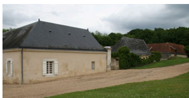
La ferme, aile en retour : façade postérieure sur le chemin.