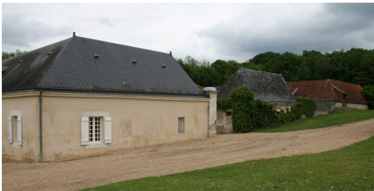
La ferme, aile en retour : façade postérieure sur le chemin.