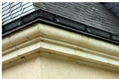
Le logis, détail : la corniche. IVR52_20077200498NUCA