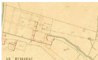
Plan de situation en 1845. IVR52_20057204520NUCA