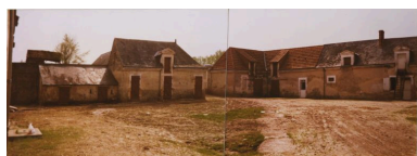
La ferme : l'aile en retour avant les travaux. IVR52_20077200503NUCA