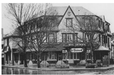
Façade nord-est de l'hôtel Continental vers 1930. IVR52_19984402684X