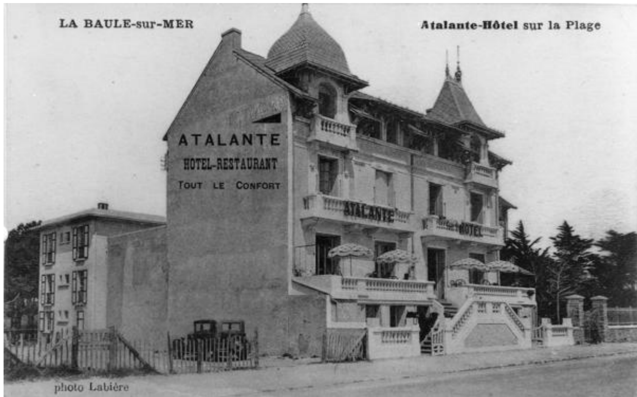
Façade sud de l'ancien hôtel Atalante dit Armorik Hôtel vue du sud-ouest.