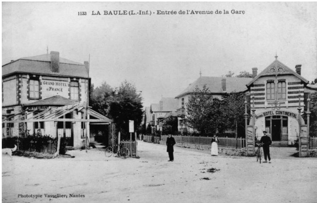
Façade nord-est du Grand Hôtel Continental à droite et du Grand Hôtel de France à gauche vers 1905.