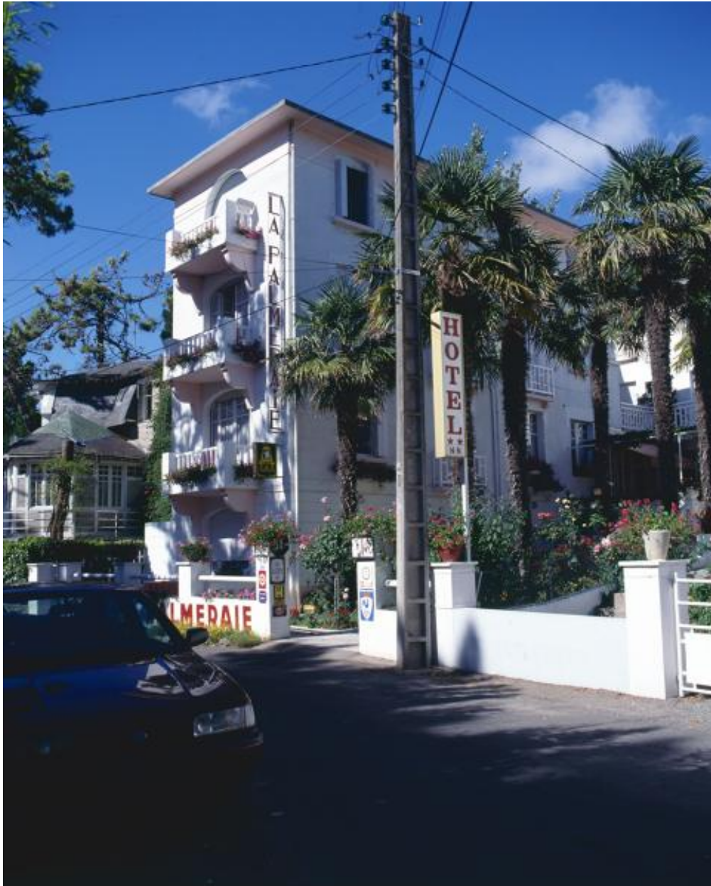
Hôtel de voyageurs La Palmeraie, façade avenue des Cormorans.