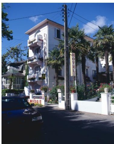
Hôtel de voyageurs La Palmeraie, façade avenue des Cormorans. IVR52_19964401341XA