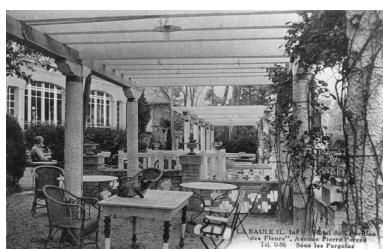
Exposée à l'est, la pergola de l'hôtel de voyageurs Le Pavillon des Fleurs. IVR52_19984402599X