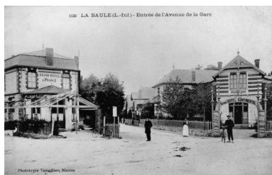
Façade nord-est du Grand Hôtel Continental à droite et du Grand Hôtel de France à gauche vers 1905. IVR52_19984402683X