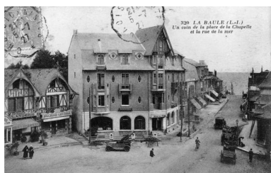
Façade ouest de l'Hôtel de Bretagne et de la villa Ker Cérés.