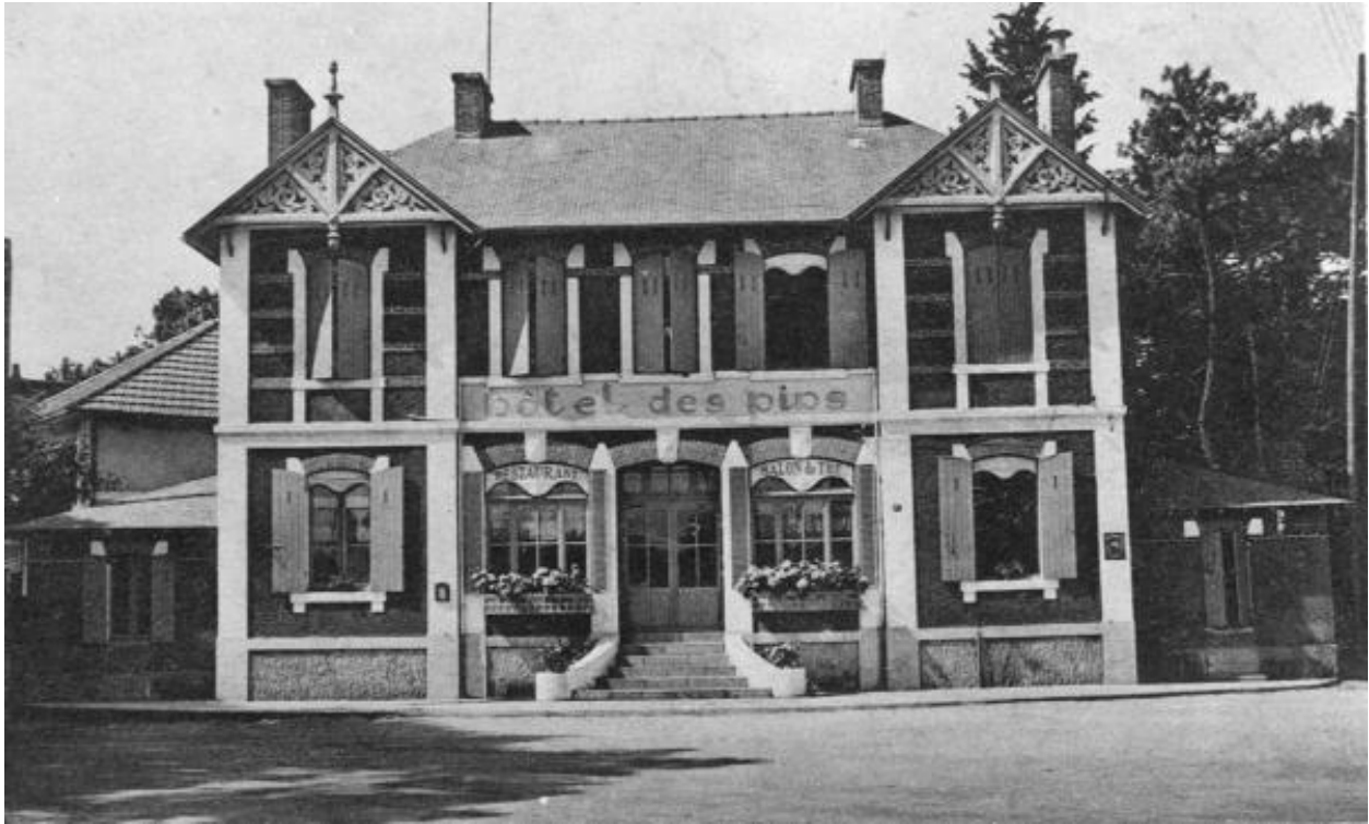
Hôtel de voyageurs, façade nord de l'Hôtel des Pins vers 1920.