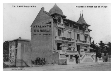
Façade sud de l'ancien hôtel Atalante dit Armorik Hôtel vue du sud-ouest. IVR52_19984402561X