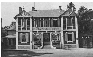
Hôtel de voyageurs, façade nord de l'Hôtel des Pins vers 1920.