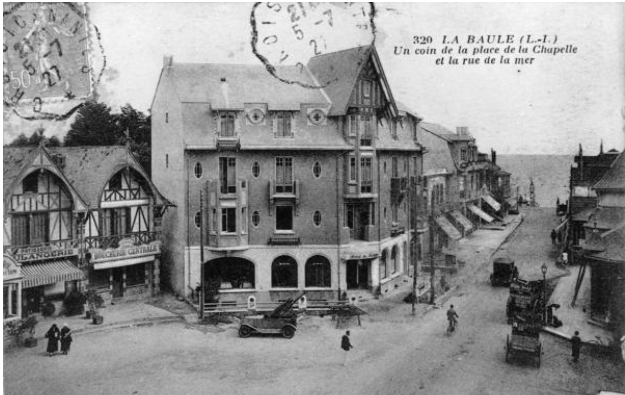
Façade ouest de l'Hôtel de Bretagne et de la villa Ker Cérés.