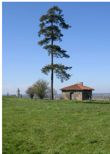
Vue du pavillon dans le jardin, actuellement transformé en bergerie. IVR52_20254900295NUCA