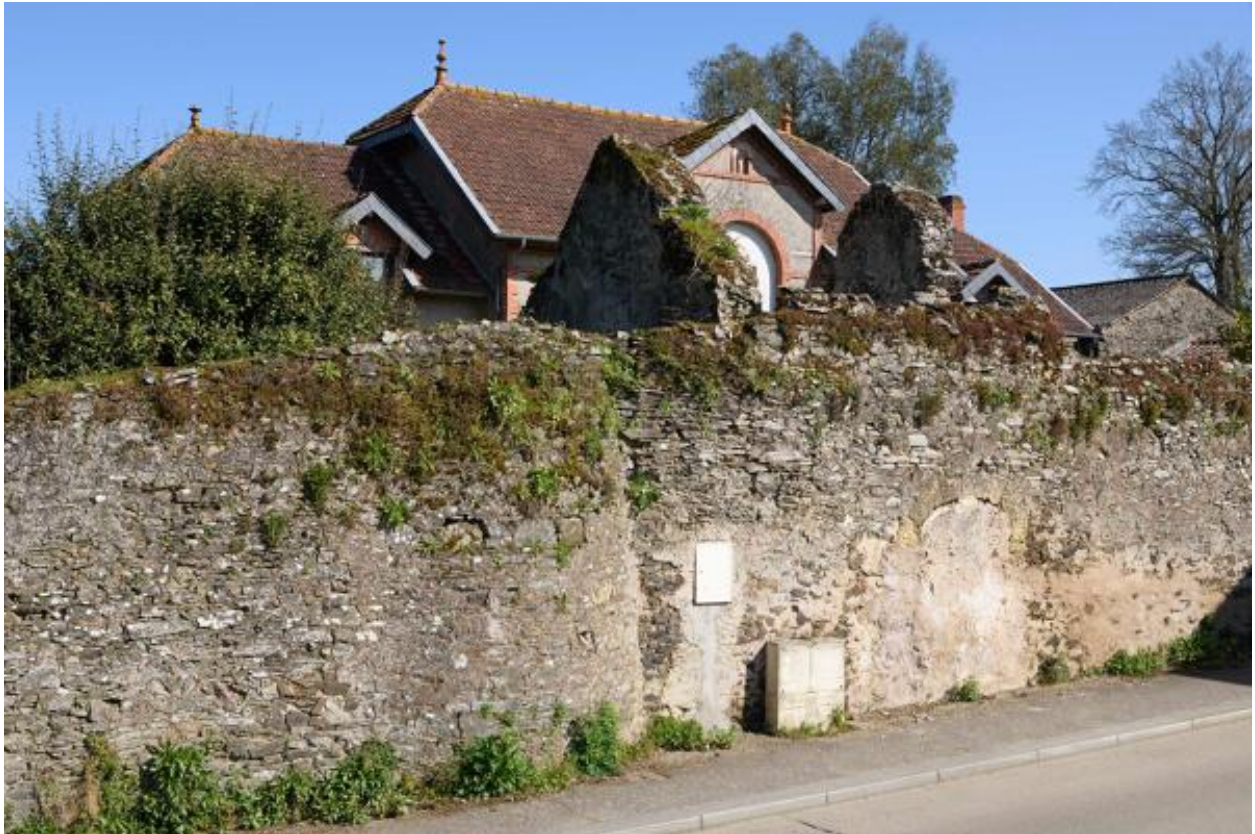
Vue du mur de clôture et vestige d'une tourelle depuis l'ouest.