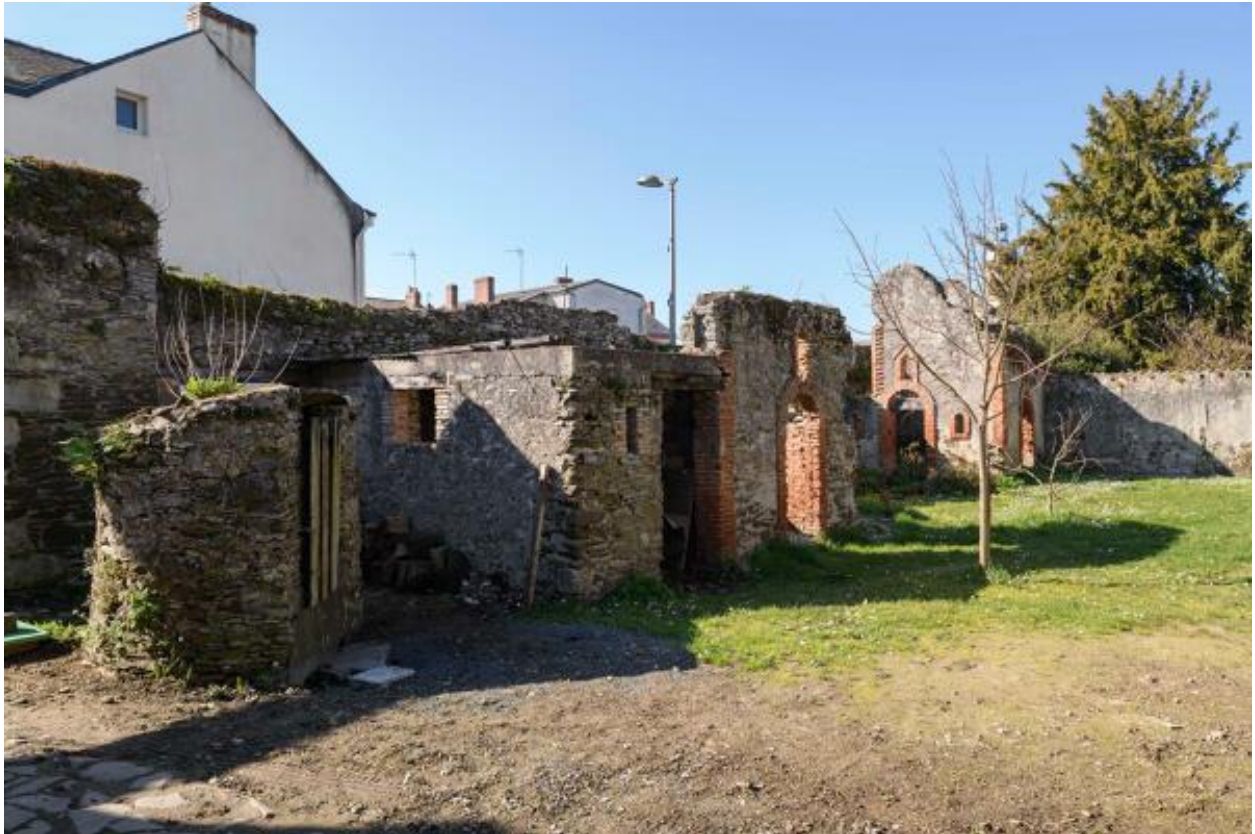
La ferme de la Cour. Vue des parties agricoles depuis le sud.