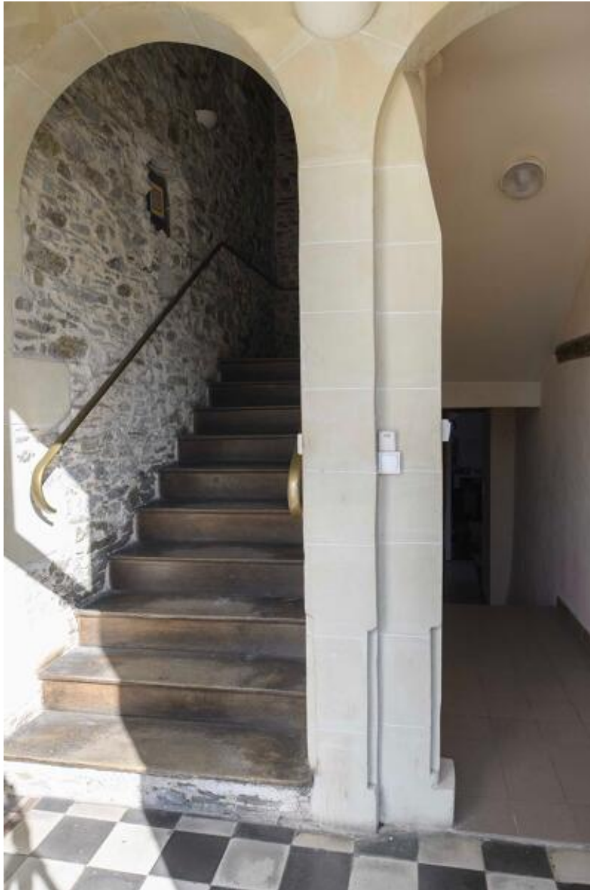
Vue de l'escalier principale rampe-sur-rampe du logis.