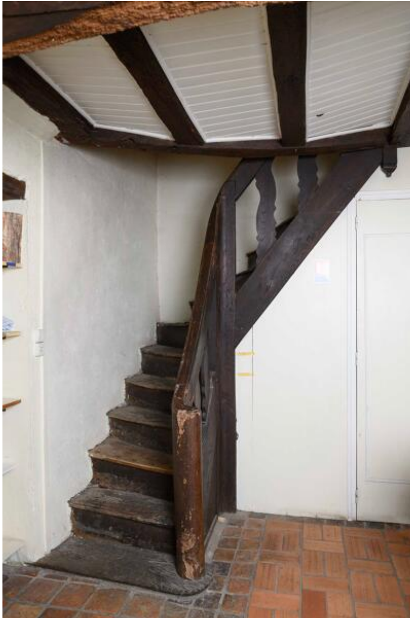
Vue de l'escalier de l'office.