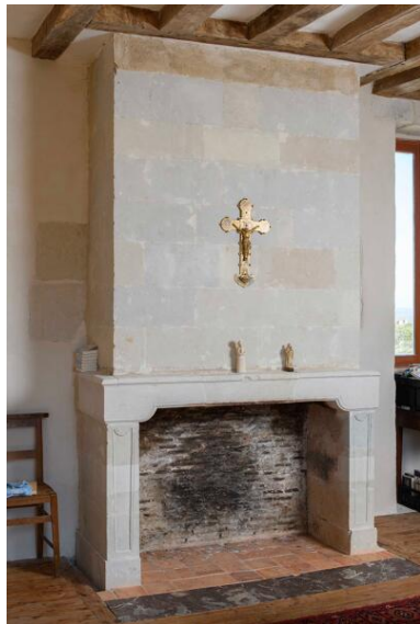
Détail de la cheminée de la chambre sud-est.