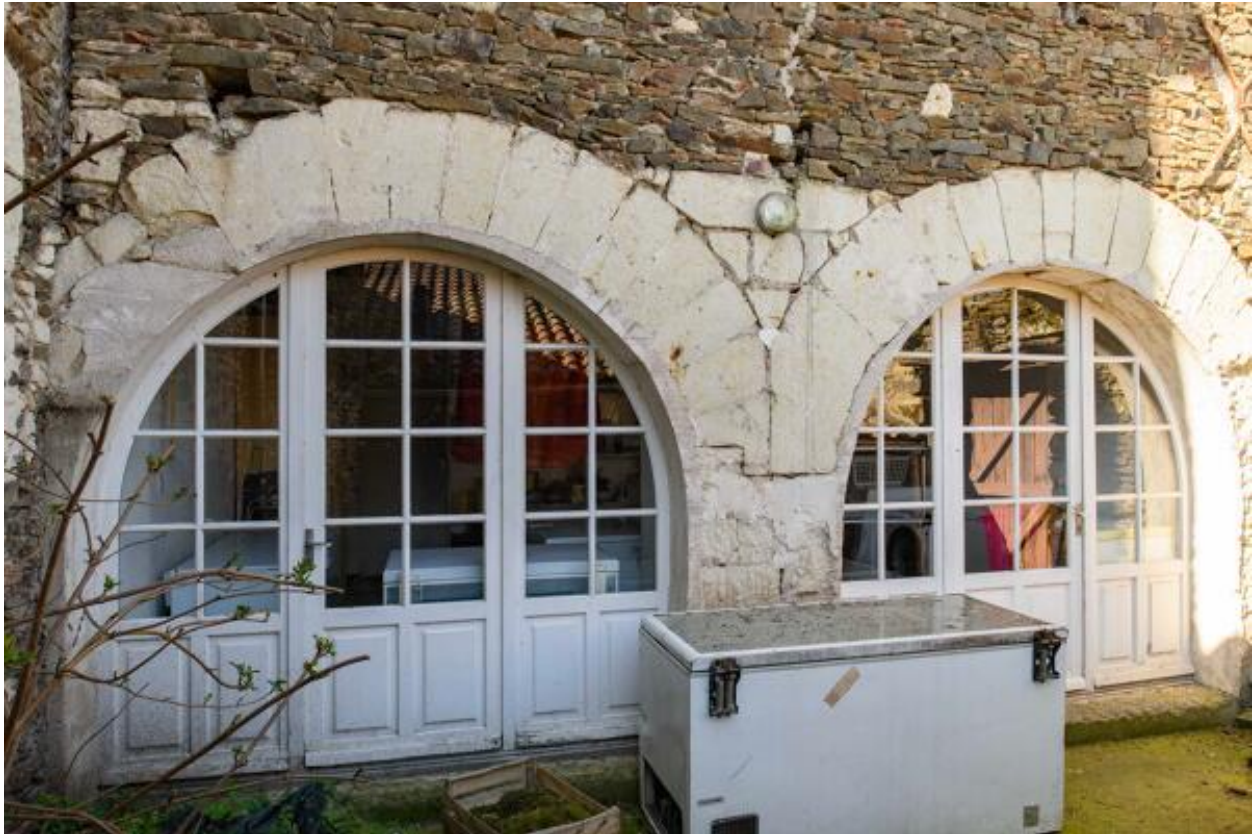
Détail des arcs sur le mur de pignon nord-est.