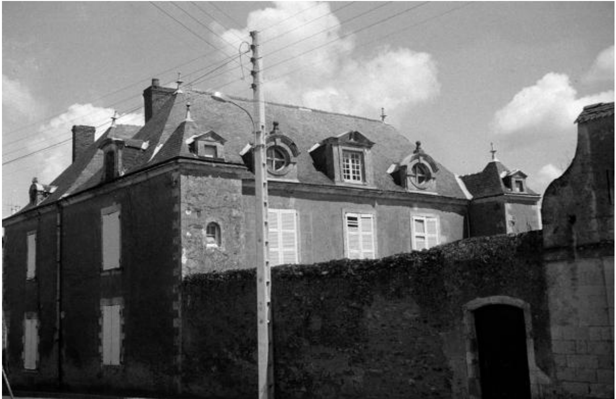
Vue d'ensemble depuis la rue prise lors du pré-inventaire en 1972.