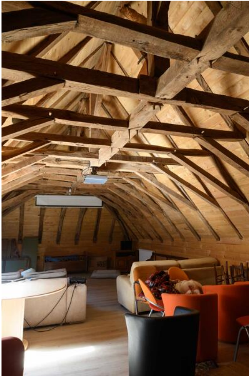
Détail de la charpente du corps de logis.