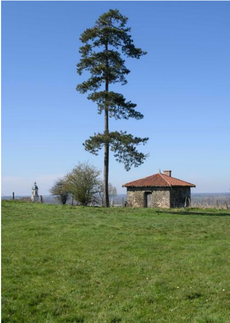
Vue du pavillon dans le jardin, actuellement transformé en bergerie.