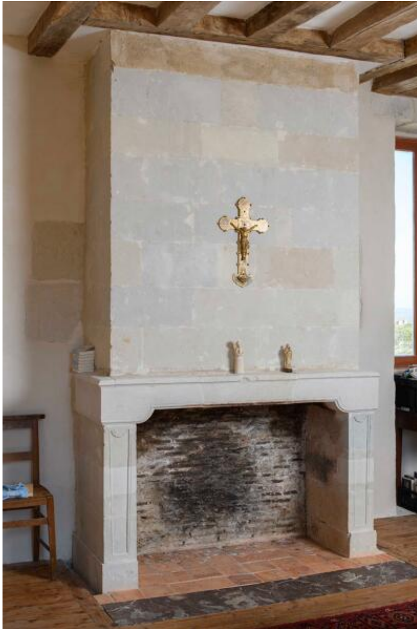
Détail de la cheminée de la chambre sud-est.