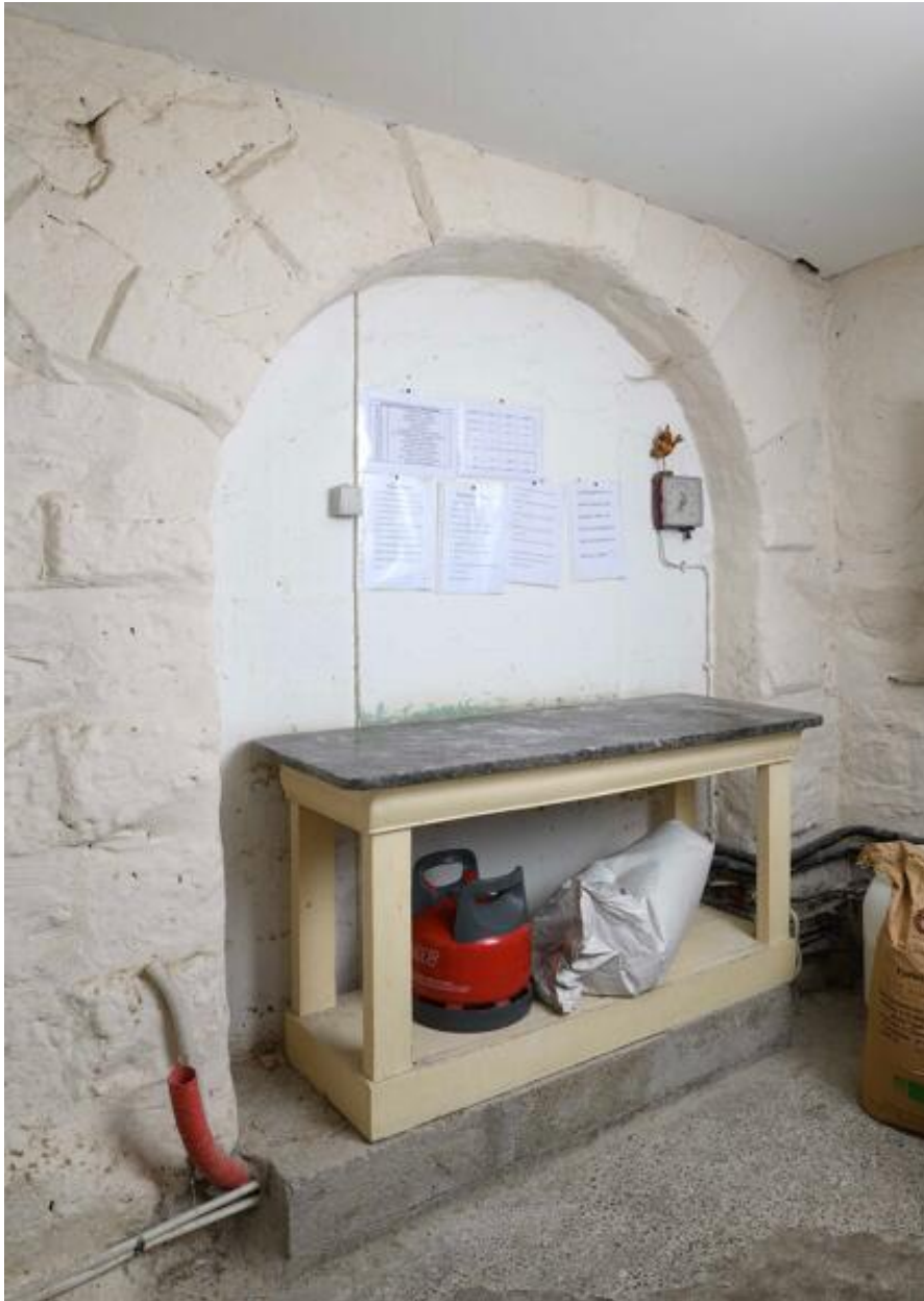
Détail de la porte en plein-cintre à bossage sur le mur pignon est.