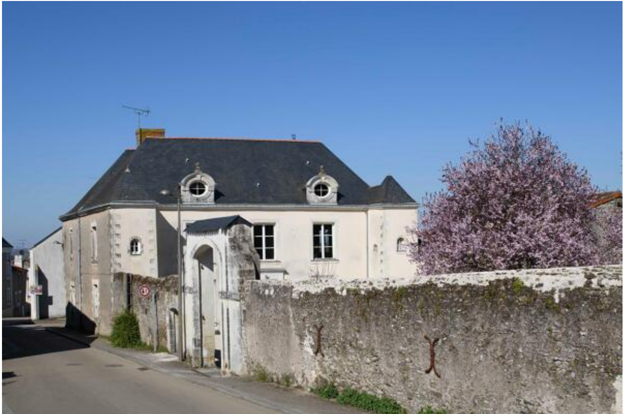
Vue d'ensemble depuis la rue des Mauges, au sud.