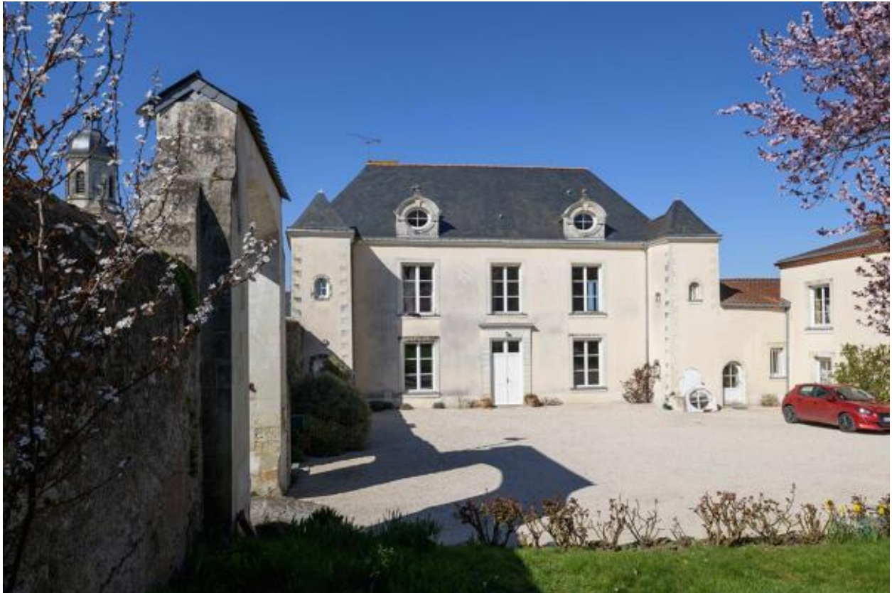
Vue du logis depuis la cour.