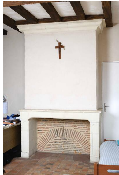
Détail de la cheminée de la chambre sud-ouest. IVR52_20254900276NUCA