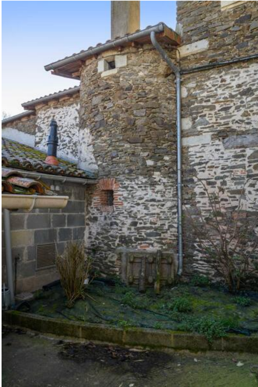
Vue de la tour circulaire adossée au mur nord de l'office.