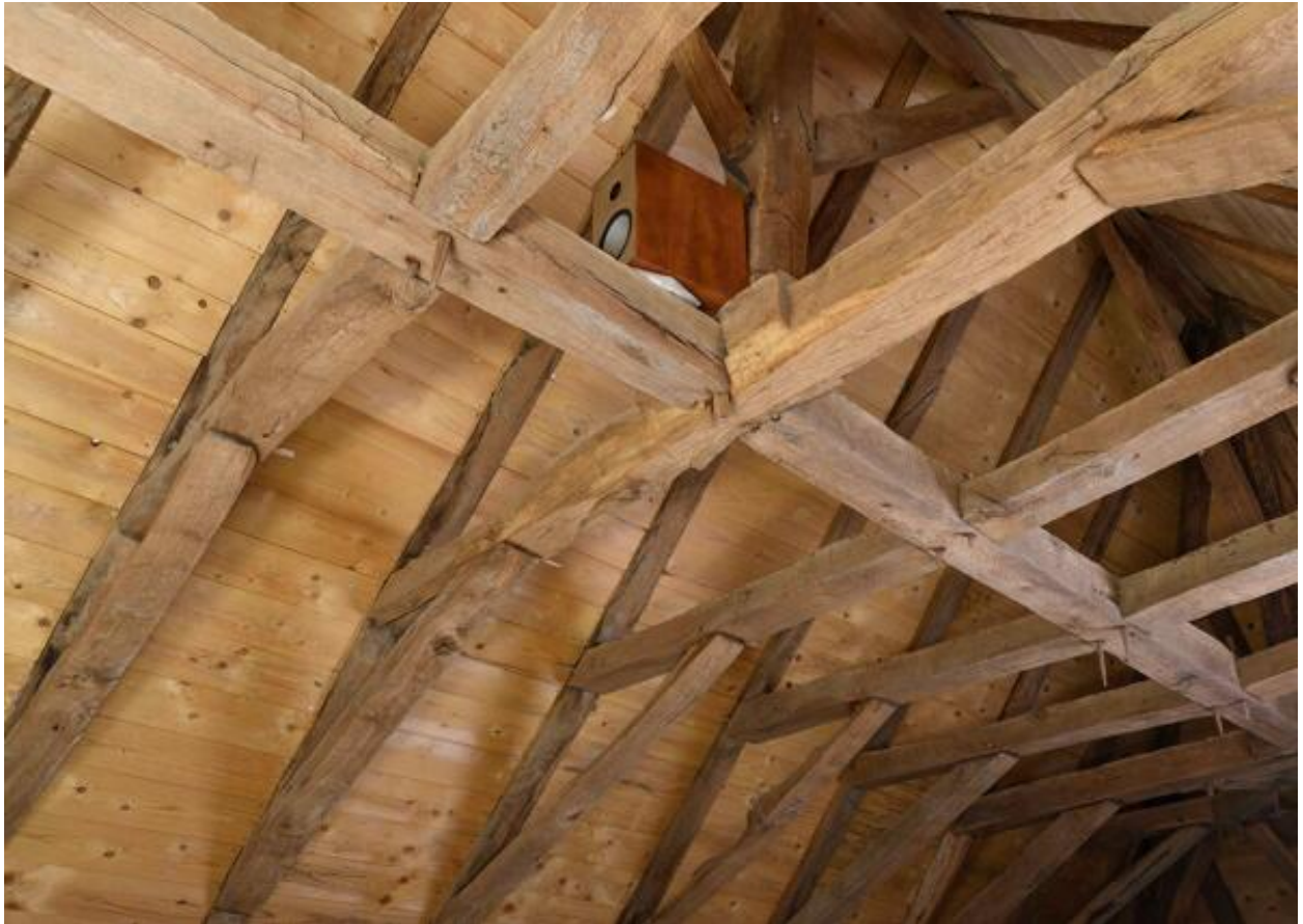
Détail de la charpente du logis.