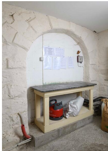
Détail de la porte en plein-cintre à bossage sur le mur pignon est. IVR52_20254900273NUCA