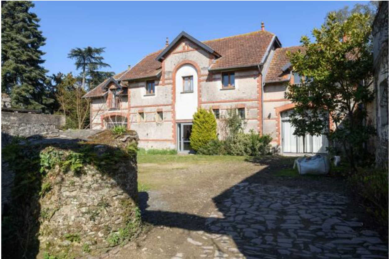
La ferme de la Cour. Vue du logis du fermier depuis l'ouest.