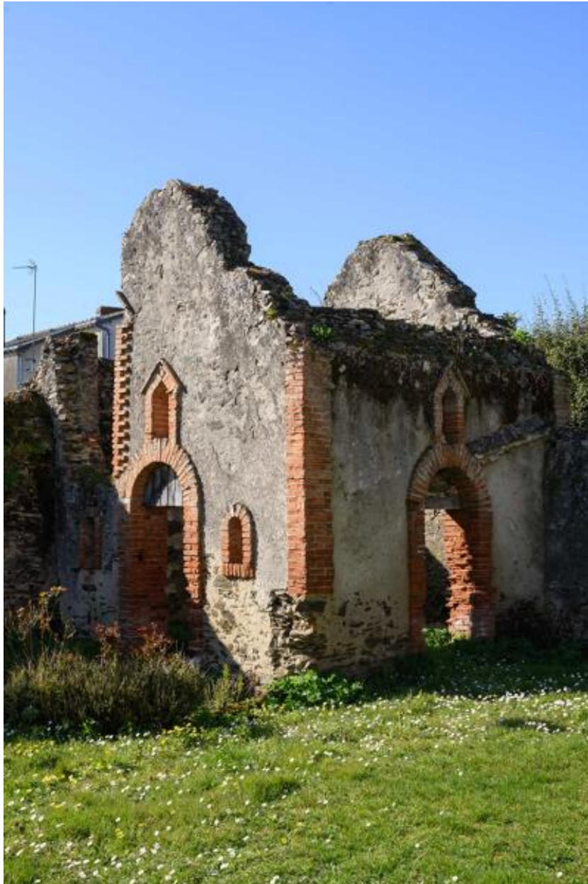
La ferme de la Cour. Vue du poulailler.