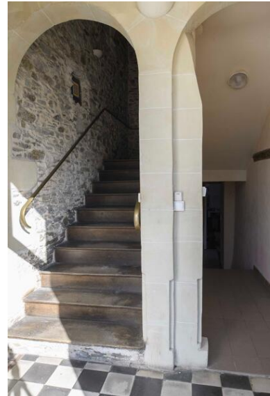
Vue de l'escalier principale rampe-sur-rampe du logis.