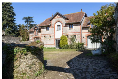
La ferme de la Cour. Vue du logis du fermier depuis l'ouest.