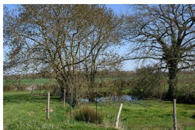
Vue de l'ancien bassin dans le parc.