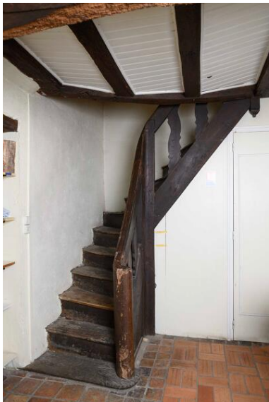
Vue de l'escalier de l'office.