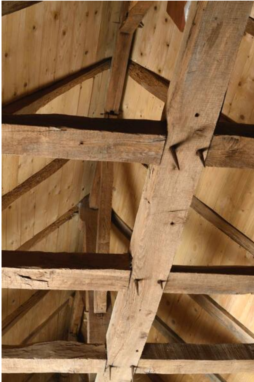
Détail de la charpente du logis.