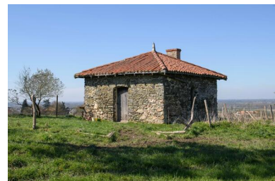
Vue de l'ancien pavillon de jardin, actuellement transformé en bergerie.