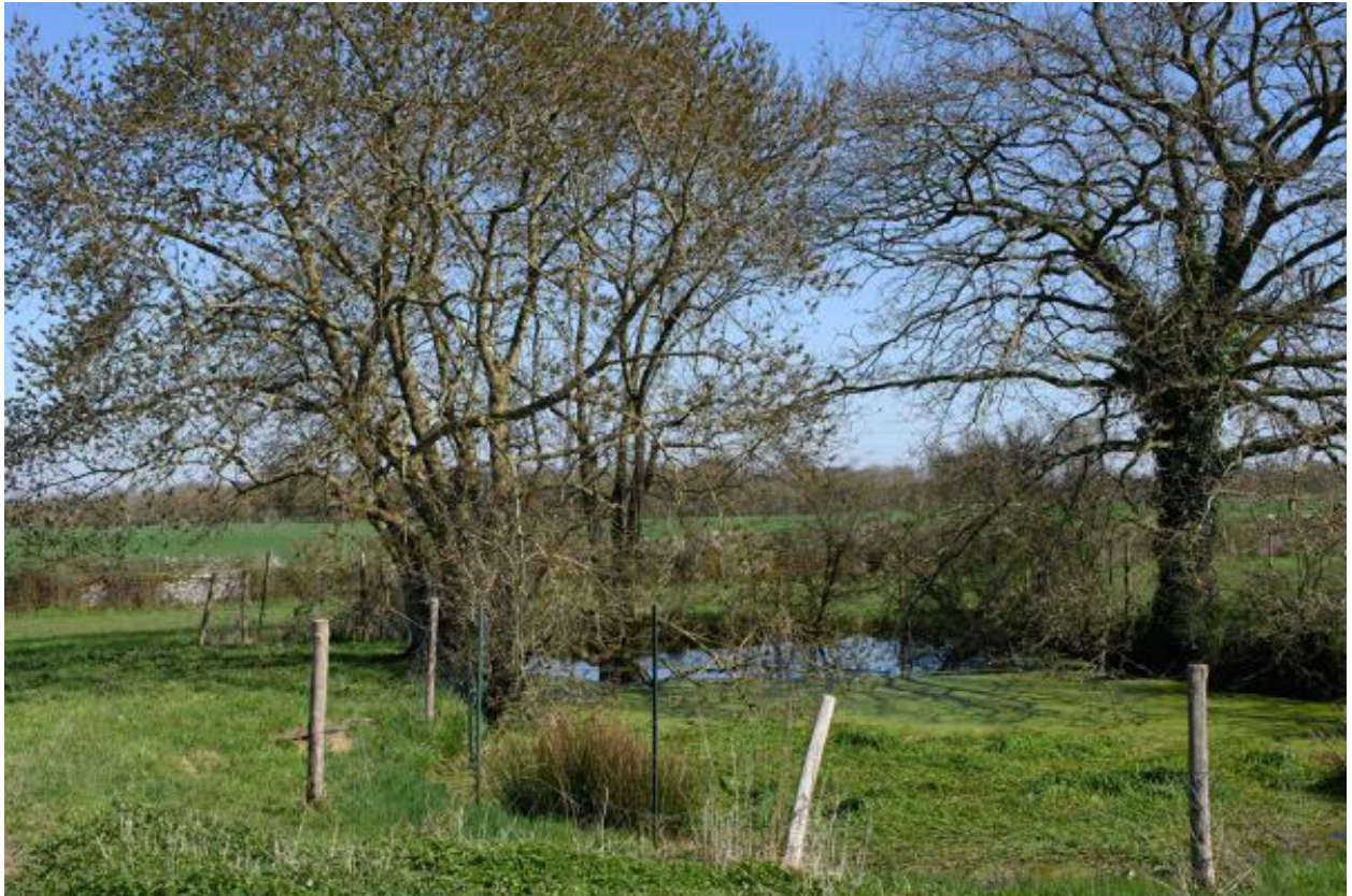
Vue de l'ancien bassin dans le parc.