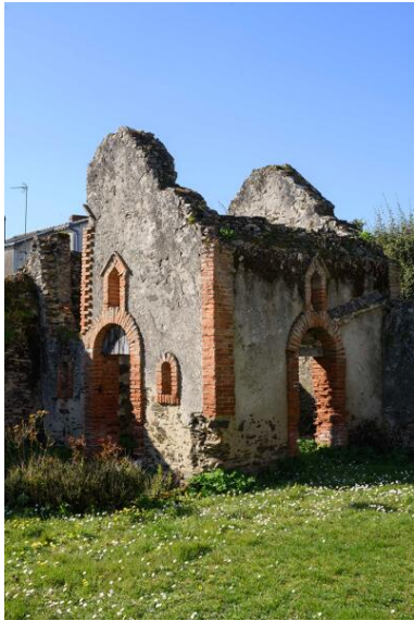
La ferme de la Cour. Vue du poulailler. IVR52_20254900319NUCA