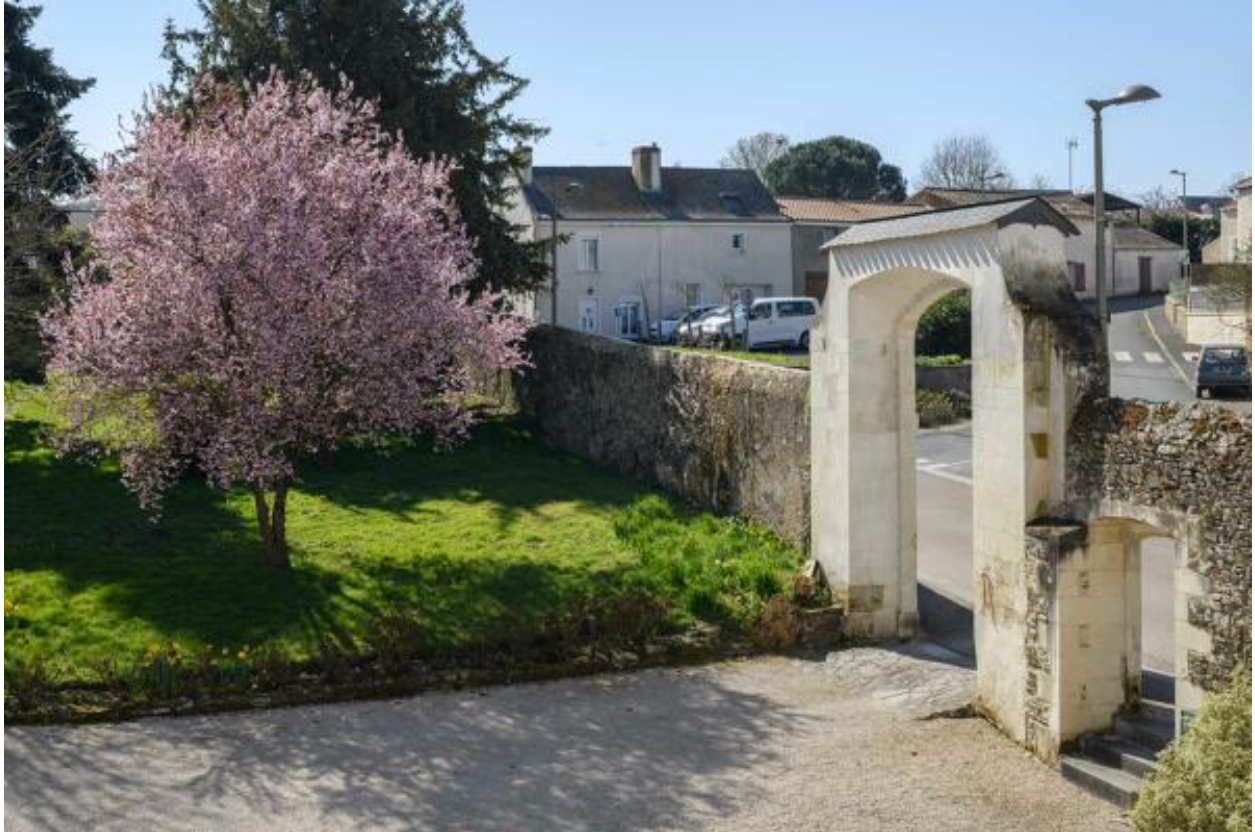
Vue du portail d'entrée depuis l'étage.