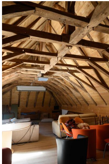
Détail de la charpente du corps de logis. IVR52_20254900279NUCA