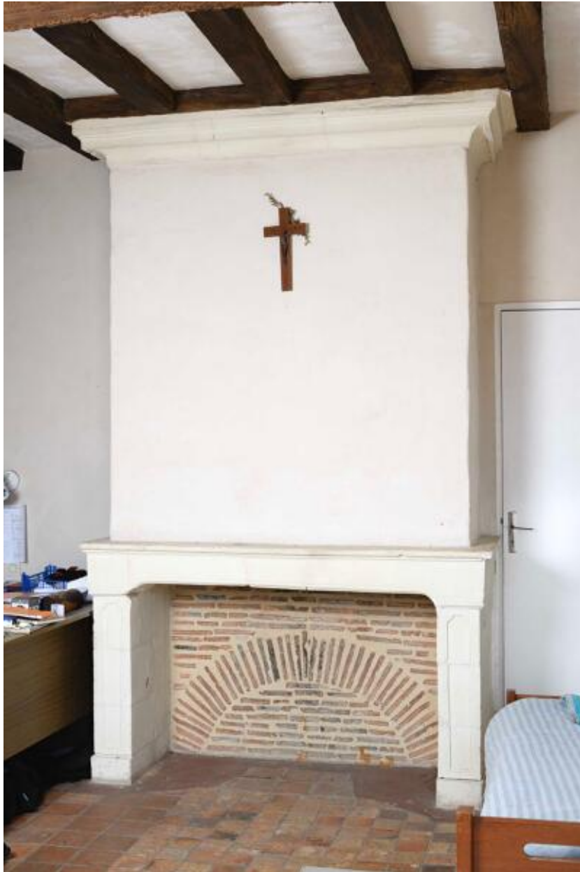
Détail de la cheminée de la chambre sud-ouest.