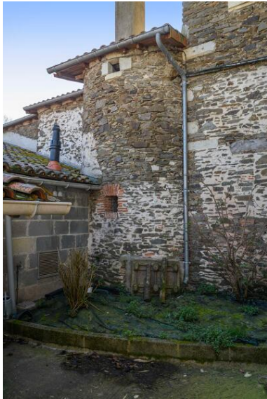
Vue de la tour circulaire adossée au mur nord de l'office.