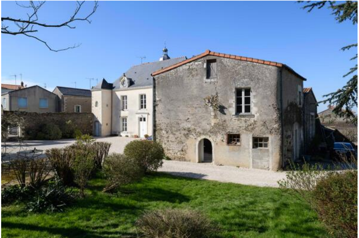
Vue du bâtiment sud.