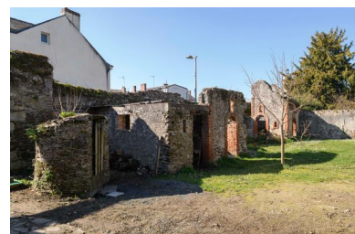
La ferme de la Cour. Vue des parties agricoles depuis le sud. IVR52_20254900322NUCA