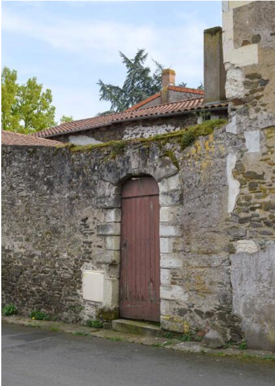
Détail de la porte piétonne, rue de la Chapelle.