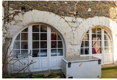
Détail des arcs sur le mur de pignon nord-est.