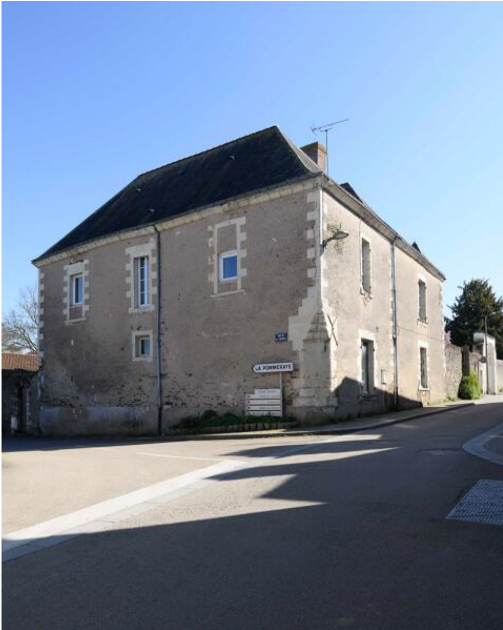
Vue du logis depuis la rue des Mauges, au nord.