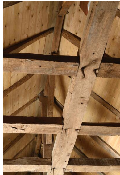
Détail de la charpente du logis.