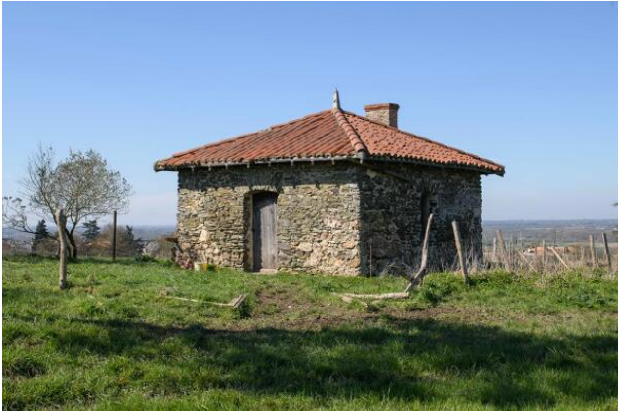
Vue de l'ancien pavillon de jardin, actuellement transformé en bergerie.