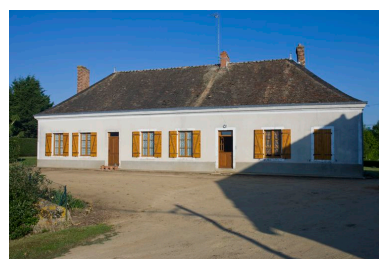
Logis : élévation antérieure. IVR52_20117200519NUCA