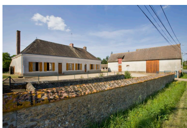
Vue générale depuis le sud. IVR52_20117200505NUCA