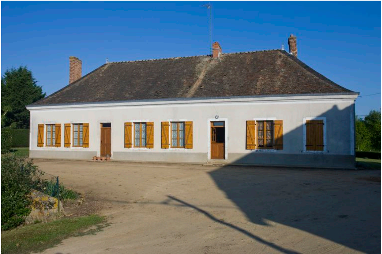
Logis : élévation antérieure.