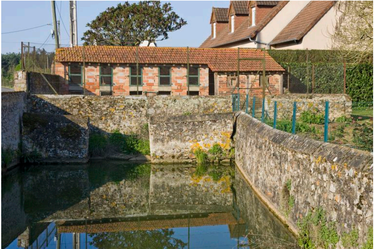
L'abreuvoir et le lavoir avec, à l'arrière-plan, le poulailler et les clapiers.