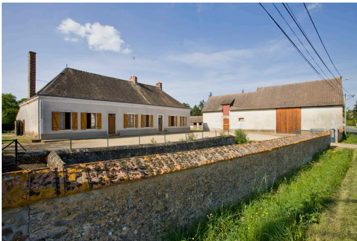
Vue générale depuis le sud.