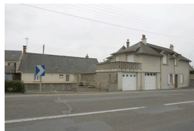
Vue depuis la route. La maison est à droite.