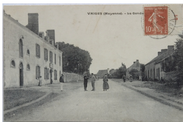
Carte postale, début du 20e siècle. La maison est au fond, dans l'axe de la route.