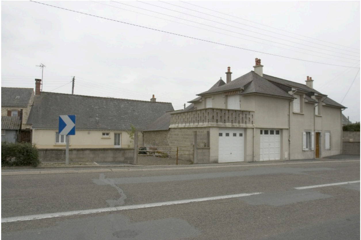
Vue depuis la route. La maison est à droite.