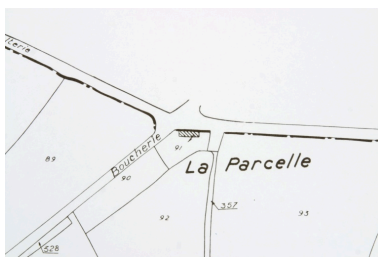
Extrait du plan cadastral révisé en 1936, réédité en 1982 et régulièrement mis à jour entre 1982 et 2002, section C2. IVR52_20045303411NUCA