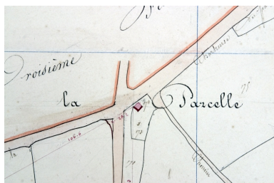
Extrait du plan cadastral de 1842, section C2. IVR52_20045302763NUCA