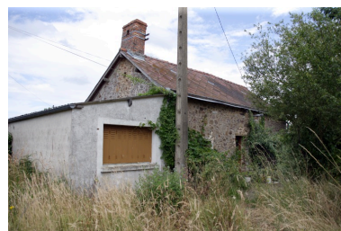
Vue d'ensemble depuis l'ouest. IVR52_20055301971NUCA