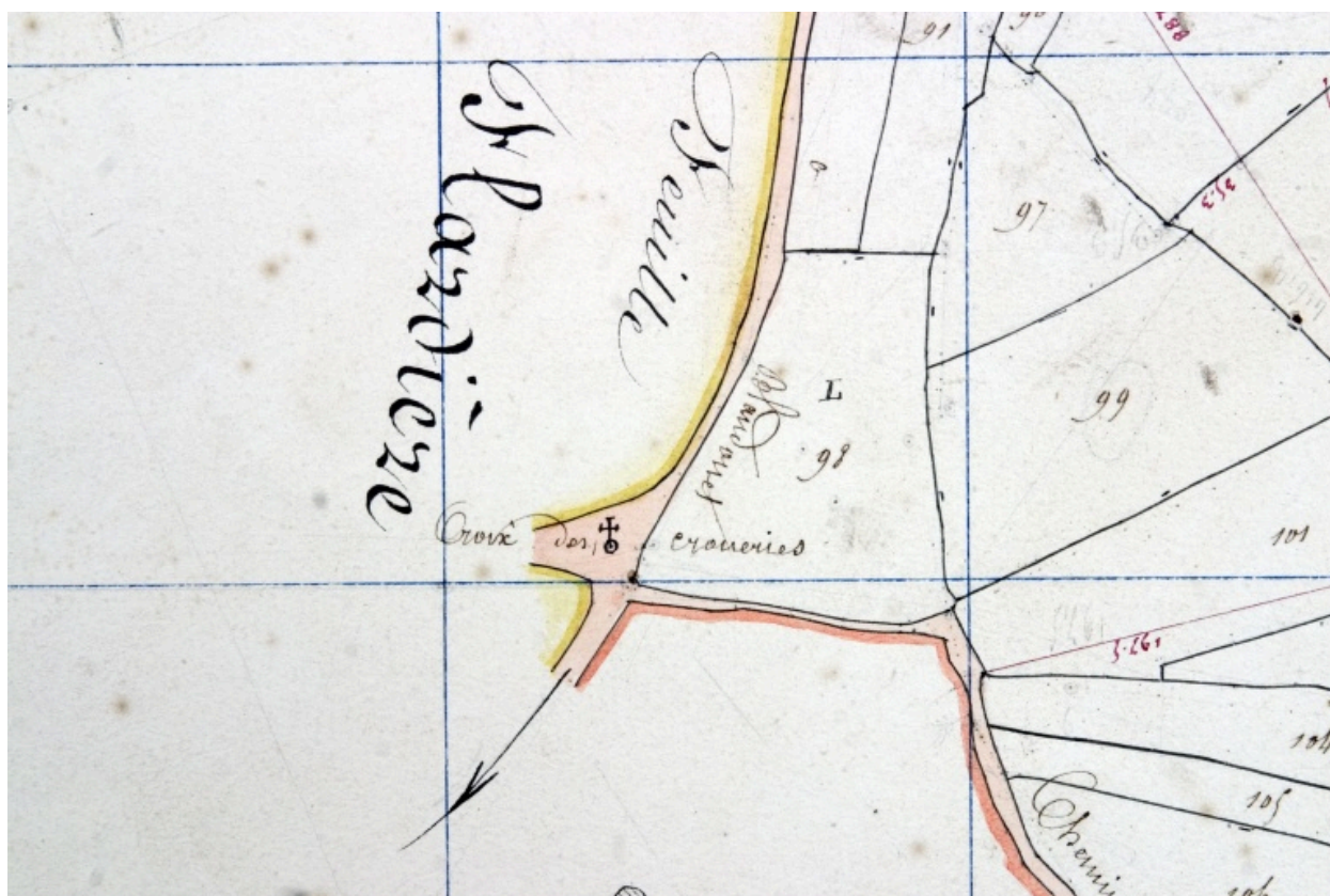
Croix des Crosneries. Extrait du plan cadastral de 1842, section B2.