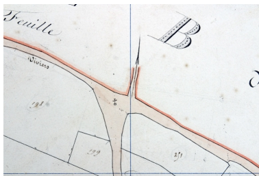
Croix des Crosneries. Extrait du plan cadastral de 1842, section A3.