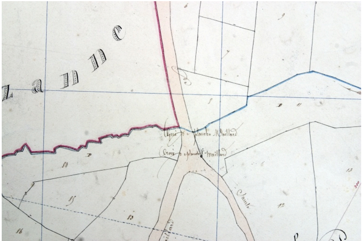
Croix de la Planche-Maillard, extrait du plan cadastral de 1842, section A1.