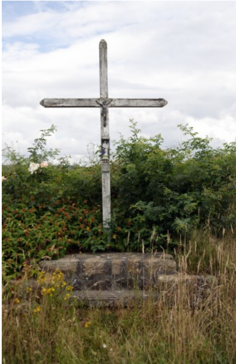
La croix de la Parcelle.