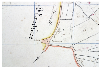
Croix des Crosneries. Extrait du plan cadastral de 1842, section B2.