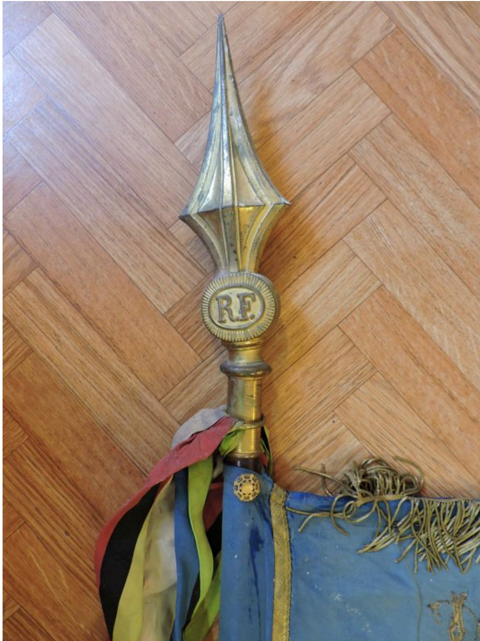
Pique au sommet de la hampe.