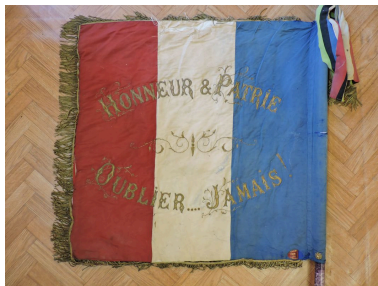
Vue d'ensemble au verso. IVR52_20198503471NUCA