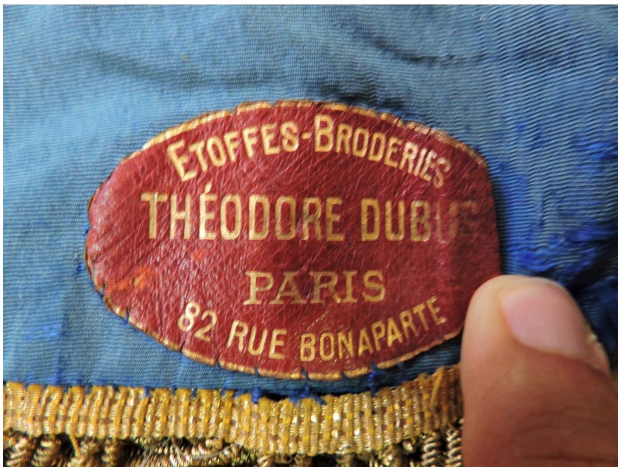
Marque du fabricant-marchand Théodore Dubus.