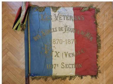
Vue d'ensemble au recto. IVR52_20198503469NUCA