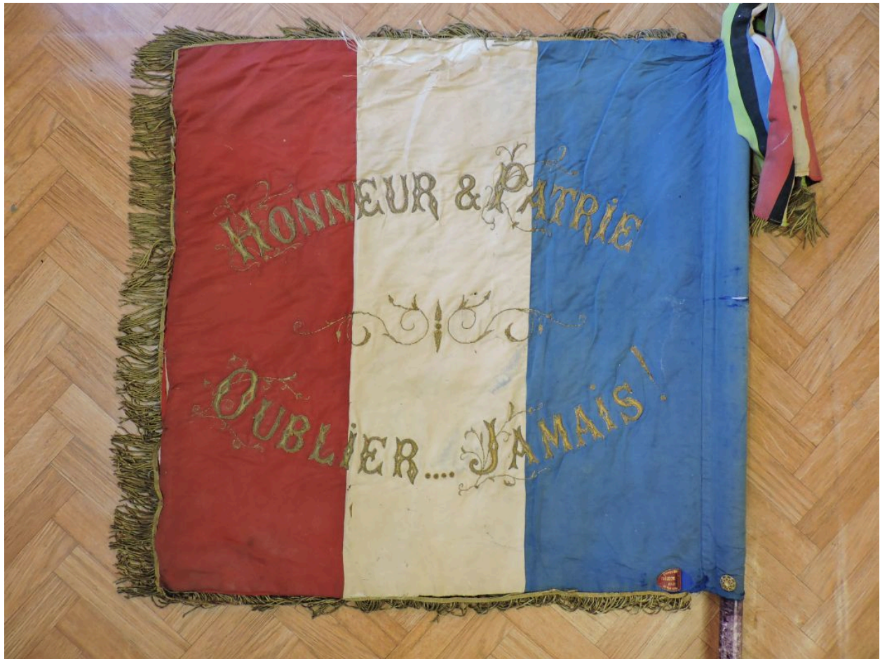
Vue d'ensemble au verso.