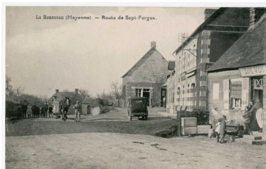
La route de Sept-Forges.