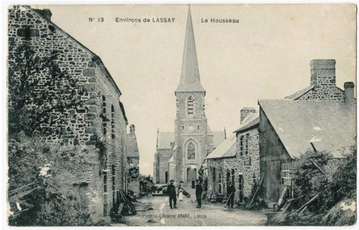
L'église, carte postale.