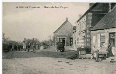
La route de Sept-Forges. IVR52_20205300511NUCA