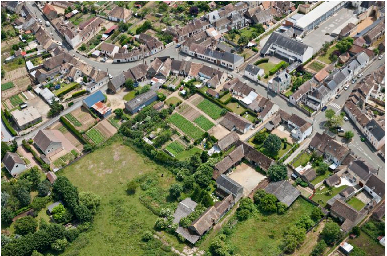
Vue aérienne de la partie nord de la ville, montrant les arrières du lotissement (angle supérieur gauche).