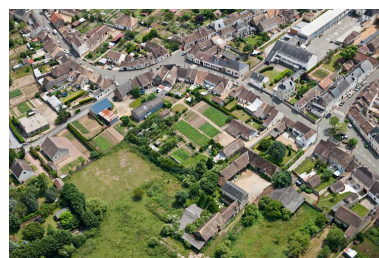
Vue aérienne de la partie nord de la ville, montrant les arrières du lotissement (angle supérieur gauche).