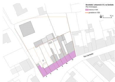
Plan chronologique. IVR52_20167200015NUDA