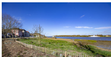
Vue sur la Loire depuis l'espace vert. IVR52_20214400175NUCA