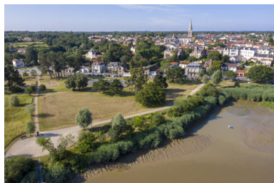
Vue aérienne du Site Bikini.