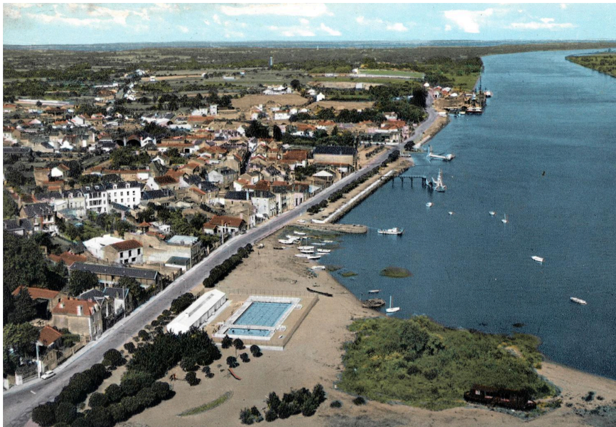
Vue aérienne du bourg et de l'ancienne piscine.