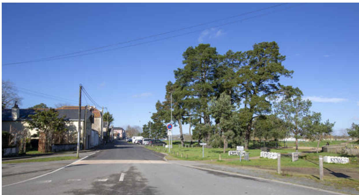
Entrée de l'espace vert depuis l'extrémité orientale du quai du Docteur-André-Provost.