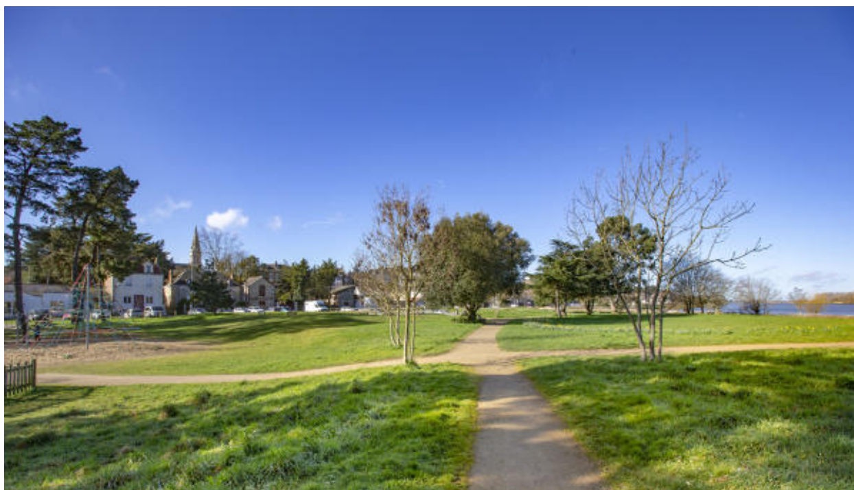
Vue générale du Site Bikini.