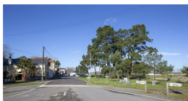
Entrée de l'espace vert depuis l'extrémité orientale du quai du Docteur-André-Provost. IVR52_20214400172NUCA