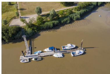
Ponton en Loire du Site Bikini.