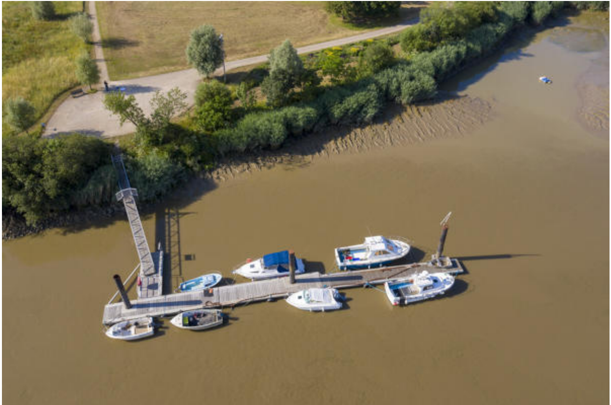
Ponton en Loire du Site Bikini.