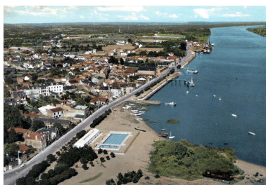
Vue aérienne du bourg et de l'ancienne piscine.