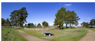
L'aire de jeu du Site Bikini.