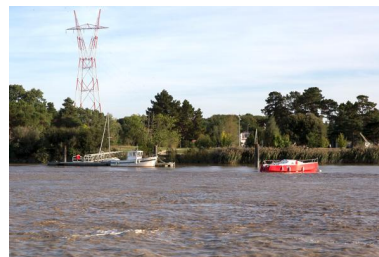
Vue du Site Bikini depuis la rive nord.