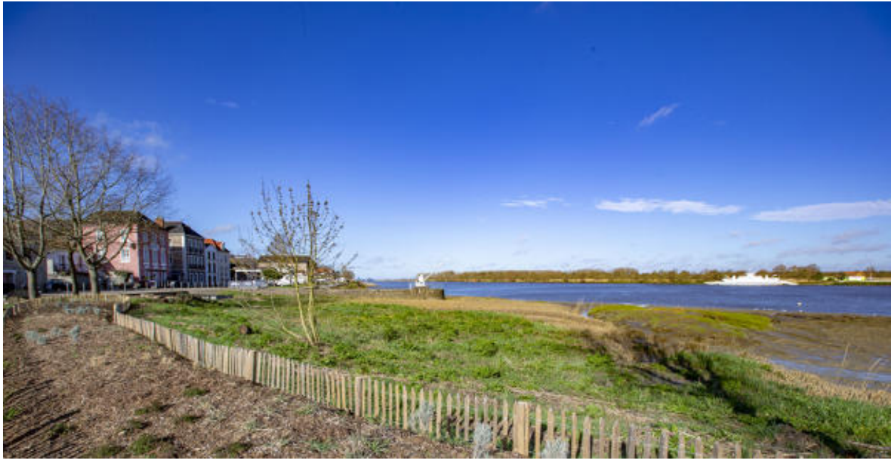
Vue sur la Loire depuis l'espace vert.