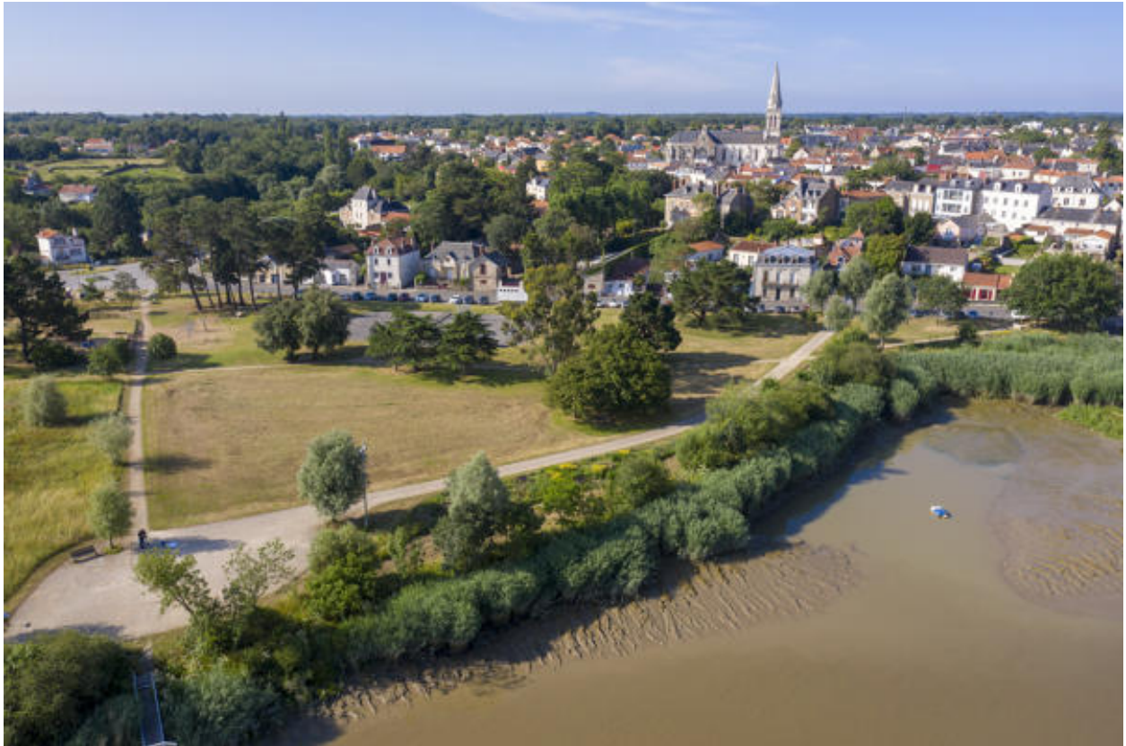
Vue aérienne du Site Bikini.