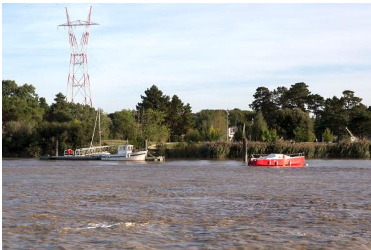
Vue du Site Bikini depuis la rive nord.