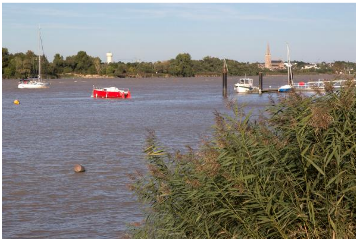
Vue sur la Loire depuis le Site Bikini.