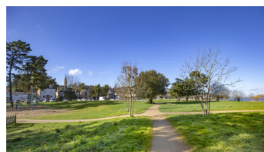
Vue générale du Site Bikini. IVR52_20214400174NUCA