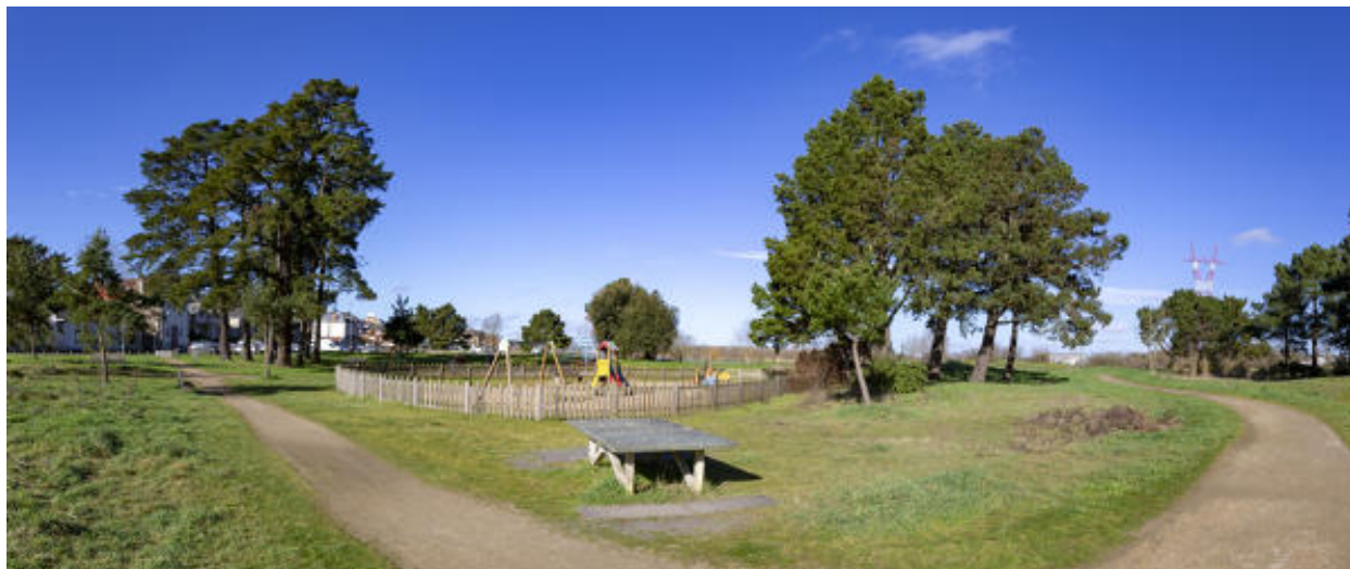
L'aire de jeu du Site Bikini.