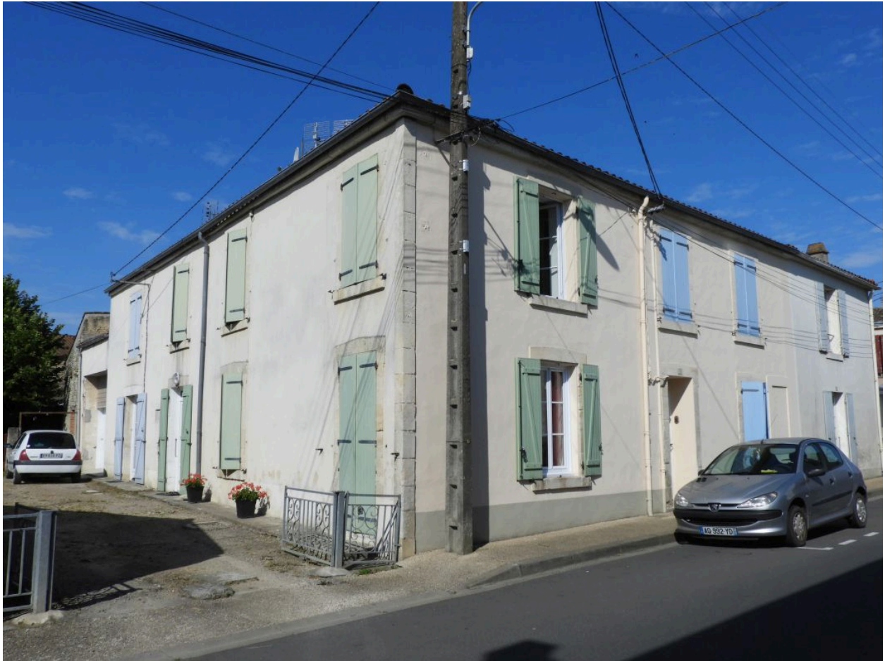
La maison vue depuis le nord-est.