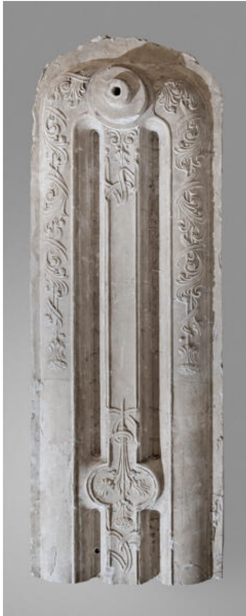
Moulage en plâtre d'un radiateur réalisé par l'atelier Cottereau pour la fonderie Chappée.