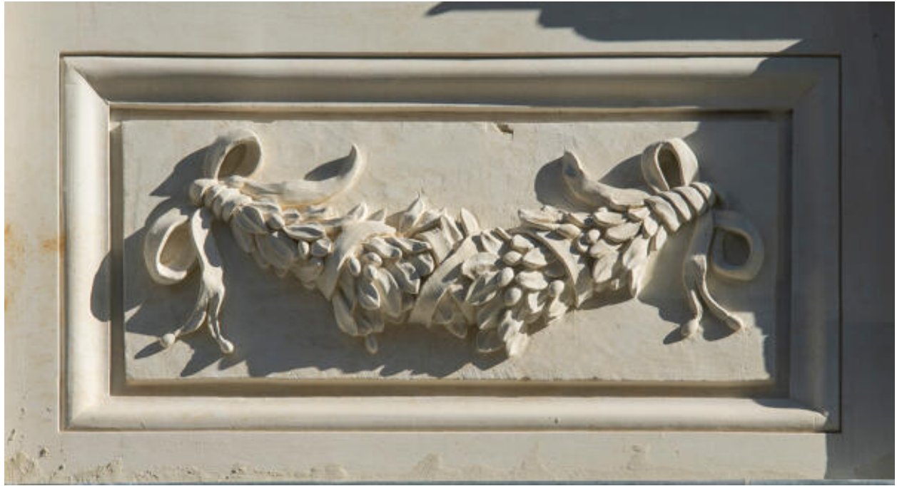
Détail de guirlande de fleurs en façade d'une maison rue du Clos-Margot.