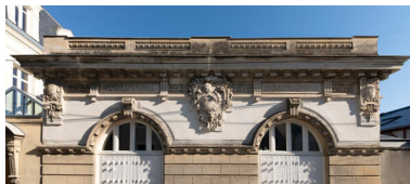
Détail du décor sous corniche de la façade principale de l'atelier rue du Clos-Margot.

IVR52_20237200305NUCA