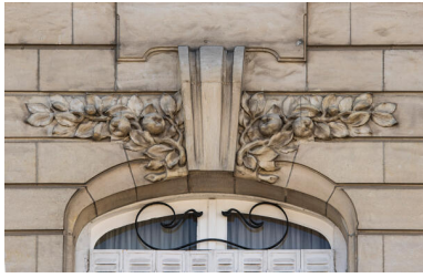
Détail de décor floral de part et d'autre de l'agrafe d'une fenêtre en façade principale d'une maison rue Gambetta. IVR52_20237200386NUCA