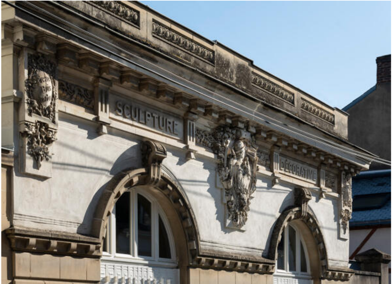
Détail de la partie sculptée en façade de l'atelier des Cottereau.