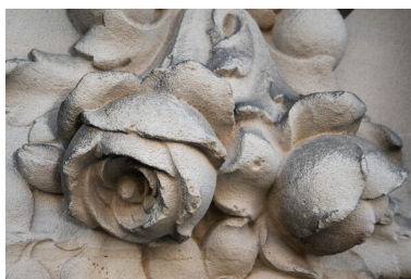
Détail de fleurs sculptées en façade avenue Bollée.

Phot. Thierry Seldubuisson IVR52_20237200283NUCA