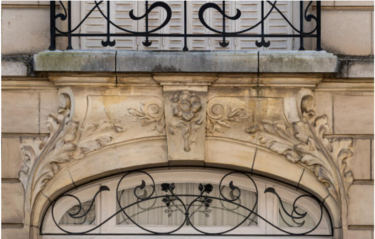
Détail de décor floral sur la façade d'une maison rue Gambetta.