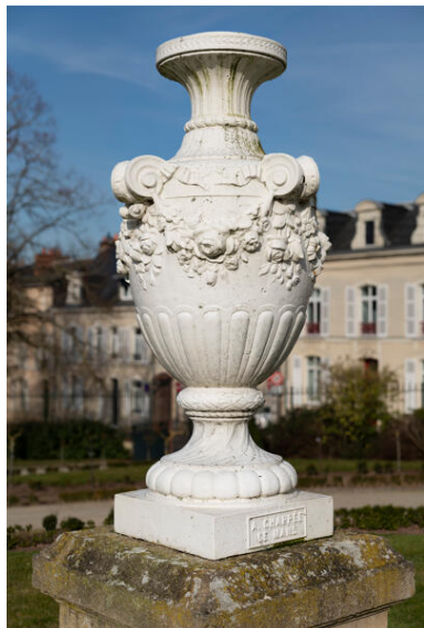
Vue du vase monumental dessiné par Alexandre Cottereau pour la fontaine monumentale créée par Chappée.

Phot. Thierry Seldubuisson IVR52_20237200294NUCA