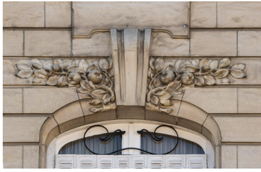
Détail de décor floral de part et d'autre de l'agrafe d'une fenêtre en façade principale d'une maison rue Gambetta. IVR52_20237200386NUCA