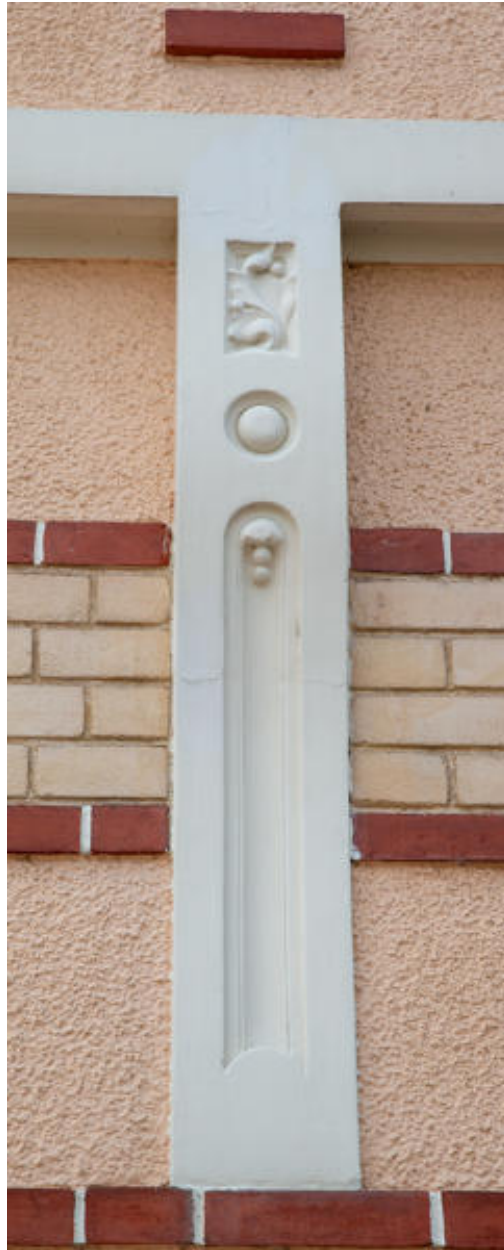
Vue du décor en façade d'une maison rue Gambetta sculpté par Cottereau.