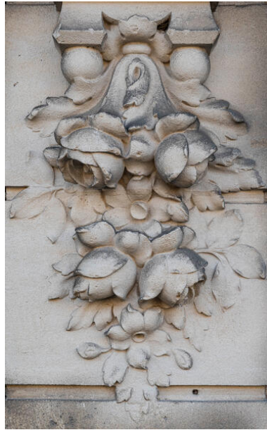
Détail de chutes de fleurs en façade d'une maison avenue Bollée. IVR52_20237200361NUCA