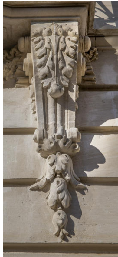
Vue d'une console de balcon sculptée rue Gambetta.