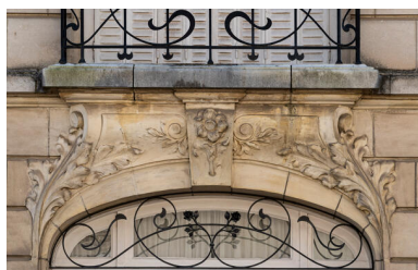
Détail de décor floral sur la façade d'une maison rue Gambetta.

IVR52_20237200294NUCA