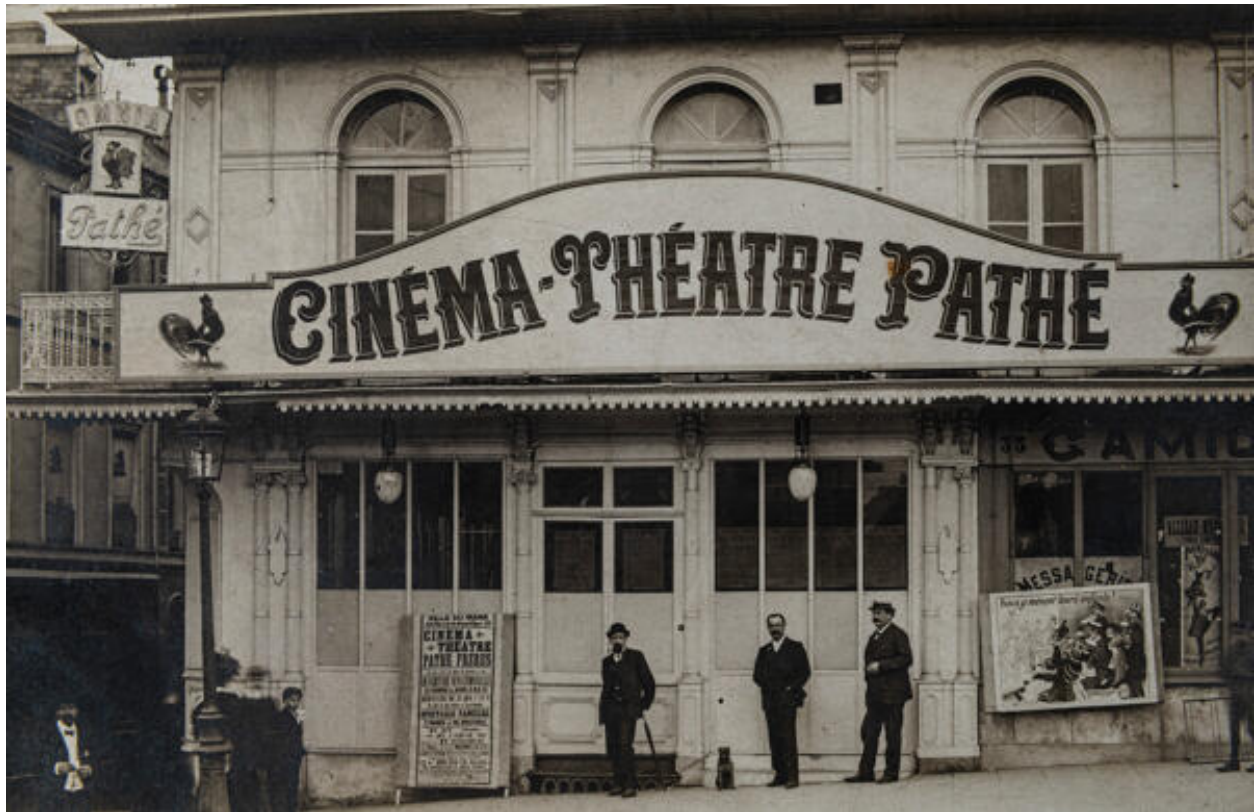
Vue du cinéma Pathé-Royal dont la façade a été réalisée par les sculpteurs Cottereau.