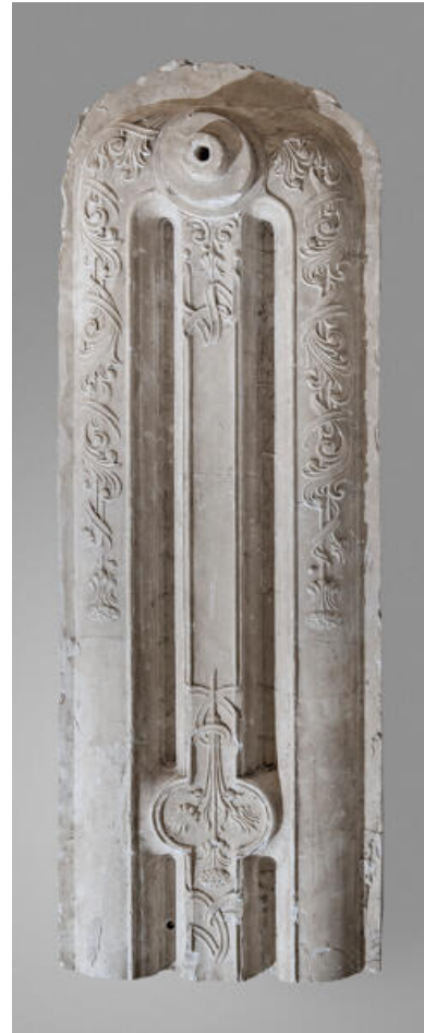
Moulage en plâtre d'un radiateur réalisé par l'atelier Cottureau pour la fonderie Chappée. IVR52_20237200291NUCA