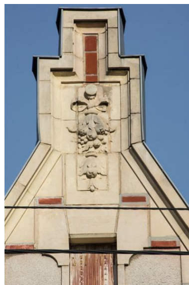
Vue d'un pignon sculpté d'une chute de fleur retenue par un ruban avenue Bollée.

IVR52_20237200277NUCA