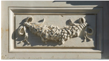
Détail de guirlande de fleurs en façade d'une maison rue du Clos-Margot. IVR52_20237200282NUCA