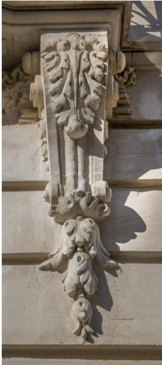
Vue d'une console de balcon sculptée rue Gambetta.