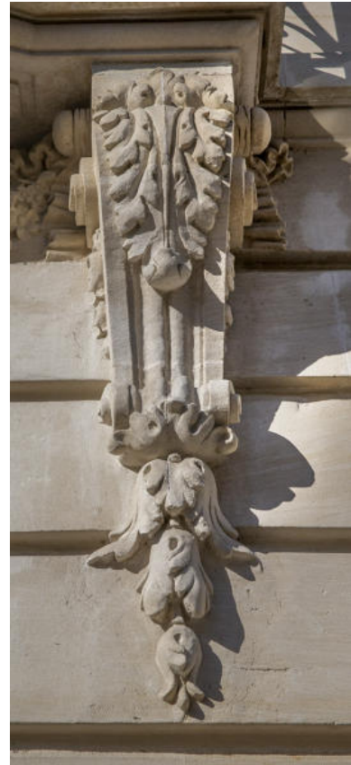
Vue d'une console de balcon sculptée rue Gambetta. IVR52_20197201846NUCA