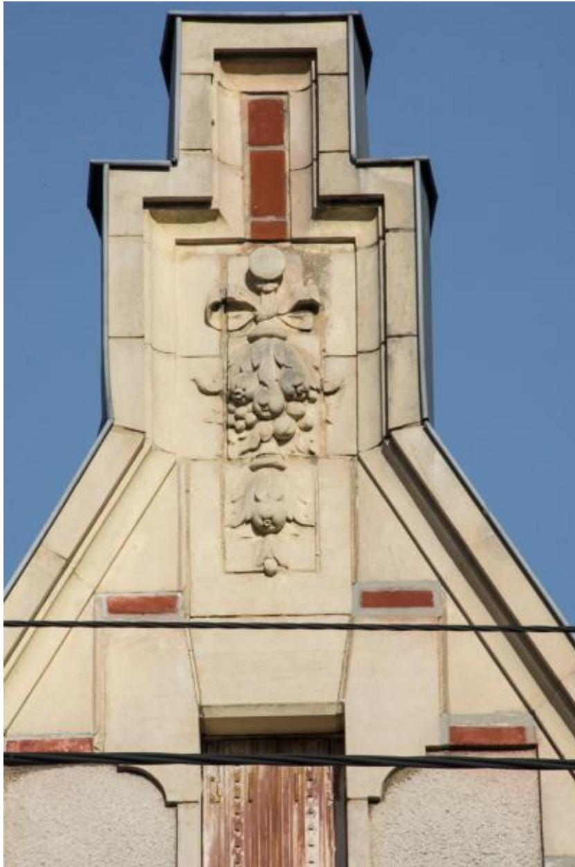
Vue d'un pignon sculpté d'une chute de fleur retenue par un ruban avenue Bollée.