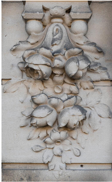
Détail de chutes de fleurs en façade d'une maison avenue Bollée.