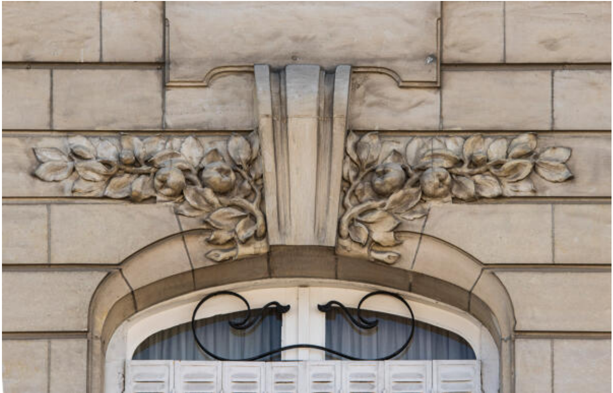
Détail de décor floral de part et d'autre de l'agrafe d'une fenêtre en façade principale d'une maison rue Gambetta.