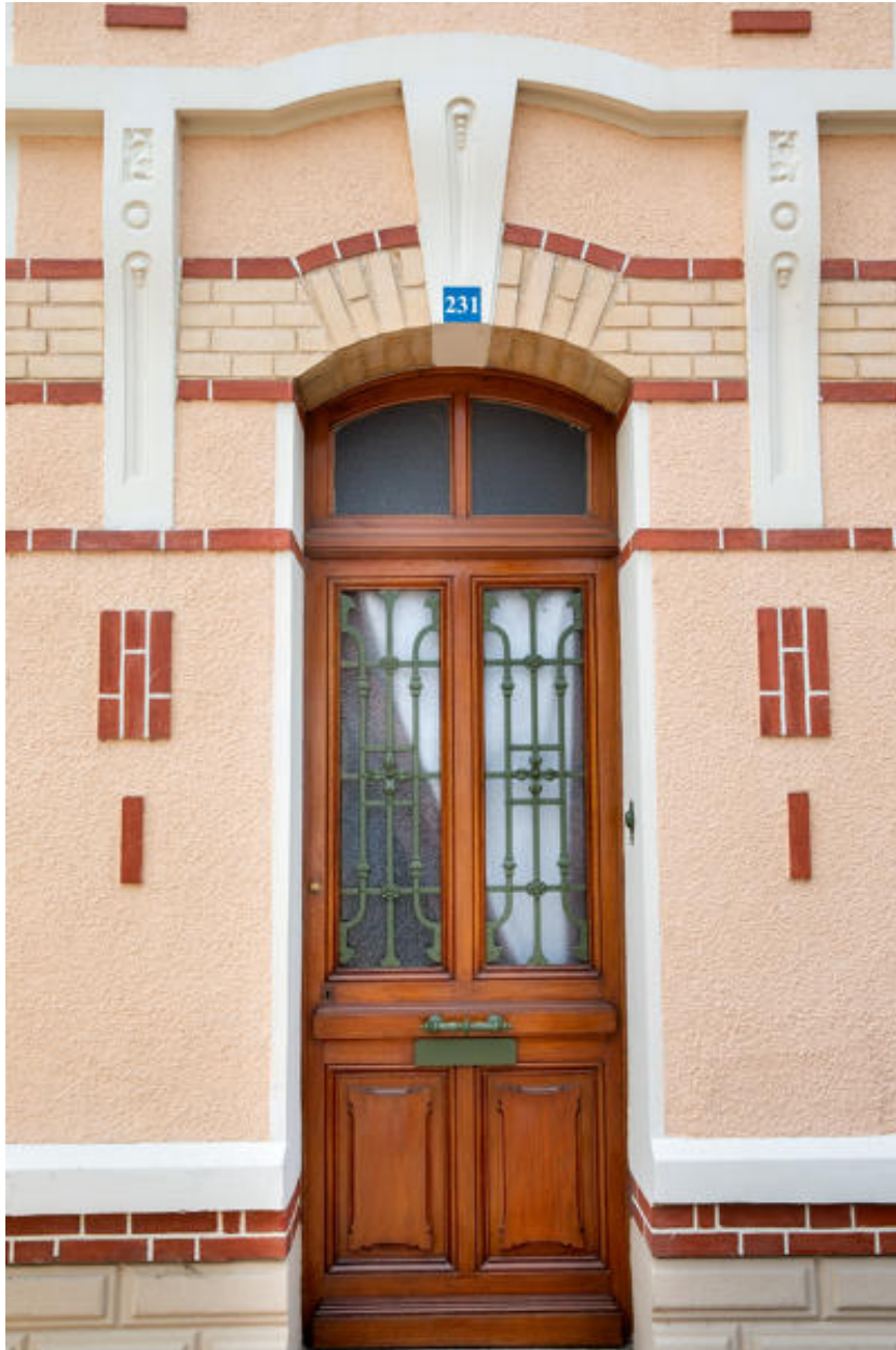
Vue du décor autour de la porte d'entrée d'une maison rue Gambetta sculpté par Cottereau.