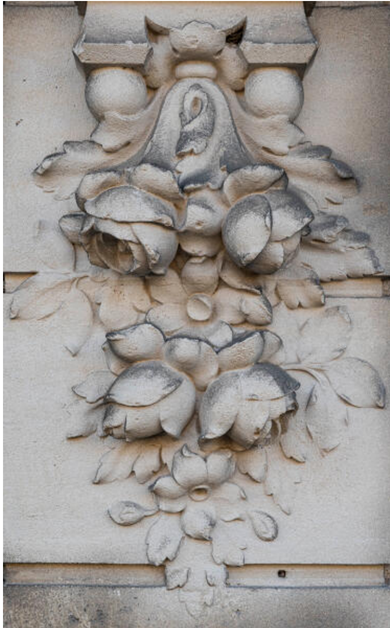
Détail de chutes de fleurs en façade d'une maison avenue Bollée.