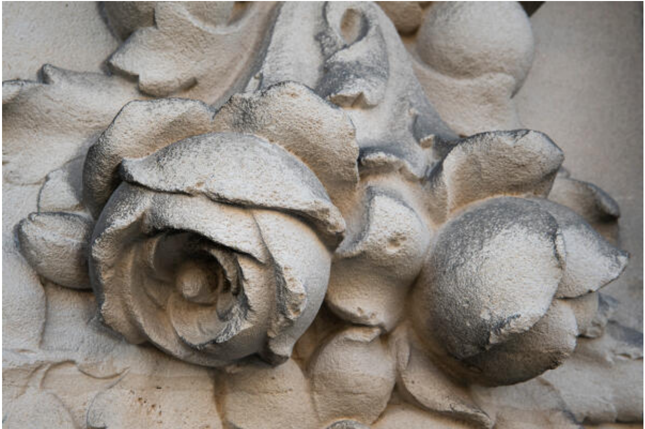
Détail de fleurs sculptées en façade avenue Bollée.