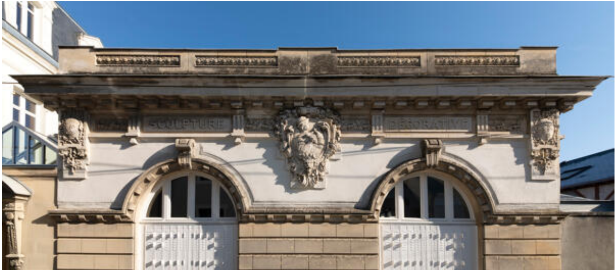
Détail du décor sous corniche de la façade principale de l'atelier rue du Clos-Margot.