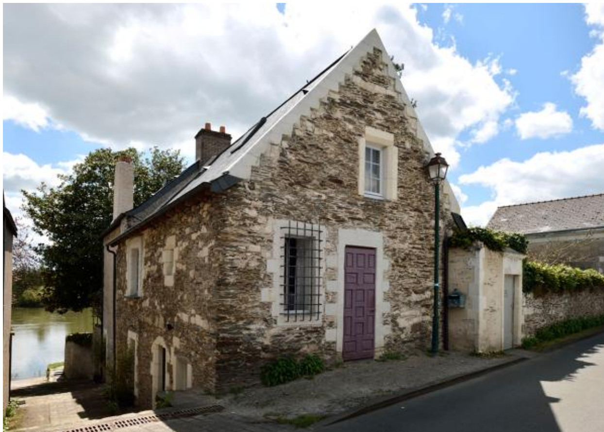
Vue du 41 route de Port-Thibault.