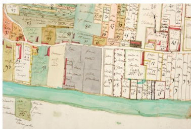
Extrait du plan visuel du fief de Port-Thibault à Sainte-Gemmes-sur-Loire. Vers 1773.

Repro. Bruno Rousseau IVR52_20134900833NUCA