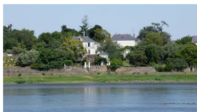
Vue du village de Port-Thibault depuis la rive gauche de la Loire.