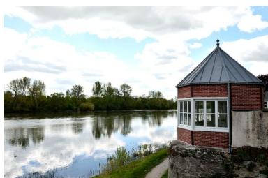
Vue du pavillon de l'ancien hôtel- restaurant Le Pavillon bleu.