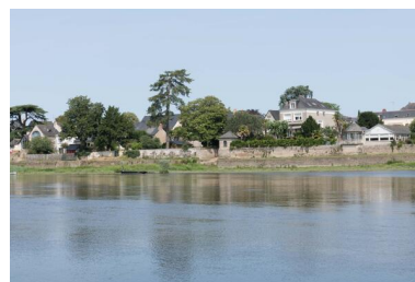
Vue du village de Port-Thibault depuis la rive gauche de la Loire.

Phot. Armelle Maugin IVR52_20204900190NUCA