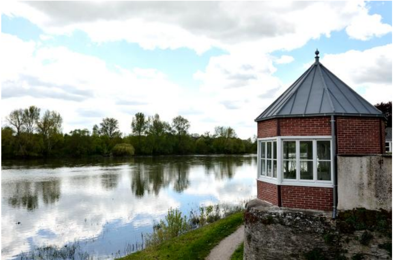
Vue du pavillon de l'ancien hôtel-restaurant Le Pavillon bleu.