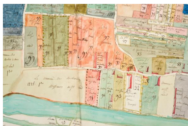
Extrait du plan visuel du fief de Port-Thibault à Sainte-Gemmes-sur-Loire. Vers 1773.

IVR52_20134900839NUCA