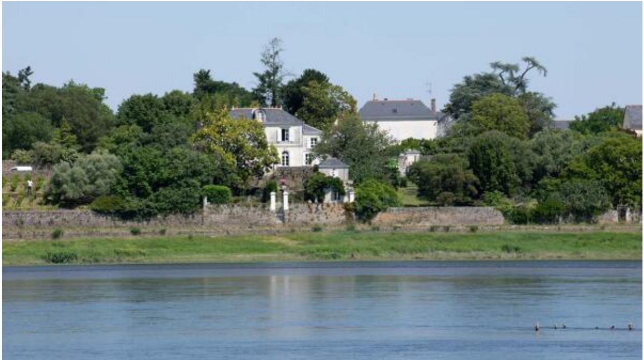
Vue du village de Port-Thibault depuis la rive gauche de la Loire.