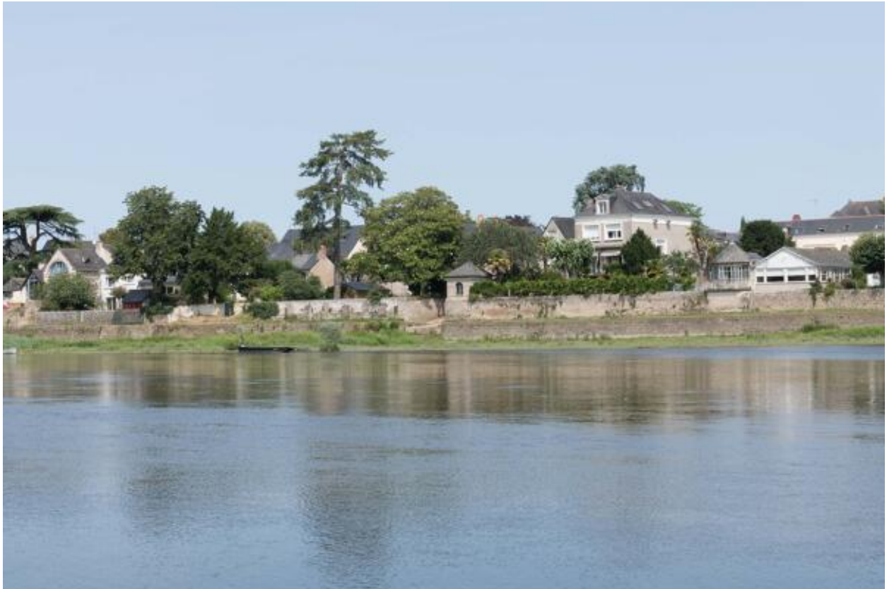
Vue du village de Port-Thibault depuis la rive gauche de la Loire.