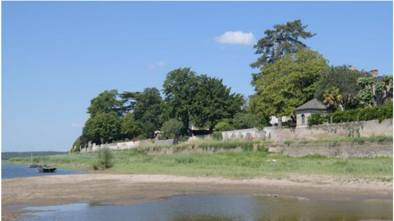
Vue du village de Port-Thibault depuis la rive gauche de la Loire.