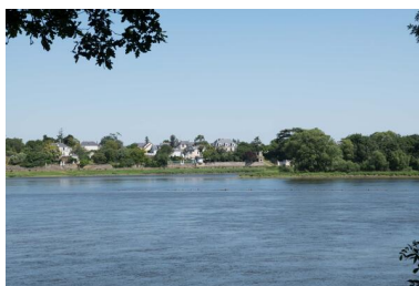
Vue du village de Port-Thibault depuis la rive gauche de la Loire.

Phot. Armelle Maugin IVR52_20204900189NUCA