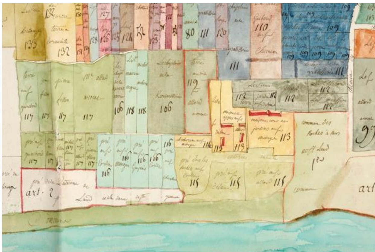
Extrait du plan visuel du fief de Port-Thibault à Sainte-Gemmes-sur-Loire. Vers 1773.