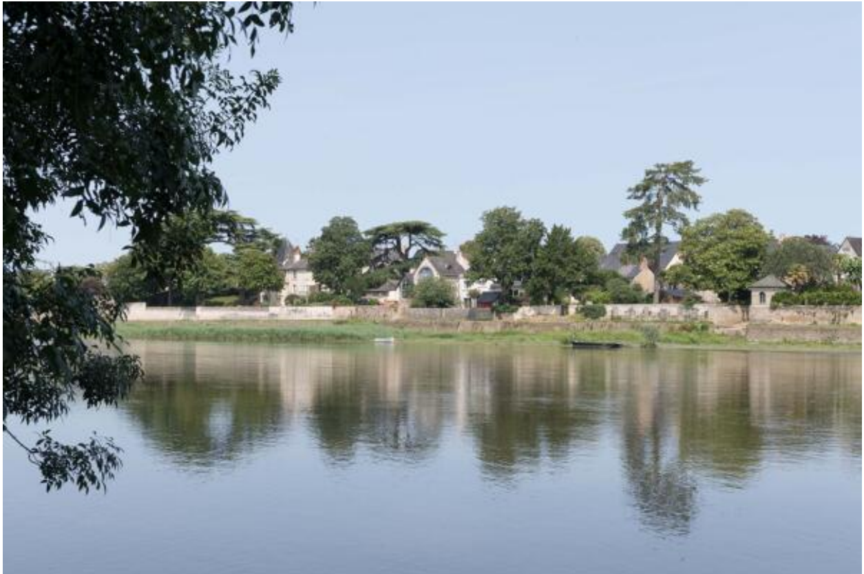
Vue du village de Port-Thibault depuis la rive gauche de la Loire.