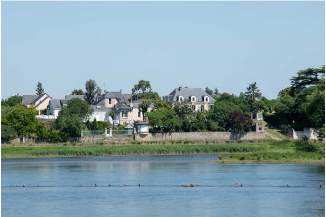
Vue du village de Port-Thibault depuis la rive gauche de la Loire.