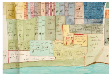
Extrait du plan visuel du fief de Port-Thibault à Sainte-Gemmes-sur-Loire. Vers 1773.

IVR52_20134900838NUCA