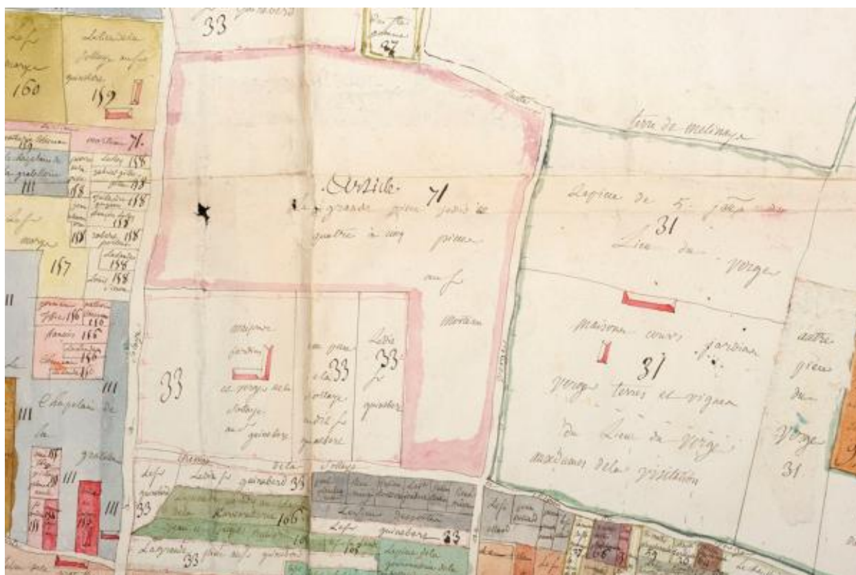
Extrait du plan visuel du fief de Port-Thibault à Sainte-Gemmes-sur-Loire. Vers 1773.