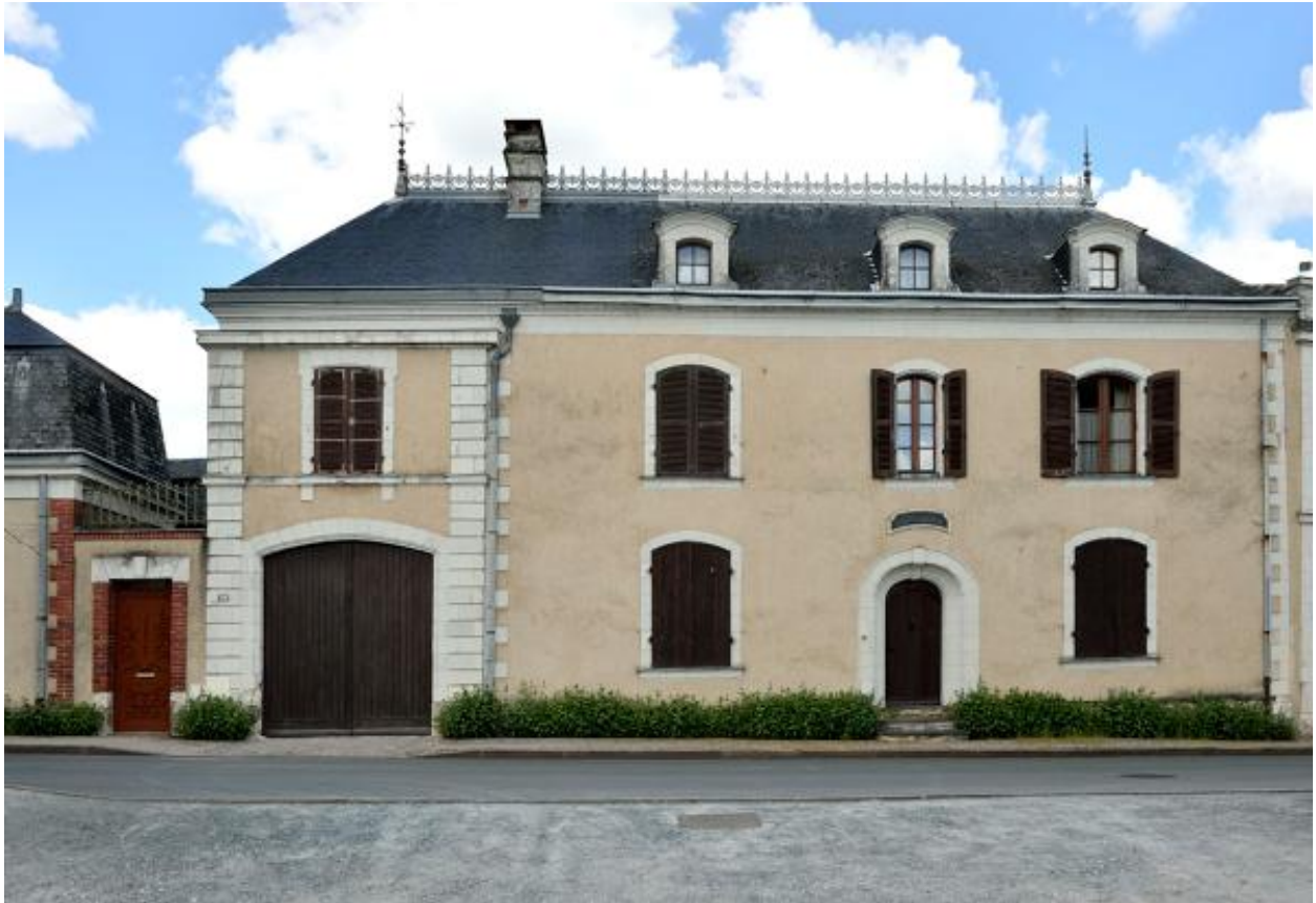
Vue de la maison dite Le Cloteau. 34 route de port-Thibault.