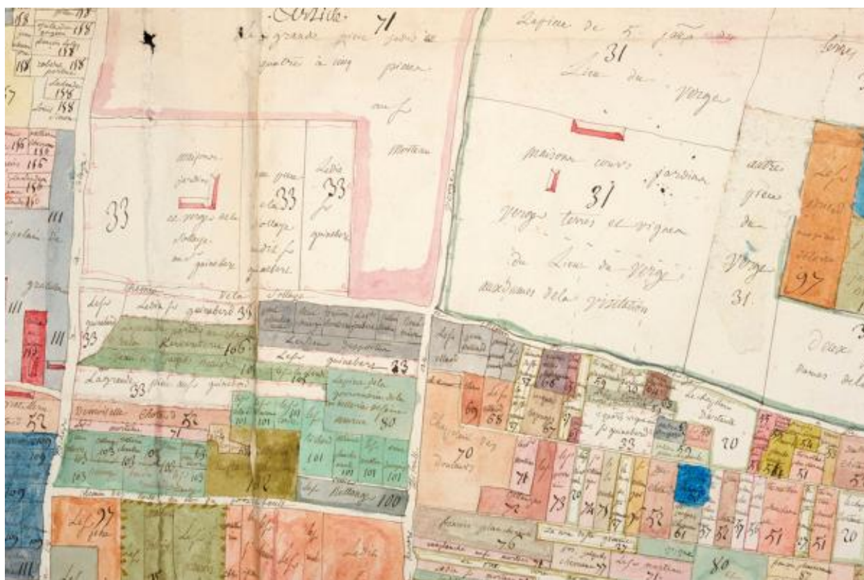
Extrait du plan visuel du fief de Port-Thibault à Sainte-Gemmes-sur-Loire. Vers 1773.