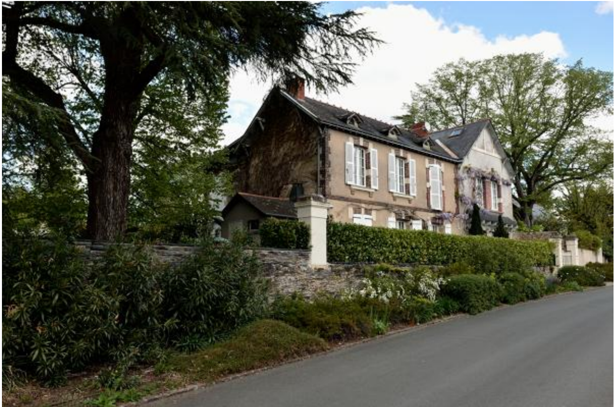
Vue du 30 route de Port-Thibault.