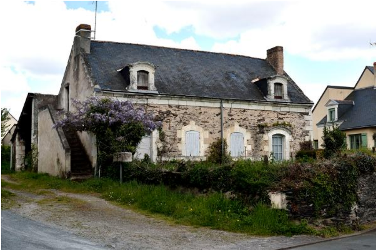
Vue du 24 route de Port-Thibault.