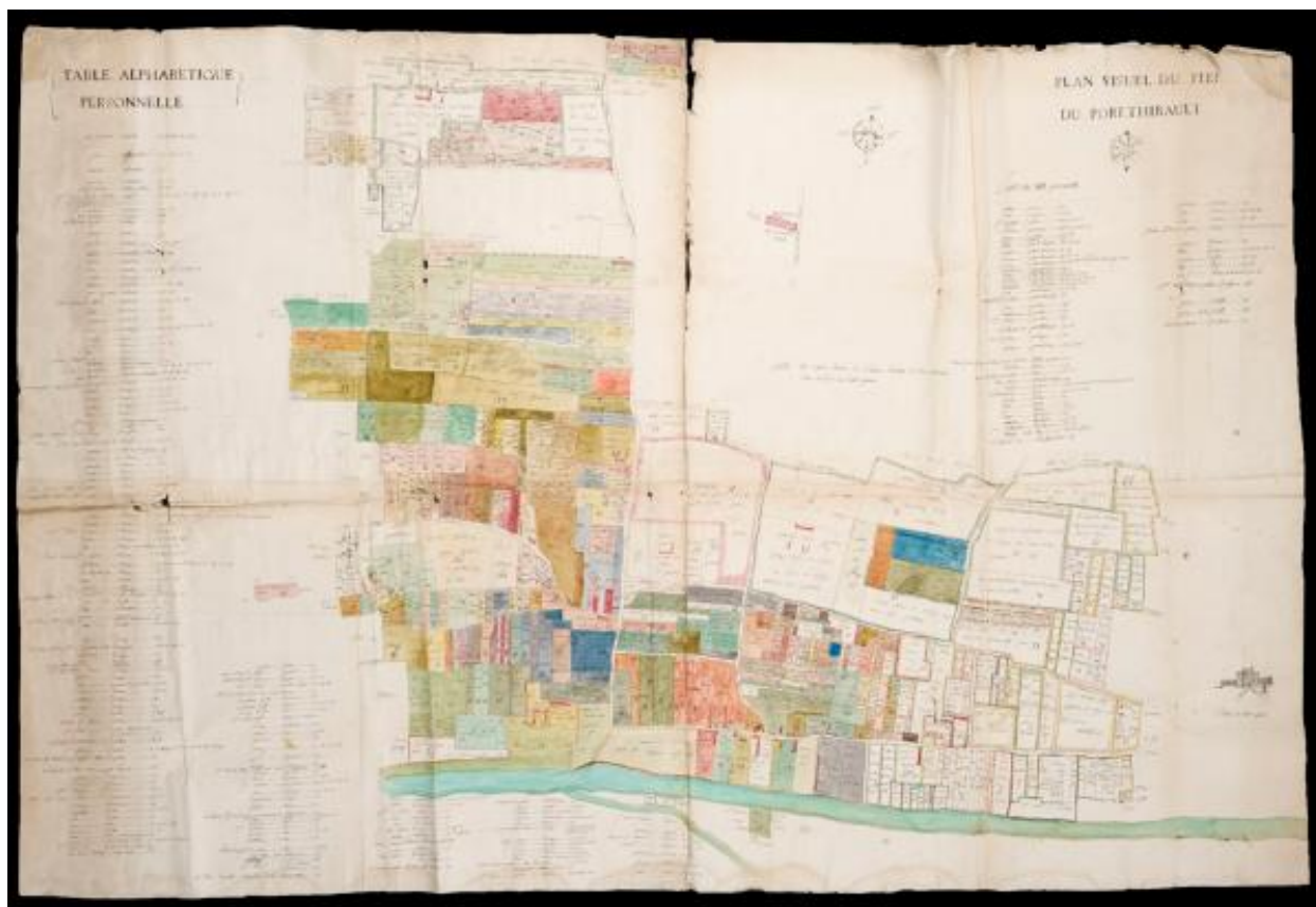
Plan visuel du fief de Port-Thibault à Sainte-Gemmes-sur-Loire. Vers 1773.