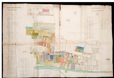
Plan visuel du fief de Port-Thibault à Sainte-Gemmes-sur-Loire. Vers 1773.

IVR52_20134900833NUCA