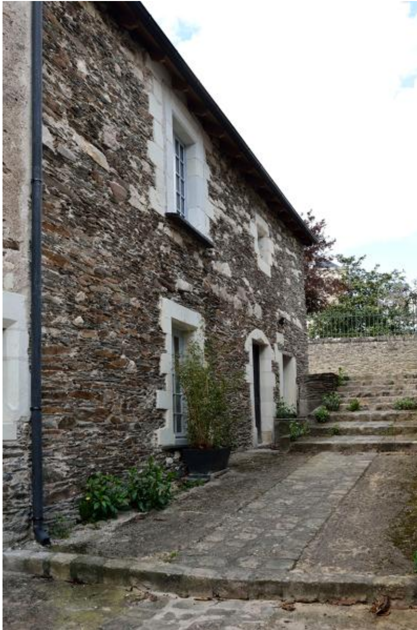
Vue du 41 route de Port-Thibault.