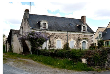
Vue du 24 route de Port-Thibault. IVR52_20164900401NUCA