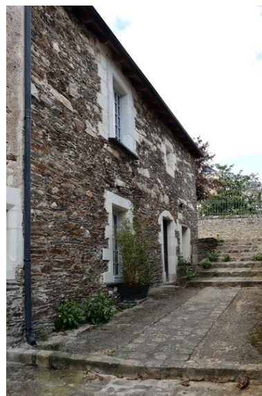
Vue du 41 route de Port-Thibault.