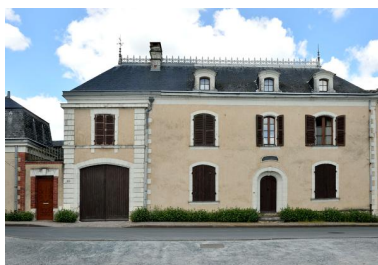
Vue de la maison dite Le Cloteau. 34 route de port-Thibault. IVR52_20164900403NUCA