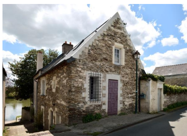
Vue du 41 route de Port-Thibault. IVR52_20164900406NUCA