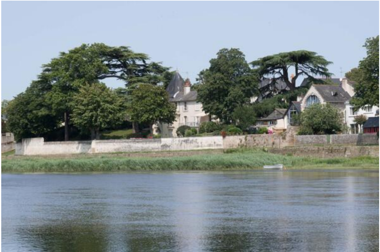
Vue du village de Port-Thibault depuis la rive gauche de la Loire.