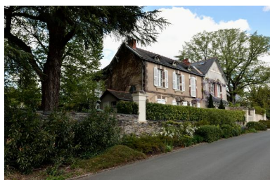
Vue du 30 route de Port-Thibault.