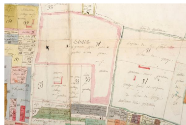
Extrait du plan visuel du fief de Port-Thibault à Sainte-Gemmes-sur-Loire. Vers 1773.

Repro. Bruno Rousseau IVR52_20134900836NUCA