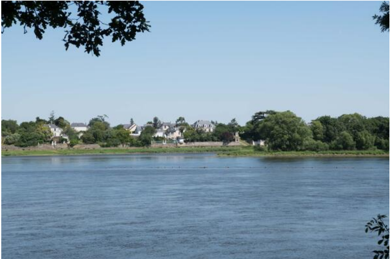
Vue du village de Port-Thibault depuis la rive gauche de la Loire.