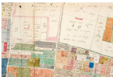
Extrait du plan visuel du fief de Port-Thibault à Sainte-Gemmes-sur-Loire. Vers 1773.

IVR52_20134900835NUCA