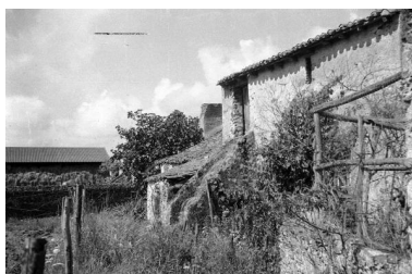
La Grande-Noue. Vue d'une ferme (détuite) prise lors du pré-inventaire de 1972. IVR52_19724900469Z