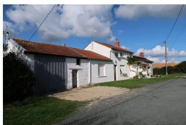
Vue de la rangée de fermes n°1 depuis le sud-ouest. IVR52_20254900772NUCA