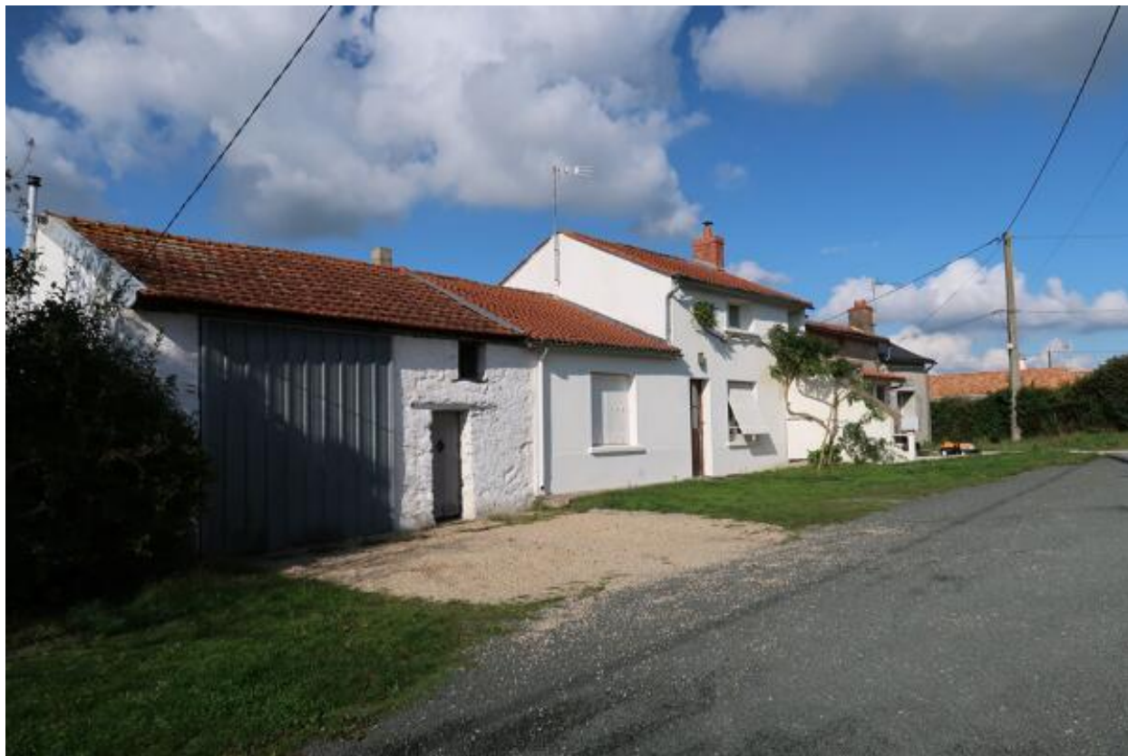
Vue de la rangée de fermes n°1 depuis le sud-ouest.