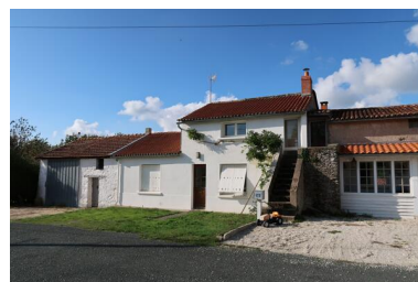
Vue de la rangée de fermes n°1 depuis le sud-est.