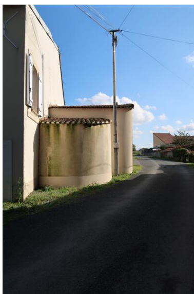
Rangée de fermes n°2. Détail d'un four à pain. IVR52_20254900774NUCA