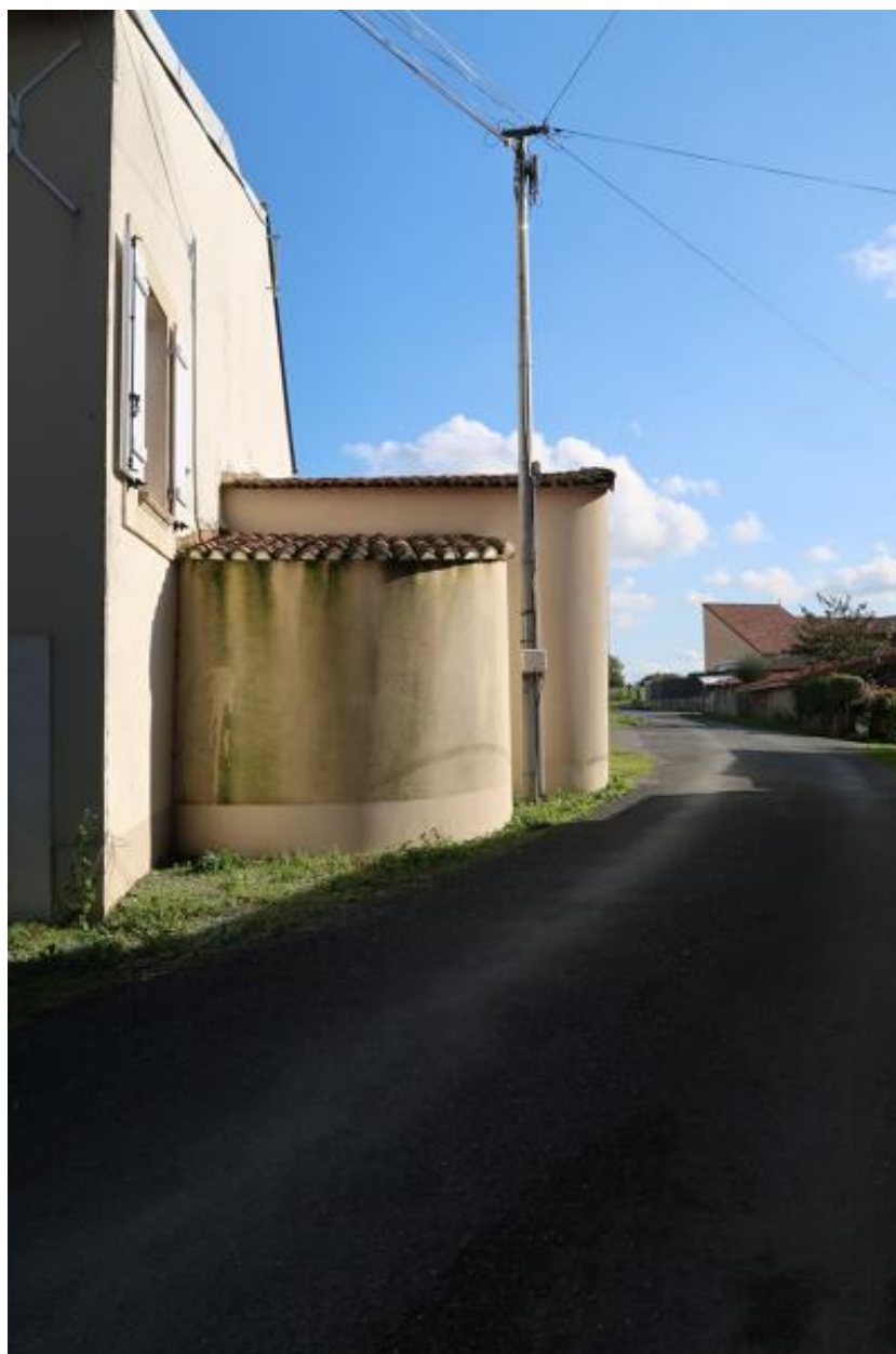
Rangée de fermes n°2. Détail d'un four à pain.