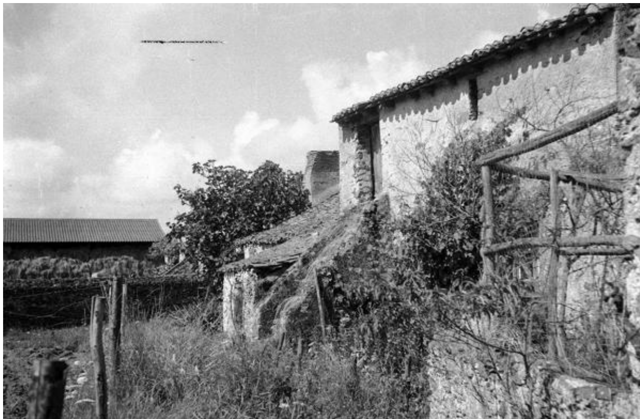
La Grande-Noue. Vue d'une ferme (détuite) prise lors du pré-inventaire de 1972.