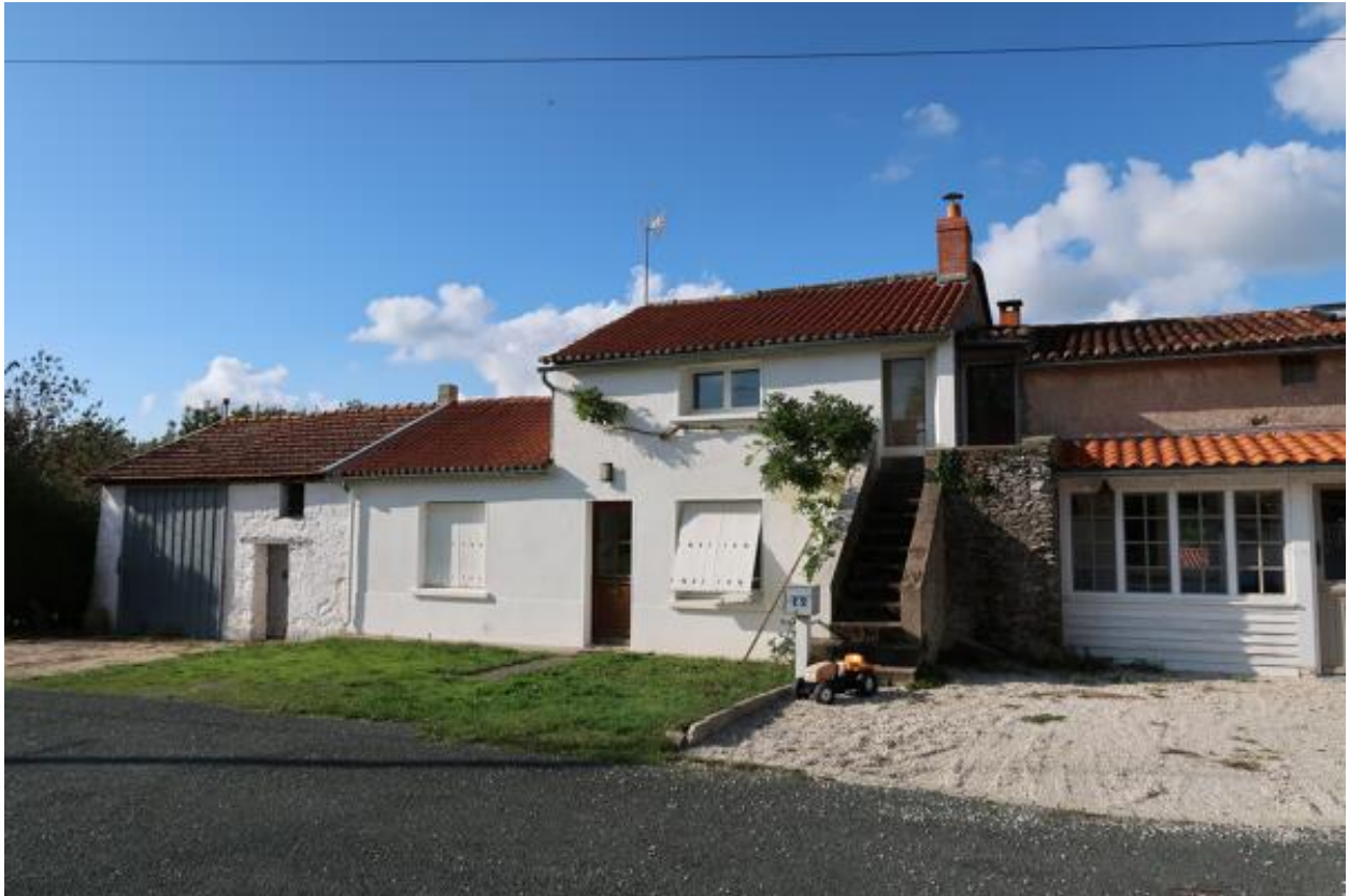
Vue de la rangée de fermes n°1 depuis le sud-est.