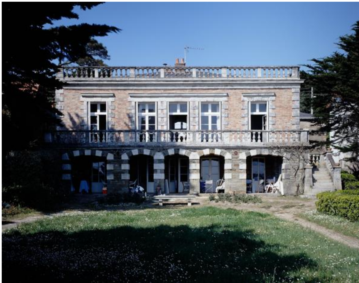
Villa Magdalena, élévation sud, face à la mer.