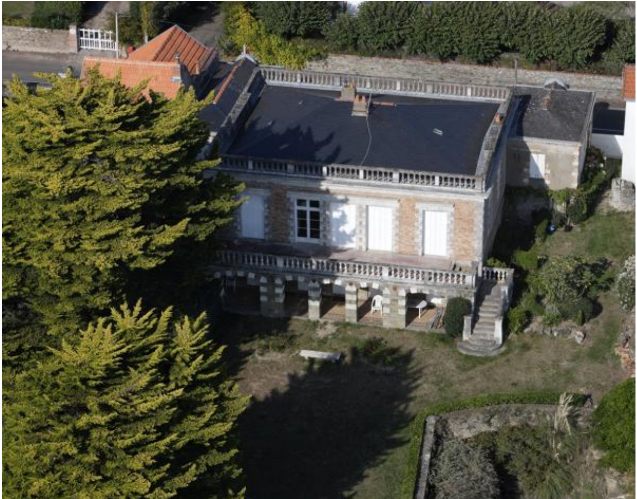
Vue aérienne de la villa Magdalena.