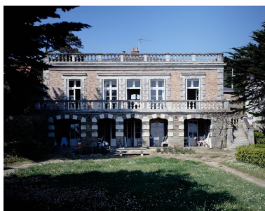
Villa Magdalena, élévation sud, face à la mer. IVR52_19954400241VA