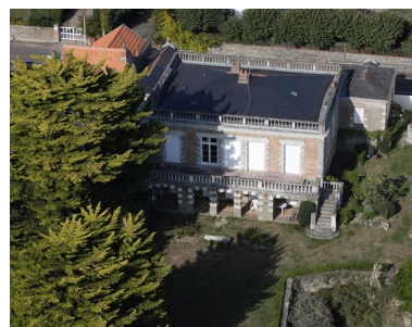
Vue aérienne de la villa Magdalena. IVR52_20114401152NUCA