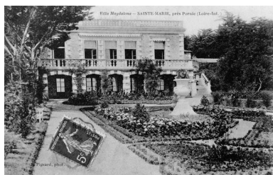
Elévation postérieure de la villa, face à la mer. Carte postale, IVR52_19944400457X