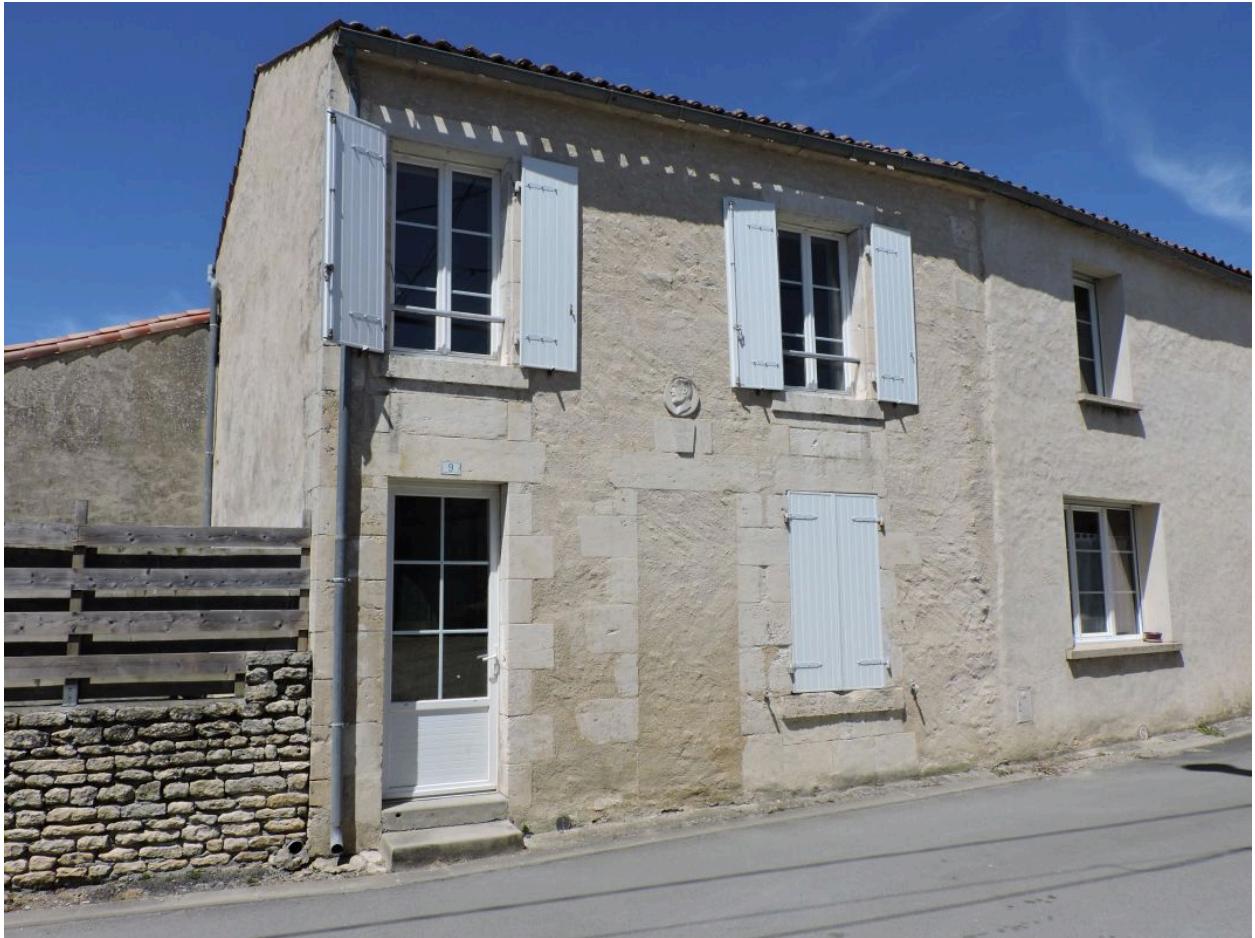
La maison vue depuis le sud.