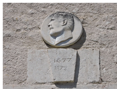
La clé de linteau réemployée, avec les dates 1677 et 1872, et le portrait sculpté en bas-relief.