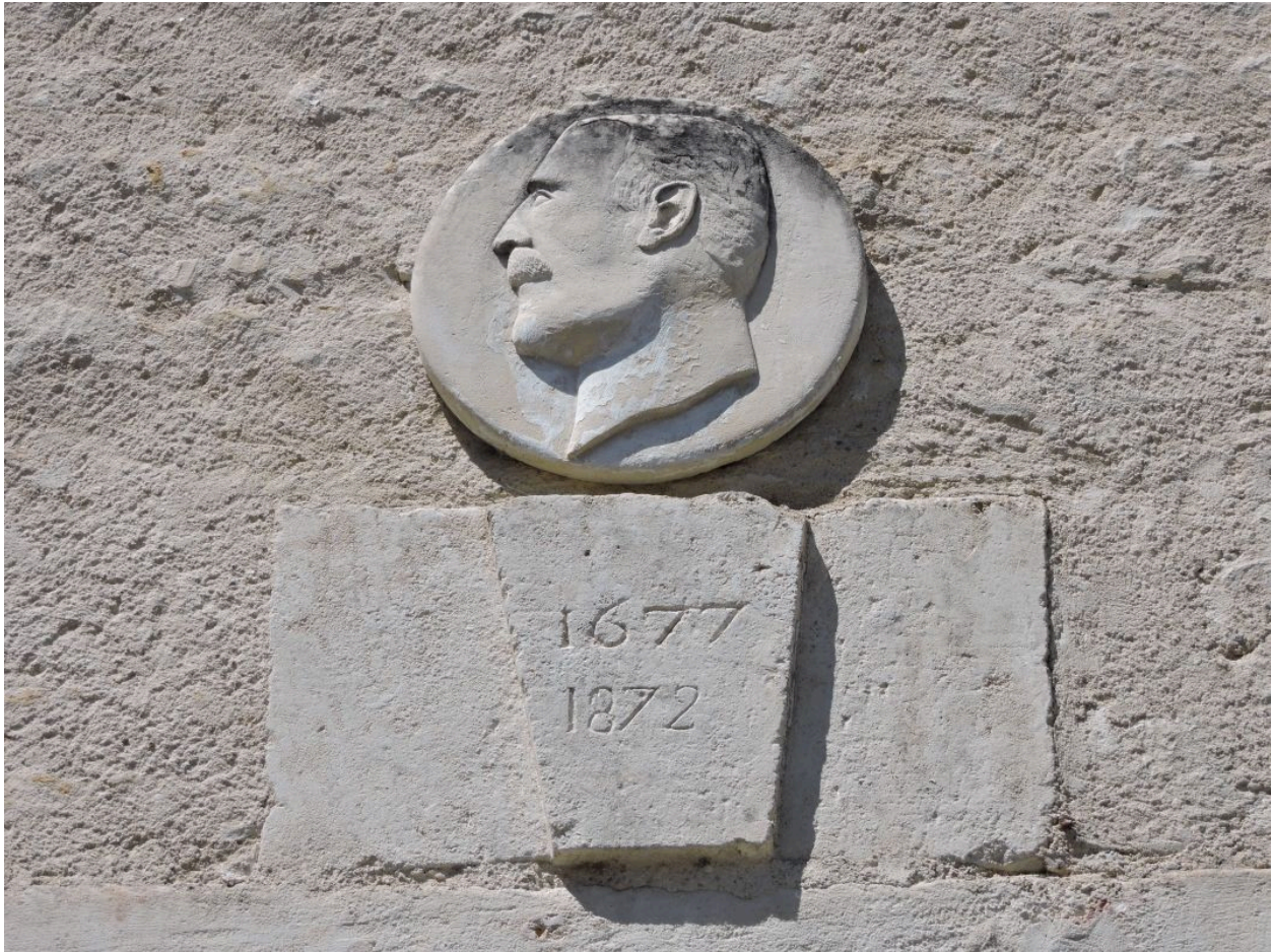
La clé de linteau remployée, avec les dates 1677 et 1872, et le portrait sculpté en bas-relief.