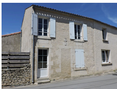
La maison vue depuis le sud.