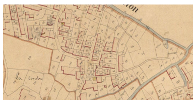
La parcelle 238, en bas, sur le plan cadastral de 1836.