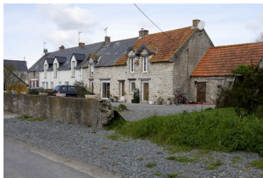
Vue d'ensemble de la rangée depuis le sud-est.