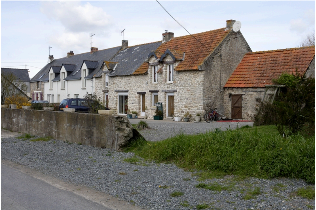
Vue d'ensemble de la rangée depuis le sud-est.