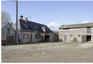
Le logis et l'étable-grange vus depuis la cour au sud-est.