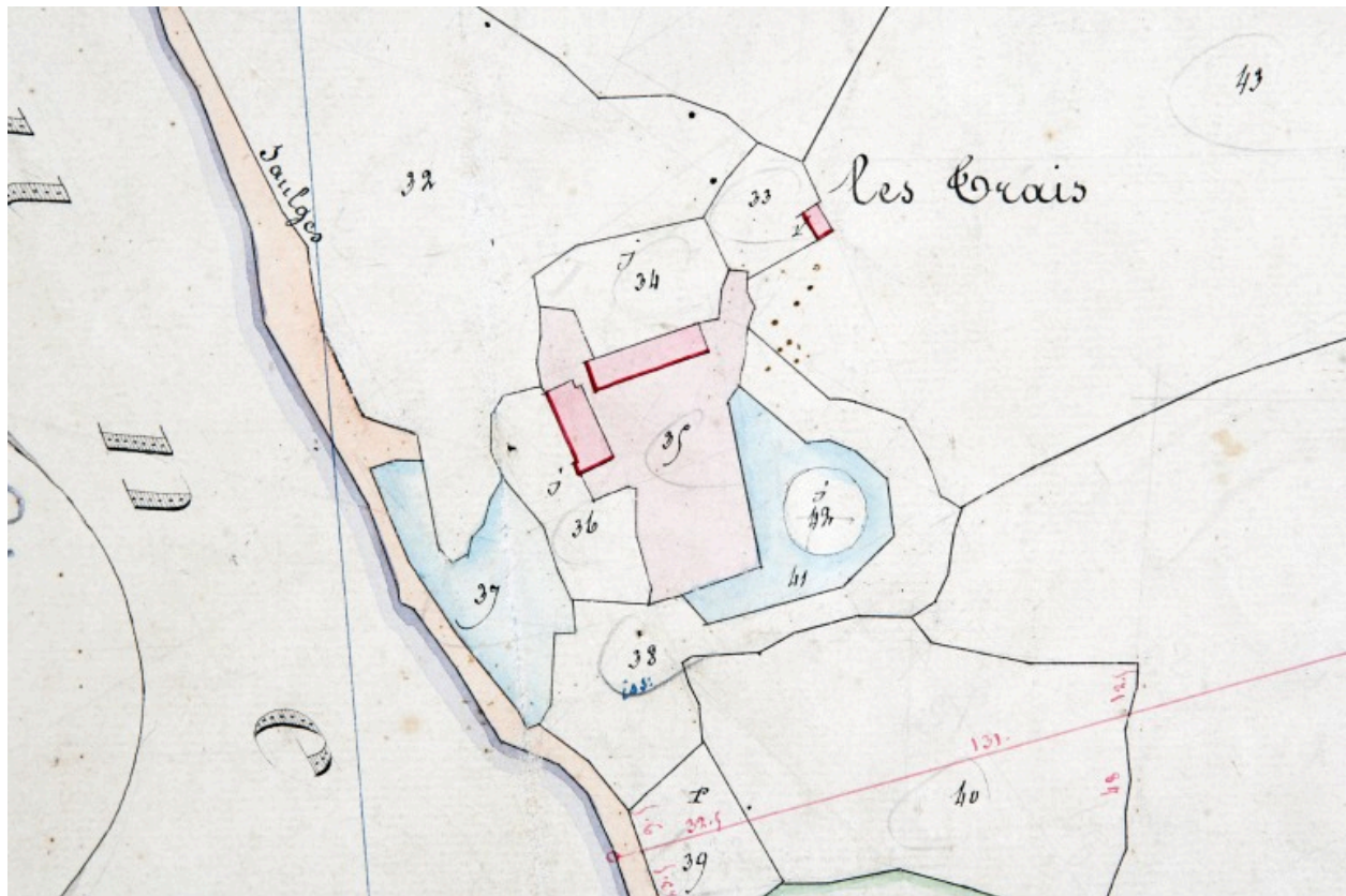
Extrait du plan cadastral de 1838, section I2.