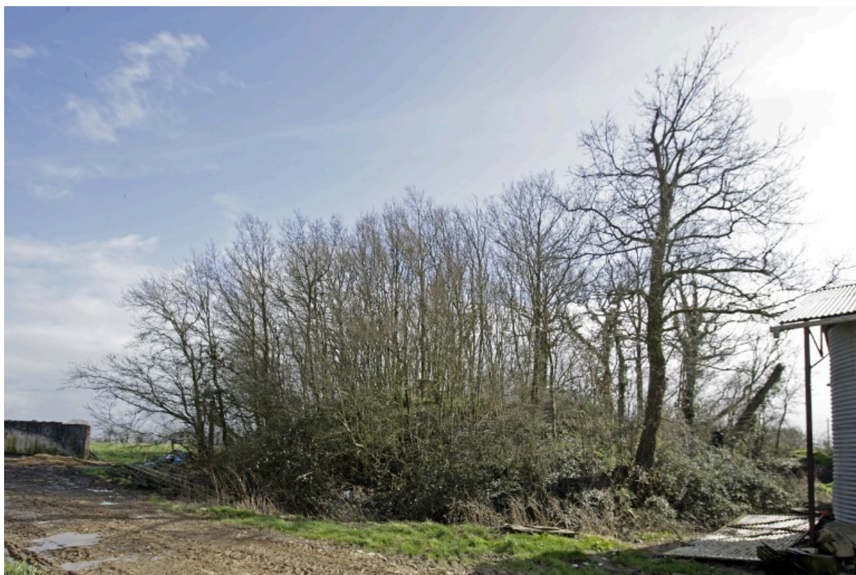
La motte vue depuis le nord-ouest.