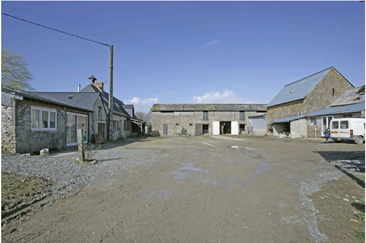
Vue d'ensemble des bâtiments de la ferme depuis le sud : le logis, l'étable-grange, l'étable à chevaux.