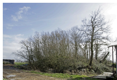
La motte vue depuis le nord-ouest. IVR52_20075301426NUCA