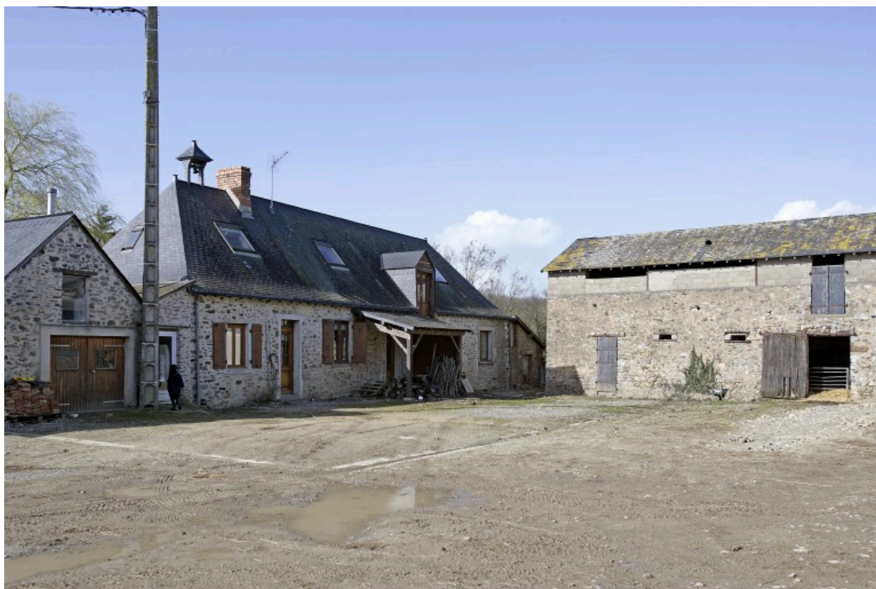
Le logis et l'étable-grange vus depuis la cour au sud-est.