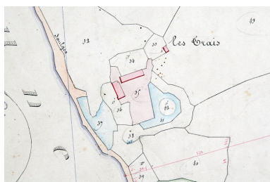
Extrait du plan cadastral de 1838, section I2. IVR52_20065302338NUCA