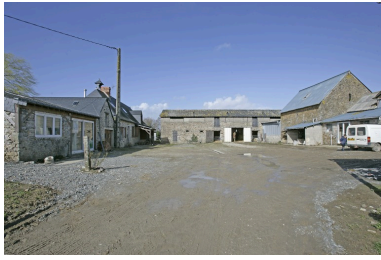
Vue d'ensemble des bâtiments de la ferme depuis le sud : le logis, l'étable-grange, l'étable à chevaux.