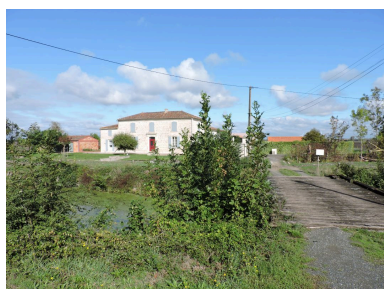
Les ponts de la Bonde des Jourdain, au premier plan le canal de Vix, vus depuis le sud. IVR52_20198503151NUCA