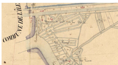
Le "passage du Jourdain" sur le plan cadastral de Vix en 1836.