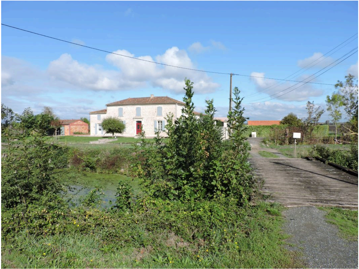
Les ponts de la Bonde des Jourdain, au premier plan le canal de Vix, vus depuis le sud.