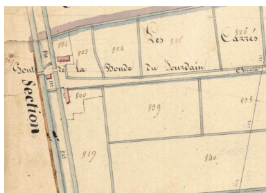
Les ponts de la Bonde du Jourdain, permettant d'accéder au passage depuis les marais desséchés, sur le plan cadastral de Vix en 1836, le nord à droite.