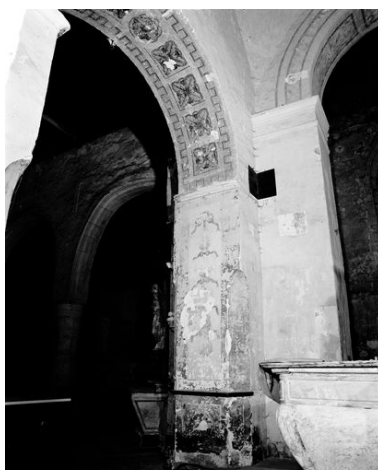
Intrados, partie nord. IVR52_19924900887X