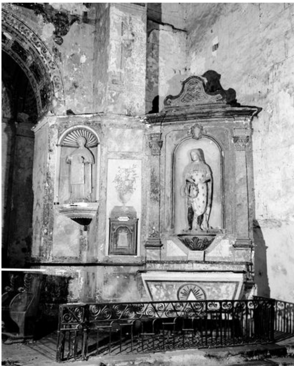
Partie inférieure sud : retable de saint Louis.