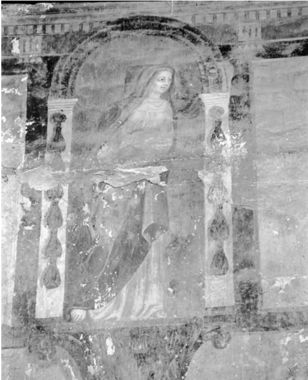
Partie centrale. Calvaire, détail : la Vierge.