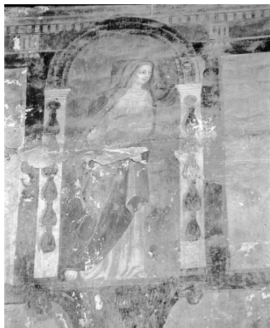
Partie centrale. Calvaire, détail : la Vierge. IVR52_19924900899X