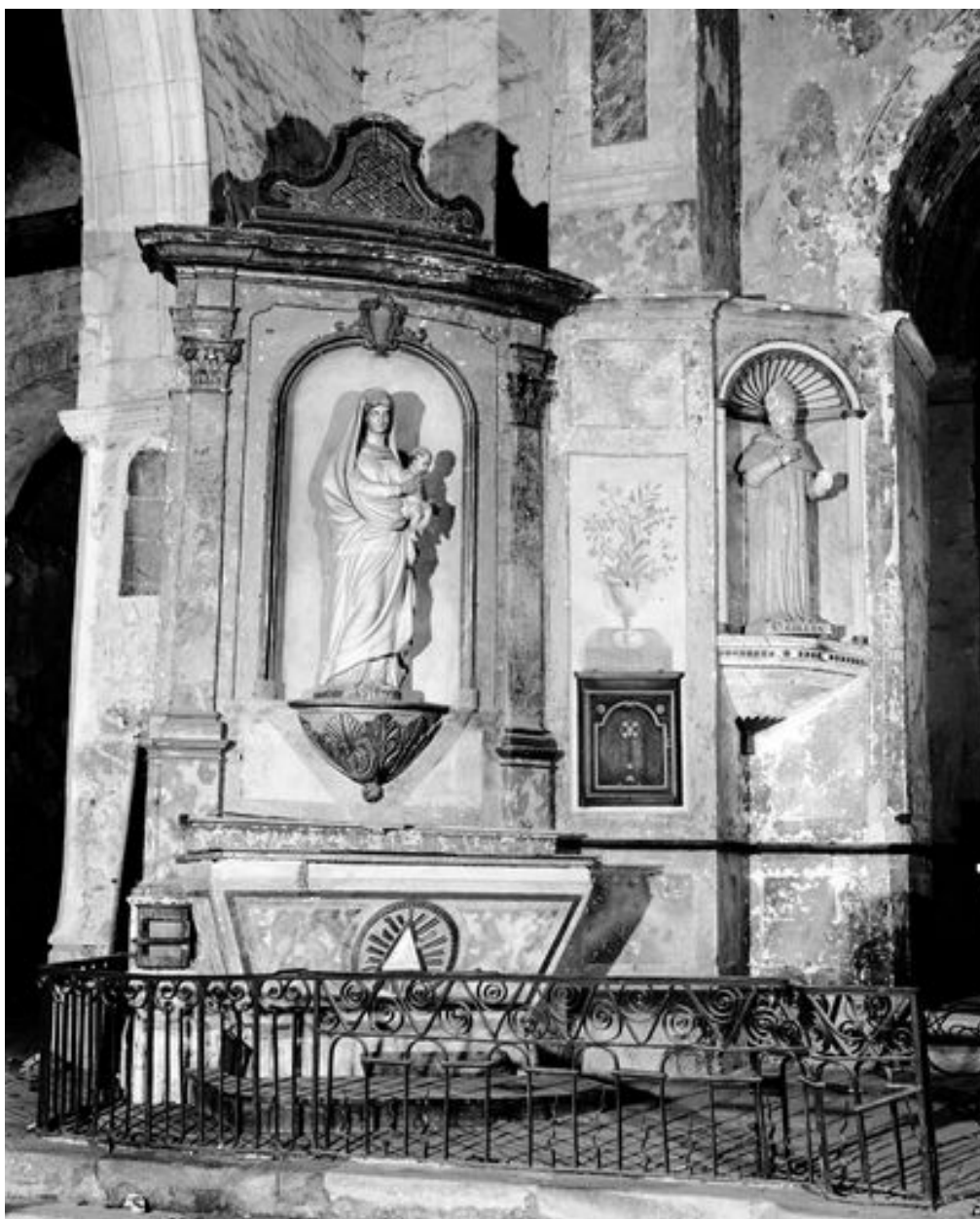
Partie inférieure nord : retable de la Vierge.