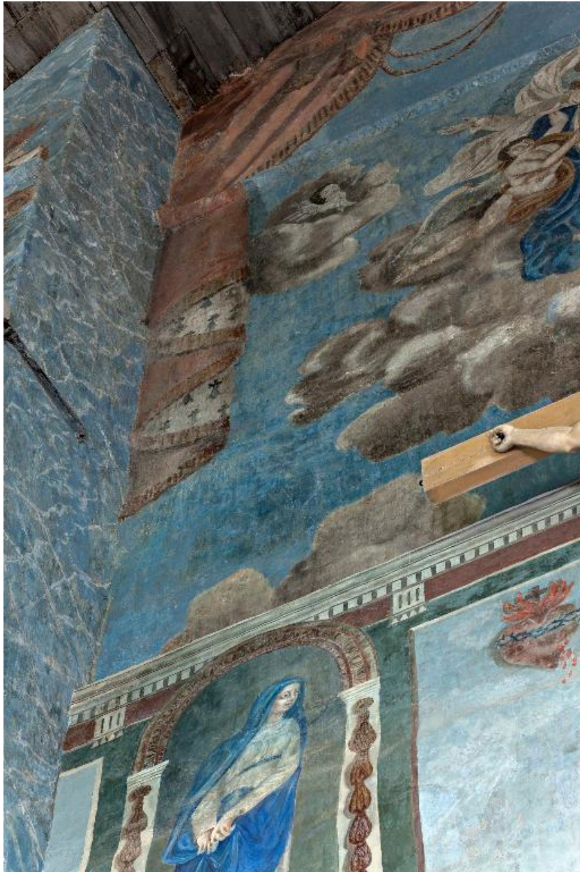
La partie droite et supérieure de la cloison posée en doublage partiel de l'arc triomphal.