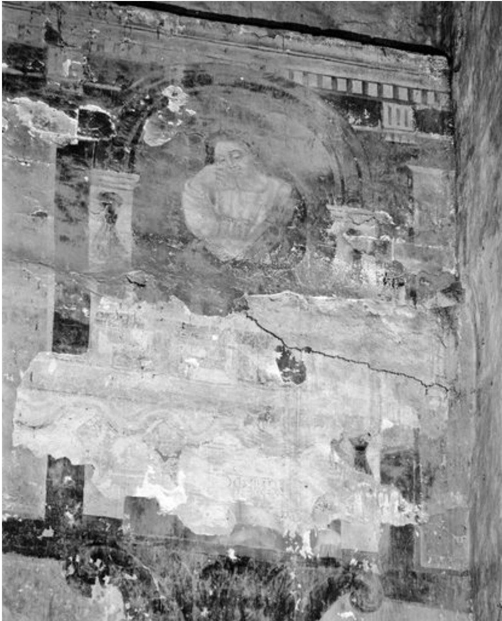
Partie centrale. Calvaire, détail : saint Jean, avec une lacune laissant voir la couche picturale des années 1200..