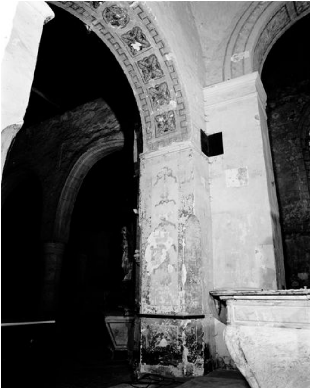
Intrados, partie nord.