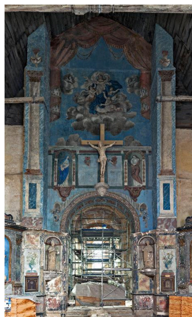
Vue d'ensemble. Après restauration. IVR52_20144900107NUCA