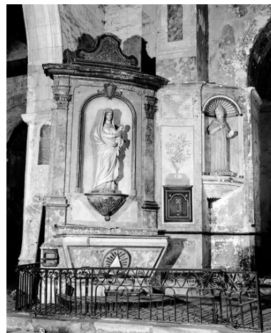
Partie inférieure nord : retable de la Vierge.