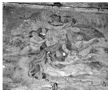
Partie supérieure, détail : l'Assomption.