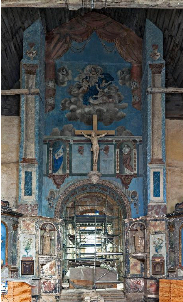
Vue d'ensemble. Après restauration.