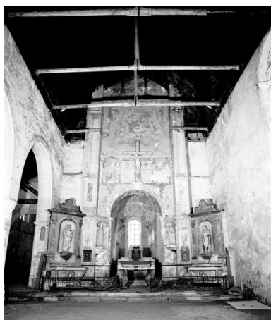
Vue d'ensemble IVR52_19924901026X