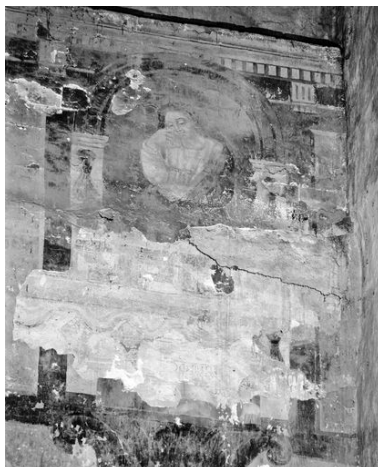
Partie centrale. Calvaire, détail : saint Jean, avec une lacune laissant voir la couche picturale des années 1200..