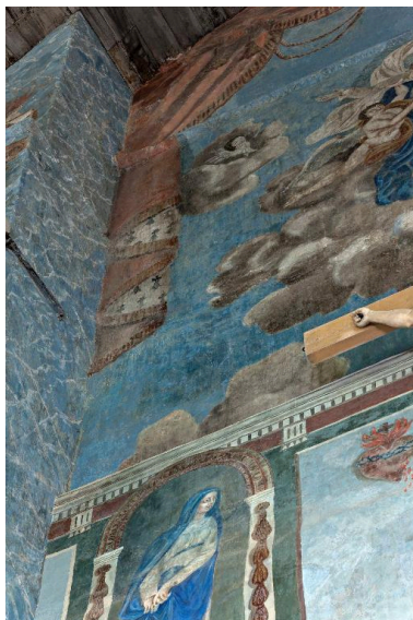
La partie droite et supérieure de la cloison posée en doublage partiel de l'arc triomphal.