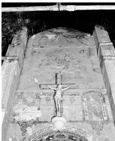
Partie supérieure. IVR52_19924900896X