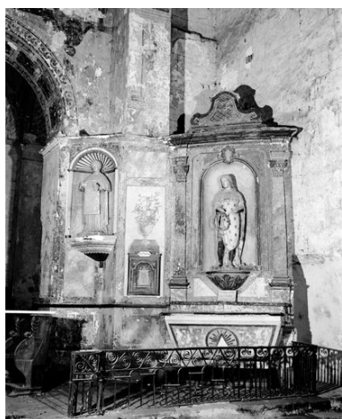
Partie inférieure sud : retable de saint Louis.