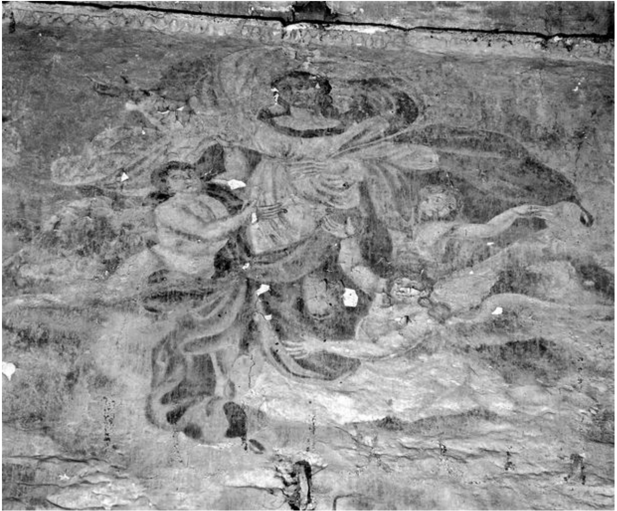
Partie supérieure, détail : l'Assomption.