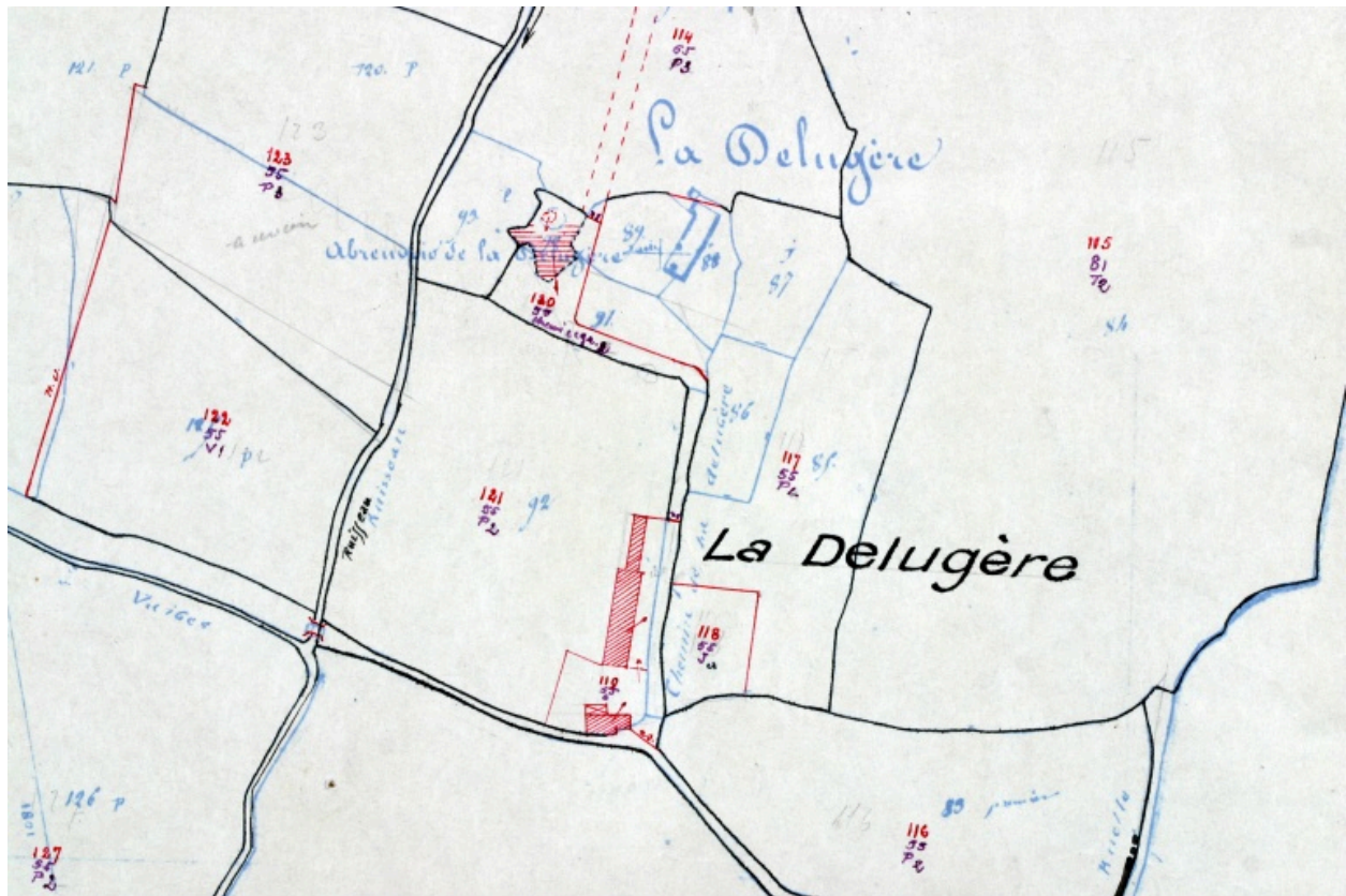
Extrait du plan cadastral de 1936, section F2.