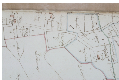
Extrait du plan terrier de la seigneurie d'Aubigné, vers 1772, pl. 2.