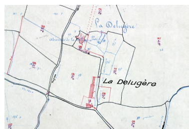
Extrait du plan cadastral de 1936, section F2.