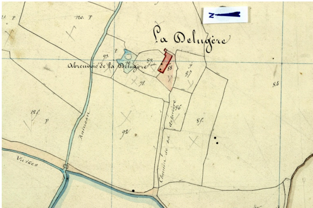
Extrait du plan cadastral de 1842, section F2.