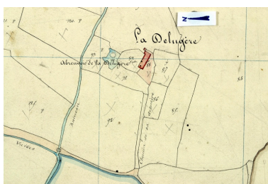
Extrait du plan cadastral de 1842, section F2. IVR52_20045301153NUCA