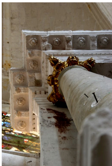
Décor de la corniche.

Phot. Jean-Baptiste Darrasse IVR52_20087201193NUCA