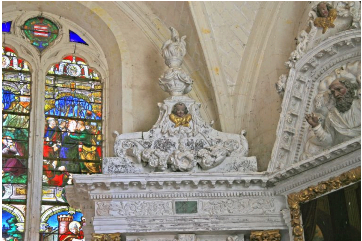
Fronton de l'aile nord.