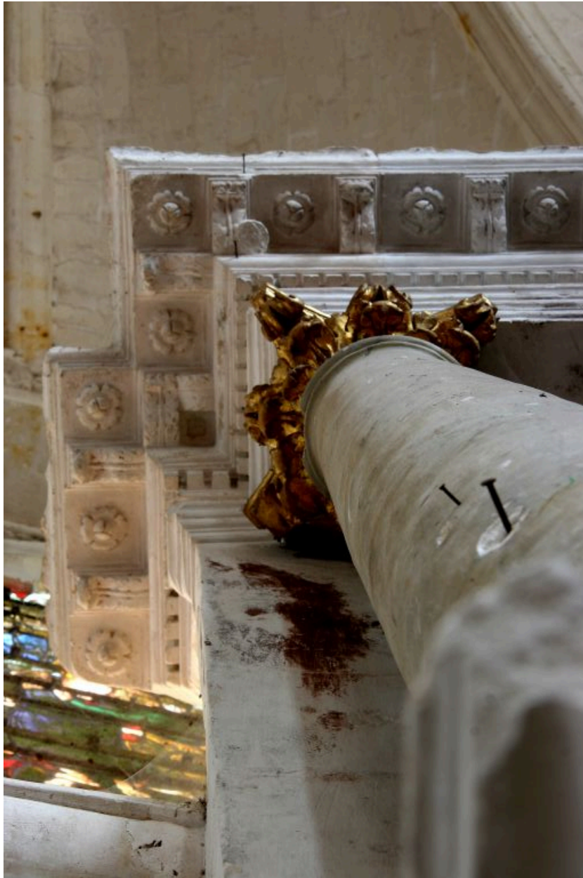
Décor de la corniche.