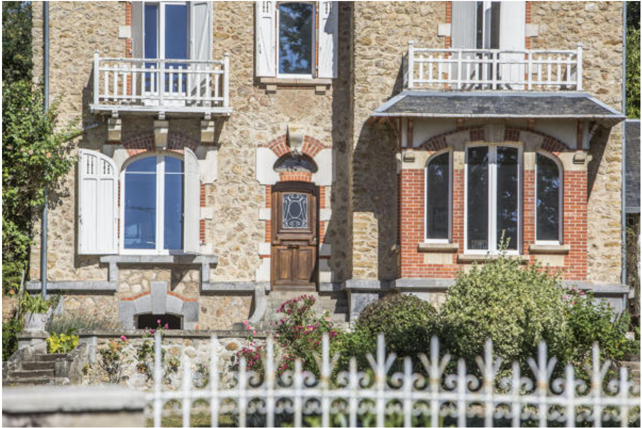
Un détail du rez-de-chaussée.