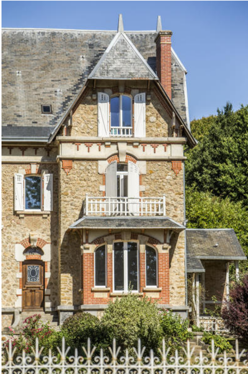
Un détail de l'avant-corps.