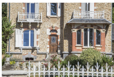
Un détail du rez-de-chaussée.