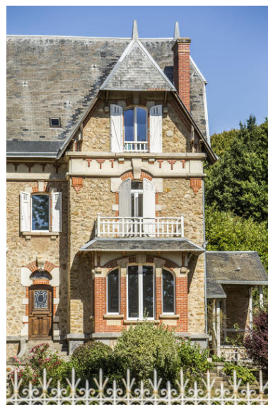
Un détail de l'avant-corps.