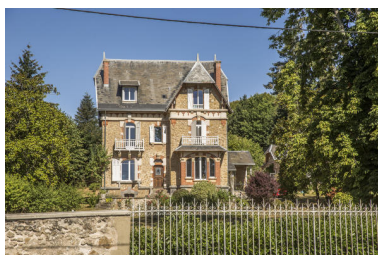
La maison. IVR52_20207200737NUCA