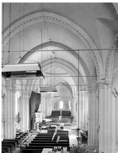
Vue d'ensemble de l'intérieur de l'église depuis la nef vers le chœur, avant la découverte des thermes.