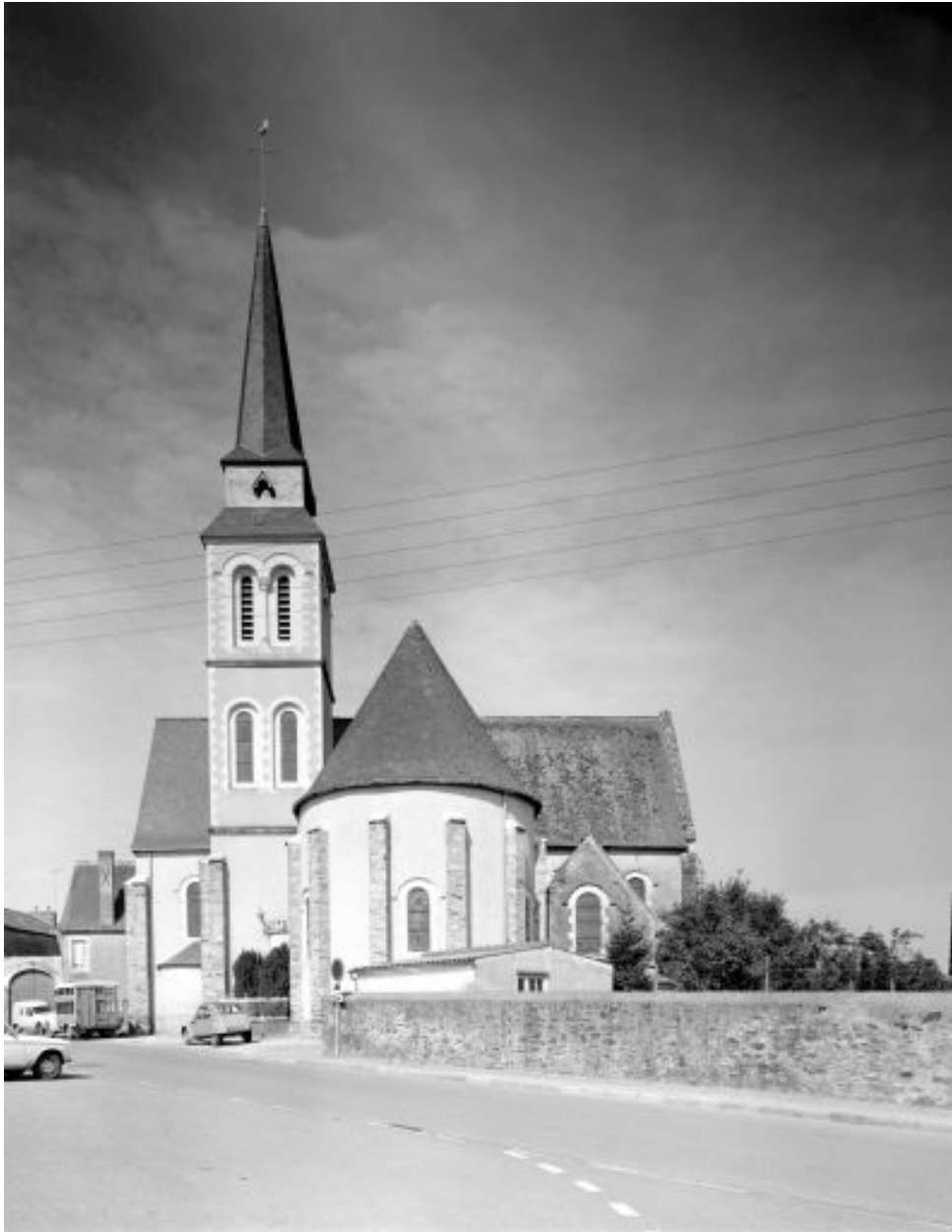
Vue d'ensemble de l'église depuis l'est avant la découverte des thermes.