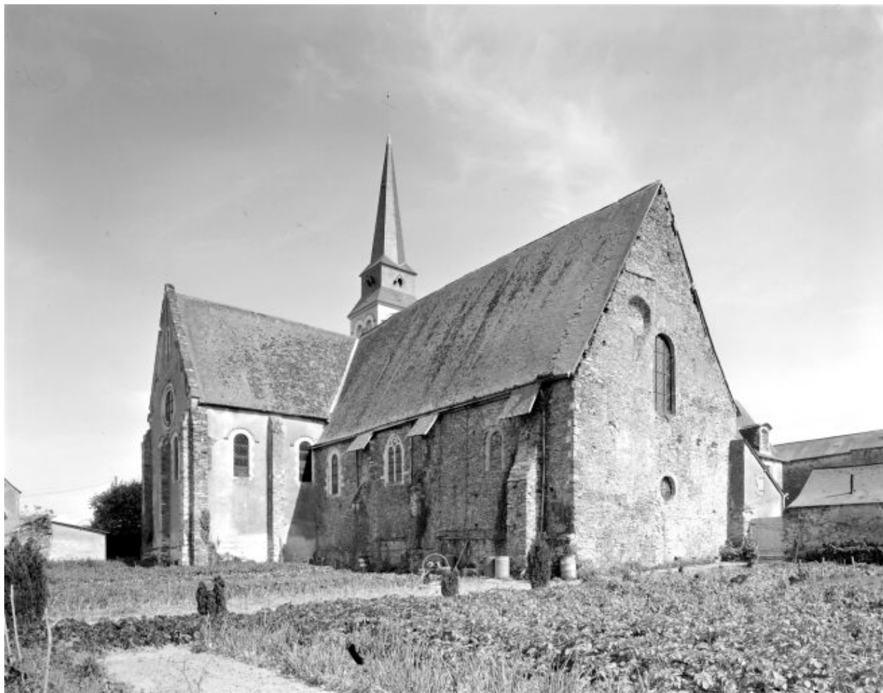
Vue d'ensemble de l'église depuis le nord-ouest avant la découverte des thermes.