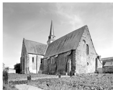
Vue d'ensemble de l'église depuis le nord-ouest avant la découverte des thermes.