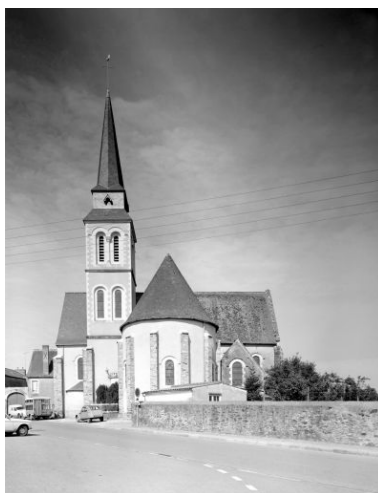
Vue d'ensemble de l'église depuis l'est avant la découverte des thermes.