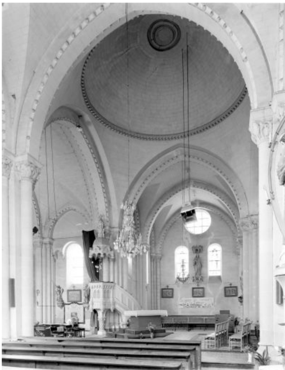
Vue de l'intérieur de l'église depuis le bras sud du transept vers le bras nord, avant la découverte des thermes.