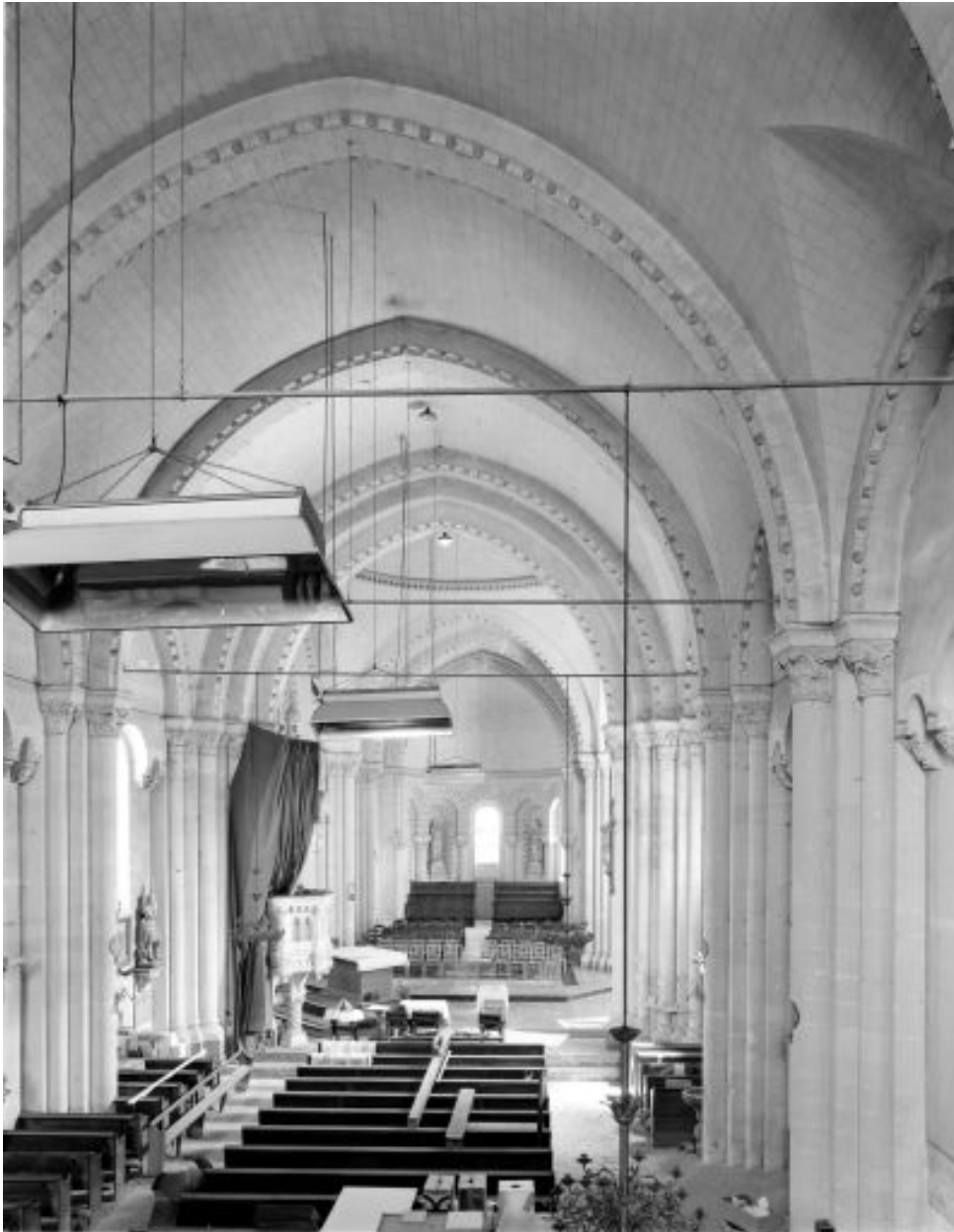
Vue d'ensemble de l'intérieur de l'église depuis la nef vers le chœur, avant la découverte des thermes.