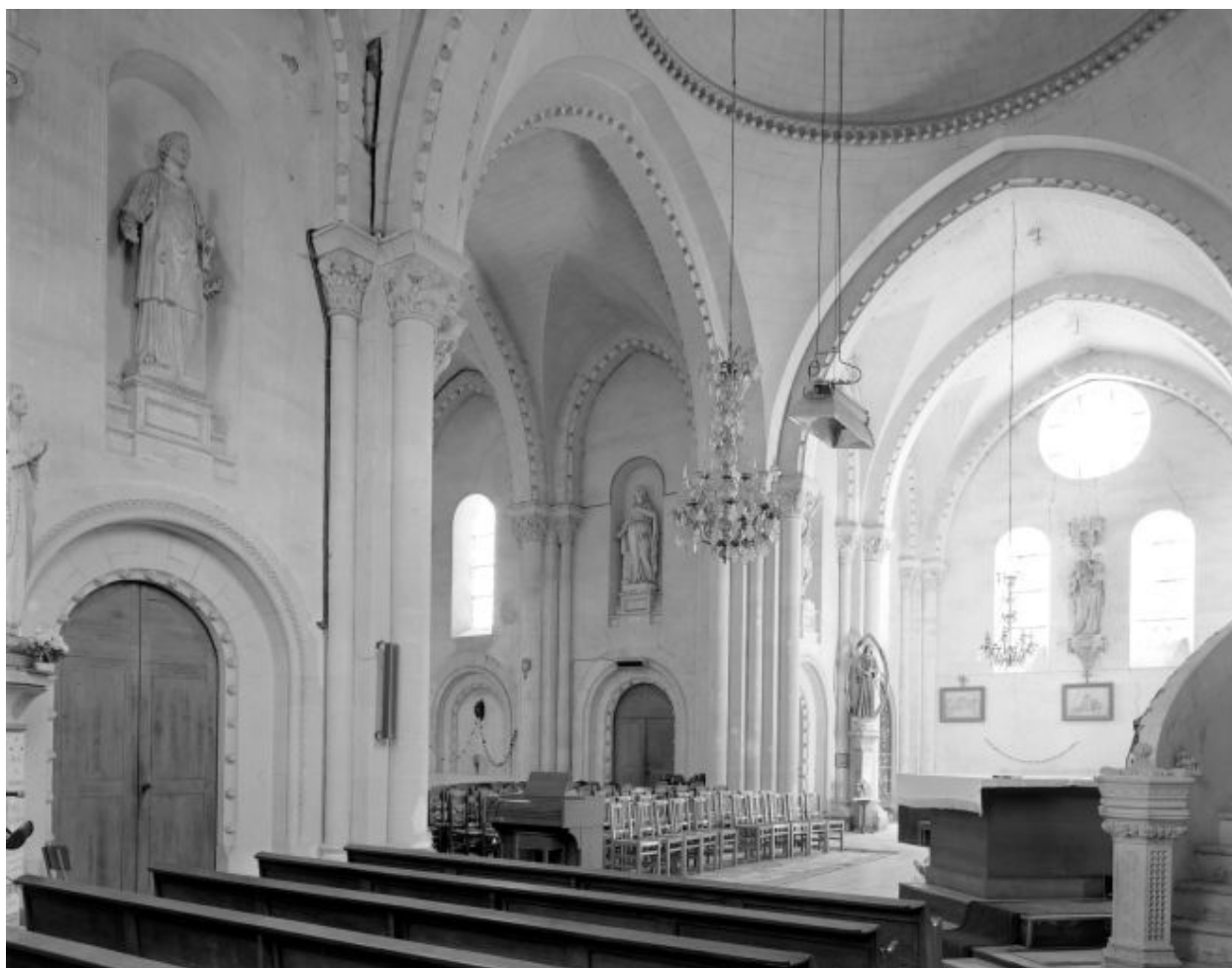
Vue de l'intérieur de l'église depuis le bras nord du transept vers le chœur et le bras sud, avant la découverte des thermes.