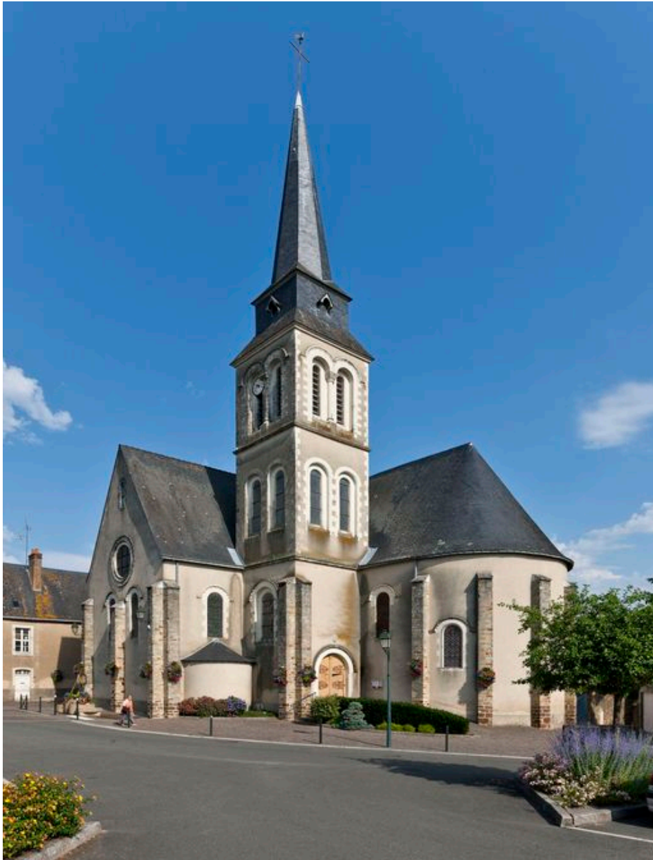
Vue d'ensemble de l'église depuis le sud-est.