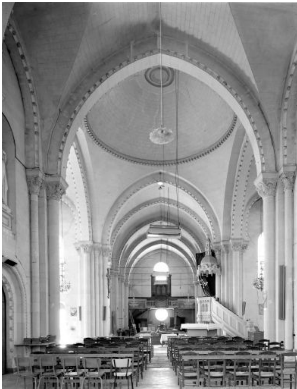
Vue d'ensemble de l'intérieur de l'église depuis le chœur vers la nef, avant la découverte des thermes.