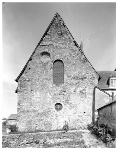
Elévation ouest de l'église avant la découverte des thermes.