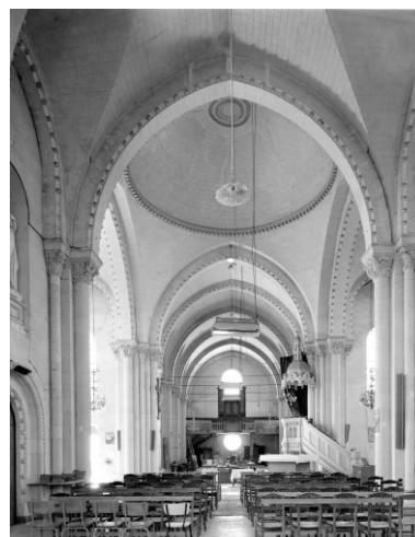
Vue d'ensemble de l'intérieur de l'église depuis le chœur vers la nef, avant la découverte des thermes.