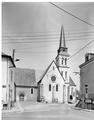
Vue d'ensemble de l'église depuis le sud avant la découverte des thermes.