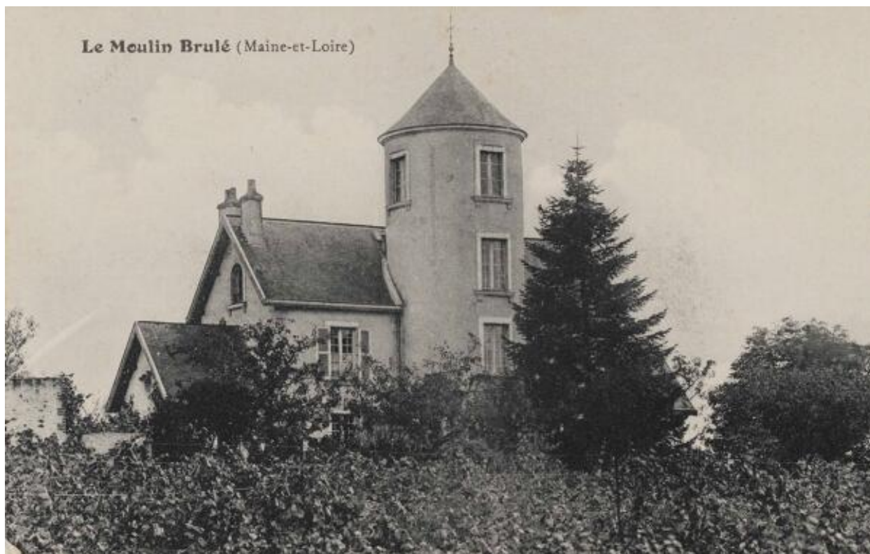
Le Moulin-Brûlé. Carte postale. 1er quart 20e siècle.