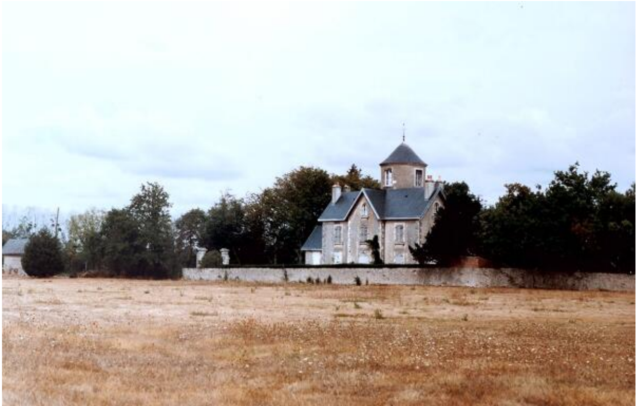
Le Moulin-Brûlé. Vue d'ensemble depuis le sud-est.