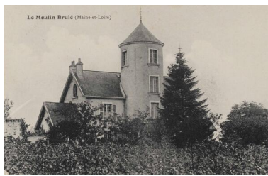
Le Moulin-Brûlé. Carte postale. 1er quart 20e siècle.