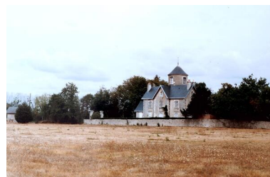
Le Moulin-Brûlé. Vue d'ensemble depuis le sud-est. (Coll. part.). IVR52_20044900197NUCA