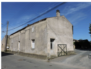
Le logis vu depuis l'est. IVR52_20198501918NUCA