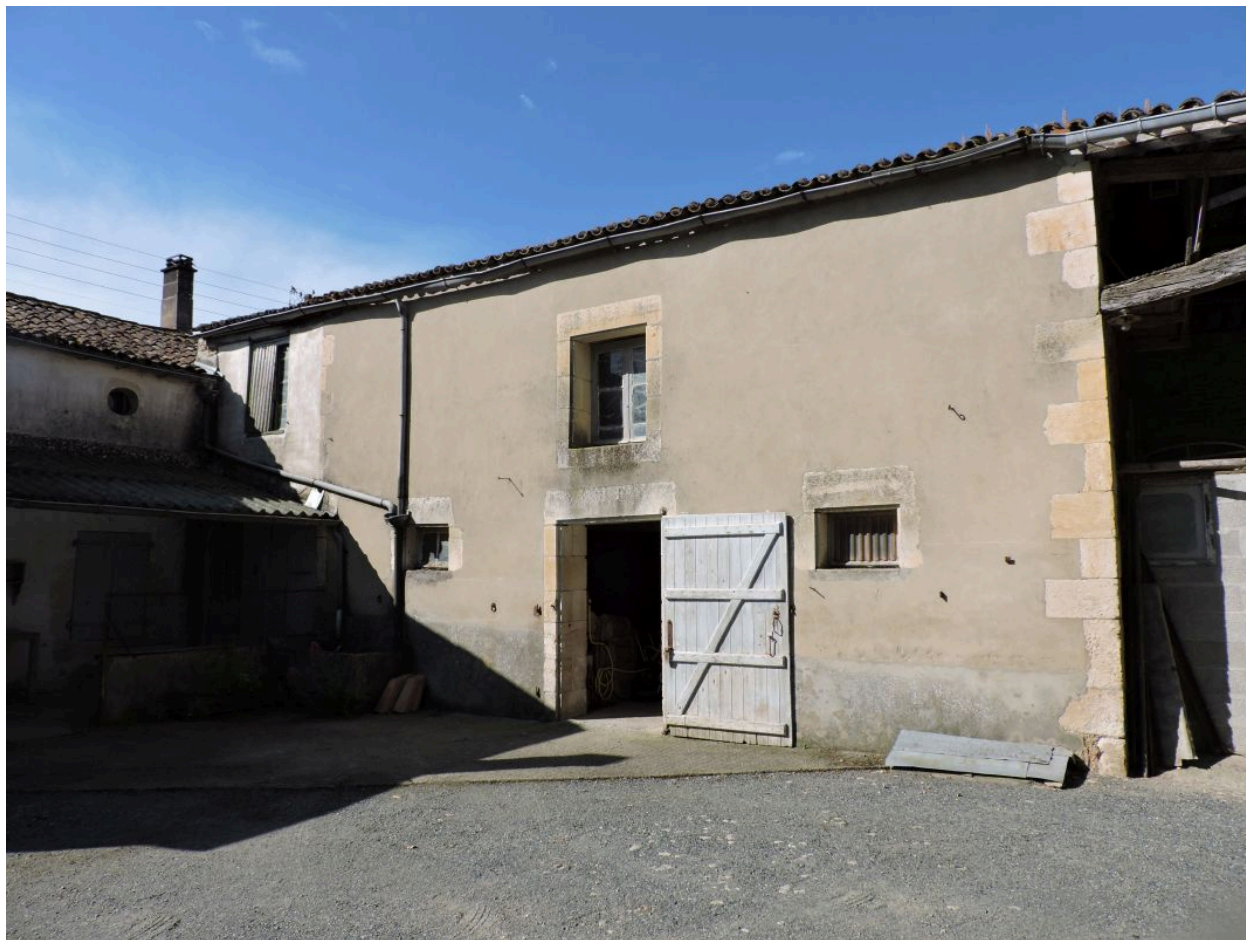
L'étable perpendiculaire à l'arrière du logis, vue depuis le nord.