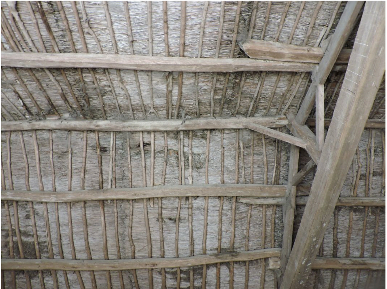
Le toit du hangar, en roseau.