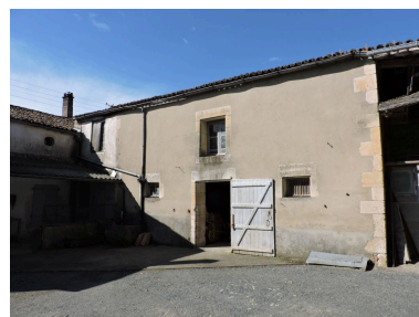
L'étable perpendiculaire à l'arrière du logis, vue depuis le nord.