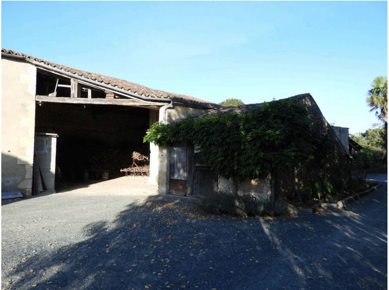
Le hangar et le fournil vus depuis l'est.