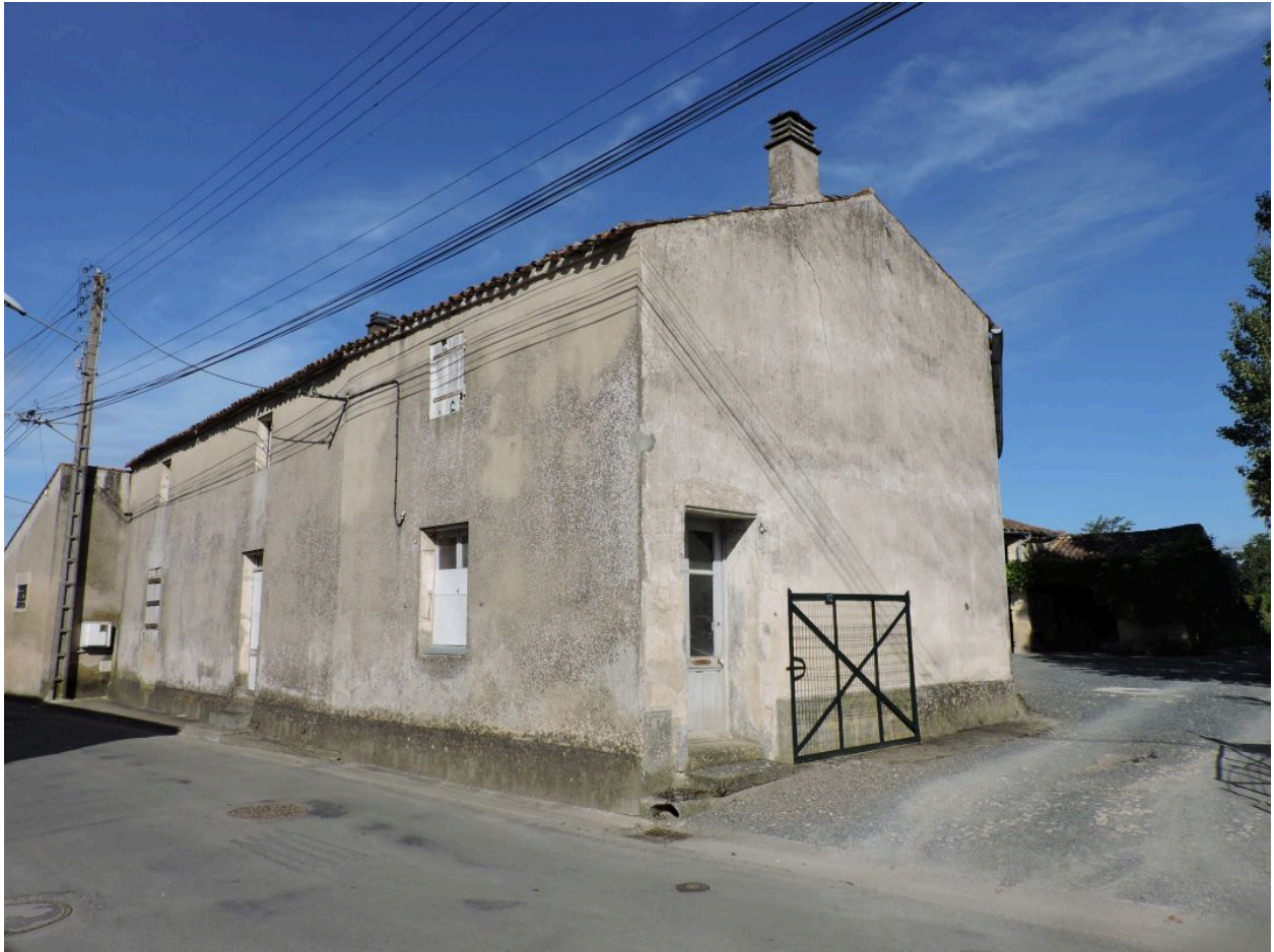
Le logis vu depuis l'est.