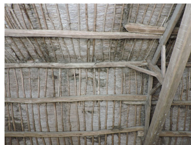
Le toit du hangar, en roseau.