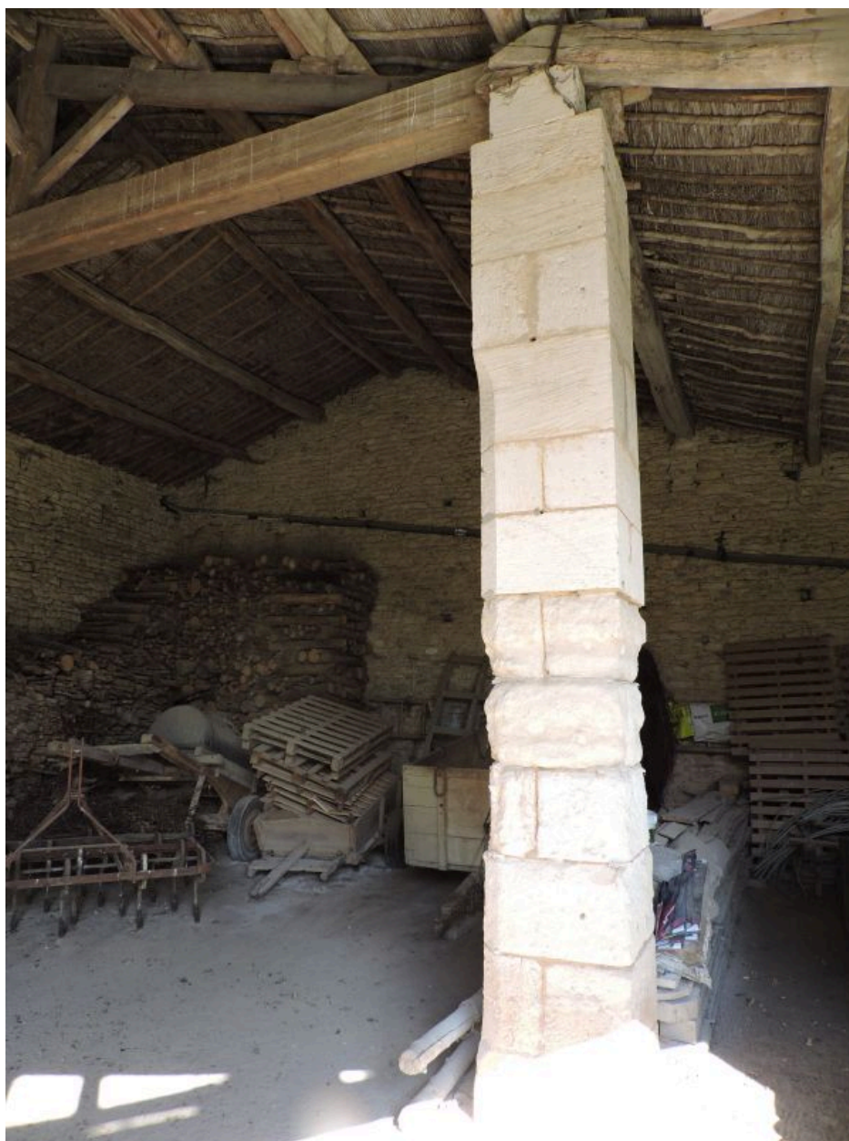
Le hangar, soutenu par un pilier en pierre de taille.