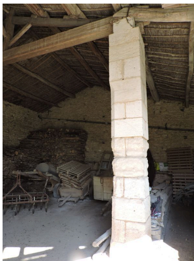
Le hangar, soutenu par un pilier en pierre de taille.