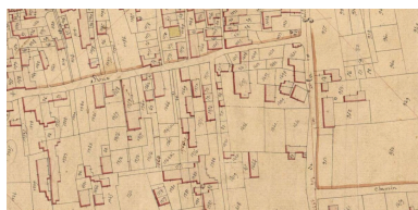
La parcelle 1441, à droite, sur le plan cadastral de 1836.