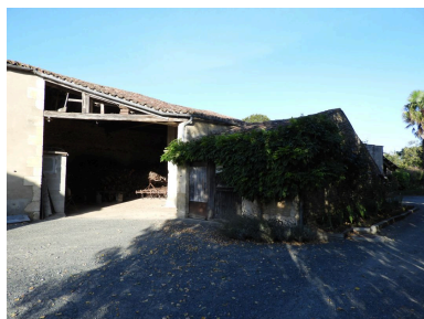
Le hangar et le fournil vus depuis l'est.